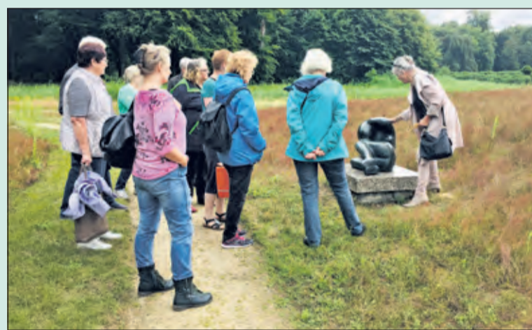
Door gebruik te maken van een tijdslot en een aangepaste routing kan iedereen rustig genieten van de veelzijdige kunstcollectie’.

De Open Monumentendagen vinden vrijwel ieder jaar plaats in het atelier van de beroemde kunstenaar, het kunstdomein waar de beeldhouwer, schilder, glaskunstenaar, graficus en maker van sieraden ruim vijftig jaar werkte aan uiteenlopende opdrachten. De open dagen bieden, mede vanwege de mogelijkheid om een uitgebreide rondleiding van circa veertig minuten te volgen, een uniek inkijkje in het reilen en zeilen van een van Nederlands’ bekendste beeldend kunstenaars.