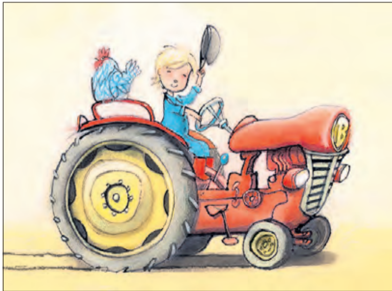
Boris komt tot leven tijdens het jubileumfeest bij de Bilthovense Boekhandel.