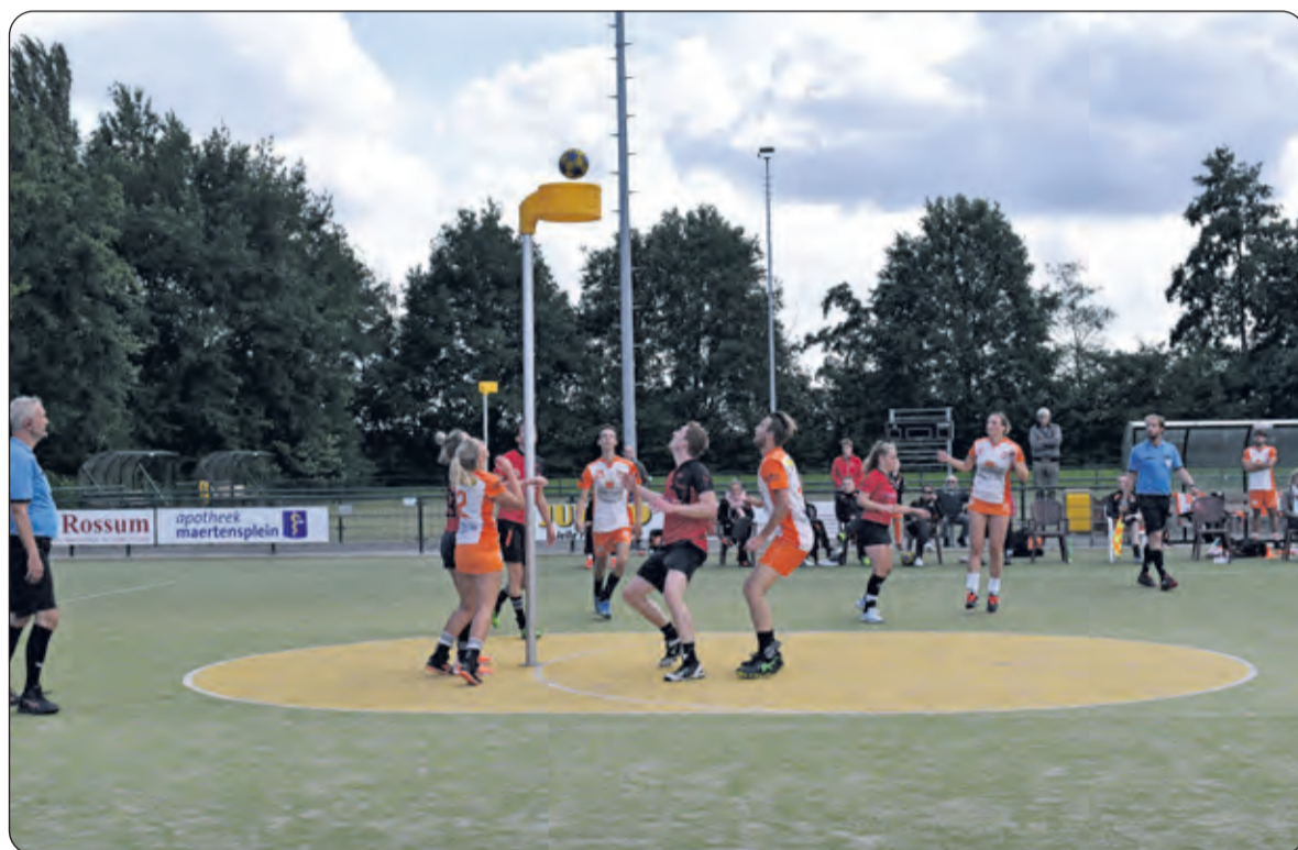
TZ weet de wedstrijd naar zich toe te trekken.