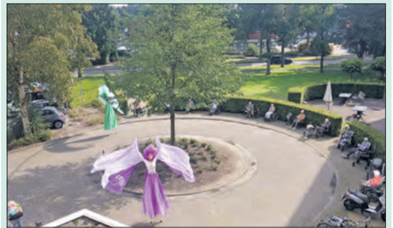
Sierlijke lange vormen voor de Bremhorst.