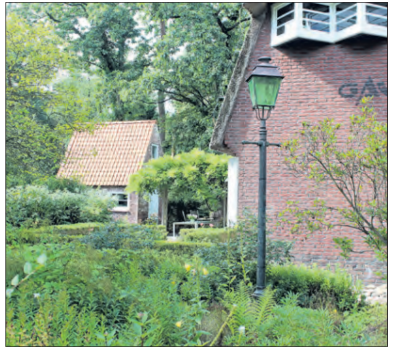
Het was-huisje is vanaf de weg gedeeltelijk te zien.

studio voor elektronische muziek. Toen de studio was verhuisd naar Utrecht werd het weer opslagruimte, totdat de toenmalige bouwkeet, die dienst gedaan had als kantoor voor de Stichting Gaudeamus, bewoond werd door een gezin. De twee dochters van dat gezin zijn in het huisje geboren dus was het ook kraamkamer. Later heeft dat gezin het huisje als badkamer ingericht. Daarna werd het weer opslagruimte totdat ons bestuur de stoute schoenen aantrok en met succes bij instellingen aanklopte met het