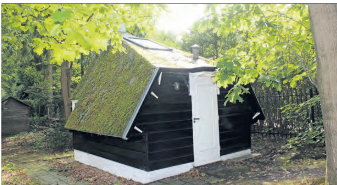
Achter villa Gaudeamus is een gebouwd tuinhuis van één bouwlaag en gedekt door een gewolfd bitumen zadeldak. In het plat is een dakvenster aangebracht. De zuidgevel heeft een liggende vensterreeks met vier ramen. Het componeerhuisje is een rijksmonument.

huisje voor de familie Röntgen en waarschijnlijk is het dat gebleven, ook in de tijd vanaf eind 1940 toen Walter Maas in Huize Gaudeamus een pension was begonnen, maar misschien was het toen wel opslagruimte. In de vijftiger jaren werden in het huis gezinnen uit Ambon gehuisvest en deed het huisje dienst als keuken, waar de hele dag gekokkereld werd. Tijdens Open Monumentendag 2018 ontmoetten wij nog twee Ambonese dames, die er in die tijd met hun gezin gewoond hadden. Begin 60-er jaren werd het huisje ingericht als