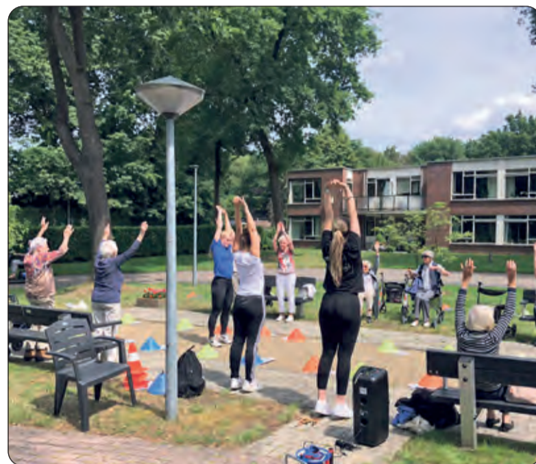
Bij de Amandelboom wordt levend ganzenbord gespeeld onder leiding van de buurtsportcoaches van Mens.

'We proberen als gemeente met landelijke subsidie zoveel als kan lokaal mogelijk te maken. De gemeente heeft met de verenigingen een Lokaal Sportakkoord afgesloten waar we het