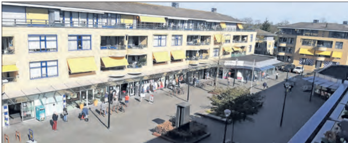
Gedisciplineerde ochtendrukte op Goede Vrijdag op het Maartensdijkse Maartensplein.

en tussen jou en de eerstvolgende persoon houdt, dan kan er niets mis gaan. De stok buigt een beetje en dat is niet voor niets: buigt ie iets naar beneden, dan is het een vriendelijk gebaar. Voor een strengere aanpak staat de punt omhoog. Simpel, maar effectief.