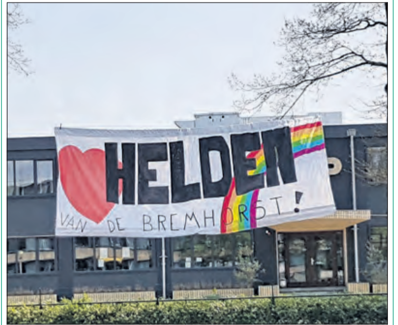
Spandoek voor De Bremhorst om de zorgverleners te bedanken.

Afgelopen vrijdag werden de medewerkers van De Bremhorst in Bilt-hoven warm verrast door een enorm spandoek, opgehangen door familie van een van de bewoners van dit verpleeghuis, die momenteel geen bezoek mogen ontvangen. 'Helden van De Bremhorst', stond er: zo wilde de familie de verzorgenden bedanken voor hun inzet en zorg, en hun een hart onder de riem steken. Dit hartverwarmende gebaar werd door het hardwerkende personeel in dank aanvaard. (Peter Schlamilch)