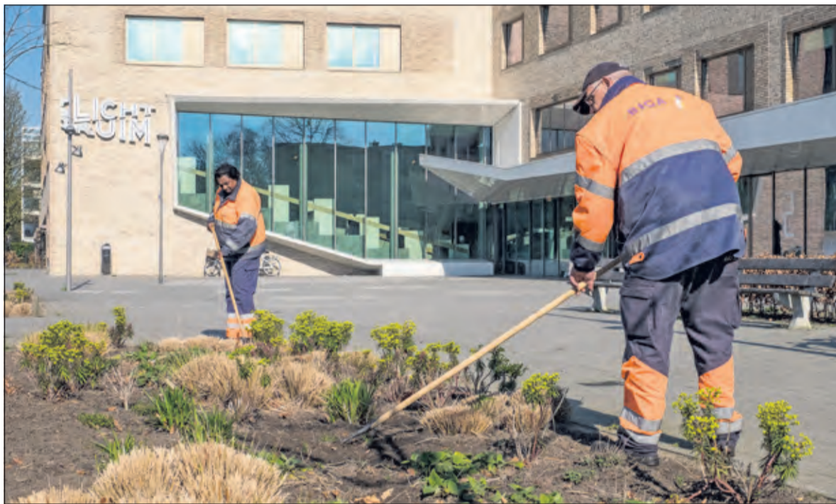
Biga Groep heeft de mensen weer buiten aan werk.

spreekt dagelijks de actualiteit en scherpt aan waar nodig. Biga Groep biedt op dit moment werk aan ruim 200 mensen in plaats van de gebruikelijke 550. De uitbreiding vanaf 6 april wordt zeer gecontroleerd uitgevoerd. Op de productieafdeling in het pand van Biga in Zeist en