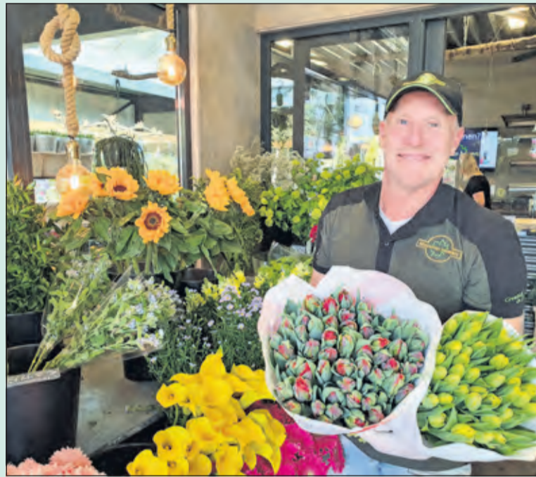
Ook bij de Koperwiek in Bilthoven kon winkelen en meeleven publiek een bos bloemen kopen voor (een) eenzame oudere(n) in één van de verzorgingshuizen binnen de gemeente De Bilt.

een gehandicapteninstelling en een verpleeg- en verzorgingshuis. 'Ik maak het van alle kanten mee.'