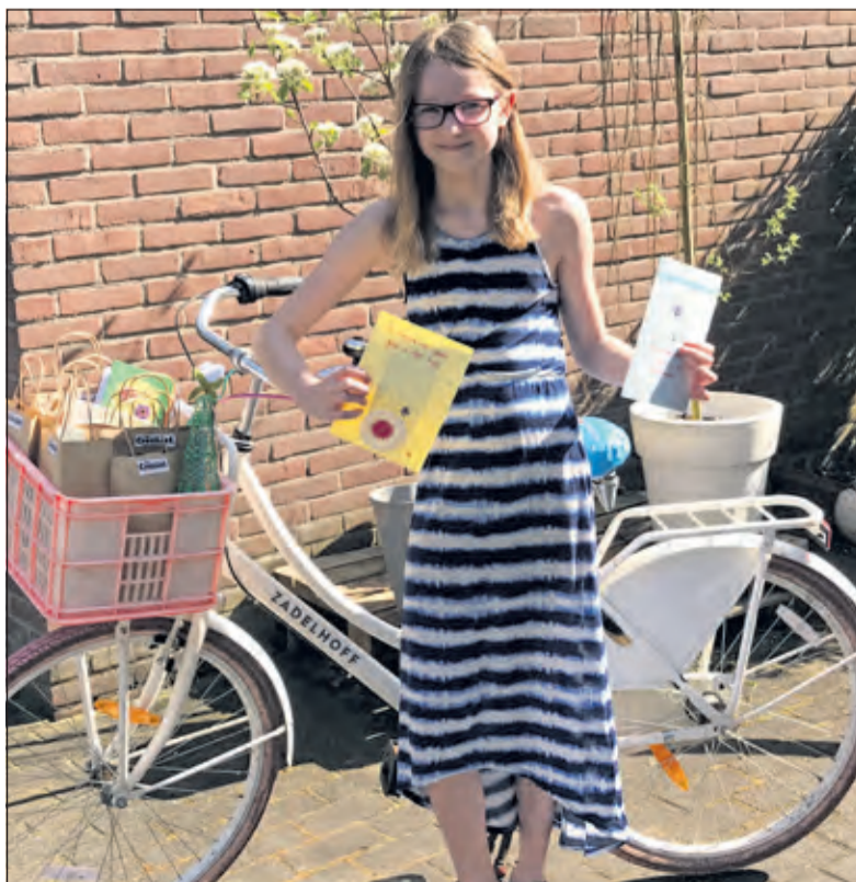
Er zijn al veel kaarten onderweg.

Wie graag iemand een hart onder de riem wil steken, kan dit laten weten via de Facebook-pagina van Club Crealief Bilthoven of via Clubcrealief@gmail.com