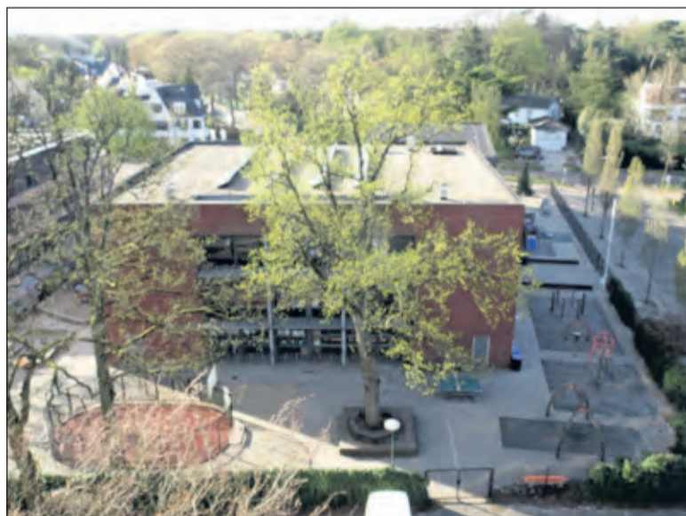
De Julianaschool mist de leerlingen op het schoolplein.

ten en we hebben snelle landelijke hulp nodig. Het is goed dat onze burgemeester daarvoor aangeklopt heeft. Ik vind dat onze burgemeester zich erg goed en zichtbaar inzet. Hij probeert goed met de burgers te communiceren, telefonisch bijvoorbeeld en daarnaast vind ik dat hij ons als raadleden goed op de hoogte houdt van wat er allemaal gebeurt. Daar ben ik heel tevreden over. Daarnaast merk ik dat wethouders erg hun best doen om de echt belangrijke dossiers snel aan de beurt te laten komen.'