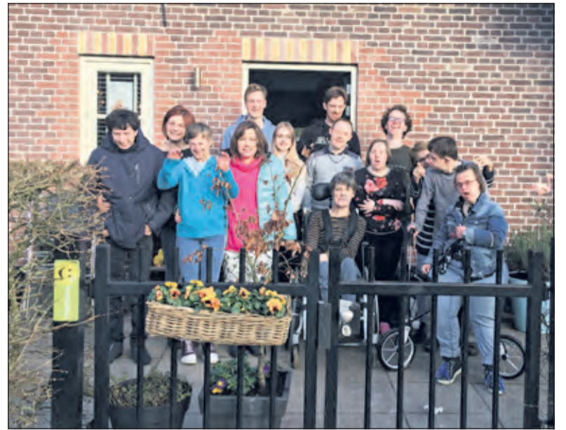
Groeten uit het Thomashuis.

Het is veel extra regelwerk voor het zorgchepaar. Vorige week waren ze bijvoorbeeld nog blij met de tijdelijk overgenomen activiteitenbegeleidster, tot ze vertelde dat ze dat ze benaderd was door de instelling waar zij invalwerk doet om daar te komen werken vanwege de hoge uitval van personeel en dat