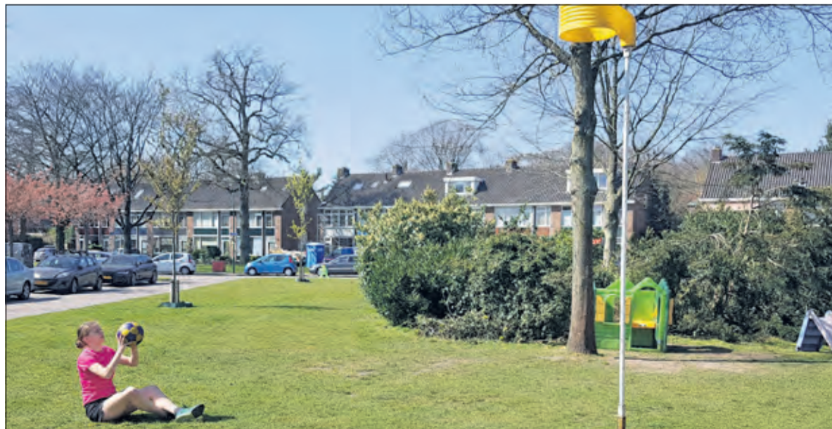
Bij de club is het niet te doen; dan maar in 't plantsoen.