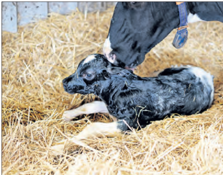
Koe Fokje heeft zojuist haar 8e kalf op de wereld gezet.