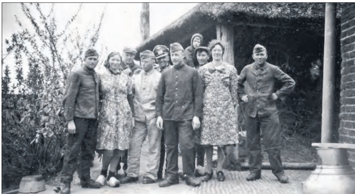
Duitsers ingekwartierd bij familie van de Bunt in Westbroek, 1944.