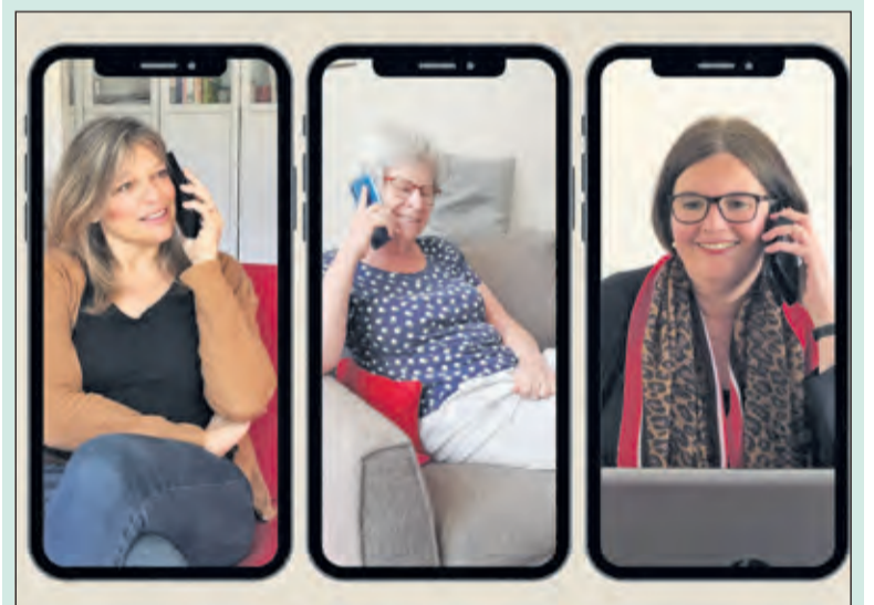
Even bellen met een ander kan veel betekenen.

De Biltse telefoonlijn is onlangs van start gegaan. Met dit lokale initiatief bellen vrijwilligers regelmatig met mensen die het huis niet uit mogen. Een simpele manier om anderen een hart onder de riem te steken.