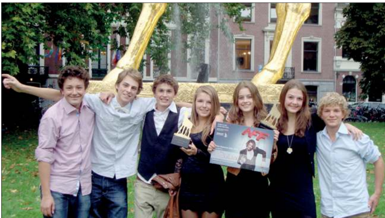
Drie Gouden Kalveren voor De Werkplaats