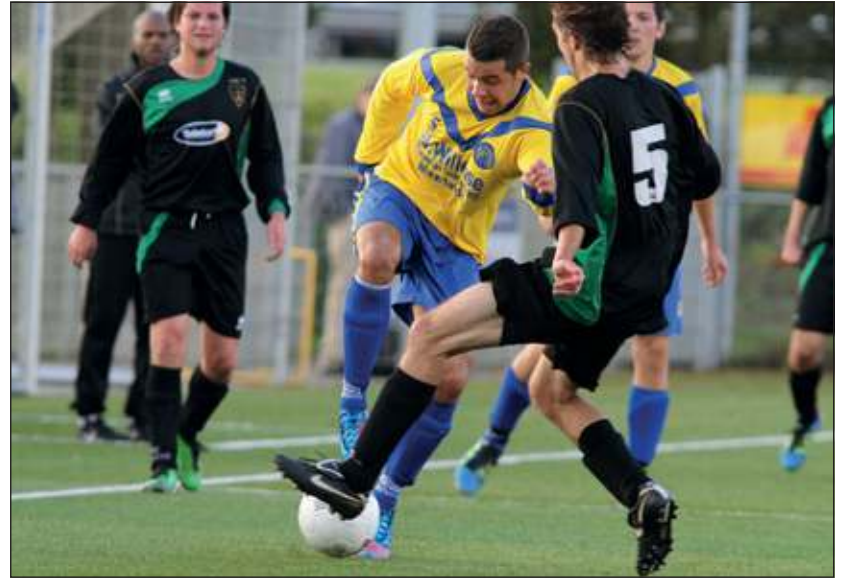
SVM heeft goede zaken gedaan door met 1-0 te winnen van FC Almere.

SVM 2 blijft het ook goed doen. Thuis werd het 2-2 tegen koploper