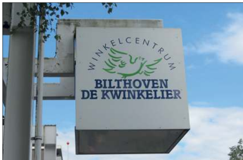
Het nieuws over de ontwikkelingen met betrekking tot het ontwikkelen van de Kwinkelier heeft de gemeente onaangenaam verrast.

De gemeente heeft dan ook de eigenaar Kerckebosch met klem verzocht om de renovatie van het bestaande winkelcentrum nu zo spoedig mogelijk ter hand te nemen. Uiteraard laat de gemeente onderzoeken wat de juridische en financiële consequenties van deze ontwikkeling zijn en beraadt zich op de verder te nemen stappen.