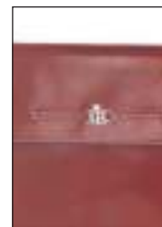
Castelijn en Beerens

U vindt bij ons nu ook: trendy colshawls , poncho's en beenwarmers