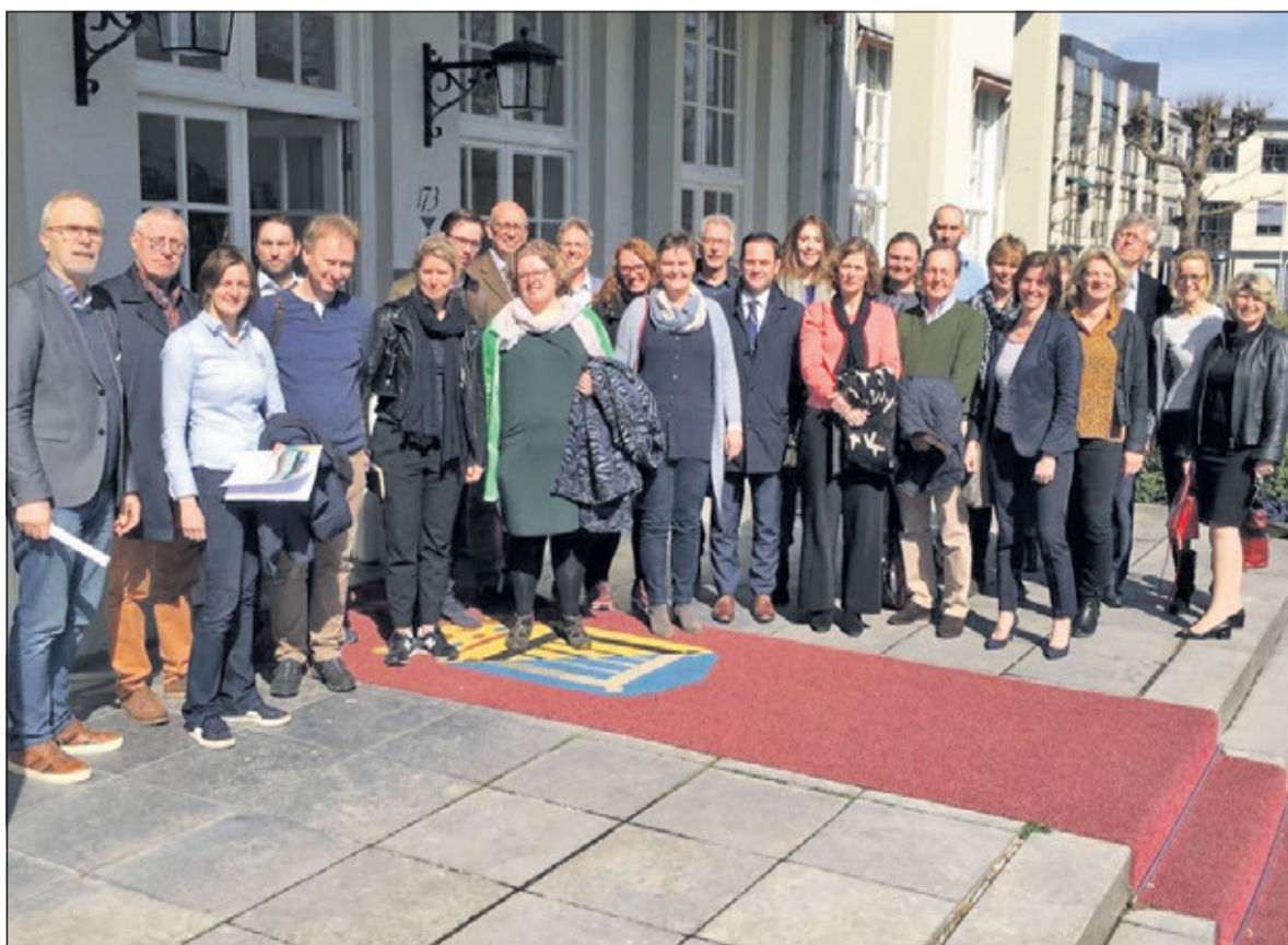
Leden van de gemeenteraad voor het vertrek van de rondrit door de gemeente, vergezeld door de directie en de gebiedsmakelaars van de gemeente.

sche Rading, het Maartensplein in Maartensdijk en de Life Science As en de omgeving Melkweg in Bilt-hoven. De komende weken gaan de raadsleden verder aan de slag met de verkregen informatie. De eerste reguliere raadsvergadering van de nieuwe raad is op donderdag 26 april. Belangstellenden zijn van harte welkom om daar bij aanwezig te zijn. De vergadering is ook online te volgen via raadsinformatie. debilt.nl.