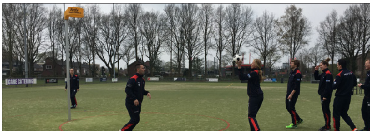
Nova 1 in nieuwe trainingspakken neemt deel aan de warming up.