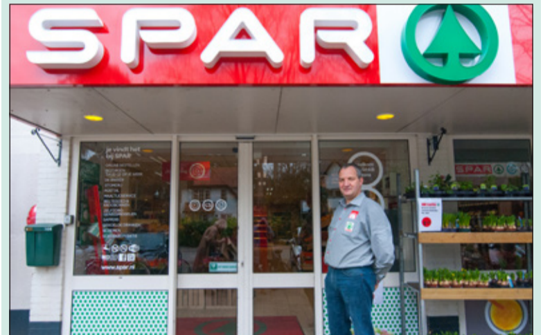
De actie blijft nog voor onbepaalde tijd geldig en zorgt daarmee voor constructieve steun aan de armeren in onze gemeente.