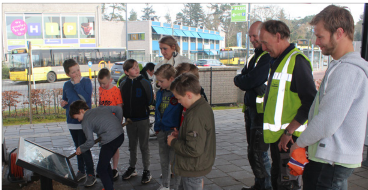
Met man en macht wordt aan het opgraven van de herdenkingsplaat gewerkt.

Op steeds meer stations (ook in Bilthoven) zijn toegangspoortjes in gebruik genomen. Zo vergroot men volgens NS de veiligheid op een station en in de trein en vermindert (ook weer volgens NS) het aantal zwartrijders. De toegankelijkheid tot de stations wordt daardoor steeds meer 'functioneel', d.w.z. afgestemd op het reizen. Dit was de reden, dat voor de herdenkingsplaat opnieuw een andere plaats gevonden diende te worden. De voorkeur ging uit naar een meer algemeen openbare ruimte. Vrijdag 13 april waren leerlingen van groep 4b van de Julianaschool actief bij de verplaatsing betrokken.