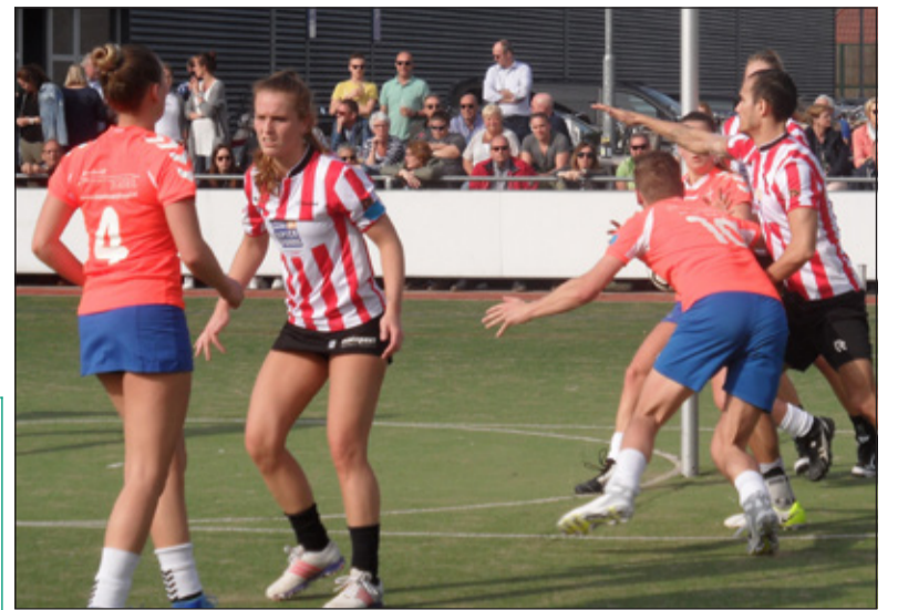
DOS probeerde DeetosSnel te verschalken.

toch vertrouwen voor de komende wedstrijden. Aanstane zaterdag ontvangt DOS TOP uit Arnhem. Top staat op een tweede plek. De wedstrijd begint om 15.30 uur.