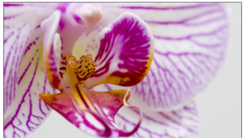
Een foto van 'Orchideeën für Elise' van lid Sijt de Bie.

langstelling rekenen. Ook niet-leden, die deze interessante avond willen bijwonen zijn van harte welkom. Vanwege de verwachte drukte wel graag even aanmelden bij voorzitter Wim Kastelijn (tel. 06 44517848). De avond wordt gehouden in het HF Witte centrum, Henri Dunantplein 4 in De Bilt. Aanvang 20.00uur.