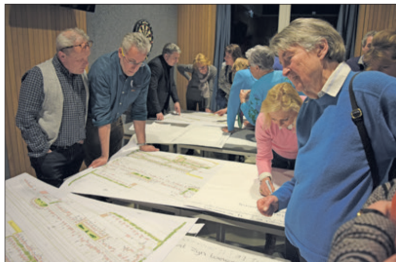
Bewoners wijzen bijenoases aan in Hollandsche Rading.