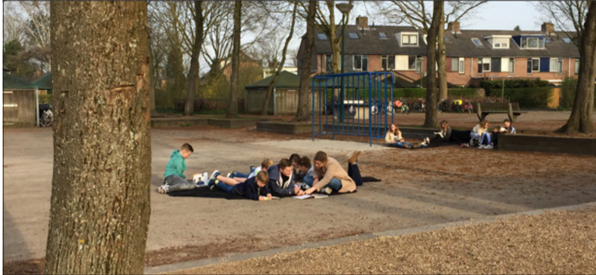
Buitenles kan ook buiten leren zijn.