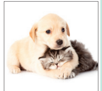
Met het huisdieren ZorgPlan ben je verzekerd van preventieve gezondheidszorg voor je huisdier.

Dierenkliniek Midden Nederland introduceert het Huisdieren ZorgPlan. Met dit gezondheidsprogramma is het mogelijk om de kosten van preventieve zorg voor je huisdier over een heel jaar te spreiden. Je betaalt maandelijks een vast bedrag waarmee je recht krijgt op regelmatige preventieve gezondheidszorg. Het Huisdieren ZorgPlan maakt het daarmee gemakkelijk om het welzijn van je huisdier te bewaken en veel geld te besparen.