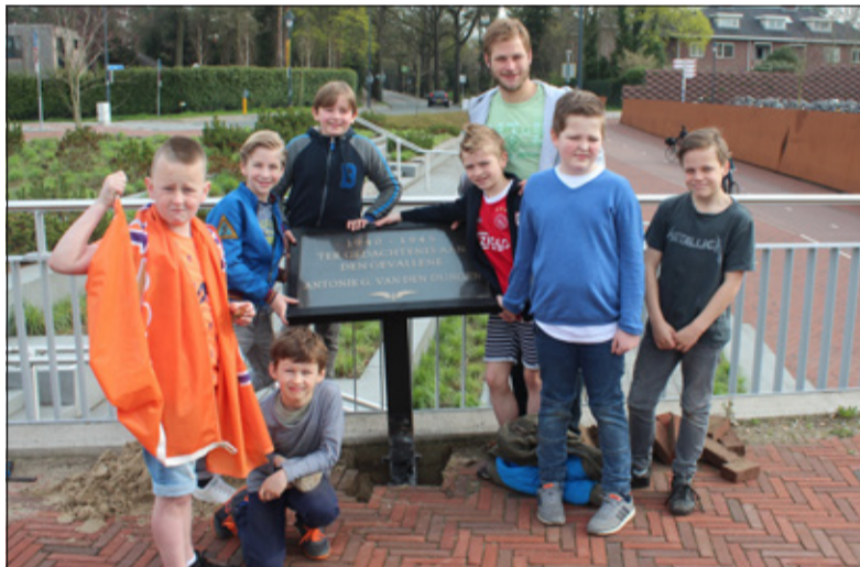
Leerlingen van Julianaschool groep 4b hebben de plaquette + sokkel verplaatst.