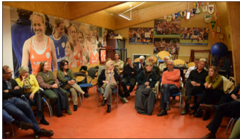
Veel omwonenden maken zich zorgen over het vele verkeer en de stijgende geluidsoverlast