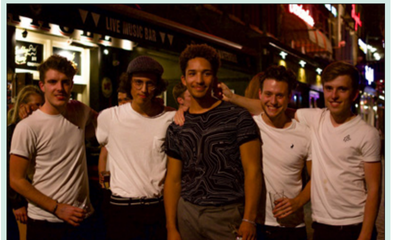
ParHasard is een band ontstaan uit een samenloop van toevalligheden.

Kings Jazz & Lounge is voor alle leeftijden. Er is een springkussen voor de allerkleinsten. Het event vindt plaats op 27 april 2018 in en voor de Centrumkerk, Julianalaan 42 in Bilthoven vanaf 15.00 tot 19.00 uur. Kings Jazz & Lounge is een initiatief van Rotary Zandzegge. De opbrengsten van het event gaan naar de Buddha's Smile School in India en naar extra muziekonderwijs voor alle basisscholen in De Bilt/Bilthoven. Kaarten via www.kingsjazz.nl of aan de deur. voor kinderen tot 18 jaar is de toegang gratis.