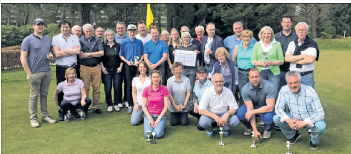
Deelnemers en winnaars van de Cross Country wedstrijd.