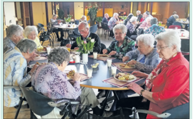
Zonnebloemgasten genieten van de brunch bij WVT.

Zondag 15 april konden zo'n 40 Zonnebloemgasten en 10 vrijwilligers genieten van een heerlijke brunch bij WVT, Talinglaan te Bilthoven. Eerst werd er een lekker kopje koffie en thee geserveerd met een klets-kop. Daarna konden de Zonnebloemgasten langs een langloopbuffet heerlijke gerechten halen; vrijwilligers ondersteunden hen, die moeilijk ter been waren, hierbij.