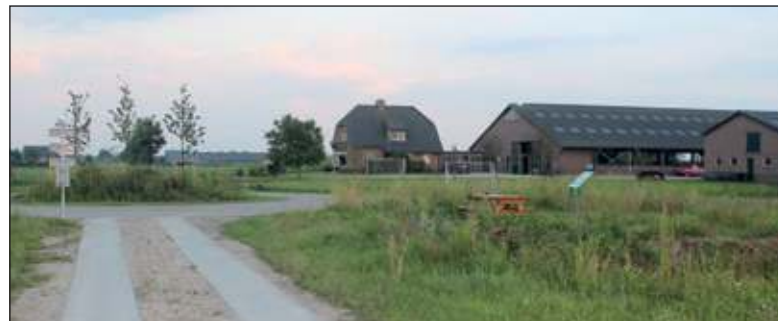
Vanaf de Graaf Floris V weg loopt een nieuw fietspad naar de (nieuwe) Korssesteeg.