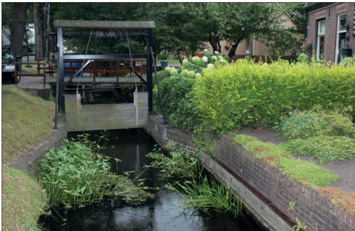
Ooit waren er zes schutjes in de wetering langs de Dorpsweg. Om de pramen te laten passeren werd door aan het grote rad te draaien het schut gehesen. Na de Tweede Wereldoorlog verviel het gebruik van de pramen. Het schut hoefde niet meer gehesen te worden.

Aan de Nachtegaallaan passeren we achtereenvolgens (rechts) De Vierstee, het (basis-)scholencomplex en de RK St. Maartenskerk en (links) de achteringang van Dijkstate en vervolgens het in 2006 en 2007 geheel gemoder-