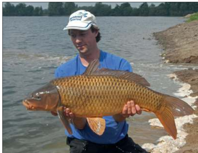
Door professionele vissers is het leeg gepompte deel leeg gevist en werden wel 100 grote vissen (zoals paling en schubkarper) terug gezet in het diepe deel.

Vogelaar Wigle Braaksma vertelt namens Vogelwacht Utrecht: 'Het afgelopen broedseizoen zijn leuke soorten aanwezig geweest, waaronder drie broedparen fuut, een paar Indische ganzen, spotvogel en (kortstondig baltsende) oeverlopers. De Hooge Kampse Plas is