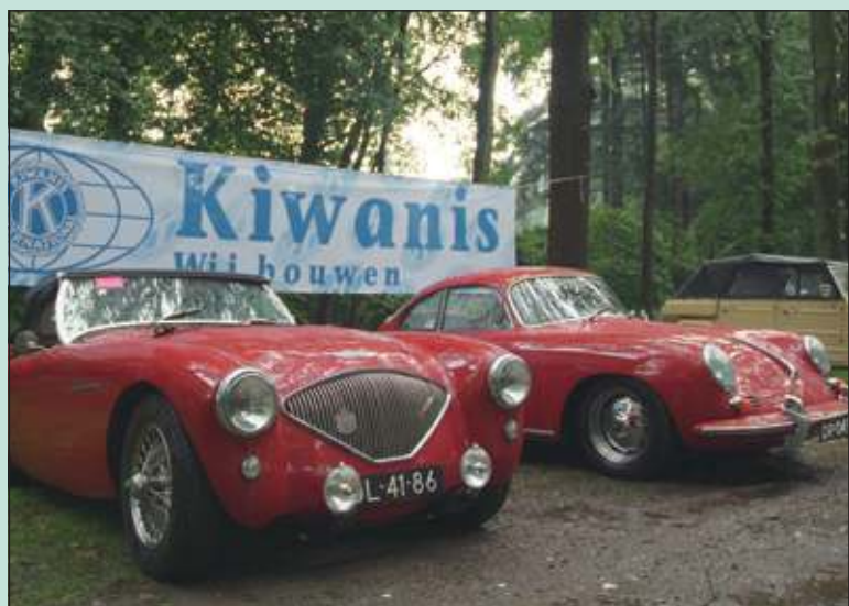
Zondag 25 augustus vindt de derde Gijs van Lennep Legend-rit plaats.

Gezien de bijna 100 auto's, die deelnemen, is het voor bezoekers handiger met de fiets te komen, want alle parkeerplaatsen rond het gemeentehuis zijn bezet die zondagochtend.