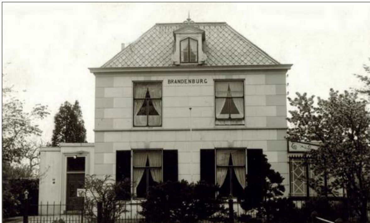
Dorpsweg 50 heeft de naam Brandenburg gekregen omdat de vrouw van de gemeentesecretaris van de boerderij Brandenburg in De Bilt kwam. (Foto uit 1958 uit de verzameling van Rienk Miedema)

Maartensdijk is ontstaan in een groot veengebied tussen het Gooi en de Utrechtse Vecht, dat het 'Oostveen' genoemd werd. In de vijftiende eeuw dook de naam Maartensdijk voor het eerst op, als een waterwerk in dat Oostveen. De nederzetting die er in de volgende eeuwen om heen groeide kreeg ten langen leste dezelfde naam. De gemeente omvatte aanvankelijk vrijwel het gehele Oostveen. Oostveen is meer een streeknaam. Het 'Gerecht Maartensdijk' werd na 1795 gemeente.