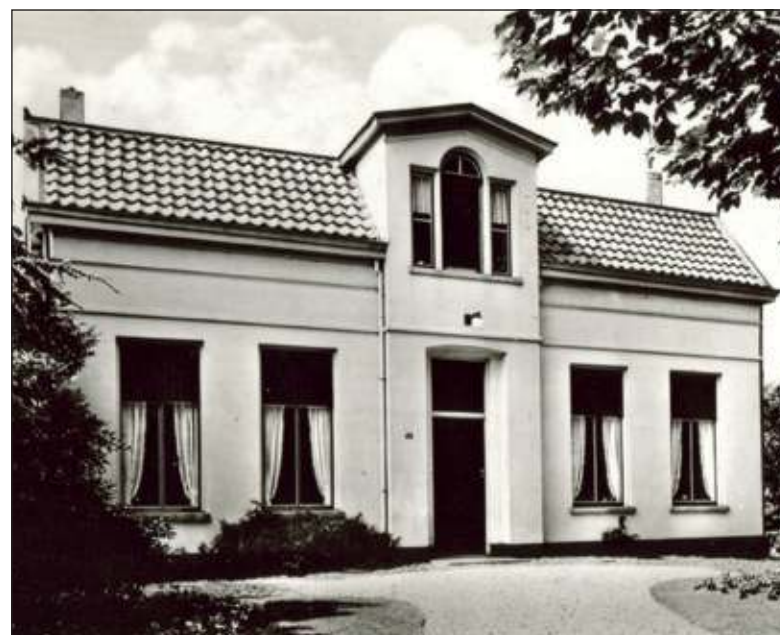
De pastorie Dorpsweg 40 is een gemeentelijk monument. De nagenoeg voltooide restauratie van het pand is zeker geslaagd te noemen.

seren we de Ontmoetingskerk, oorspronkelijk in 1967 gebouwd als Gereformeerde Kerk, nu PKN. De Julianalaan gaat over in (het bebouwde gedeelte van) De Prinsenlaan en is de voorloper van het Prinsenlaantje; het onbebouwde deel van de Prinsenlaan dat loopt vanaf de dorpsrand van Maartensdijk tot aan de Nieuwe Weteringseweg in Groenekan. Het is een cultuurhistorisch overblijfsel van een weg die gelopen heeft van Hollandsche Rading naar Utrecht. Na Prinsenlaan 26 gaan we rechtsaf en bereiken via de Sterrenlaan, de Bernhardlaan en (linksaf) de Melkweg weer ons vertrekpunt aan de Dierenriem.