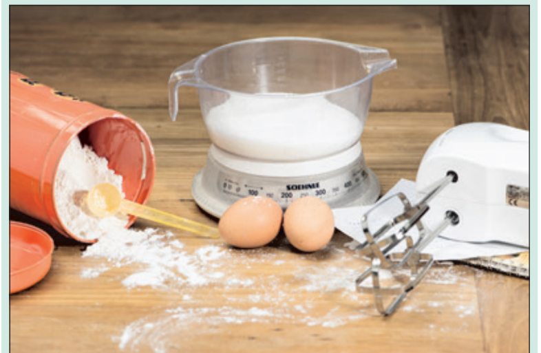
Taartenbakkers kunnen hun producten voortaan makkelijk lokaal kwijt.

De website is recent opgericht. In dit stadium worden vooral hobbybakkers verzocht om zich alvast aan te melden op www.gebakplaats.nl .