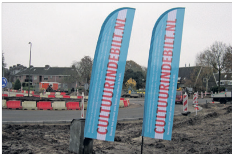
Cultuur in De Bilt blijft zichtbaar.

Expositie Gemeentehuis Jagtlust De Bilt 20 januari | 19 maart 2019 ART TRAVERSE Co van Gasteren schilderijen Mieke de Groot keramische beelden Zondag 20 januari om 15.00 uur opening www.arttraverse.nl