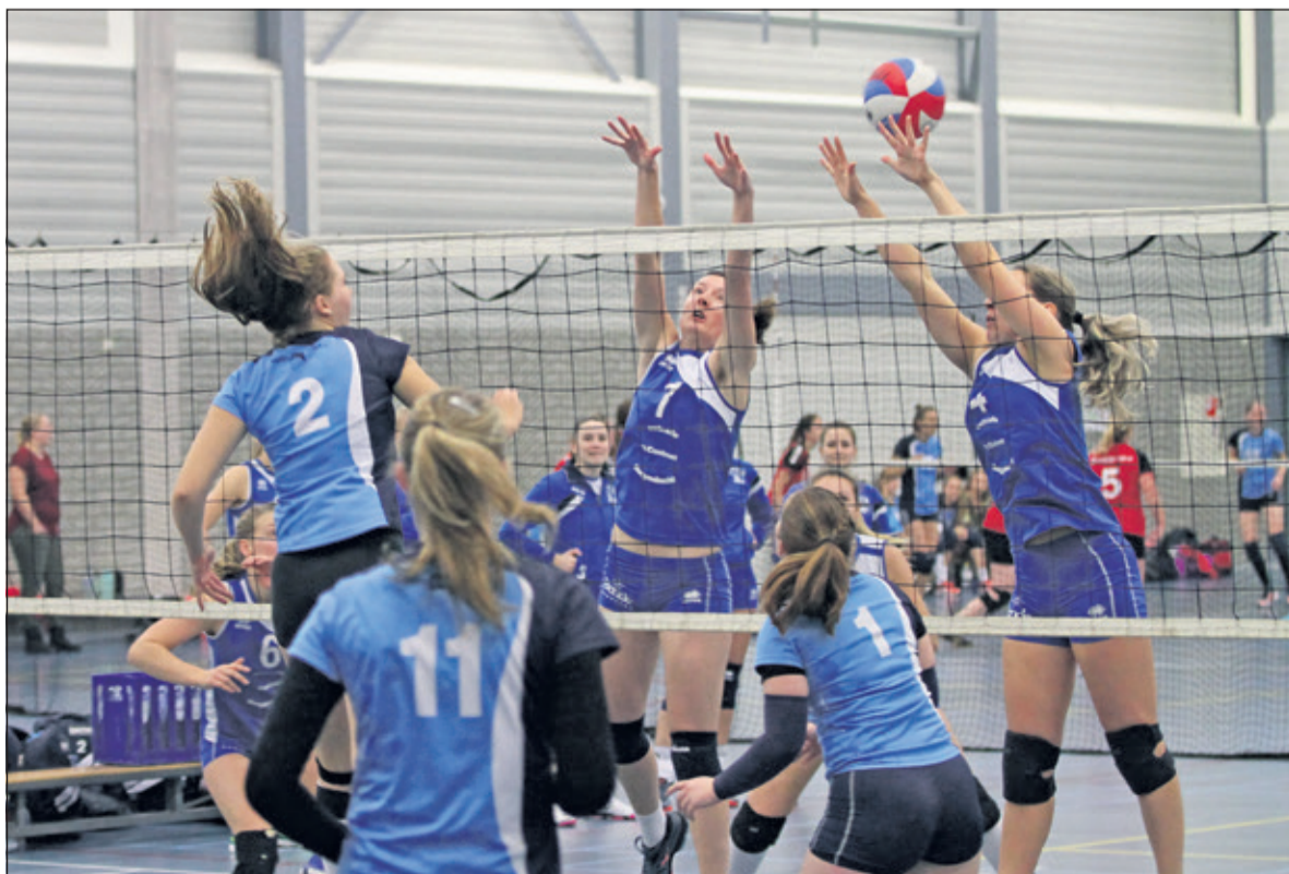
De Irenemeiden vechten voor ieder puntje dat ze kunnen pakken.