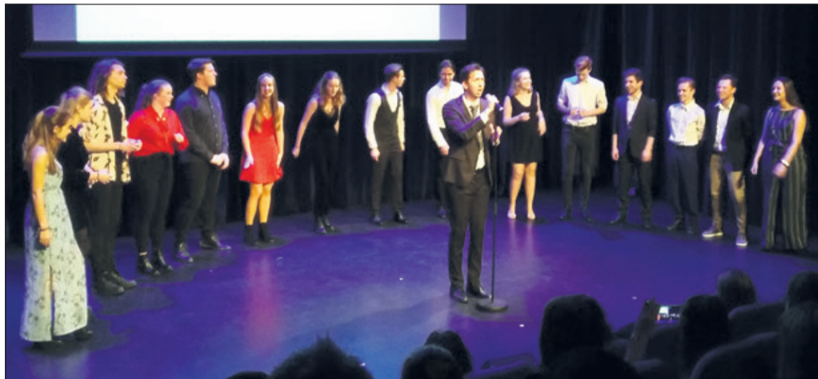
Mind vraagt middels een voorstelling aandacht voor psychische gezondheid.

ding van de gezongen nummers had kunnen geven, zodat het publiek zich beter had kunnen verplaatsen in diepere betekenis van deze reis door musicalland, waar duidelijk over was nagedacht maar die nu soms onvoldoende uit de verf kwam. De individuele prestaties waren echter vrijwel zonder uitzondering sterk, soms wat zang betreft, soms qua voordracht en vaak ook beide. (Peter Schlamilch)