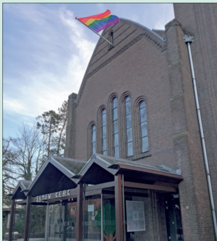
Op de voorgevel van de OLV-kerk (Bilthoven) werd de regenboogvlag uitgehangen (evenals bij meerdere kerkgebouwen) als reactie op de 'omstreden'-Nashville-verklaring. (foto Philip Vos, OLV Bilthoven).