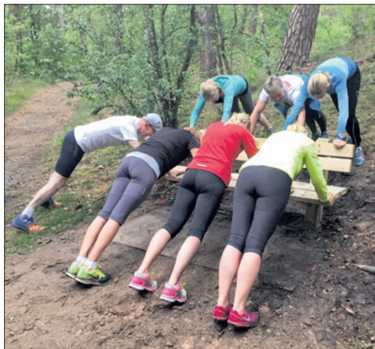
Trainen in groepsverband werkt stimulerend.