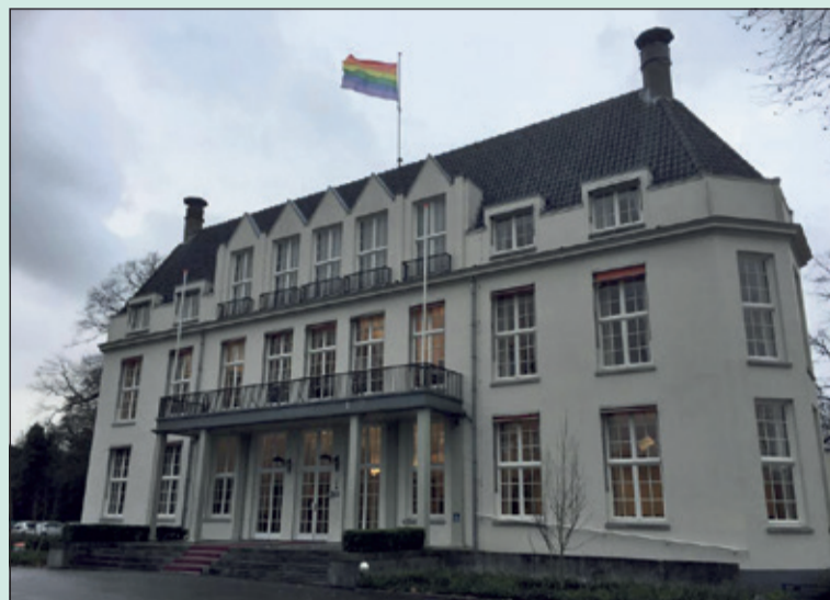
Op verzoek van een meerderheid van de fractievoorzitters uit de Biltse Gemeenteraad hing op 8 januari de regenboogvlag op Jagtlust.