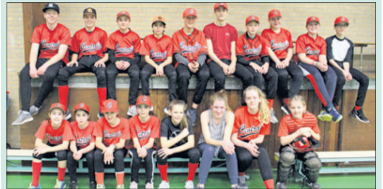
Centrals jeugd heeft even een time-out.