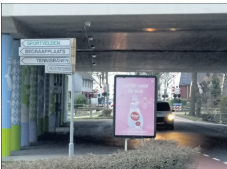
Het bord bij het viaduct in Maartensdijk ontnemt zicht.

Uiteraard legde de redactie al deze opmerkingen voor aan de bekende communicatiekanalen van de gemeente en RWS. In tegenstelling tot alle andere keren werd er geen enkele reactie of ontvangstbevestiging ontvangen; zelfs niet op een latere 'ontvangstvraag'.