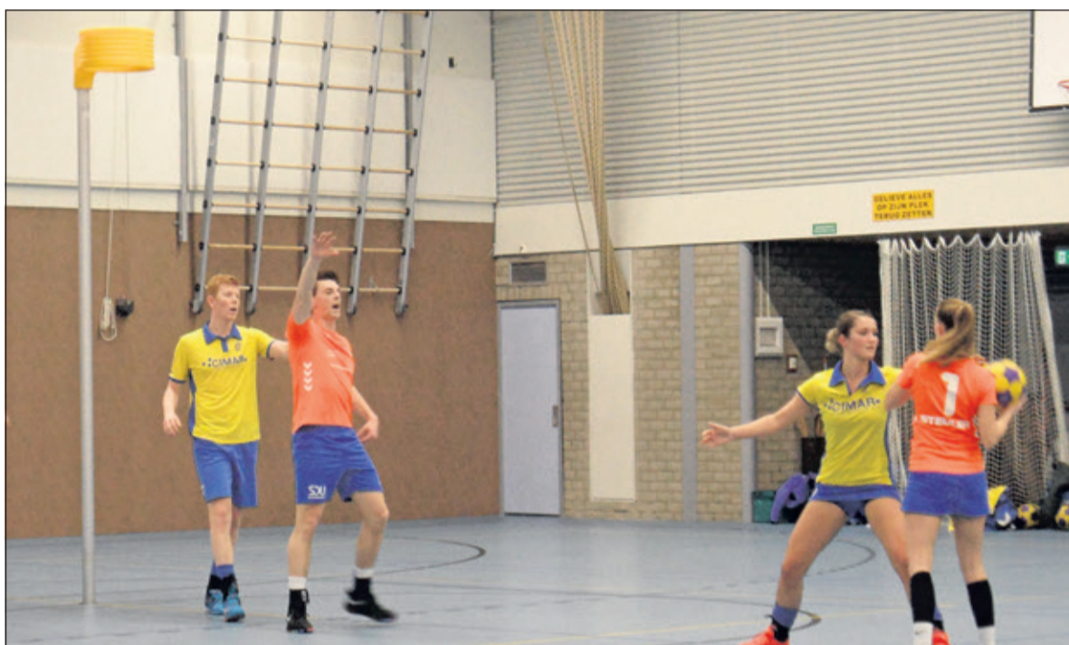
Dos weet het gat maar niet te dichten.

Het lukte de Westbroekers niet om echt lekker in de wedstrijd te komen en het tij te keren. Vanaf 14-14 was het steeds SKF dat op voorsprong stond. Het verschil bleef klein, maar DOS kon dit helaas niet meer overbruggen. Dat lag vooral aan DOS, dat zich zelf dat zich te kort deed met de 20-22 nederlaag. SKF en DOS wisselden zo stuuivertje op de ranglijst en staan nu op plek 4 en 5. Volgende week speelt DOS een uitwedstrijd tegen de nummer twee van de ranglijst, de Meeuwen. De wedstrijd in Putten begint om 20.30 uur.