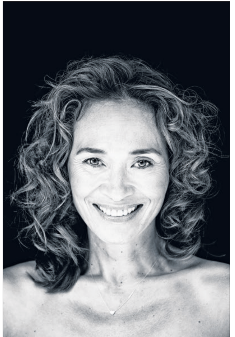
Bibian siert de cover van het boek.

Voor wie geïnteresseerd is in het (sport)leven van Bibian Mentel, verloot de redactie van De Vierklank vijf gesignde boeken van Bibian Mentel. In haar boek 'Leef' gaat zij uitgebreid in op haar leven als snowboardster en hoe zij haar beperking te lijf gaat. De eerste vijf inzenders krijgen het boek toegestuurd.