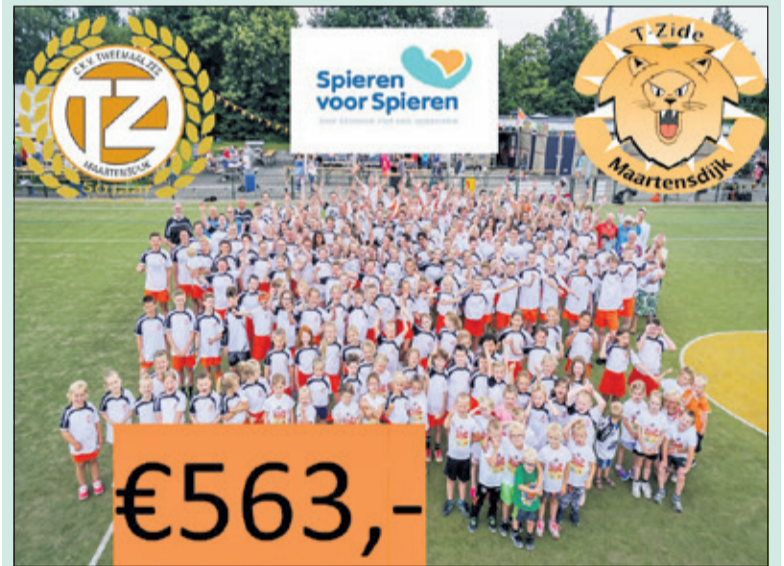
De supportersvereniging TZide en jubileumcommissie hebben verschillende acties gehouden en een deel hiervan (563 euro), gedoneerd aan het goede doel: Spieren voor Spieren.