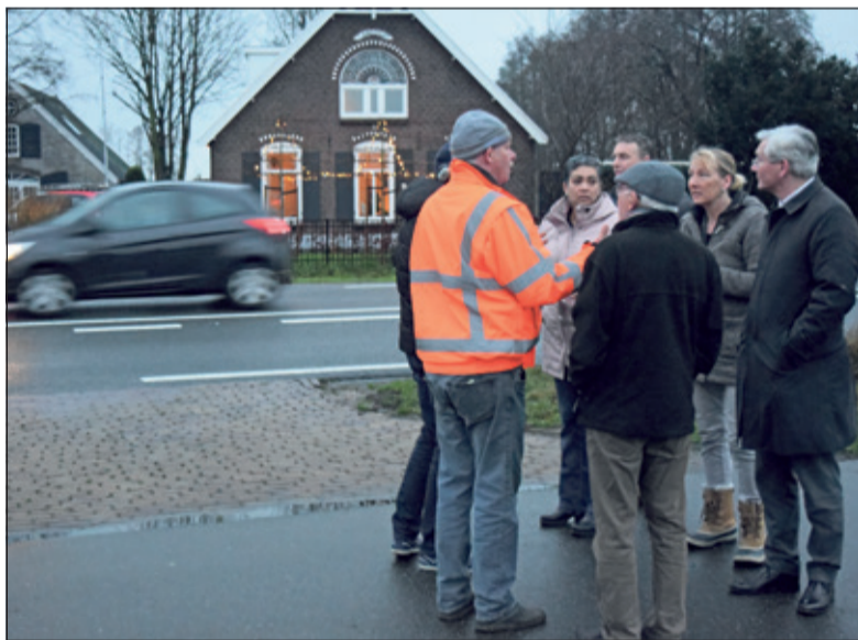
De Nieuwe Wetering oversteken is levensgevaarlijk