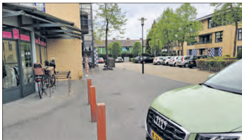
Later deze week worden hier de marktwagens van Zweistra voor 8 weken geplaatst.

De verkoop zal gedurende deze verbouwingsperiode plaatsvinden vanuit twee marktwagens, die tussen de winkels van Nagel Fashion en Landwaart Culinair worden geplaatst. De verkoop zal volgens de markt-corona-richtlijnen plaatsvinden en betalingen kunnen ook met de pin worden gedaan.