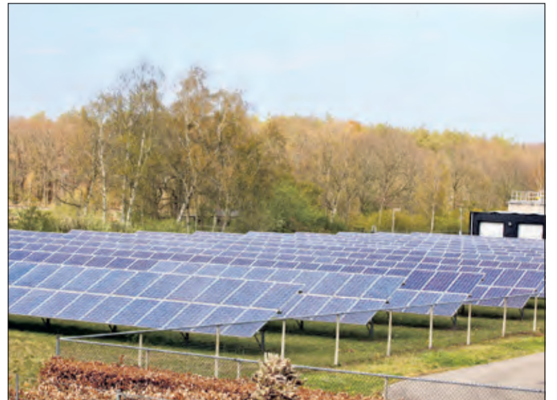
Het zonnepark bij de rioolwaterzuivering aan de Groenekansweg.

'Ik zeg vaak in gesprekken met mensen in De Bilt dat je maar beter niet kunt wachten tot de energie-