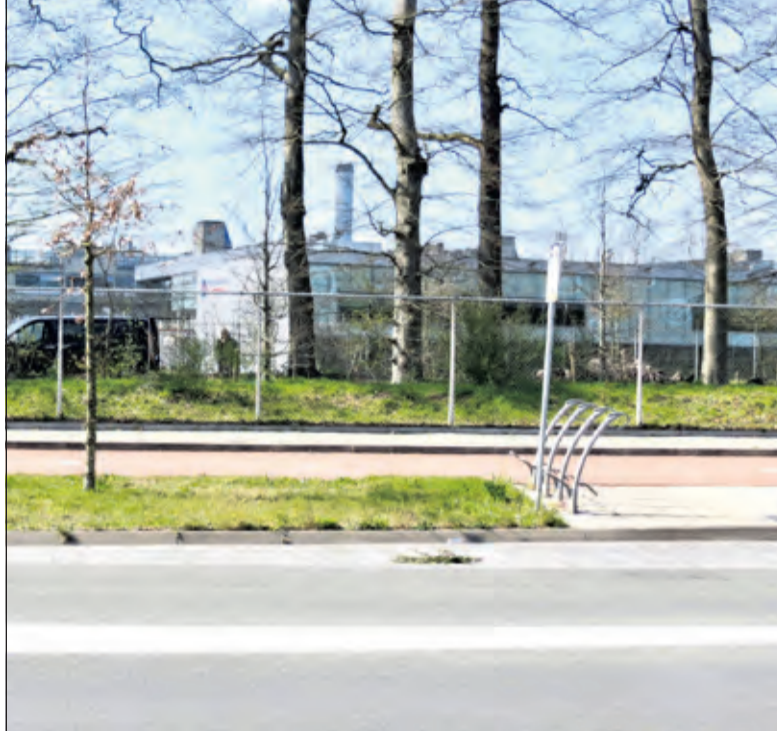
Het RVIM gezien vanaf de Soestdijkseweg.

Er werden 15 amendementen in stemming gebracht die alle werden verworpen. Een motie van wanhouden tegen wethouder André Landwehr ingediend door Forza De Bilt werd met 8 stemmen voor en 18 tegen verworpen. Een motie van afkeuring tegen de wethouder ingediend door Fractie Brouwer werd met 10 stemmen voor en 16 tegen verworpen. Unanieme steun is er voor een motie ingediend door GroenLinks die het college oproept de verkeersafwikkeling bij de ontwikkeling van de Schapenweide en de zorgen hierover in het vervolgproces mee te nemen en in een vroeg stadium op de agenda te zetten. De motie vraagt tevens om het Rijksvastgoedbedrijf te verzoeken dit toe te voegen als bijlage aan het biedboek.