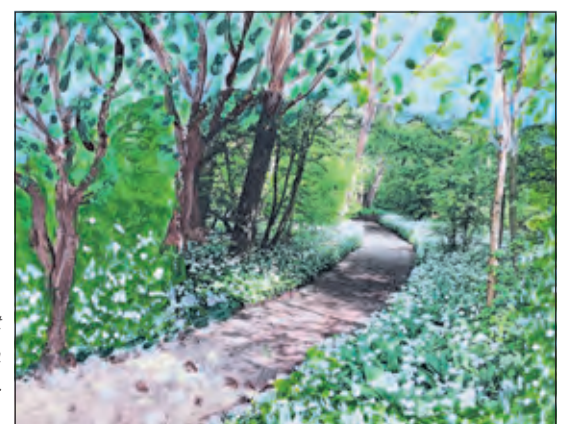
Herkenbare kunst van de hand van een van de Rinnebeek deelnemers.