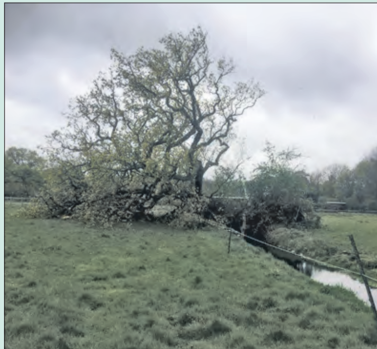
De omgevallen eik.

'De ca. 250 jaar oude eik heeft het niet gered, omdat zijn wortels niet goed konden uitgroeien; Het grondwater was hoog waardoor de wortels niet diep de grond in konden. Daarnaast hebben koeien en paarden die schaduw onder de boom zochten, de grond platgestampt. Zo bleef de kluit relatief klein. Van de oude eikenlaan uit de formele aanleg zijn nu nog 3 eiken overgebleven. Er staan er nog bij het bruggetje naar het kleine bosje, in het kleine bosje en de laatste nog in het weiland. De eik heeft met 250 jaar een mooie leeftijd bereikt, maar had nog een stuk ouder kunnen worden. Als de omstandigheden van zo'n boom goed zijn, kunnen ze de duizend jaar passeren.'