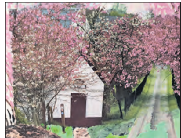
Deelnemers aan de dagbesteding bij Rinnebeek maken verrassende kunst.

Vorbijgangers kunnen de schilderijen nu bekijken in het Ontmoetingscentrum Rinnebeek, aan de St. Laurensweg 11 in De Bilt.