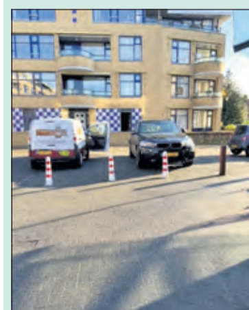
Bij gebrek aan parkeerplaatsen worden auto's voor de rode paaltjes neergezet.