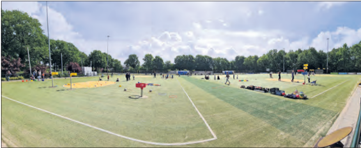
De korfbalvelden zijn klaar om spelers te ontvangen.