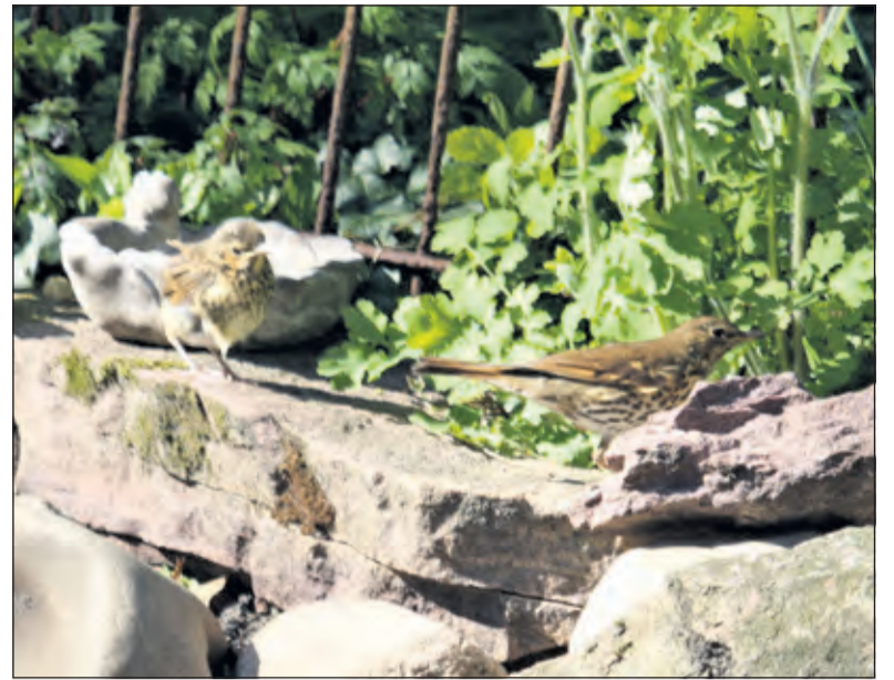
De lijsters voelen zich nog veilig in de tuin.

'Einde actie van het lijsterpaar, dat elke ochtend en avond hun longen uit het lijf zong. Na een periode van broeden, de gehele dag voedsel zoeken. Alle moeite voor niets. Ik weet dat de natuur enorm hard