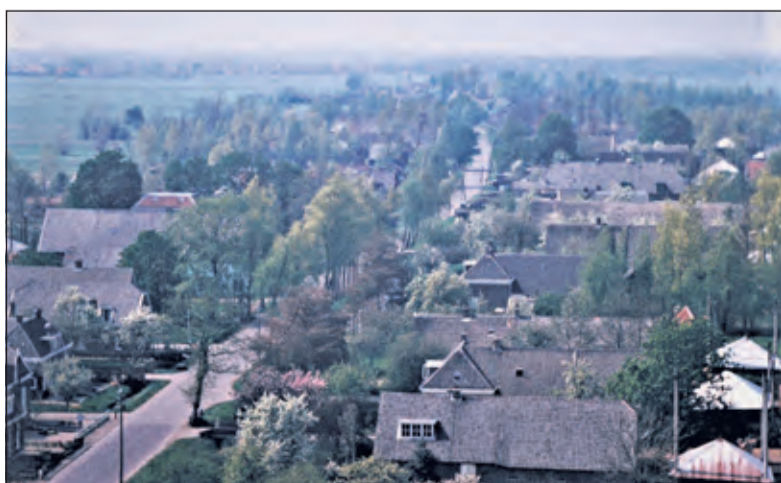
Kerkdijk rond 1965.