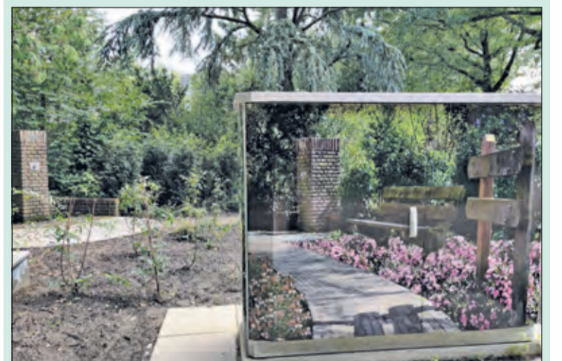
Vanaf de Vuursche Dreef zijn nu twee waterpunten.

Nu de scholen weer zijn begonnen is het devies rijd niet onbezonnen want bedenk hoe het gaat kinderen spelen op straat met rustig rijden is dan veel gewonnen