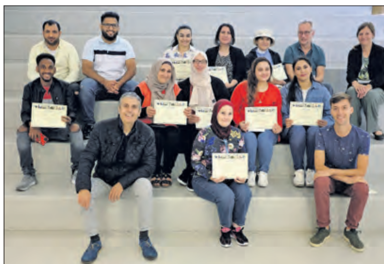
Deelnemers aan de zomerschool zijn trots op hun behaalde certificaat.

Steunfonds Vluchtelingen De Bilt maakt de Zomerschool financieel mogelijk, zodat de deelnemers echt een stukje op weg geholpen worden in onze maatschappij. Meer informatie? Kijk op de website: www.steunfondsvluchtelingendebilt.nl/ (Maud Bredero)