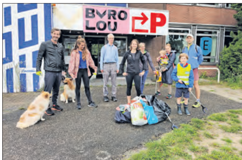
Eindpunt van de Groene Toer bij Buro Lou (voormalig politiebureau).

Bilt op zaterdag 18 september. Kijk voor meer informatie op www.sportiefinhetgroen.nl .