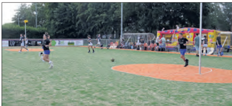
Dos in actie op het nieuwe veld.