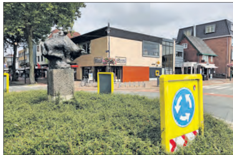
Het beeld, waaruit woeste kracht spreekt, is gebaseerd op een verhaal uit de Griekse mythologie.