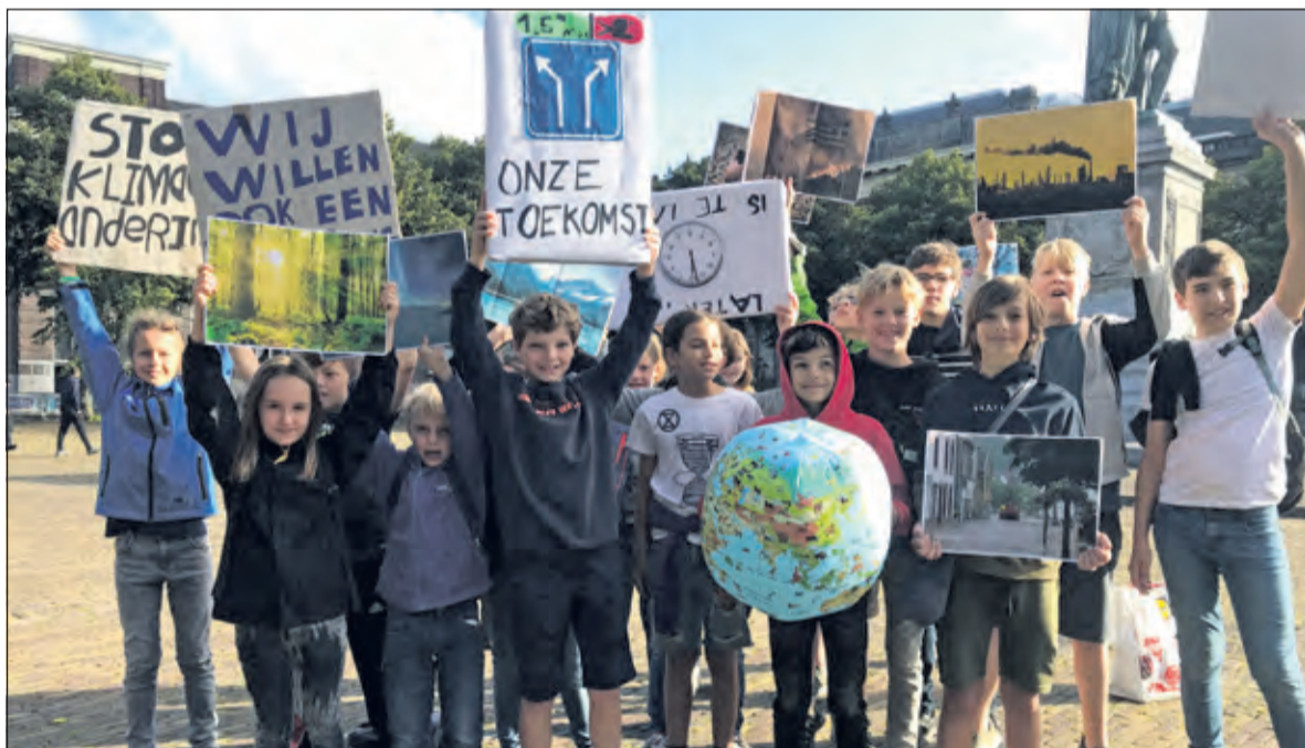
De KinderKlimaatwakers in Den Haag.