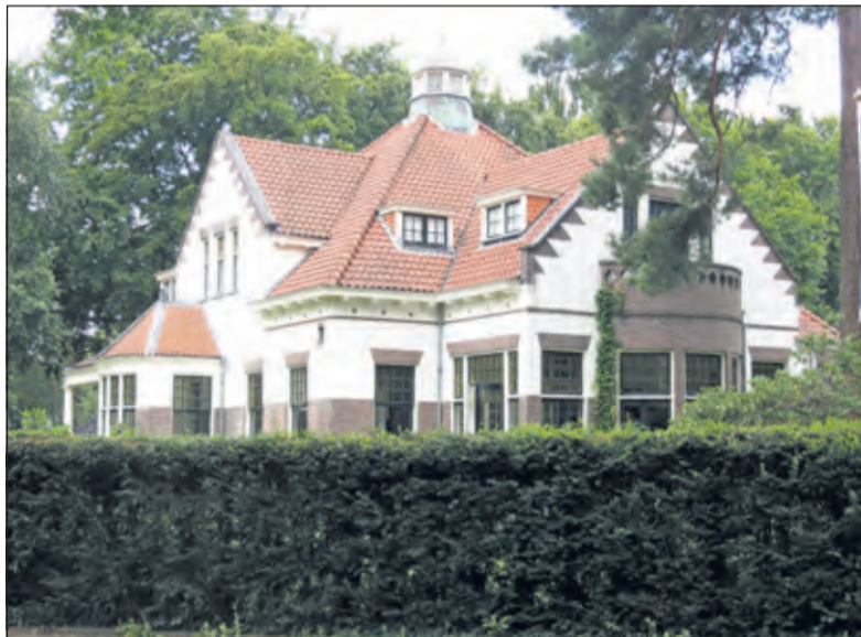
Op 11 september opent burgemeester Sjoerd Potters de Open Monumentendag bij villa Trinari aan de Soestdijkseweg in Bilthoven.

Burgemeester Sjoerd Potters opent de dag op 11 september bij villa Tri-