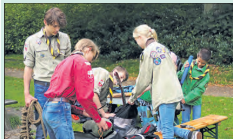
De scouts zijn druk in het Van Boetzelaerspark.

Scouting moet je beleven, daarom kun je in de maand september tijdens een opkomst kennis komen maken. Jongens en meiden kunnen van 9.30 uur tot 11.30 uur gezellig mee doen met de bevers (5-7 jaar) of met de welpen (7-11 jaar). De verkeners (11-15 jaar) hebben hun opkomst van 11.30 uur tot 13.30 uur. Rowans, jongeren van 15-18 jaar komen op vrijdagavond van 19.30 uur tot 21.30 uur bij elkaar. Voor meer informatie www.benlabre.nl of neem contact op via info@benlabre.nl