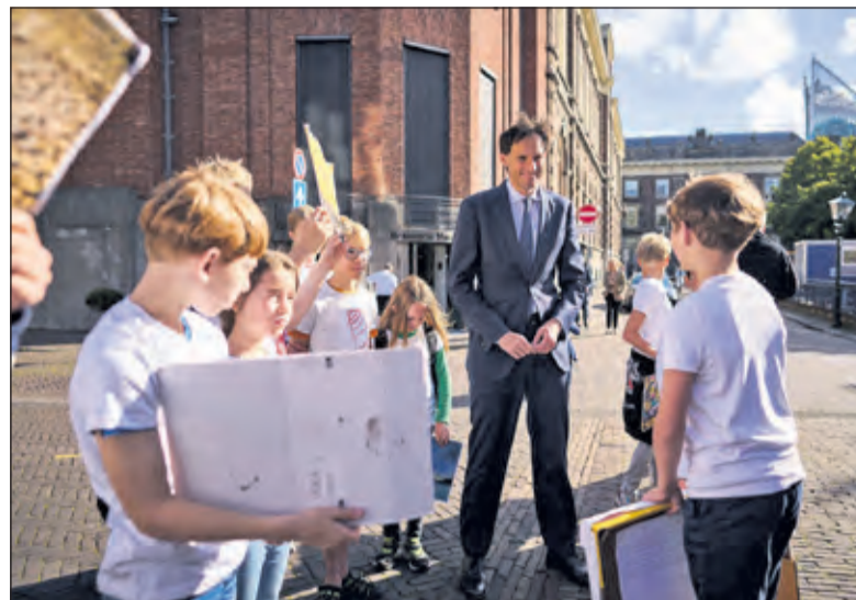
De groep luistert naar minister Wopke Hoekstra.

Onlangs verscheen het klimaatrapport van IPCC. De belangrijkste conclusie is dat klimaatverandering onomkeerbaar is. Maar, zo concludeert het rapport, het is niet te laat om drastische maatregelen te nemen. Die oproep heeft Bram letterlijk op zich genomen. 'Ik kan niet stilzitten en blijven afwachten', aldus de jonge actievoerder. Hij probeert daarom leeftijdsgenoten aan te wakkeren om ook actie te ondernemen. 'In groep 5 heb ik een spreekbeurt gehouden over de dieren die uitster-