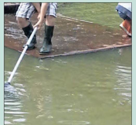
Nieuwe slootexperts mogen in de vissenkom op Beerschoten vissen.

Woensdag 8 september gaat het over Waterdiertjes. Op Beerschoten wordt een bezoek gebracht aan de vissenkom, een watertje in het bos. Dus laarzen aan en vang de meeste diertjes. Het is voor de leeftijdsgroep 6 t/m 10 jaar, het duurt van 14.30 tot 16.30 uur en het vindt plaats bij Paviljoen Beerschoten, de Holle Bilt 6 in De Bilt. Aanmelden kan per email tot en met zaterdag 4 september naar kindernatuuractiviteiten@gmail.com (Trees Althues)