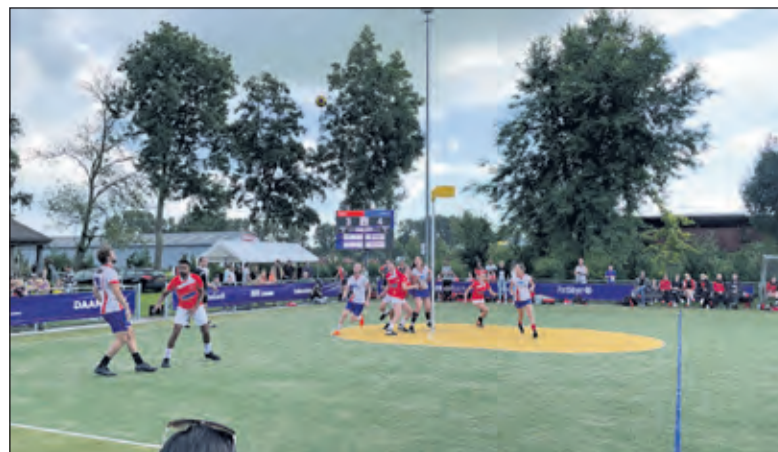
Tijdens de KorfbalTotaal Regio Cup werd er een nieuwe wedstrijdvorm geprobeerd.

Nova en de derde eindigde in een gelijkspel. Viko won de shoot-out, waardoor Nova 2-1 achter kwam in sets. Maar Nova was strijdlustig en haalde de vierde set binnen. Met een einduitslag van 2-2 volgde een allesbeslissende shoot-out. Nova won de shoot-out en won hiermee de KorfbalTotaal Regio Cup.