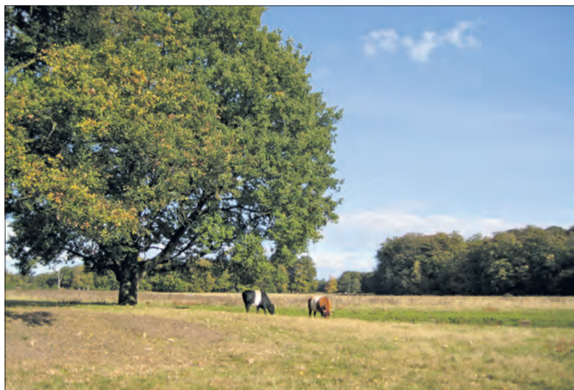
Koeten en heel oude bomen op Houdringe.