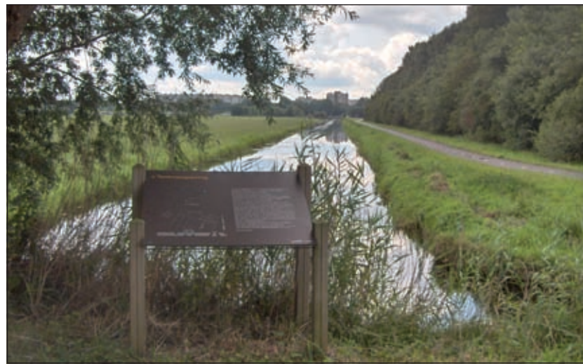
De brede watergang die met de Ruigenhoeksedijk kruist en uitkomt bij gemaal Overvecht-Zuid.

Het Fort op den Ruigenhoekse Dijk (1869-1870), in eigendom van Staatsbosbeheer. Het sloot de dijkwegen, tevens inundatiekaden af. Rondom het fort worden dikwijls broedvogels als de bosuil, de grote bonte specht, de blauwe reiger en de ijsvogel aangetroffen. Doordat er zand op de gebouwen ligt, afkomstig uit de fortgracht, is het een 'eilandje' van zandgrond in het veengebied, wat een aantal bijzondere plantensoor-