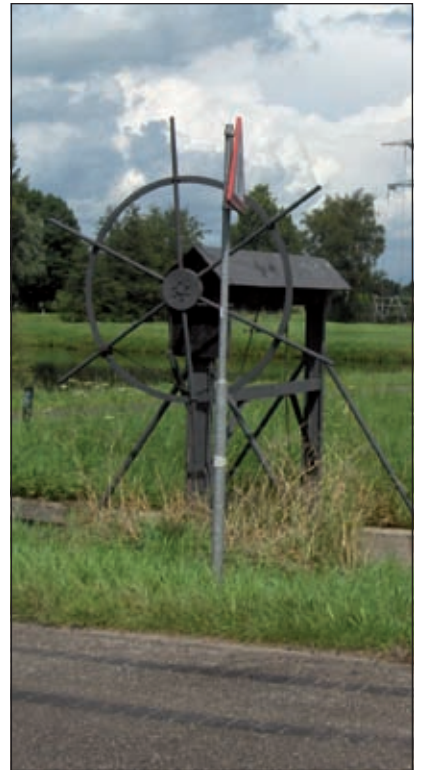
Bij het verlaten van het Gagelbos aan de kant van de Utrechtse Gageldijk, treft men links van de brug opnieuw een stuw of valschut.

De fietsroute is verkrijgbaar bij Hoogheemraadschap De Stichtse Rijnlanden, Postbus 550, 3990 GJ Houten. E-mail: post@hdsr.nl