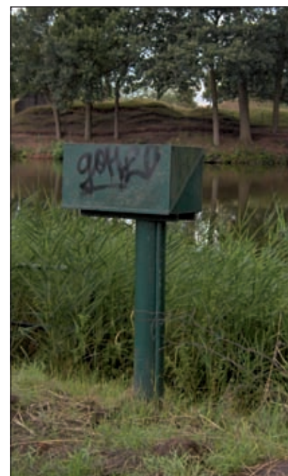
Een van de twee groene palen die meetapparatuur bevat om waterkwantiteit te bepalen.

Vervolgens is het even goed zoeken naar de Grondwaterpeilbuis. Bereidwillige medewerkers van zwembad De Kikker helpen ijverig mee, omdat ook hen dit meetpunt nooit eerder is opgevallen. Uiteindelijk wordt de buis buiten het zwembadterrein links in de tweede bocht van het Kikkerpad, dat naar de Kooidijk loopt, getraceerd. De Grondwaterpeilbuis is één van de 380 punten waar tweemaal per maand het verloop van de grondwaterstanden in de provincie Utrecht wordt afgelezen.