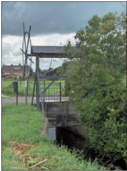
De bijna anderhalve eeuw oude stuw- of valschutten aan de Kooidijk.

Wij vervolgen onze route een kleine twee kilometer over Kikkerpad (cultuurpad) en (aan het einde linksaf) Kooidijk. Voordat de Kooidijk aan het westelijke einde naar links gaat afwijken, worden we geattendeerd op de eerste van twee stuw- of valschutten. Deze stuwen zijn waarschijnlijk ooit gebouwd voor de Nieuwe Hollandse Waterlinie en dus al meer dan een eeuw oud. Normaal gesproken staan ze open.