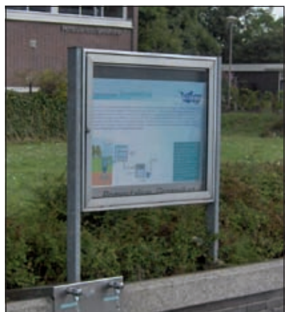
Fris slokje water aan de Ruigenhoeksedijk

Via de Koningin Wilhelminaweg komen wij op de Ruigenhoeksedijk bij het pompstation van drinkwaterbedrijf Vitens. Hier pompt het