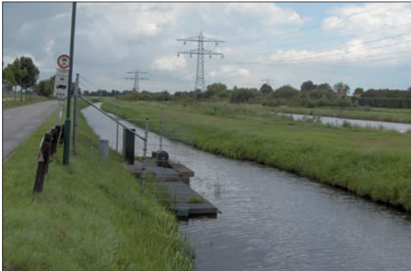
De Stuw ter hoogte van de splitsing BeHa en WeBe.

Aan het einde van de Kooidijk voert de route naar links. Ter hoogte van de T-splitsing van de Burgermeester Huydecoperweg en de Westbroekse Binnenweg valt ons oog op de aan de oostzijde gelegen Stuw met vispassage. Deze stuw zorgt ervoor dat overtollig water vanuit de polder Achtienhoven naar de polder Maarseveen (aan de overzijde van de weg) kan overlopen. Voor vissen is een stuw niet te overbruggen; daarom is een vispassage aangelegd. Deze