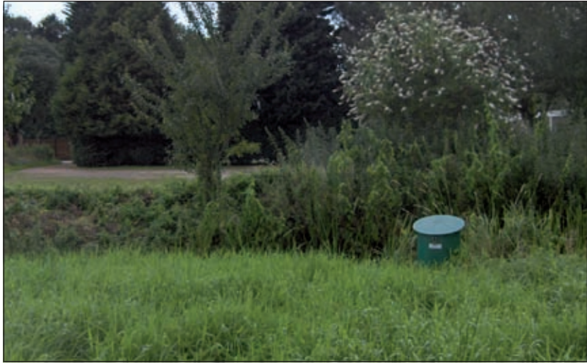
Na goed zoeken ontdekten we de grondwaterpeilbuis.

Wij vervolgen onze route een kleine twee kilometer over Kikkerpad (cultuurpad) en (aan het einde linksaf) Kooidijk. Voordat de Kooidijk aan het westelijke einde naar links gaat afwijken, worden we geattendeerd op de eerste van twee stuw- of valschutten. Deze stuwen zijn waarschijnlijk ooit gebouwd voor de Nieuwe Hollandse Waterlinie en dus al meer dan een eeuw oud. Normaal gesproken staan ze open.