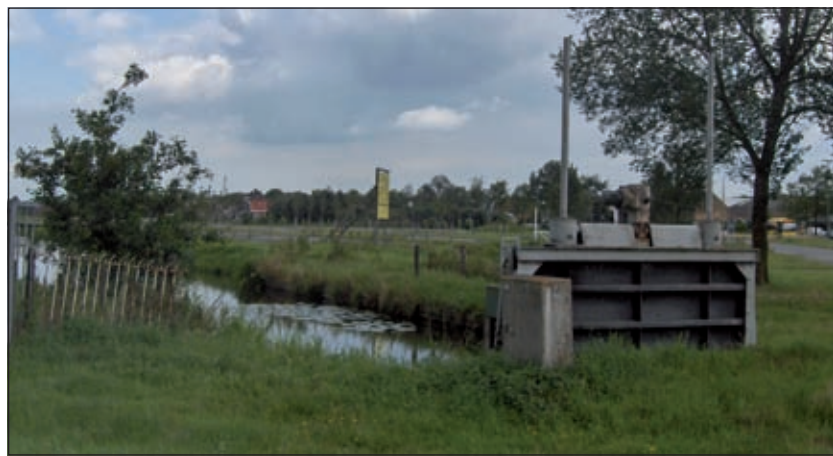
De Schuif in de Groenevaart staat tegenwoordig altijd open. Op de achtergrond ligt recreatiepark Ruigenhoek.

Een volgend punt is een brede watergang die de Ruigenhoeksedijk kruist en uitkomt bij gemaal Overvecht-Zuid. Dit gemaal pompt overtollig water uit de polder Ruigenhoek naar Overvecht en uiteindelijk naar de Vecht. In de routefolder is een foto opgenomen van deze watergang met uitvoerig een informatiebord daarbij in beeld. Het bord vermeldt informatie over de gedeeltelijk herstelde tankversperring, welke kort voor 1940 werd gebouwd. Terecht vraagt het Hoogheemraadschap op deze wijze aandacht voor die tankversperring. Het was het modernste verdedigingsmiddel van de Waterlinie. Dankzij al die sloten, weteringen etc.