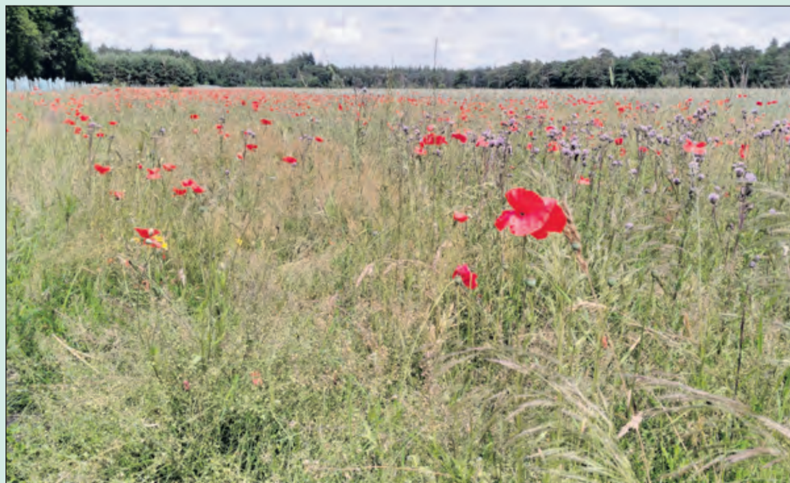
Wat is er veel moois te beleven in de natuur. Alles heeft zijn volgorde: eerst bloeiend koolzaad, daarna de velden met margrietten en zover je kijken kunt klapprozen. (Anneke Bolt)