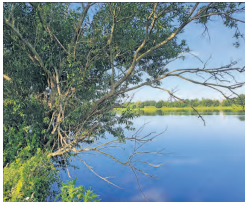
Veel vogelaars weten de Hooge Kampse Plas inmiddels te vinden.

uit. De cetti’s zanger is een kleine, bruine zangvogel. Het aantal neemt de laatste jaren toe, door onder andere het veranderende klimaat. Naast Zeeland en Zuid-Holland wordt deze Zuid-Europese soort op steeds meer plekken in Nederland gezien. ‘Terwijl het hier op en rond de Hooge Kampse Plas dringen was geblazen, was het in de grote stad juist rustig. Kraaien en diverse soorten meeuwen zoch-