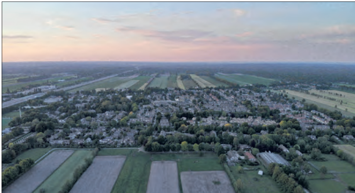
Maartensdijkers willen graag betrokken worden bij de plannen voor woningbouw.

In deze vergadering van de Raadscommissie ging onnodig veel van de tijd (bijna 2 uur) verloren aan het spreken over aantallen en soort van te bouwen woningen en vooral waar; uiteindelijk werd het getal van 200 nieuwe woningen in Maartensdijk uitgesproken. Onduidelijk was en bleef het dan waar en wanneer. En het agendapunt (6) van deze vergadering ging alleen maar over de 'niveau-vraag'; men geeft inwoners hierbij de gelegenheid wensen en ideeën aan te leveren. Mag men dan mee-weten, meedenken, meewerken of meebepalen? Die vraag beantwoordt de gemeenteraad wellicht op 25 juni.