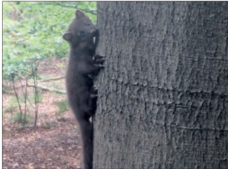
De boommarter aan een beukenstam in het Beukenbos aan de Eikensteeg.

Volgens Hartman bevinden zich waarschijnlijk twee nesten in hetzelfde territorium, iets dat zeer zelden voorkomt. De twee moertjes (vrouwjes) zijn bij haar bekend onder de namen Els (de jongste boommarter) en Riek (de oudste). Alle geïnventariseerde boommarters krijgen een naam. Twee moertjes in één territorium is wel heel opmerkelijk, volgens Hartman. En mogelijk heeft het oudste moertje Riek de jongste verjaagd en zijn de jongen alleen achtergebleven. Van Boetzelaer: 'Margriet Hartman vertelde mij dat jonge boommarters een heel eind kunnen lopen en zij het jong, een vrouwtje, al meerdere malen hebben teruggezet, in de hoop dat moeder boommarter nog ergens was. Helaas