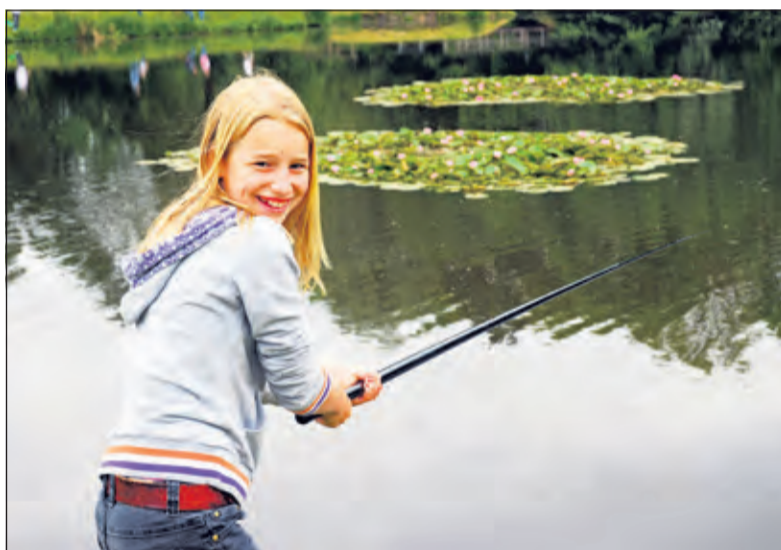
Ook meer jeugd vindt de weg naar de hengelsport.

rechten van de kant van de gemeente De Bilt niet goed loopt. Door de toename van leden hebben we ook een toenemende behoefte aan water waar gevestigd mag worden. Tot nu toe vissen we vooral in de plassen achter Tuincentrum Overvecht en de vaart tussen Groenekan en West-