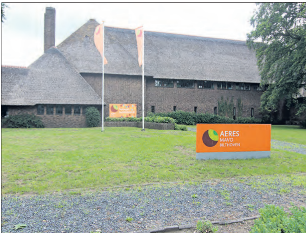
Bij de Aeres Mavo proberen ze er het beste van te maken en positief te blijven.