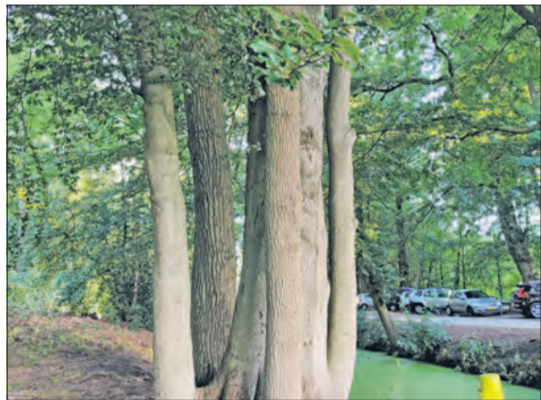
Die aan de zuidzijde van de baronbrug weet helemaal van wanten.