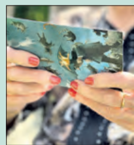
Een persoonlijke boodschap van een onbekende.