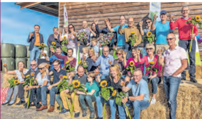
Deelnemers aan het zonneproject Nieuw Toutenburg.

De Consumentenbond geeft om | nieuwe energie al jaren een 10 in haar onderzoek. Overstappen naar om kan via www.beng2030.nl Kijk op de pagina Energie opwekken, groene energie via BENG! voor informatie, een offerte en gemakkelijk aanmelden.