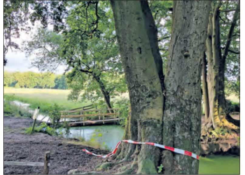
De Vierstammige beuk bij de noordzijde van de baronbrug.

boeketten is volgens experts nodig voor de instandhouding van groen erfgoed. Bij Houtringe staan op meerdere plaatsen rijtjes beuken en eiken, die telkens samen leken te zijn opgegroeid. Het is bekend van boswachters dat het soms heel normaal was meerdere bomen in één plantgat te zetten. Bij de baronbrug aan weerszijden ervan vindt men twee boomgroepen als hakhout.