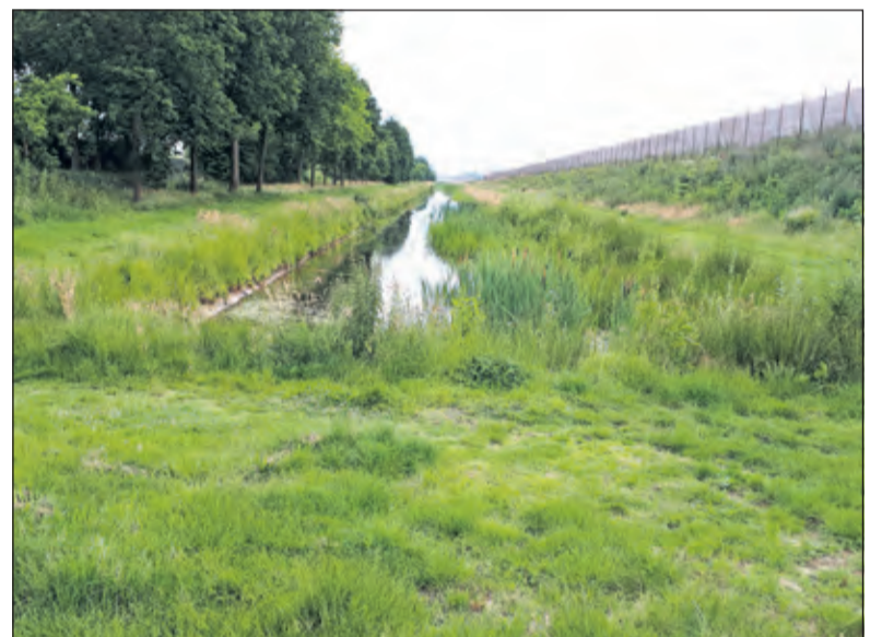
De wetering achter de sportvelden langs de A27 in Maartensdijk. Hengelsportvereniging De Bilt is druk doende hierop visrecht te verkrijgen.

visrechthebbende. Vaak is dat een gemeente, een waterschap of een particulier. Iedereen boven de 14 jaar die wil vissen heeft een VIS-pas nodig. Hiermee kan in alle wateren in Nederland, waar hengelsportverenigingen het visrecht hebben, worden gevist. Alle informatie staat op www.sportvisserij-nederland.nl '.