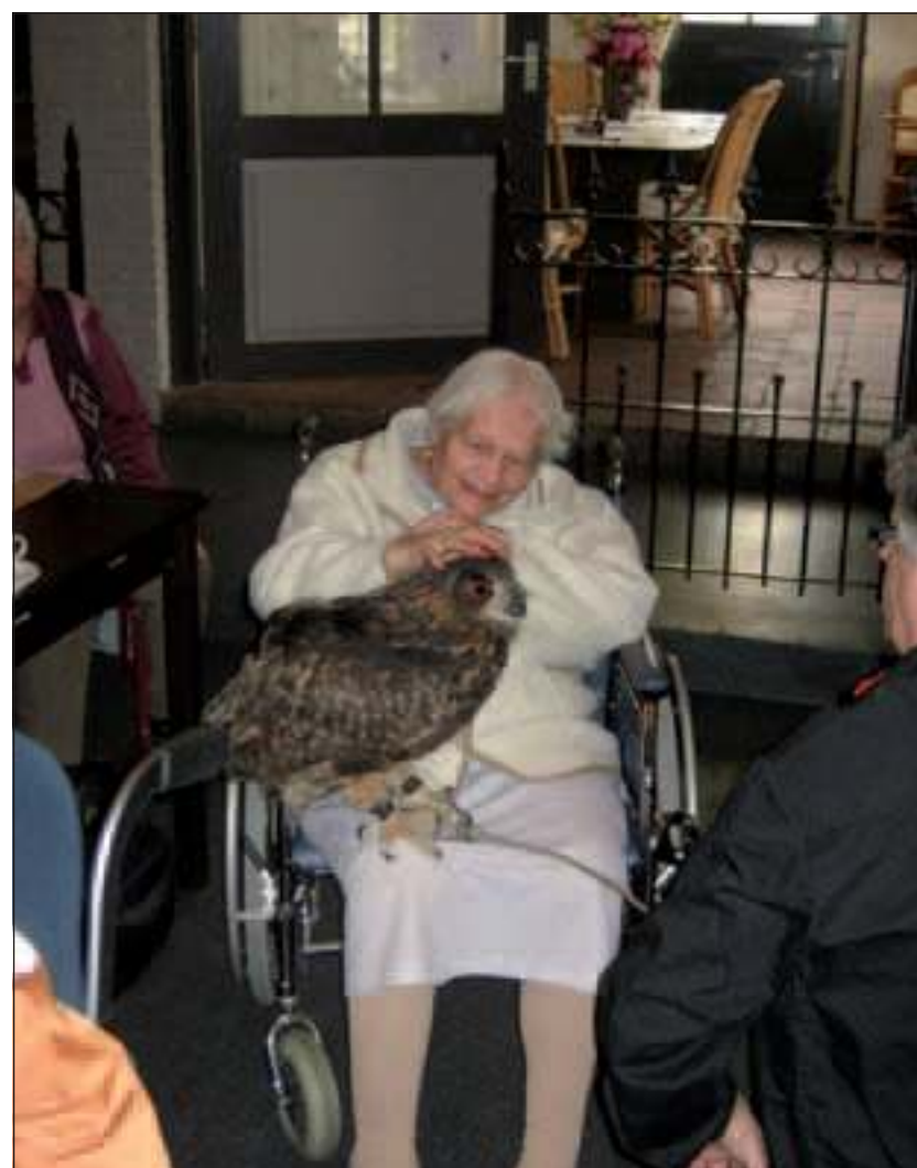
Na aankomst in Ameide werden de deelnemers o.a. welkom geheten door tamme uilen.

Besloten wordt te kiezen voor de rondrit door de Alblasserwaard onder leiding van een gids. Aan al het moois komt dan toch weer een eind. Rond de klok van half vijf worden de gasten weer afgeleverd in Weltevreden, Bremhorst en Schutsmantel, wetende dat dit niet het laatste uitje met De Zonnebloem zal zijn.