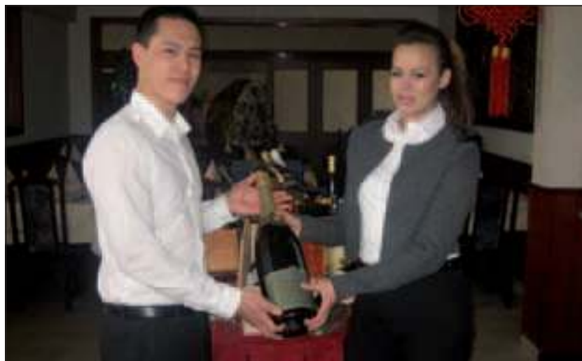
Gastvrouw en Gastheer. Bescheiden, beschaafd en zeker van hun zaak.

het, bescheiden, beschaafd en zeker van hun zaak. Ook als er grote groepen gasten komen kunnen ze dat aan. Er is vast personeel en indien nodig, worden er nog extra opgeroepen. Alleen op dinsdag is het bedrijf gesloten. Alle andere dagen zijn ze open van 16.00 uur tot 22.00 uur. Van 4 uur in de middag tot 10 uur in de avond.