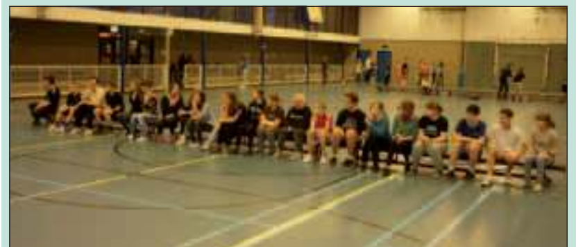
Klaar voor een sportieve ontmoeting in De Vierstee.

Vorige week waren er voor de zestiende keer Poolse gasten op bezoek bij het Maartensdijkse Groenhorst College. Maandag 4 april kwamen de Poolse gasten uit Miescisko aan in Maartensdijk. Het programma bevatte bezoeken aan Doorwerth met midgetgolf, een rondleiding door het Arnhemse Gelredome (Vitesse) en wandklimmen, winkelen en bowlen, in Arnhem. Ook was er een sportontmoeting in De Vierstee, handboogschieten in Hilversum en een bezoek aan de binnenstad van Utrecht. Op de laatste dag werd de Efteling bezocht en was er een afsluitende disco bij Sojos. Van 5 juni t/m 9 juni bezoekt het Groenhorst College Miescisko met een groep tweedeklassers die er voor de eerste keer naar toegaan. (Anneke Voorhorst)