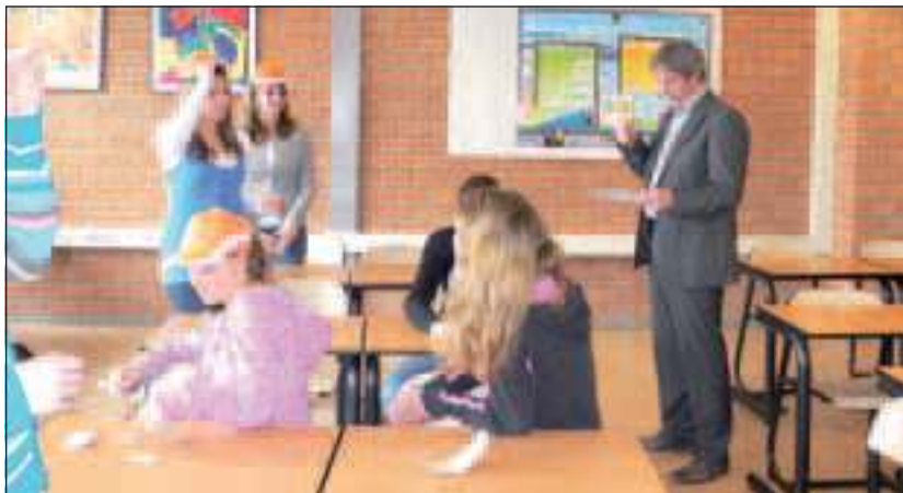
Leerlingen strijden voor de eer tijdens het vragenspel 'Petje op Petje af'.

per, docent economie van het Groenhorst College. Het is de bedoeling dat dit project ook volgend schooljaar weer zal plaatsvinden. Dit project is gecoördineerd door Samen voor De Bilt, www.samenvoordebilt.nl .