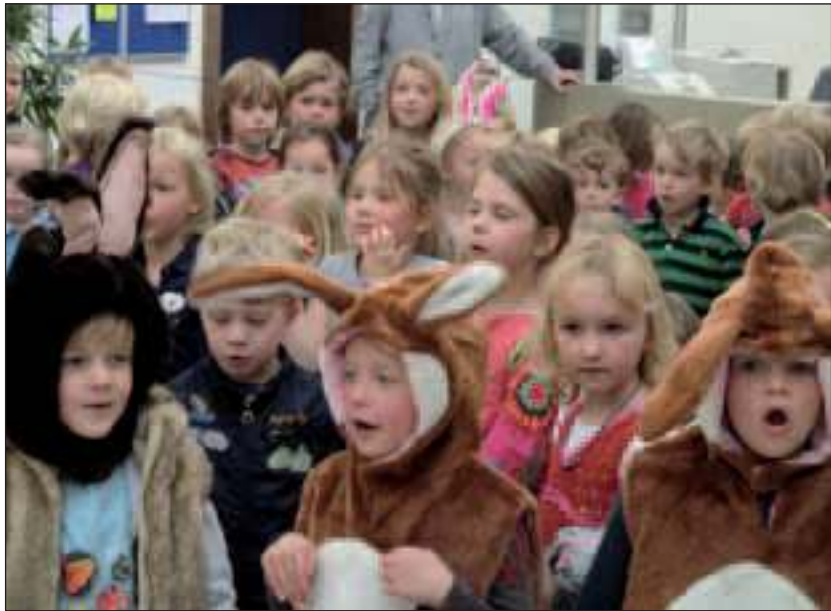
Van Dijksschool kleuters bezorgden bewoners van Huize het Oosten een gezellige ochtend.

Deze week bezochten de kleuters van de Van Dijksschool Huize het Oosten. De kinderen boden alle bewoners een mooie zelf versierde palmpas stok aan. Daarna gingen ze gezamenlijk knutselen en werden er paaskleurplaten ingekleurd. De bewoners genoten van de interactie en de gezellige gesprekjes met de kinderen.