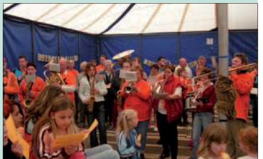
De aubade op Koninginnedag 2005.

Het inschrijven voor de optocht is aan de vooravond van Koninginnedag, dus op 29 april, in de feesttent van 17.30 tot 18.30 uur. Dit kan niet meer op 30 april bij het opstelpunt langs de Nedereindsevaart. Op deze manier hoopt de Oranjevereniging de wachttijd op de Koninginnedag zelf te bekorten.