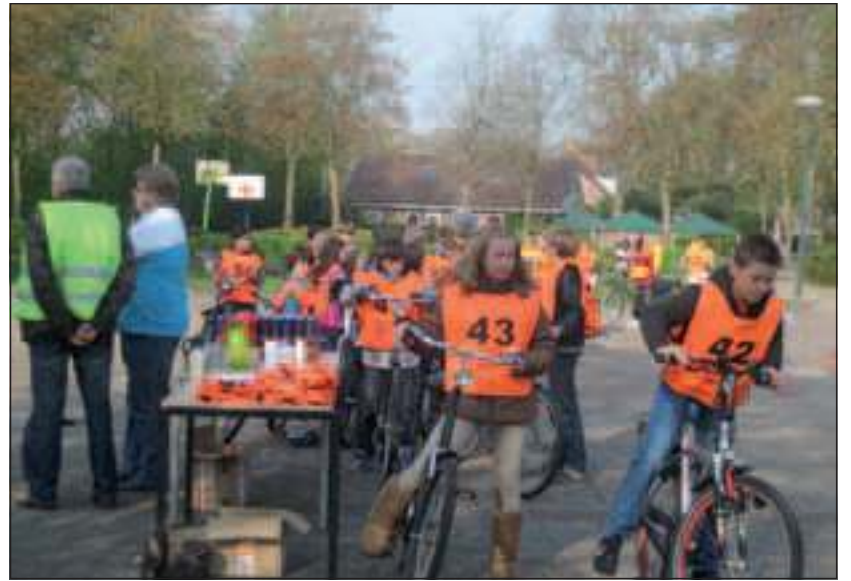
Start op het schoolplein van het scholencomplex aan de Nachtegaallaan te Maartensdijk.

De leerlingen waren niet minder trots. Het resultaat mag er dan ook wezen,