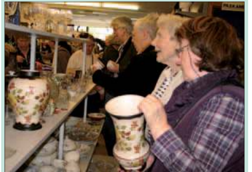
Het was druk tijdens de voorjaarsmarkt bij Emmaüs.