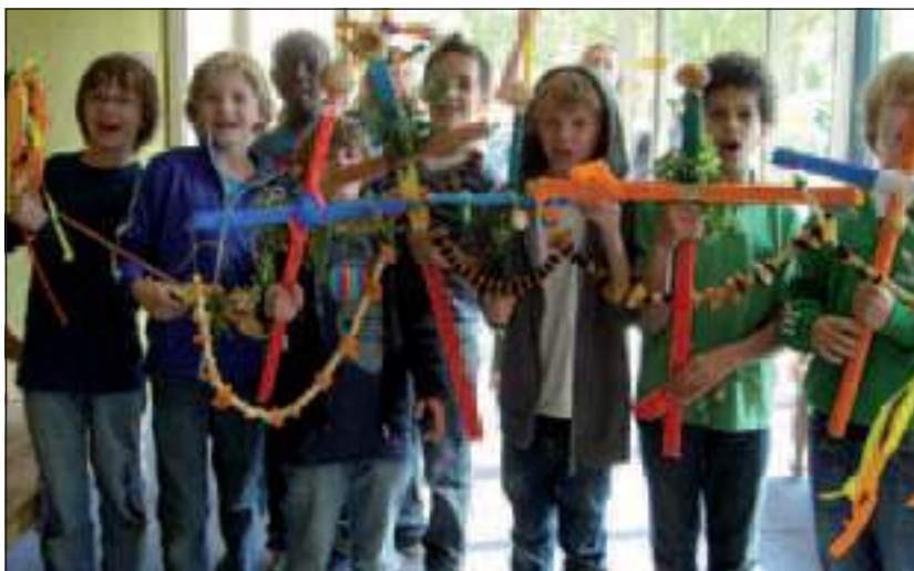
Tientallen kinderen kwamen vrijdagmiddag hun zelfgemaakte Palmpaasstok aan ouderen in De Bremhorst overhandigen.