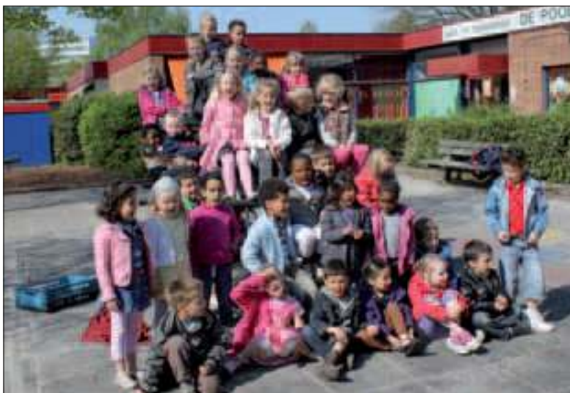
Leerlingen van basisschool de Poolster oefenden afgelopen maandag naar hartelust vanwege het mooie weer buiten op het klimrek.

De leerkrachten van de deelnemende groepen kregen in de afgelopen periode twee teamtrainingen en persoonlijke coaching van Louise Janssen, zang- en dwarsfluitdocent van de