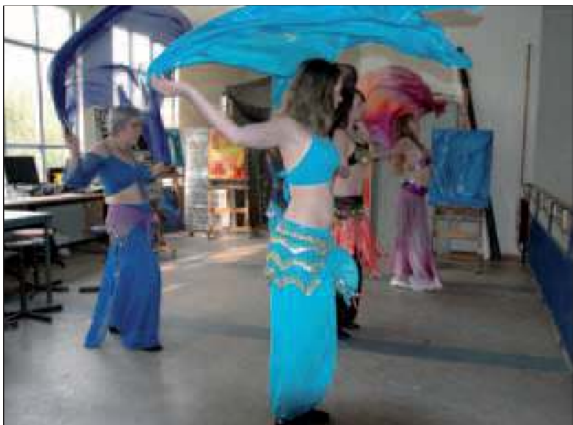
Buikdansen is een geschikte dansstijl en een goede vorm van lichaamsbeweging voor mensen van alle leeftijden, slank of wat meer gevuld.

Wie meer informatie wil, kan een mail sturen naar info@werkschuit.nl of bellen met 030-6958393. [LvD]