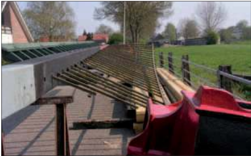
Ook de wieken worden in oude luister hersteld.

Wilten heeft een bijzondere band met 'De Kraai'. Na zijn MTS opleiding was zijn eerste klus het vervangen