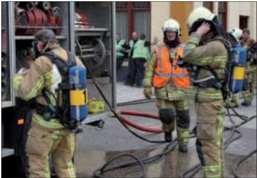
Een pand aan de dokter Welferweg in Westbroek was uitgekozen als oefenlocatie voor de provinciale brandweerwedstrijden.

Daar zal ook een Maartensdijkse (brandweer-)ploeg bij zijn. Bij eerdere selectiewedstrijden (2 april in Kockengen) werden de Maartensdijkers derde, waardoor ook zij zich kwalificeerden.