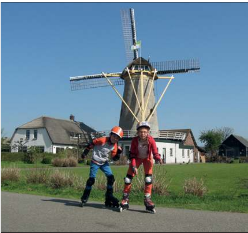
Twee jeugdige skeelertiefhebbers bij de molen betrappt tijdens een undercover trainingstocht.

Woensdag 5 juni organiseert de Stichting Molen Geesina een skeelertocht voor de groepen 6, 7 en 8 van de Nijepoortschool uit Groenekan. De tocht staat onder leiding van Andries Klaarenbeek (een lokale crack op mountainbike, skeelers en schaats, 3x elfstedentocht!) en heeft een tweeledige doel: sportief bewegen stimuleren én de kiem planten van het 'molengevoel'. De tocht start om 11.00 uur vanaf molen Geesina en beslaat maximaal 10 rondes (=15 km) door het Noorderpark. Om het helemaal echt te maken staan er op de route ook twee stempelposten. Het moet overigens vooral een gezellige tocht worden, meedoen is bij deze tocht belangrijker dan het aantal rondes dat de deelnemers afleggen. Start- en eindpunt (om een uur of 12.00 uur) is de molen waar na afloop de in Groenekan wereldberoemde overheerlijke pannenkoeken van Truus Bos en kraten vol frisdrank de vermoeide skeelers wachten. [FK]