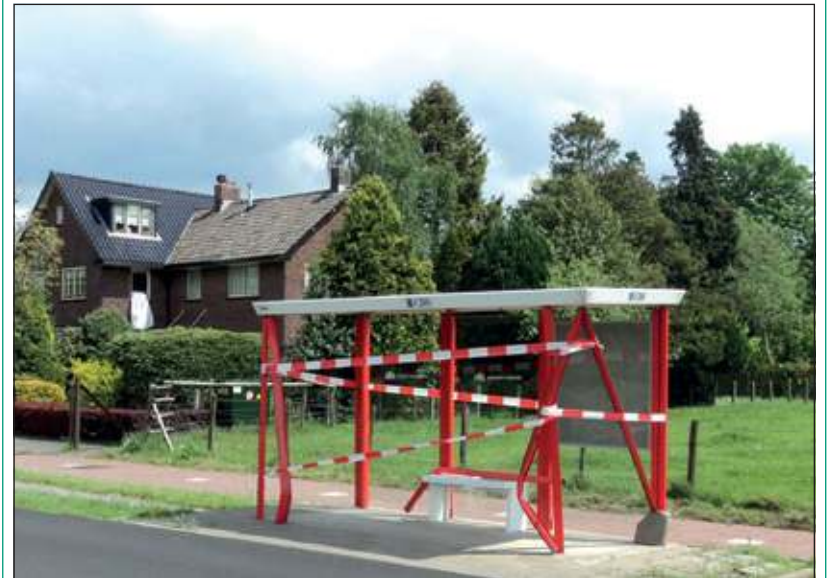
De abri werd totaal uit de grond gerukt en hoewel op kromme poten, daarna terug geplaatst. Er is nog niet vastgesteld of het huisje wordt gerepareerd of dat er een nieuwe geplaatst zal worden.

Vorige week vrijdagochtend rond 11.30 uur reed een Maartensdijkse automobilist op de Tolakkerweg in Hollandsche Rading richting Maartensdijk en raakte, rijdend achter een vrachtwagen, bij een inhaalpoging in de problemen. Bij het uitwijken naar het rijwielpad naast de rijweg werd het daar onlangs geplaatste wachthuisje ter hoogte van Groenrijk geramd. Het personeel van Groenrijk aan de overkant stond toevallig buiten en was getuige. De chauffeur is voor verhoor meegenomen naar bureau De Bilt. (KP)