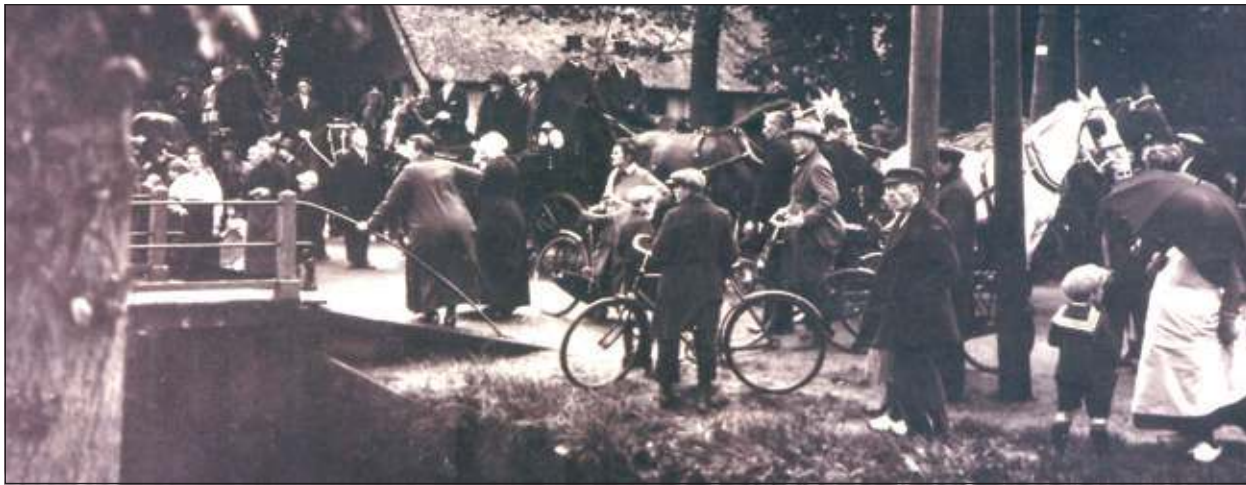
Heel Groenekan is uitgelopen bij het 25-jarig jubileum van de burgemeester.