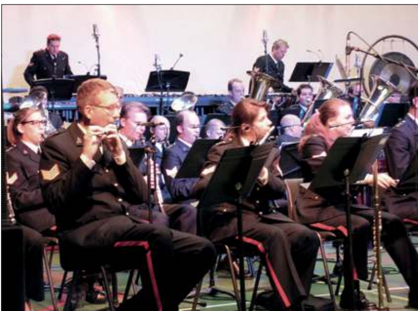
De Marinierskapel van de Koninklijke Marine.

De bezoekers genoten volop. Zo werd het concert, georganiseerd door de Stichting Zomerconcerten De Bilt een groot succes dat goed paste in de viering van 900 jaar De Bilt. Bij de uitgang van de hal vonden de bezoekers een tuba met de uitnodiging hier een vrijwillige bijdrage in te doen. Alleen op die manier kunnen ook volgend jaar deze bijzondere concerten doorgang vinden. De schatkist van de organisatie is op dit moment leeg. De sponsors hebben tot nu toe steeds bijgesprongen maar ook zij moeten keuzes maken. Het volgende concert in het kader van de zomerconcerten vindt overigens plaats op 9 juni. Dan met Gipsy Jazz Indifference en de percussiegroep van de Koninklijke Biltse Harmonie. En als alles dan mee zit weer in de open lucht op Beerschoten.