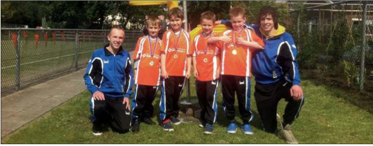
Het F1 team behaalde met een 6-0 zege op TZ hun eerste kampioenschap.

Na het kampioenschap vorige week van DOS 4, was het deze zaterdag een echte kampioenendag bij DOS. Het hoogtepunt was hierbij het kampioenschap van DOS 1. Hiernaast waren er in de ochtend titels voor de allerjongsten.