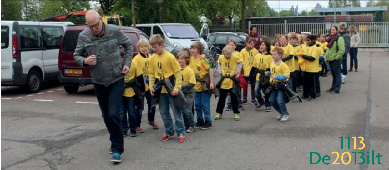
De meester van de Kievitschool neemt bij zijn groep het voortouw.

In de zes kernen liepen van elke basisschool vorige week 30 kinderen uit de groepen 6 in de eigen kern een estafetteploeg: de '900 METER LOOP 900 jaar DE BILT'. Er werd gebruik gemaakt van eerstejaars sportacademiestudenten, die ervoor zorgden dat alles in goede banen wordt geleid, uiteraard onder verantwoordelijkheid en leiding van de vakleerkrachten gymnastiek en de leerkrachten van de scholen.