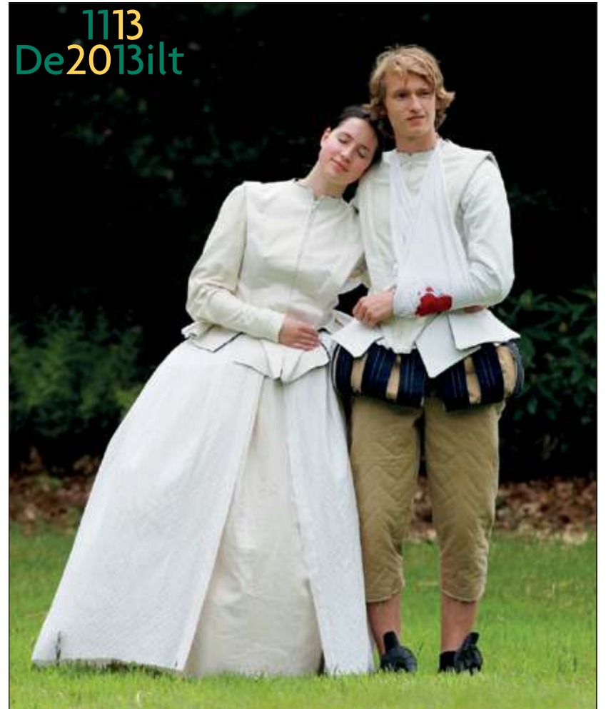
De jeugdige spelers zijn onder de indruk van de prachtige kostuums die speciaal voor deze productie zijn gemaakt..

Kaarten voor de voorstelling zijn te koop bij boekhandels in Maartensdijk (Primera), De Bilt (Bouwman) en Bilthoven (de Bilthovense Boekhandel), bij Vakhandel van der Neut in Groenekan en via website www.Theaterinhetgroen.nl