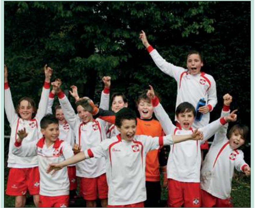
Met slechts één gelijkspel en zonder nederlaag is De Bilt E4 de trotse kampioen.