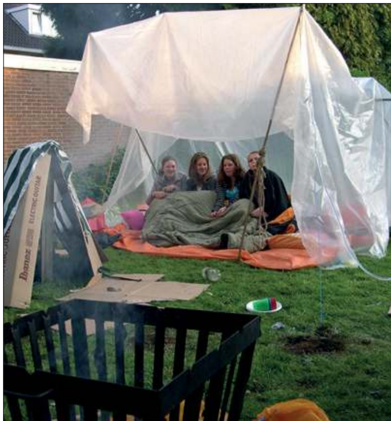
Vorig jaar overnachtte de jeugd ook al een keer buiten.