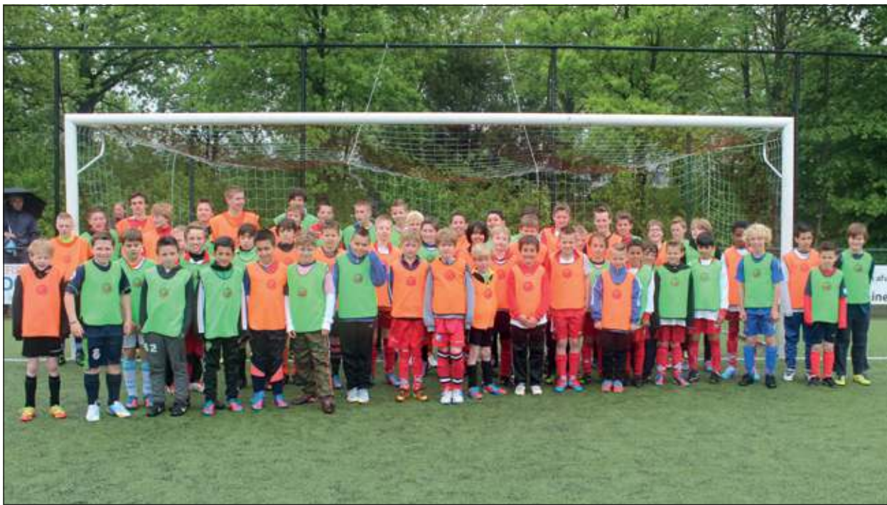
In vier leeftijdscategorieën, van F-pupillen tot C-junioren, werd anderhalf uur lang fanatiek gedribbeld, geschoten en gescoord.

De Open Talentendag die FC de Bilt in samenwerking met FC Utrecht op dinsdag 21 mei organiseerde is een groot succes geworden. Ondanks