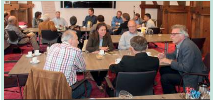
Er werden werkgroepen gevormd die direct in overleg gingen.

De deelnemers bespraken naast organisatorische zaken zoals het opstellen van een werkplan en de ledenwerving ook meer inhoudelijke thema's, zoals de opwekking van zonne-energie, de warmte-isolatie van woningen en gebouwen en de voorlichting over energiebesparing. Rond deze thema's zijn werkgroepen gevormd die de komende weken een concreet plan gaan opstellen. Deze plannen worden direct na de zomerperiode voorgelegd aan de eerste algemene ledenvergadering van de coöperatie. Wie op de hoogte wil blijven van alle plannen, kan zich nu al aanmelden via de website www.ldec-debilt.nl [HvdB]