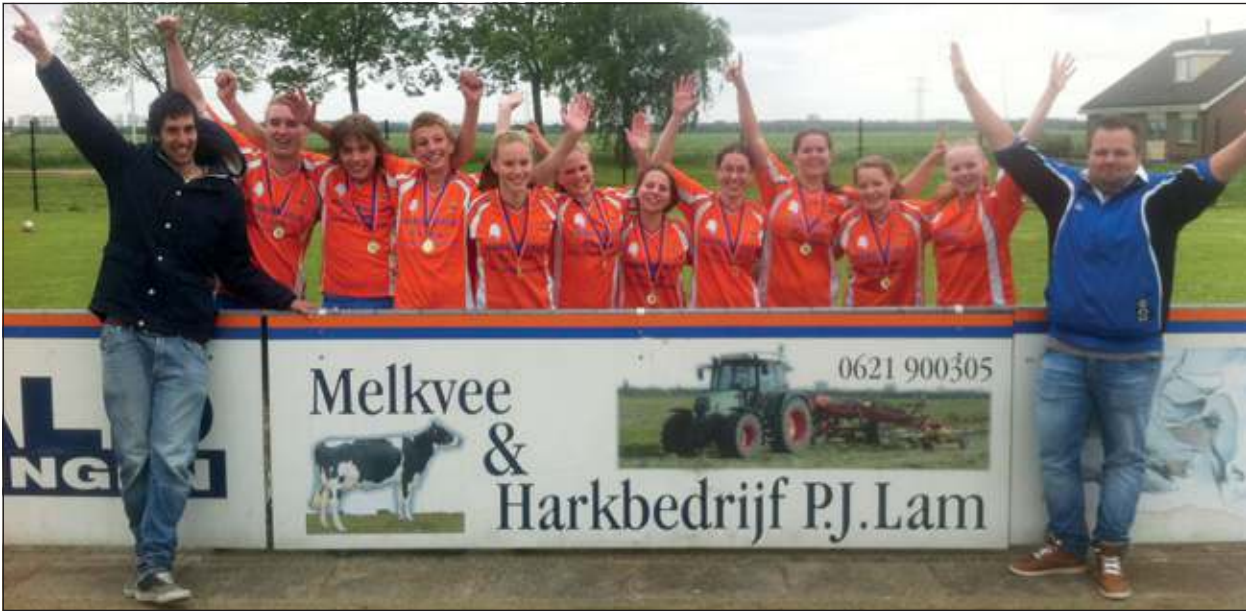
Aan het einde van deze succesvolle dag was de laatste wedstrijd voor de A2. Ook zij wonnen hun wedstrijd ruim met 11-2 van tegenstander TZ.