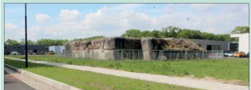
De bunker op Larenstein wordt geïsoleerd met een laag gewapend beton en rubber.

Het college neemt de aanbevelingen van het onderzoeksbureau over. Voordat het autobedrijf gaat bouwen, wordt de bunker op de aanbevolen wijze geïsoleerd. De werkzaamheden voor het isoleren van de bunker zullen worden ondergebracht bij de bouwer van het garagebedrijf. Dat betekent dat deze een aanvraag omgevingsvergunning zal indienen voor zowel het isoleren van de bunker als voor het bouwen van de nieuwe bedrijfslocatie, zodat alles in één hand en zonder onnodige vertraging kan worden uitgevoerd.