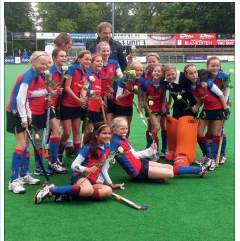
Meisjes D2 van hockeyclub SCHC in Bilthoven is zaterdag 18 mei een echte kampioen gebleken: in een zinderende wedstrijd tegen de nummer 2 uit de poule, Weesp D1, wisten deze dames uiteindelijk met 3-1 te winnen van hun directe concurrent. Er is nog 1 wedstrijd te gaan dit seizoen, maar de kampioenstitel van de 1e klasse D kan hen niet meer ontnomen worden.