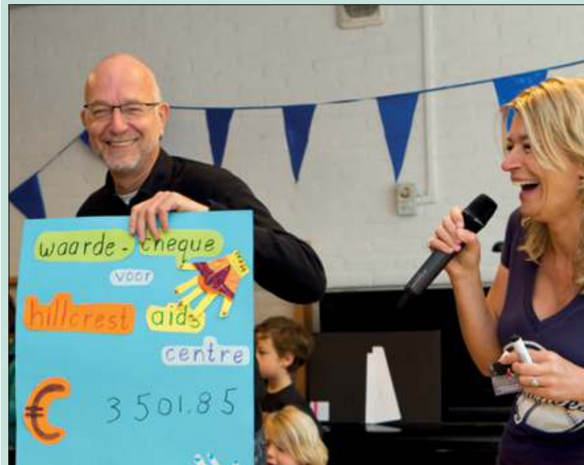
Alom blijdschap met een prachtige opbrengst van de sponsorloop.

Als dank kregen alle kinderen een speldje met de vlag van Zuid-Afrika, gemaakt door de 'grannies' die de zware taak hebben te zorgen voor de opvoeding van hun kleinkinderen waarvan de ouders overleden zijn aan Aids.