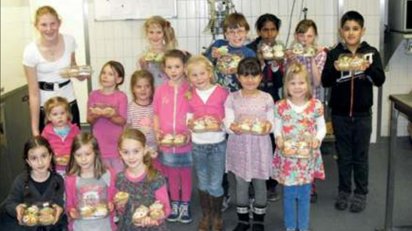
Na de uitleg gingen alle kinderen enthousiast aan de gang en hebben ze de mooiste cupcakes gemaakt.