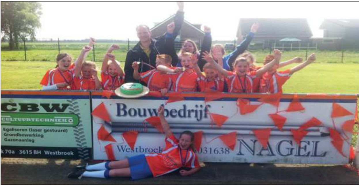
Later voegde de D1 zich hierbij. Zij wonnen hun laatste wedstrijd met 7-0 tegen Ter Leede.