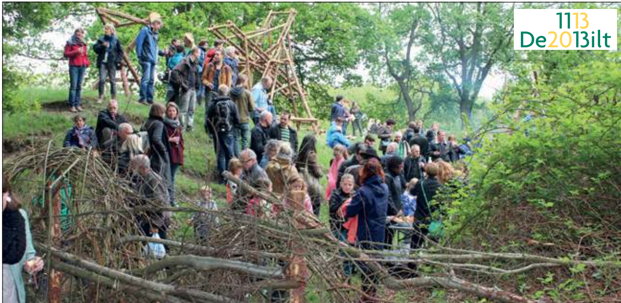
Homeworks is een ode aan het 'alles zelf maken'. Met materialen als takken, boomstammen, modder, touw en leem bouwt men huizen, hutten, bruggen enz.

Van 26 mei tot en met 14 juli 2013 is op Fort Ruigenhoek in Groenekan avontuurlijke kunst te zien speciaal gemaakt voor kinderen. Kaap wordt dit jaar voor de 8e keer georganiseerd. Kaap is speels, absurd, direct, verrassend en interactief.