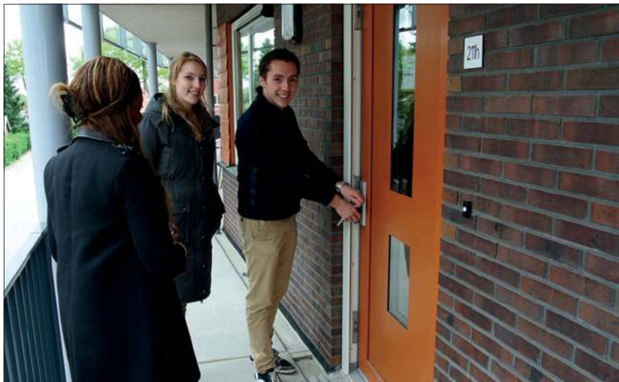
De nieuwe bewoners zijn dolgelukkig met hun nieuwe huis.

Het oude gemeentehuis werd al eerder als kantoorruimte in gebruik genomen. Het nieuwbouwweddele van het voormalige gemeentehuis is verbouwd tot medisch centrum. Het geheel is ontwikkeld door een vastgoedontwikkelaar samen met Woonstichting SSW.