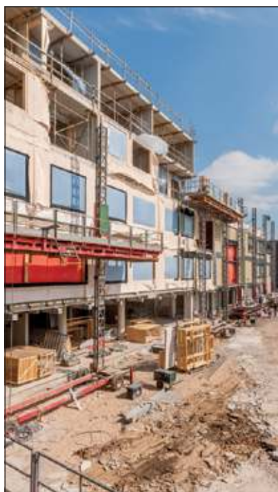
Op de Dag van de Bouw kunt u de bouwplaats op.

In Het Lichtruim komen basisschool Wereldwijs, kinderdagverblijf De Steenuiltjes en buitenschoolse op-