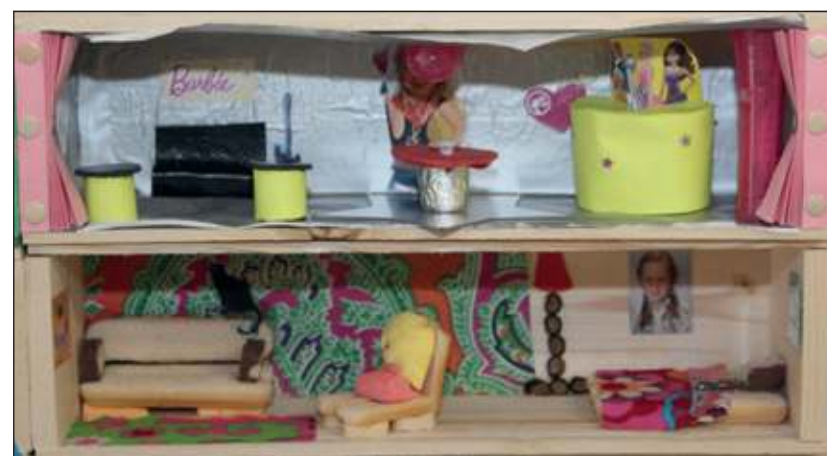
De overige kunstkastjes zijn op Fort Ruigenhoek te zien.