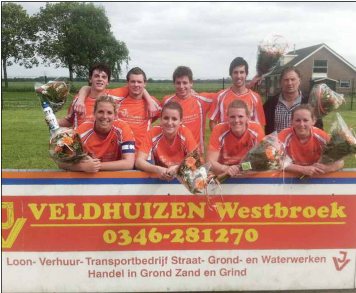
De beide shirtsponsors, Loonbedrijf J. Veldhuizen en Easydek hadden als start van het feest een heerlijke barbecue voor spelers, begeleiders en reserves geregeld.

Na de titel in de zaalcompetitie, heeft DOS afgelopen zaterdag ook het kampioenschap op het veld behaald. Een geweldige prestatie zodat volgend seizoen ook op het veld in de 2e klasse wordt gespeeld.