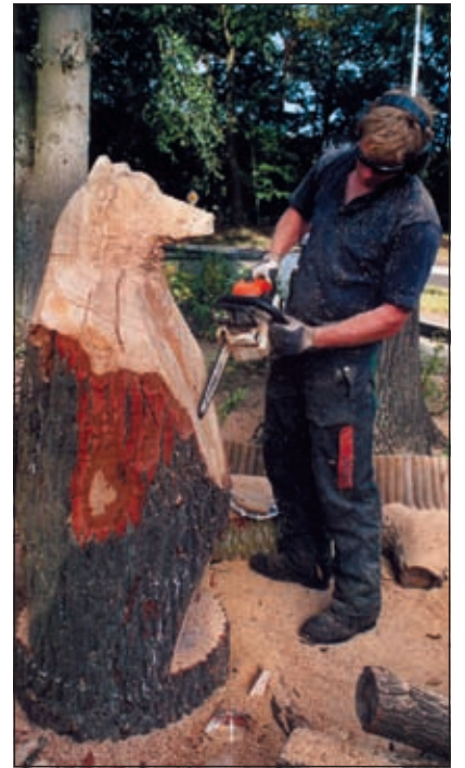
De beer langs de rotonde bij Loosdrecht is een creatie van de David Harmsworth.

Tijdens het jaarlijks Houthakkersfeest in augustus in Lage Vuursche wordt gestreden om het Nederlands kampioenschap Sculptuurzagen, waar de deelnemers van kwart voor tien 's ochtends tot vijf uur 's middags de gelegenheid krijgen twee kunstwerken te maken, die dan beoordeeld worden door zowel een vak- als een publieksjury. D.m.v. een loting krijgt iedere deelnemer 2 stamstukken toegewezen. Voor 1 stamstuk krijgen de deelnemers enkele uren de tijd om er een prachtig kunstwerk van te maken,