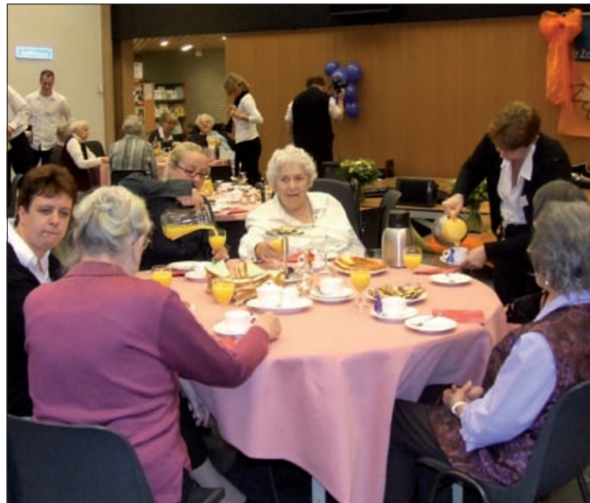
De High Tea werd vorig jaar zeer gewaardeerd.

Met gasten van De Zonnebloem wordt een bezoek gebracht aan de kerstmarkt in Leusden. Kinderen van de Julianaschool gaan op maatschappelijke stage bij De Koperwiek in Bilthoven. Ze gaan daar voor de bewoners bloemstukjes maken, een lunch klaarmaken en petit fours bakken. Op zorgboerderij Nieuw Bureveld gaan de ambtenaren met cliënten klussen. Met cliënten van zorginstatie Reinaerde gaan ze buurtboerderij