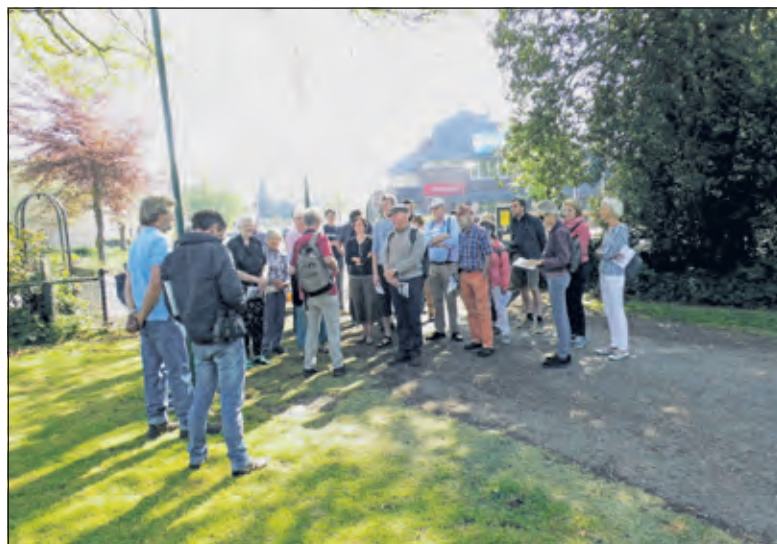
Ruim belangstelling voor de paaswandeling in het park.