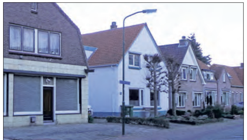
Alle winkels zijn er nu verdwenen. Winkelcentrum Planetenbaan en de Hesenweg hebben deze rol overgenomen. (foto Hist. Kring 'dOudeSchool).