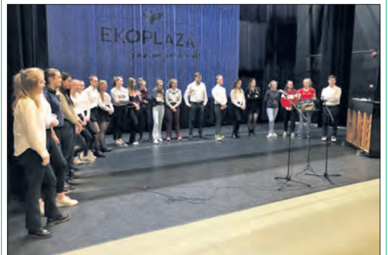
Leerlingen van 5 VWO zetten zich in voor een goed doel.