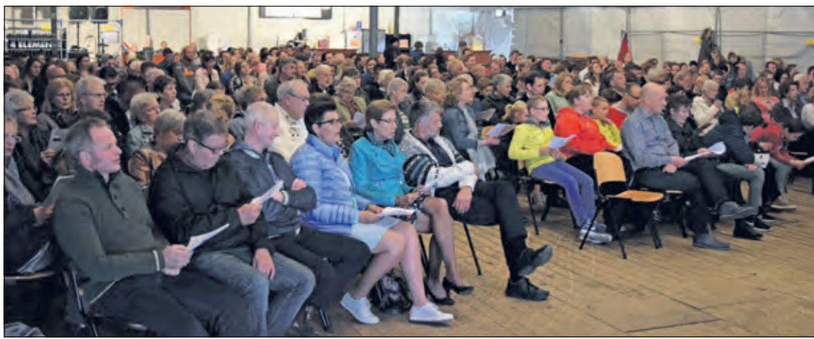
Het eerste jaar trok de tentdienst al veel belangstellenden.

De tentdienst vindt plaats op zondag 28 april van 14.00 tot 15.00 uur, op het terrein bij de molen. De tent gaat open vanaf 13.45 uur.