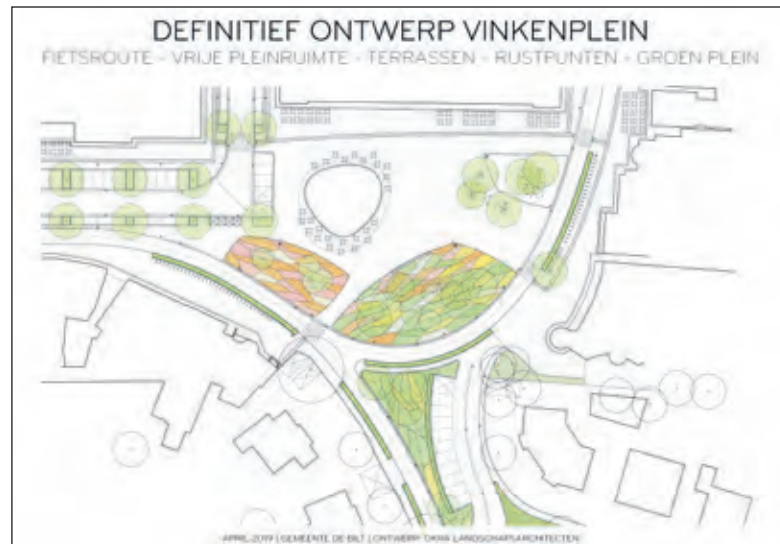
Definitief ontwerp Vinkenplein.