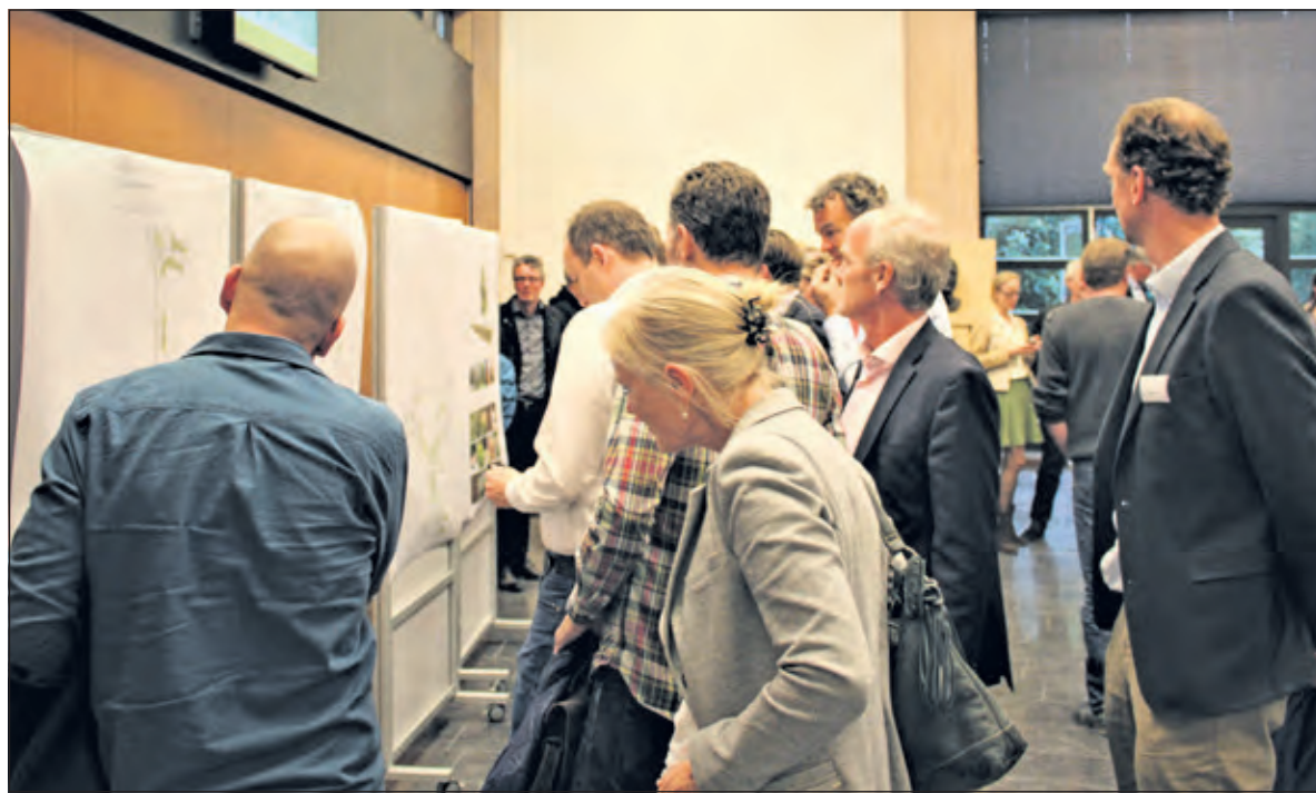
Veel belangstelling voor de uitgewerkte plaatjes.