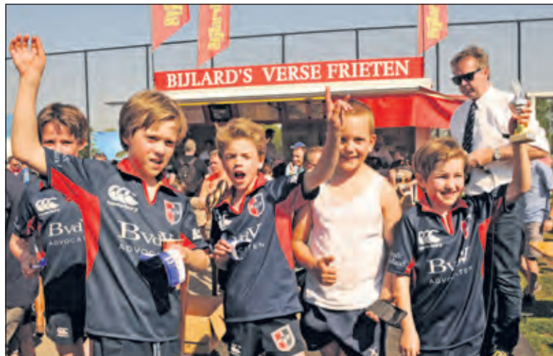
Het U10 team wint de Bowl finale en neemt de trofee in ontvangst.

De derde en beslissende wedstrijd tegen 't Gooi uit Naarden was bepalend, wel of geen finalewedstrijd. Dat was het moment waarop de Wolven hun ware identiteit lieten zien. Met snelle aanvallen, goede tackels en scherpe passes naar teamgenoten wisten ze de winst naar zich toe te trekken. Rugby wedstrijden eindigen altijd met 3 finales waarin de beste teams voor de winst in elke groep spelen. Stichtsche mocht de Bowl finale spelen tegen een Nederlands team,