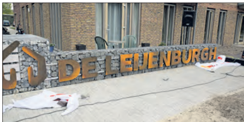
De nieuwe naam van het complex.

Bouwbedrijf De Vries en Verburg realiseerde het appartementencomplex in opdracht van Woonstichting SSW. Alle 99 appartementen zijn geschikt voor zorg, ook voor oudere bewoners. De woningen, met een oppervlakte van 60-90 vierkante meter, zijn duurzaam, zonder gas, want deze worden verwarmd