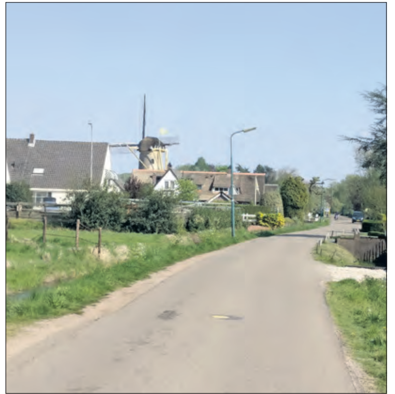
De Ruigenhoeksedijk ligt in een recreatiegebied.

Tussen gemeente De Bilt en de bewoners van de Ruigenhoeksedijk vonden in het verleden meerdere gesprekken plaats. Deze gesprekken leidden tot snelheidsmetingen en de dijk werd 'afgesloten' tegen sluipverkeer, tijdens spitsuren. Helaas houdt niemand zich hieraan en wordt niet gehandhaafd door de gemeente. Uit contacten met De Bilt bleek dat zij het verkeersprobleem op de Ruigenhoeksedijk erkennen. Van den Elsen: 'Na het laatste on-