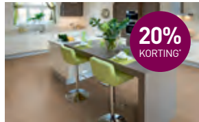
20% korting* op Decorette collectie laminaat, PVC, vinyl en vloerkleden

Bekijk ons gehele assortiment op Decorette.nl