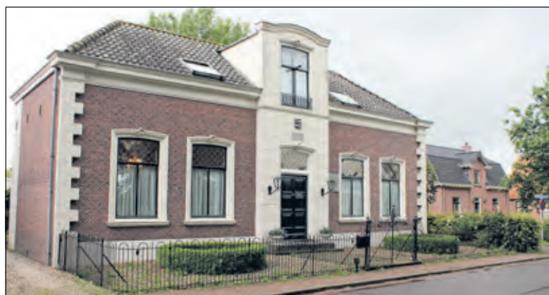
Het voormalig gemeentehuis van Westbroek stond destijds tussen het oude doktershuis en het armenhuis. Omstreeks 1939 is het doktershuis afgebroken en is er een nieuwe woning gebouwd voor het hoofd van de plaatselijke school. Het voormalige gemeentehuis was enkele decennia tot 1993 het hoofdkwartier van Harlekijn Holland, het bedrijf van, voor en achter Herman van Veen.