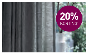
20% korting* op collectie Your Edition gordijnstoffen

KORTING* OP DECORETTE COLLECTIE DUPLI- EN PLISSÉGORDIJNEN EN BNWALLCOVERINGS* BEHANG