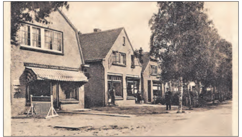
In 1924 kon je rustig lopend voor de dagelijkse boodschappen op de Oude Brandenburgerweg terecht

Met een foto van weleer, de camera van nu en tekst van overal ((dorps-)historici en eerdere publicaties) gaan we kriskras door de kernen van deze gemeente. [Henk van de Bunt]