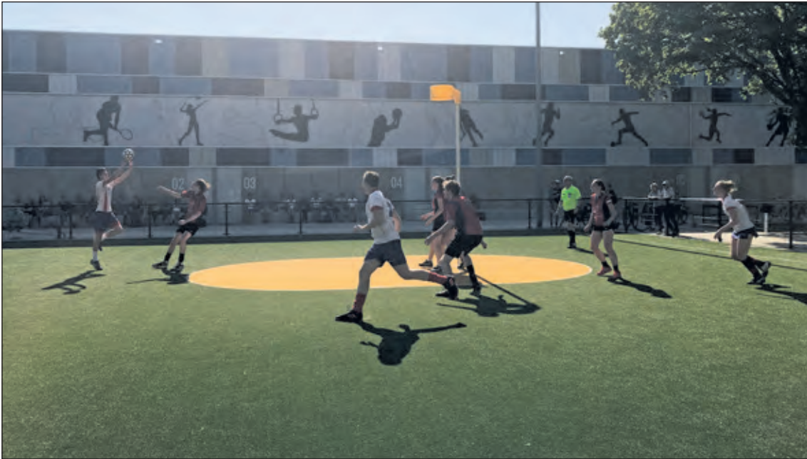
Nova bepaalt het spel tegen Synergo.

beetje in en liet zich meegaan in het spel van Synergo. Hier en daar kon Synergo profiteren van wat schoonheidsfoutjes in de verdediging van Nova en wist het gat deels in te lopen. Nova hield het hoofd koel en scoorde op de juiste momenten waardoor zij nooit in gevaar zijn gekomen. De scheidsrechter floot de wedstrijd af met een 14-18 stand.