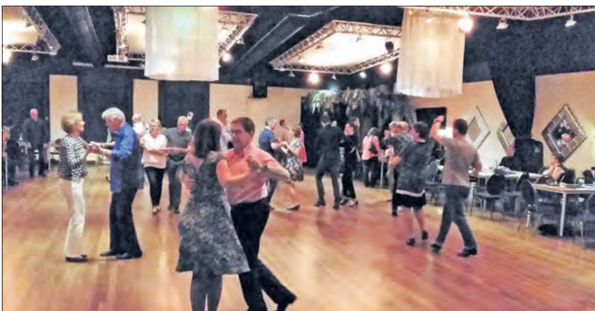
Uitgelaten stemming op de Danssalon in het H.F. Wittecentrum.

'Zij die dansen, worden voor gek verklaard door hen die de muziek niet horen', zei de Duitse filosoof Friedrich Nietzsche, toch niet bekend als zonnetje in huis en fameus 'doodverklaarder' van God (waarin hij trouwens volkomen ongelijk heeft gekregen), maar die kennelijk wel van een dansje hield.