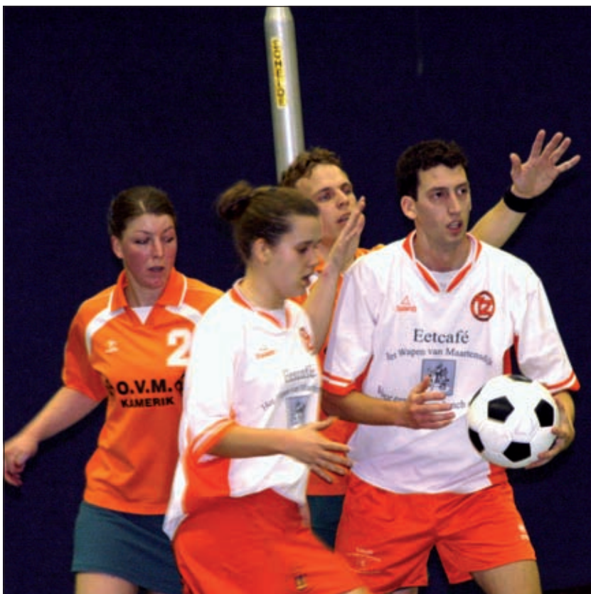
Koploper Tweemaal Zes produceerde in een korte periode vijf doelpunten op rij tegen het Kamerikse SDO.

Runner-up Oranje Wit maakte geen misstap en won van VEO. Hierdoor blijft de ploeg uit Dordrecht volgen op vier punten. Volgende week kan Tweemaal Zes in Gorinchem de volgende grote stap zetten richting de hoofdklasse tegen GKV. De steun van de supporters zal daarbij wederom hard nodig zijn! Deze uitwedstrijd begint om 17.40 uur.