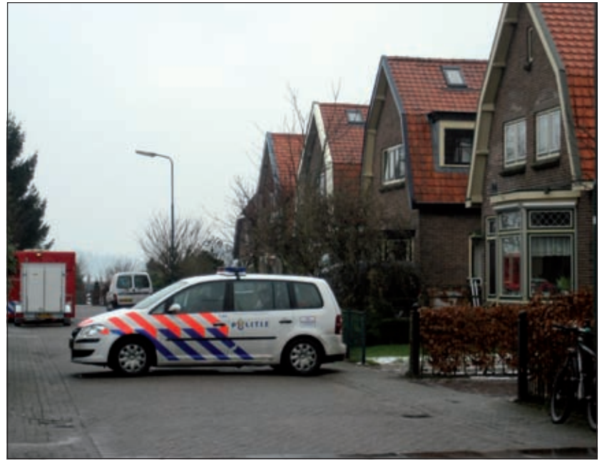
Donderdag 5 februari jl. was een gedeelte van de Tuinlaan te Maartensdijk afgesloten voor niet-aanwonenden in verband met sporenonderzoek. [foto Annemieke van Zanten]

Denkbaar is ook dat vroeger misbruikte jongeren een rekening wilden vereffenen, terwijl ook zelfmoord nog niet is uitgesloten. Voor de recherche