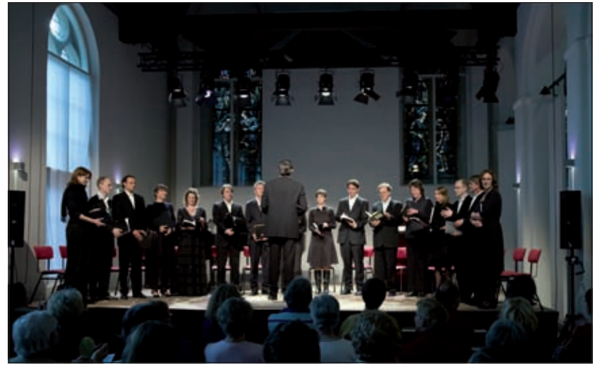
De uitvoering van de 'Petite Messe Solennelle' zoals die plaats vond in Leeuwenbergh in mei 2008. (foto: Paul Ruks).

allerlei Groenekanse evenementen. Zo waren ze vorig jaar te zien en te horen in de uitvoering van Shakespeare's Midsummer Night's Dream wat met veel succes werd uitgevoerd in Fort Ruigenhoek.