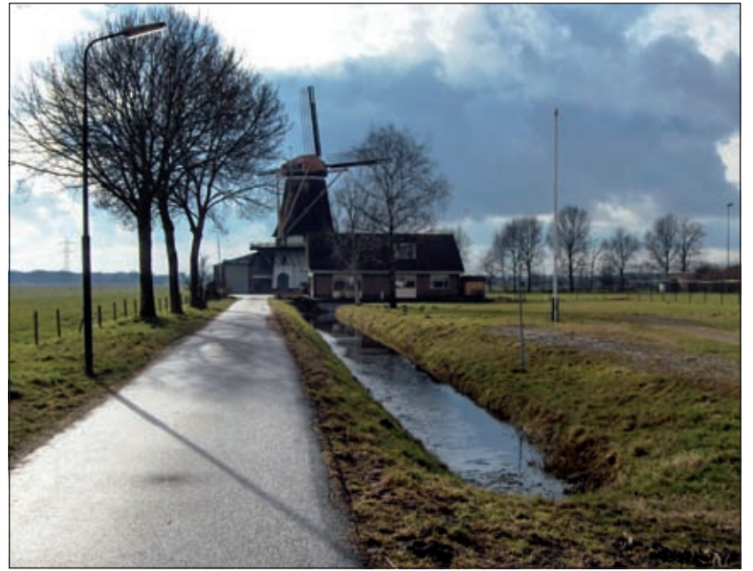
Gefilosofeerd werd bijvoorbeeld over de vraag of er in 2020 in de omgeving van een monument als Molen de Kraai een hotel of woningbouw zou moeten zijn gerealiseerd.

In Westbroek speelt een aantal onderwerpen die om een besluit van de gemeente vragen. Op dit moment is bijvoorbeeld de vraag naar woningbouw nadrukkelijk aanwezig. Daarnaast is het Dorps huis toe aan onder-