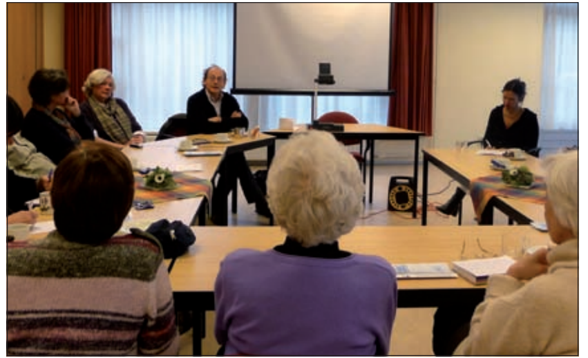
Dertien mensen waren aanwezig op de door het Steunpunt Mantelzorg De Bilt georganiseerde informatieochtend over het PersoonsGebonden Budget (PGB).

Hulp, zorg of begeleiding kan via een thuiszorginstelling verstrekt worden of via zelf gekozen zorgverleners via het geldbedrag dat ontvangen wordt bij een PersoonsGebonden Budget. Als hulp geboden wordt via een thuiszorginstelling heeft men geen eigen keuze wie de daadwerkelijke zorg levert en wanneer dat gebeurt. Met een PersoonsGebonden Budget kan men zelf kiezen wie er komt helpen en wanneer die persoon komt helpen. Het kan ook voorkomen dat men bijvoorbeeld een rolstoel met een motor wil maar dat die niet geïndiceerd is. Via zorg in natura kan dan alleen een gewone rolstoel geleverd worden. Als men een PersoonsGebonden Budget heeft kan met het verschil in bedrag