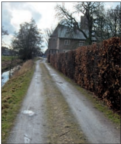
Er konden belangrijke aandachtspunten worden doorgeven, zoals het onderhoud van het toegangspad naar de begraafplaats'.