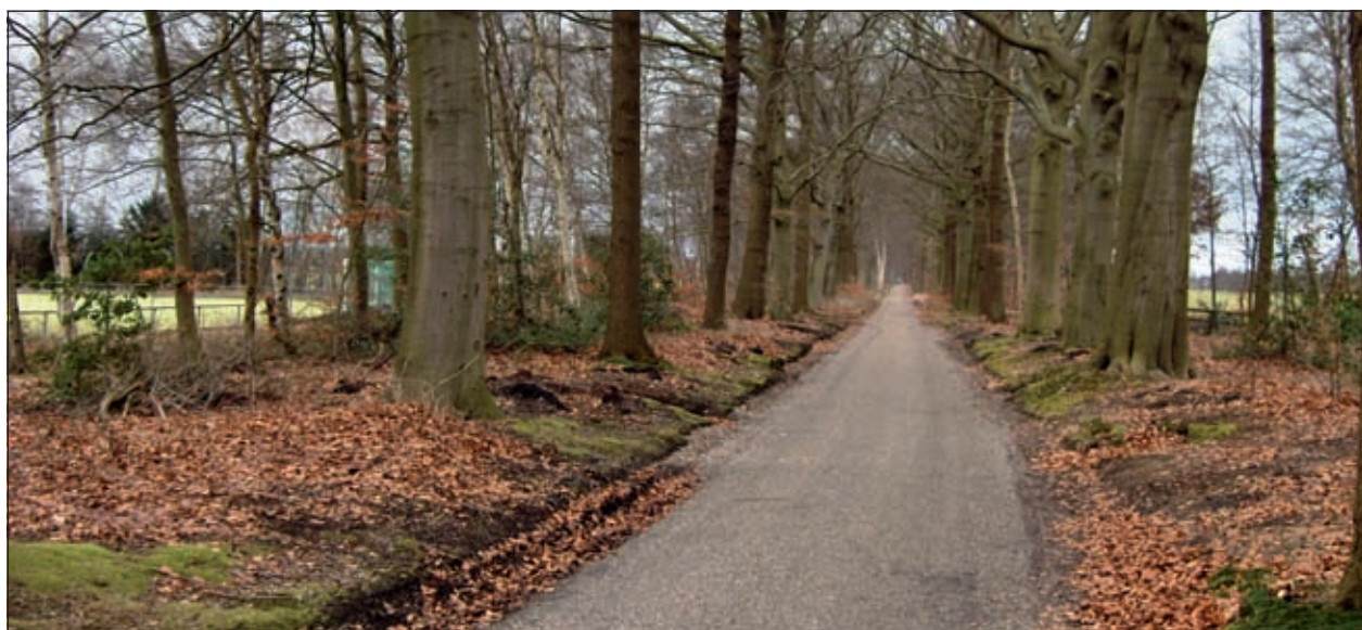
De vroegere Oostlaan van het Parkbos is nu het rijwielpad van de Bosvijver naar de Nieuwe Wetering. Hier zal de ondergroei onder de bomen langs het fietspad met twee meter aan beide zijden van het fietspad verwijderd worden, waardoor de strakke rechte laan in het polderlandschap weer terug komt.

Van de vele andere werkzaamheden kan nog genoemd worden een verder herstel van de waterhuishouding van het park. Dit door de geheel verdwenen sloot aan de westkant van het bos weer uit te graven. De werkzaamheden zullen 16 februari starten. Deze activiteiten moeten medio maart gestaakt worden want dan begint het broedseizoen.