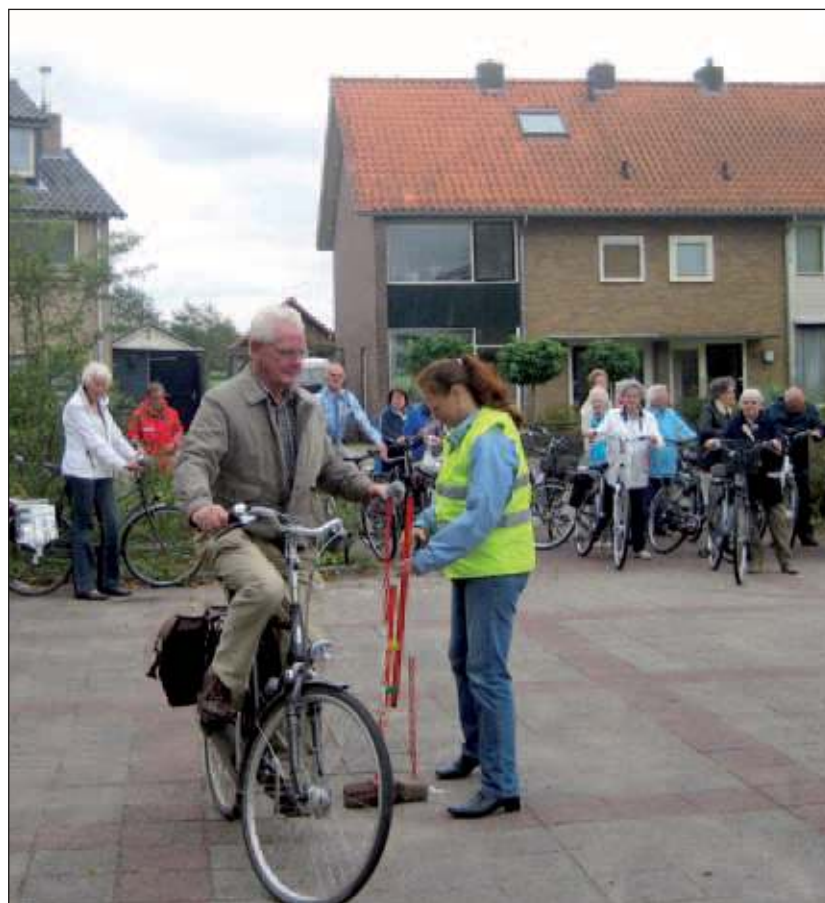
Het nemen van de eerste horde

Na terugkeer werden door politie en de beleidsmedewerker verkeer, allerlei plaatselijke verkeerssituaties doorgenomen en uitgelegd. Wethouder Diteweg had het laatste woord en het ziet er naar uit dat na de eerste keer meer van deze nuttige acties in de