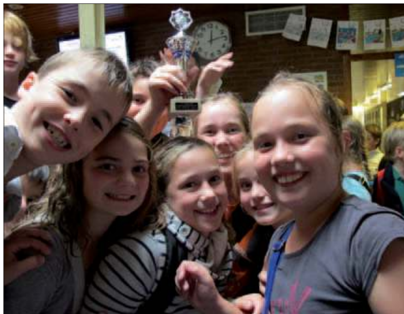
Leerlingen van de St Michaëlschool zijn blij en trots dat ze de eerste plaats hebben behaald.

Op 12 oktober doen leerlingen van de groepen zeven mee aan het Zwemfestijn van de Theresiaschool, de Montessorischool, de Julianaschool, De Nijepoort, de Jan Ligthart/Van Everdingenschool, de Rietakkerschool en de Rudolf Steiner.