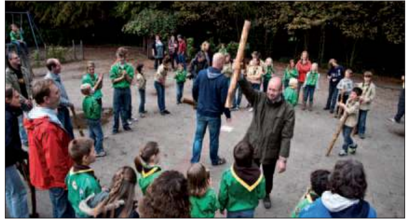
Scoutinggroep Ben Labre in De Bilt organiseerde afgelopen zaterdag een vader/zoon/moeder/dochter-dag.

De gemeenschappelijke lunch was voor veel ouders een goed moment om elkaar beter te leren kennen. Waarna de middag werd afgesloten met een spel levend Stratego. Het was geestig om te zien dat vooral veel vaders nog veel fanatieker op ‘oorlogspad’ gingen dan hun kinderen. Toch eindigde het spel onbeslist. Maar toen was het de tientallen ouders allang duidelijk: Scouting is leuk, ook als je geen Quasimodo heet!