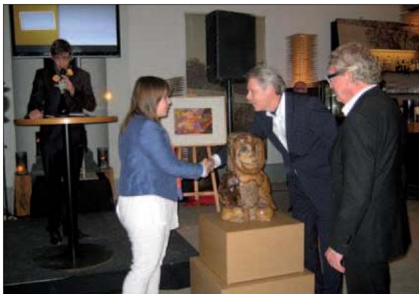
De tentoonstelling is, met het onthullen van de beelden, geopend op paleis Soestdijk.

Het paleis en de tentoonstelling zijn te bezoeken op alle vrijdagen, zaterdag en zondagen (behalve op zondag 16de) in oktober en op 17, 18, 19 en 20 oktober doordeweeks (herfstvakantie). Kaarten zijn uitsluitend te bestellen via het internet: www.paleissoestdijk.nl