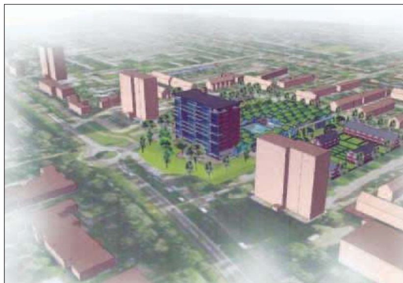
Een indicatieve schets vanaf de Biltse Rading, voorkomend in de Contourennota voor een nieuw Sport- en Zalencentrum De Bilt (febr. 2010).

Het gemeentebestuur schrijft de gemeenteraad in het mededelingenblad van 29 september jl. dat zij verwacht de klankbordgroep medio oktober