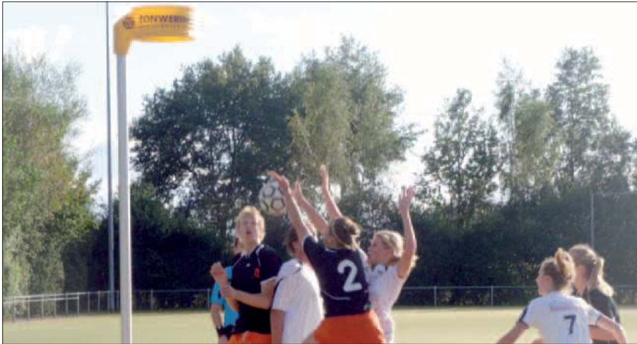
Het fenijn van TZ zat in de staart waardoor aansluiting bij de bovenste ploegen gehandhaafd blijft.

uit en hield de bal in de ploeg waardoor De Meeuwen niet meer gelijk wist te maken. Tweemaal Zes nam met deze overwinning verdiend de punten mee naar Maartensdijk. TZ 2 speelde eveneens tegen de reserves van De Meeuwen en verloor met 13-9. Volgende week speelt TZ voorlopig de laatste veldwedstrijd thuis tegen Vriendenschaar. Met een overwinning kan de ploeg zich aan de kop van de ranglijst nestelen. Daarna gaat de Maartensdijkse korfbaltrots zich voorbereiden op het zaalseizoen waar TZ uitkomt in de hoofdklasse.