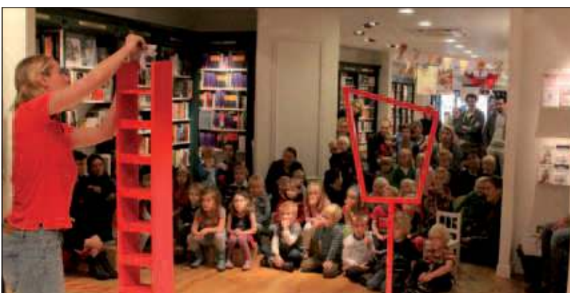
Kindertheater KOP OP speelde de voorstelling 'Muisstil' bij boekhandel Bouwman aan de Hessenweg in De Bilt.

ken niet alleen een begrijpelijke, maar ook een zeer geslaagde keus genoemd mag worden.