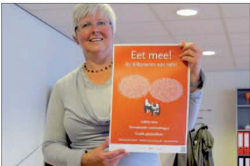
Foto: Kastein toont de poster Eet Mee! De Bilt, die al overal verspreid is.