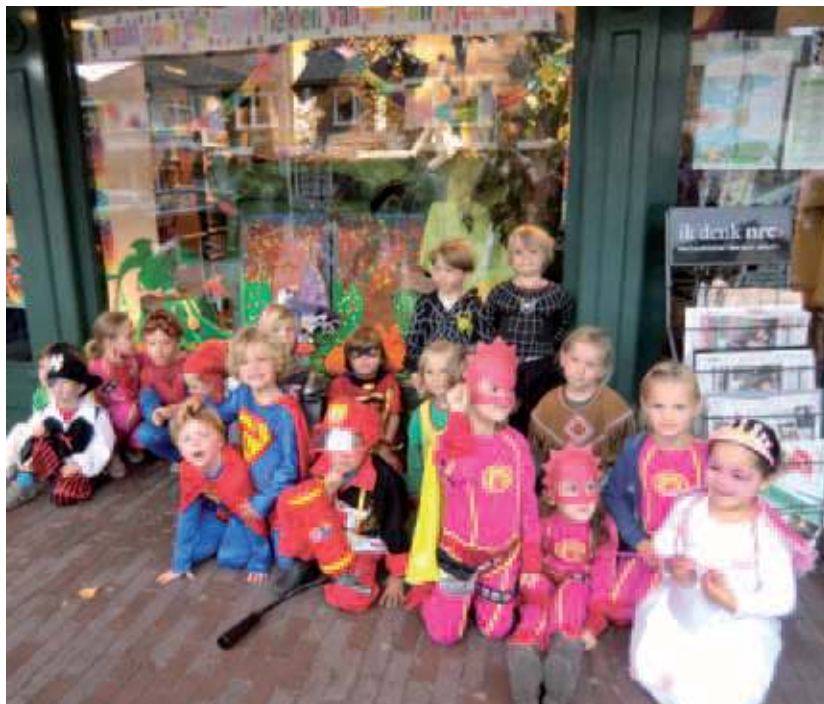
De Superhelden van de Van Dijkschool voor 'hun' etalage bij Bouwman Boeken.