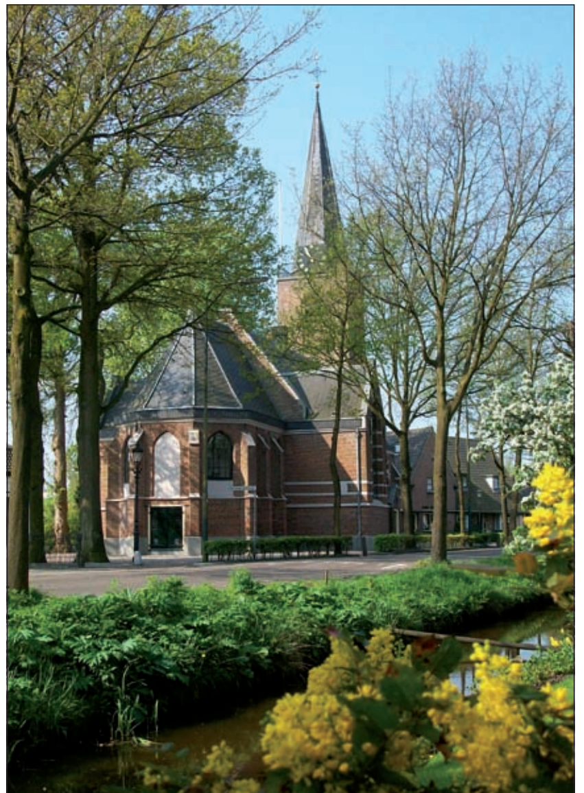
De Maartensdijkse Hervormde Kerk van Woudenberg behaalde met een foto van de Nederlands Hervormde kerk van Maartensdijk de tweede prijs van de gemeentelijke fotowedstrijd. De foto is binnenkort terug te vinden in de gemeentegids 2009-2010.

De Milieudienst is open op werkdagen van 8.30 tot 17.00 uur.