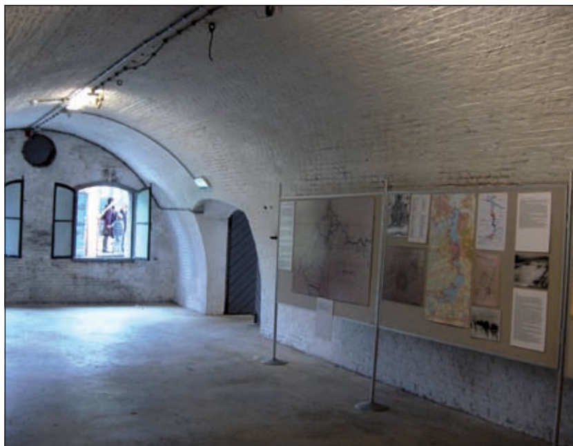
In fort Ruigenhoek is er ook op Open Monumenten Dag een interessante tentoonstelling over de geschiedenis van dit fort.

Deze indrukwekkende kerk met de schitterend gerestaureerde muurschilderingen (uit 1510) is vele malen beschreven in de brochures van Open Monumenten Dag. Behalve de muurschilderingen bevinden zich in de kerk: een houten koorhek, een eiken preekstoel met koperen lessenaar