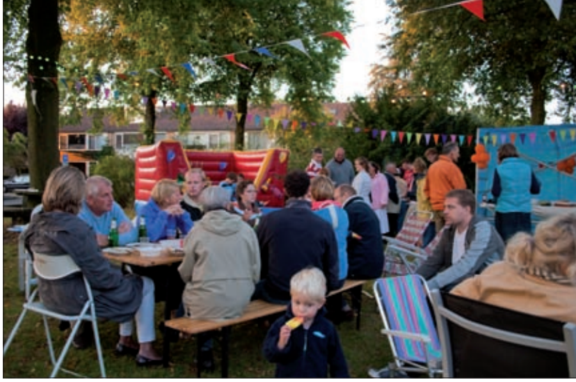
De buurtbewoners van het Alexanderplantsoen vertoefden tot laat in de zaterdagavond buiten.

Afgelopen zaterdag was het weer tijd voor de plantsoenbarbecue van het Prins Willem-Alexanderplantsoen in Maartensdijk. Deze barbecue, die gehouden wordt op het grasveld in het midden van het plantsoen, is sinds 1979 een om het jaar terugkerende traditie. Voor sommige bewoners van 'het plantsoen' was het dan ook al weer de 15e keer dat ze mee konden doen aan de barbecue. 'Dit jaar waren we even bang dat de barbecue geheel zou verregenen', aldus één van de organisatoren, 'want de avond daarvoor kwam het met bakken uit de hemel'. Gelukkig brak rond 15.00 uur de zon door en bleef het de gehele avond droog.