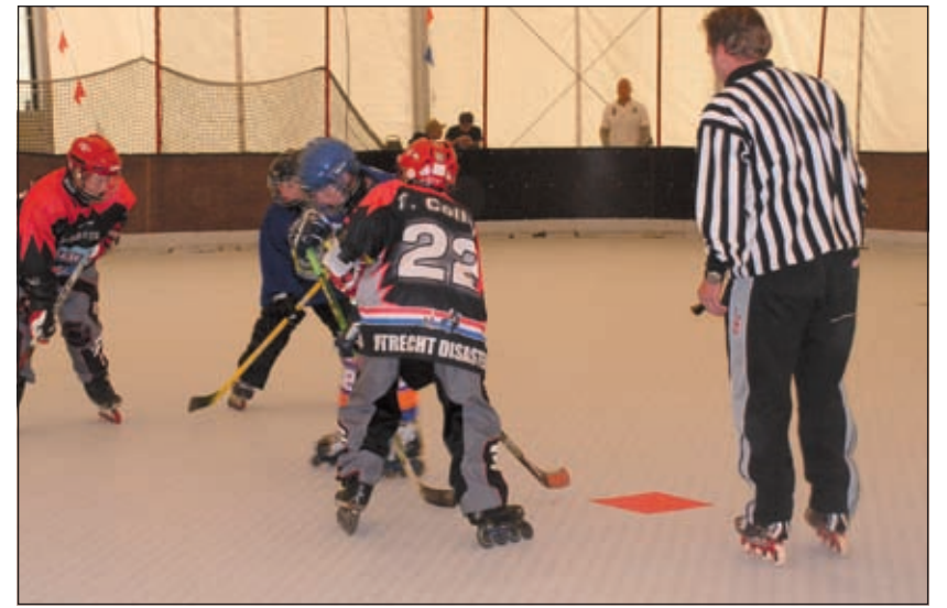
Beeld uit de wedstrijd Utrecht Disaster-Zoetermeer.

naar een hoger team en zal hij weer opnieuw beginnen met een gedeeltelijk nieuwe groep. Maar eerst zal het huidige team deelnemen aan de Europacupwedstrijden in Duitsland. Als het inline seizoen is afgelopen gaan verschillende spelertjes in oktober