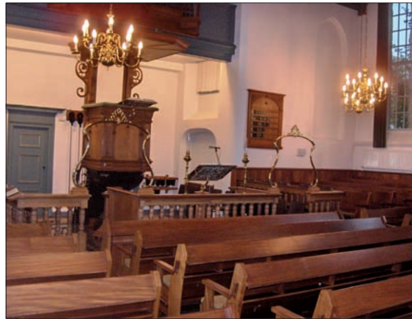
Het interieur van de Hervormde kruiskerk aan de Maartensdijkse Dorpsweg roept een 18e eeuwse sfeer op. Geelkoperen doopbogen bekronen de twee ingangen van de dooptuin, het liturgisch centrum van de kerk. Op het eikenhouten hek staat een aparte lessenaar voor de voorlezer.

Er is op landgoed Eyckenstein aan de Maartensdijkse Dorpsweg een gegend wandeling door het achter het huis gelegen bospark uitgezet, welke start bij de schuur, gelegen ten noordoosten van het huis. Hierin is een doorlopende diavoorstelling die geldt als een soort warming up. De geschiedenis van Eyckenstein gaat terug tot het begin van de zestiende eeuw. In die tijd was het veengebied in Maartensdijk net ontgonnen en de Utrechtse Heuvelrug bestond nog grotendeels uit zandverstuivingen. Op het kruispunt van de Sint Martendyk (de huidige Dorpsweg) en de Opstal (het oude grenspad tussen Maartensdijk en De Bilt) werd