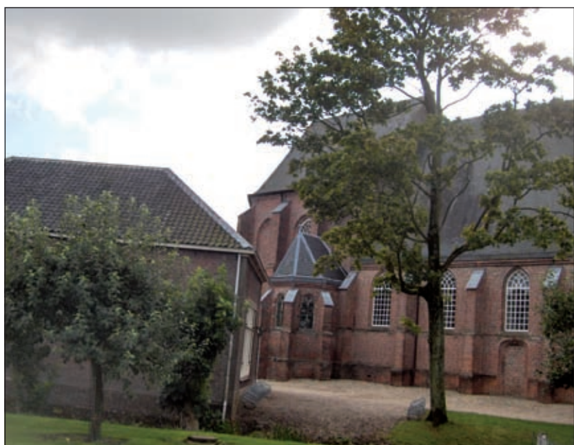
Op zaterdag 12 september van 10.00 tot 16.00 uur, vindt tijdens Open Monumenten Dag ook de jaarlijkse verkoopdag van de Hervormde Gemeente Westbroek plaats in en om het gebouw Rehoboth achter de Hervormde kerk.