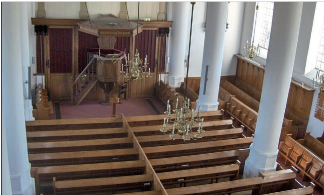
De indrukwekkende Hervormde Kerk van Westbroek met de schitterend gerestaureerde muurschilderingen (uit 1510) is vele malen beschreven in de brochures van Open Monumenten Dag. Behalve de muurschilderingen bevinden zich in de kerk: een houten koorhek, een eiken preekstoel met koperen lessenaar en diverse rouwborden.