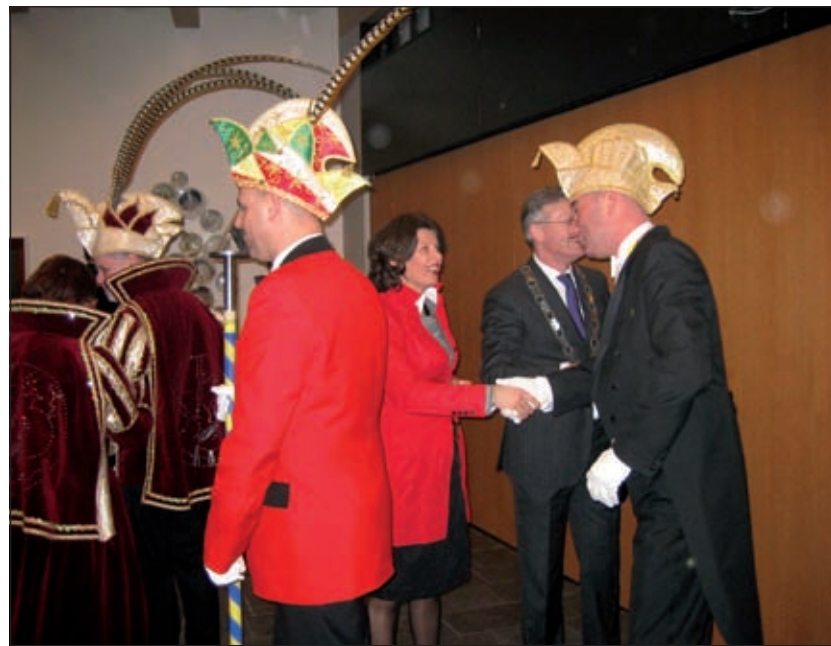
Carnavaleske goede wensen van de Weergodden.

Uit de contacten die ik in de afgelopen twee jaar in onze gemeente heb opgedaan merk ik de waardering die er is voor het gemeentebestuur als er heldere keuzen werden gemaakt. Maar ik heb ook de teleurstelling mogen voelen als die keuzen achterwege bleven. Soms is dat misschien goed verklaarbaar, maar het bewijst nadrukkelijk hoeveel mensen, verenigingen, instellingen en bedrijven vol verwachting kijken naar het gemeentebestuur als er toekomstvragen beantwoord moeten worden. Het gemeentebestuur moet zich dat goed realiseren'.