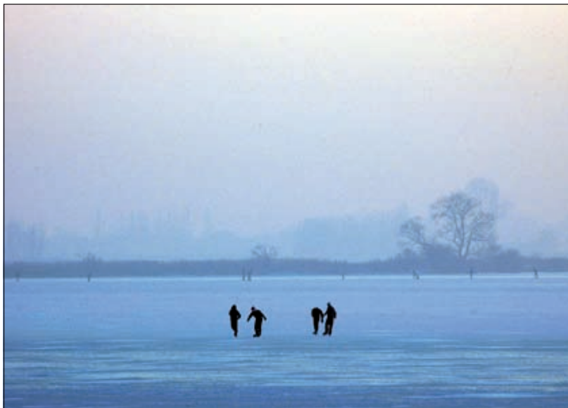
Tot laat in de middag was er ijspret dit weekend. De zon kleurde het ijs zachtroze.