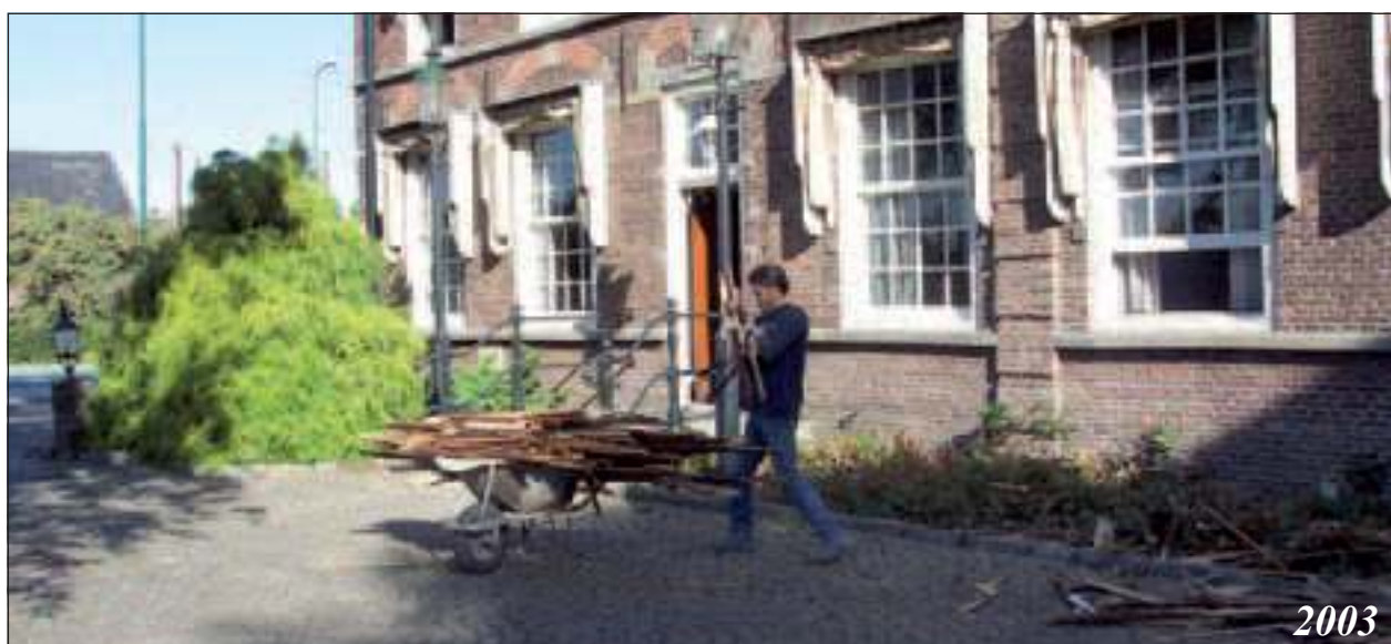
Verbouwingswerkzaamheden bij het oude gemeentehuis.