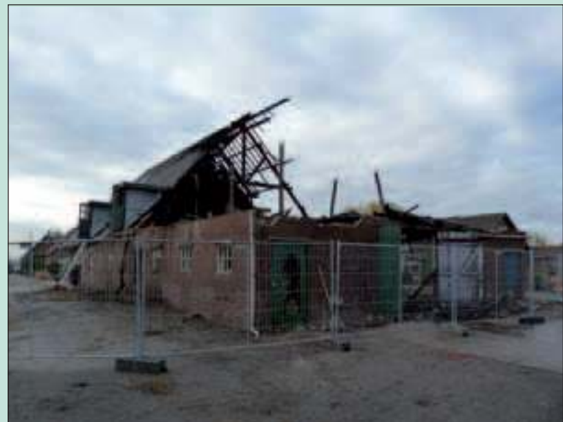
De resten van de schuur in Westbroek na de brand.

Er stond voor die avond een oefening van het korps Westbroek op het programma. Het gerucht ging dat de brand zou zijn ontstaan door de oefening. Dat was vervelend voor de brandweervrijwilligers. Vanaf het begin leek het een bizarre samenloop van omstandigheden te zijn. Gelukkig kan de politie nu met zekerheid zeggen dat er geen enkele relatie is tussen de oefening en de brand. De gemeente wil hier nog eens benadrukken dat de brandweer Westbroek geen enkele blaam treft. Het gemeentebestuur heeft grote waardering voor het korps Westbroek en andere brandweermensen die altijd klaarstaan voor de veiligheid van onze inwoners. [HvdB]