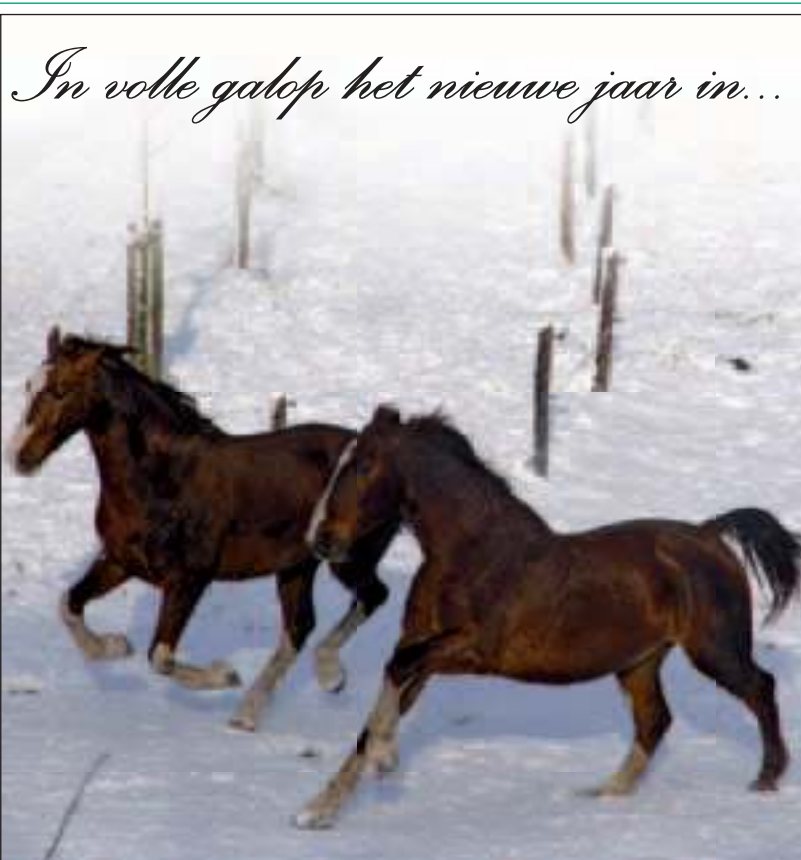
in een Groenekans weiland.

Groenekanseweg 168, Groenekan www.naastdeburen.nl