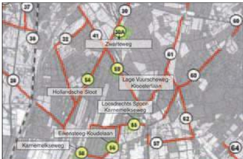
Het onderhoud van de rijkswielpaden aan de Zwarteweg, de Hollandsche Sloot, het Loosdrechts Spoor/Karnemelksweg, De Eikensteeg c.q. Koudelaan, de Karnemelksweg en de Lage Vuurscheweg/Kloosterlaan is door de gemeente De Bilt m.i.v. 2011 overgedragen aan het recreatieschap Utrechtse Heuvelrug, Vallei- en Kromme Rijngebied.

jaarlijkse financiële bijdrage voor het onderhoud gevraagd van 10.739 euro. Van belang is dat de gemeenten Baarn en Soest niet deelnemen in een recreatieschap, maar wel bereid zijn om de onderhoudskosten van de recreatieve fietspaden met ingang van 2010 voor hun rekening te nemen. De gemeente De Bilt heeft het onderhoud van de recreatieve fietspaden in deze gemeente met ingang van 2011 overgedragen aan het recreatieschap Utrechtse Heuvelrug, Vallei- en Kromme Rijngebied. Voor het jaar 2010 zijn de onderhoudskosten eenmalig vergoed aan de Rijkswielpadenvereniging, mede dankzij een overbruggingsbijdrage van 9.863 euro van de provincie Utrecht aan de gemeente De Bilt.