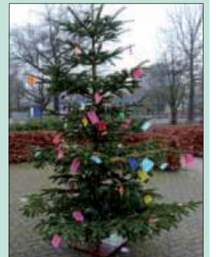
Demeter kreeg deze 'wensboom' cadeau van de Nederlandse beroepsvereniging van Oncologieverpleegkundigen (V&VN Oncologie).

Gerionne nodigde vervolgens de ongeveer 2000 congresbezoekers van 16 en 17 december jl. uit om een wens voor de zorg aan oncologie patiënten in de boom te hangen. Vervolgens heeft V&VN Oncologie deze wensen integraal doorgegeven aan de zorg voor mensen die zorg krijgen in Demeter en is de boom met sponsoring van een farmaceutisch bedrijf naar Demeter gebracht waar die door Demeter centrale plek is neergezet. Deze gift gaf Demeter de gelegenheid om de eigen gekochte boom met lichtjes voor de huiskamer aan de andere kant van het hospice neer te zetten. [HvdB]