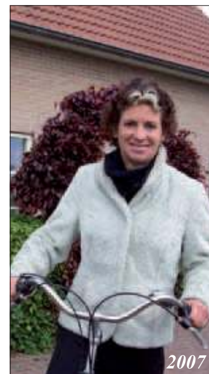
Minister Gerda Verburg op werkbezoek in Westbroek.