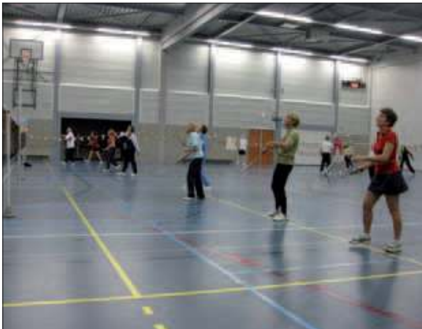
Vrijdag 14 januari kan je sfeer proeven en meespelen bij badmintonafdeling van SV Irene in de Kees Boekehal.

Ben je 18 jaar of ouder? Kom dan gezellig langs en ervaar zelf hoe leuk en gezellig badminton is. De gehele avond zal het clubhuis van SV Irene