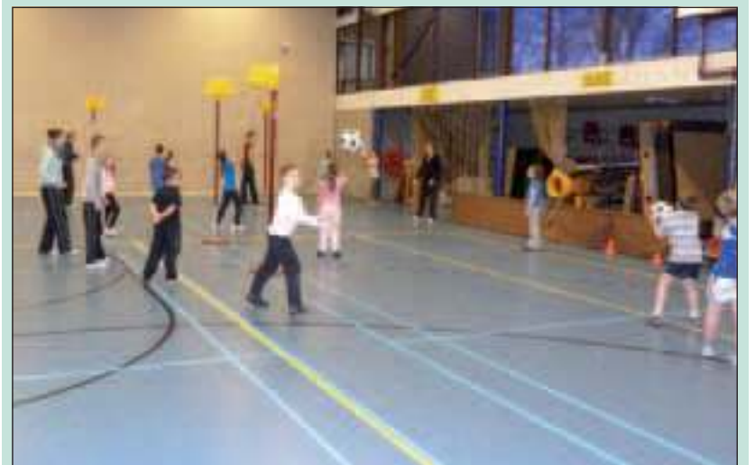
Natuurlijk was er aandacht voor korfbal in de thuishaven van Tweemaal Zes.