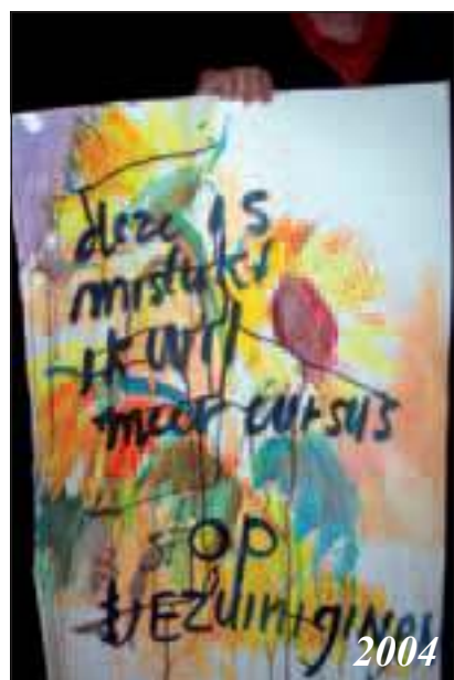
Bewoners demonstreren massaal tegen bezuinigingsplannen op kunst en cultuur.