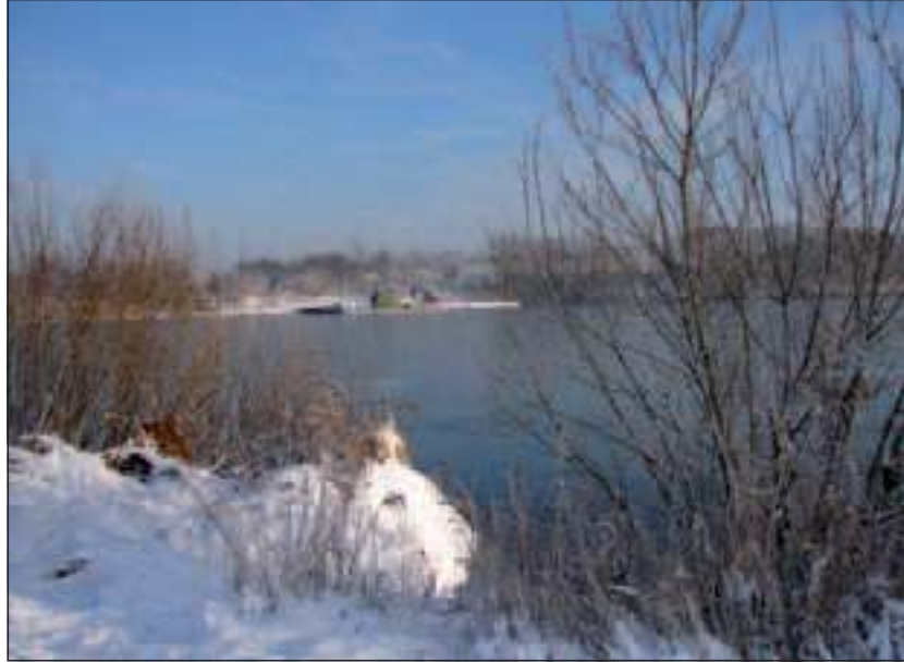
Zelfs met baggerplatform ziet de Hooge Kampse plas er in de winter sprookjesachtig uit.

Over de plannen van verondieping, die al enige maanden geleden gestart is en vijf jaar in beslag zal nemen, doen veel tegenstrijdige berichten de ronde. In de kranten zijn artikelen verschenen over de algengroei door het ondieper worden van de plas. Thijs Pons van het Groenekans Landschap is ecoloog en heeft in het verleden onderzoek gedaan naar de plassen die door zandwinning zijn ontstaan: 'De Hooge Kampse plas is ontstaan bij de aanleg van de A27. Door verwijderen van het zand vormde het grondwater een plas. In de jaren zeventig werd de plas gebruikt om vuil te storten. Uit het Amsterdam-Rijn kanaal is een grote hoeveelheid met PCB's vervuild slib gestort. PCB's zijn chloorkoolwaterstoffen die zich aan slib hechten en zich ophopen in de voedselketen. Het storten van vuil leidde tot de bijnaam