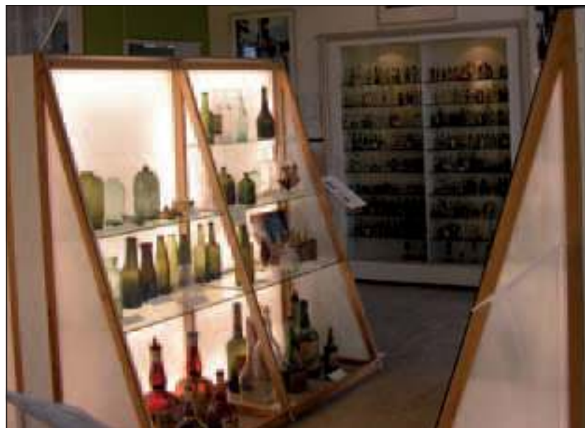
Het museum heeft een grote collectie oude flessen.

Uw verslaggever heeft in ieder geval nog nooit een bezoek aan een museum afgesloten in zo'n tevreden en vrolijke stemming en daarbij toch het gevoel veel opgestoken te hebben. Meer over het Likeur- en Frismuseum en de mogelijkheden om het te bezoeken op www.likeur-frismuseum.nl .