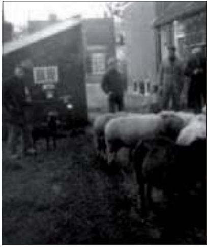
Nog even een praatje met de fam. Hogenhout. Links staat de hond Lotje bij ome Henk.

Een verzamelaar van oud-gereedschap kocht eind 2003 in Maartensdijk een langwerpig smeedijzeren voorwerp waarvan het gebruik hem onbekend was. De verkoper dacht dat het een dissel was, waarmee de timmerman vroeger hout bewerkte. In een naslagwerk ontdekte de verzamelaar dat het een schopje van een schaapherder moest zijn. Een schaapherder gooit met zo'n schopje een beetje aarde naar een afgedwaald schaap om hem weer bij de kudde te voegen. Voorzover bekend dwaalde de laatste schaapherder begin vorige eeuw met zijn kudde over de Maartensdijkse velden.