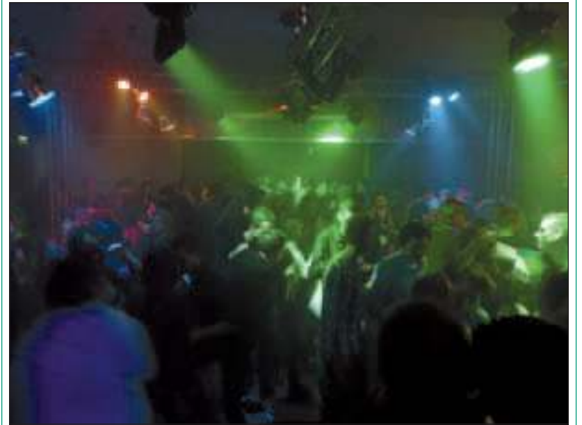
De foto's van het feest zijn terug te vinden op de Hyves pagina www.x-events.hyves.nl .

Ruim 250 bezoekers wisten in de nieuwjaarsnacht de weg te vinden naar SojoS, waar ze helemaal uit hun dak zijn gegaan op lekkere house, apres-ski en andere feestmuziek. De organisatie bedankt alle bezoekers en vrijwilligers voor de onvergetelijke nacht.