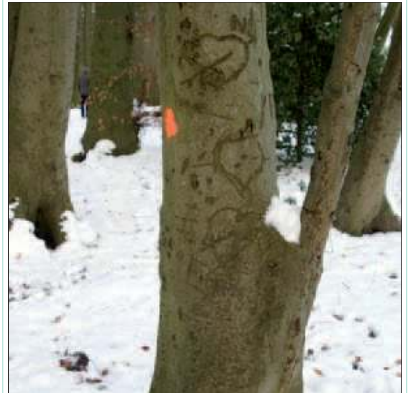
De rode stip op de boom geeft aan dat deze boom gekapt gaat worden.