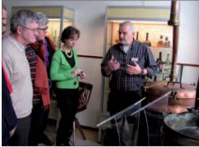
Rondleiding in het Likeur- en Frismuseum in Hilvarenbeek.

De rondleidingen worden gegeven door enthousiaste vrijwilligers. Aan