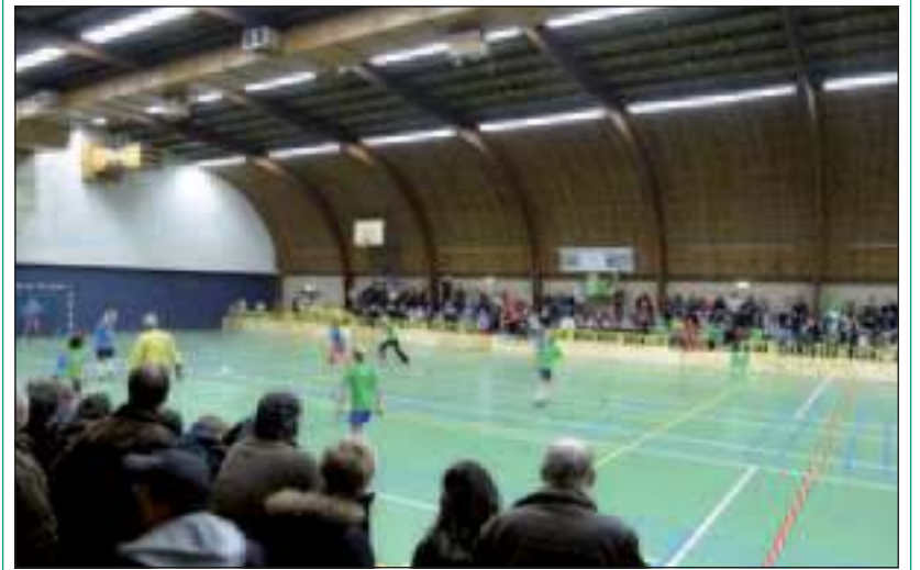
Ruim achthonderd kinderen hebben meegedaan aan het Kerstzaalvoetbaltoernooi. Zonder alle vrijwilligers was deze jarenlange traditie geen succes gebleven.