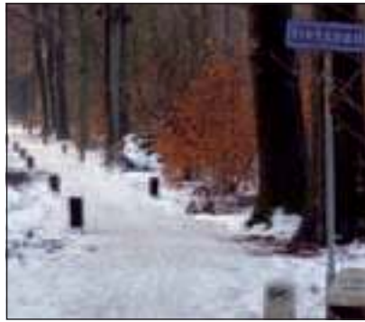
Koudelaan richting Eikensteeg. Onderaan een bordje G+C duidt op Rijkswielpadenvereniging Gooi- en Eemland.

De Rijkswielpadenvereniging heeft daarom met ingang van 2010 een