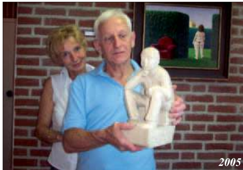
Het gemeentehuis is even expositieruimte.