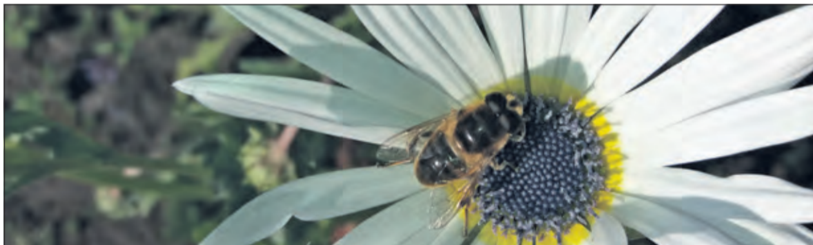
Bij op Berenoortje.

De Werkgroep Biodiversiteit van Samen voor Hollandsche Rading organiseert op 17 mei een bijzondere verkoop van bijenplanten, kruiden en zaden in en rond het Dorpshuis in Hollandsche Rading (Dennenlaan 57) van 14.00 tot 17.00 uur.