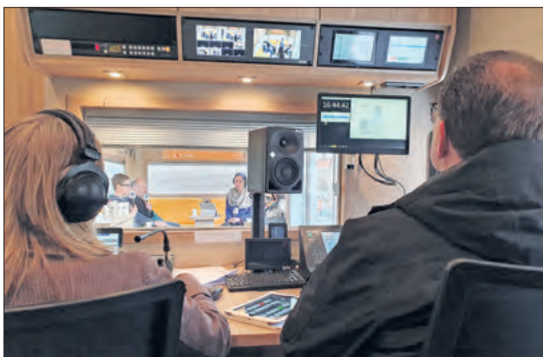
Nauwlettend wordt vanuit de regiekamer alles gevolgd.