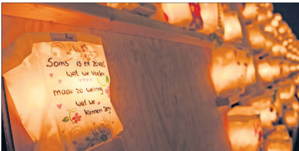
Kaarsen van hoop verlichten het parcours.