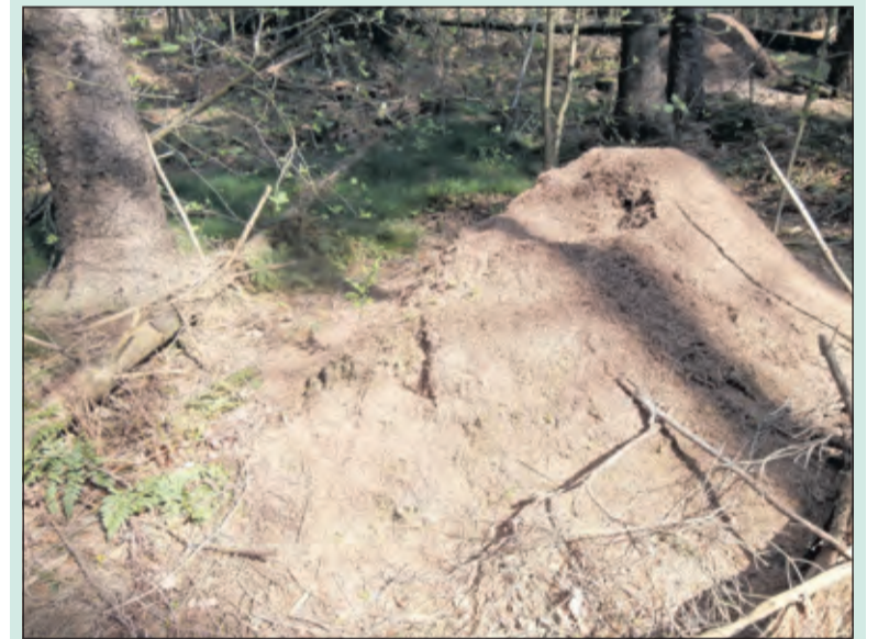
Mieren kunnen spectaculair grote nesten maken.

Mieren zijn een van de meest voorkomende dieren in Nederland. Er zijn veel verschillende soorten, ook in onze omgeving. Een van de grootste in ons land levende mieren is de bosmier, ook hiervan zijn er meerdere soorten.