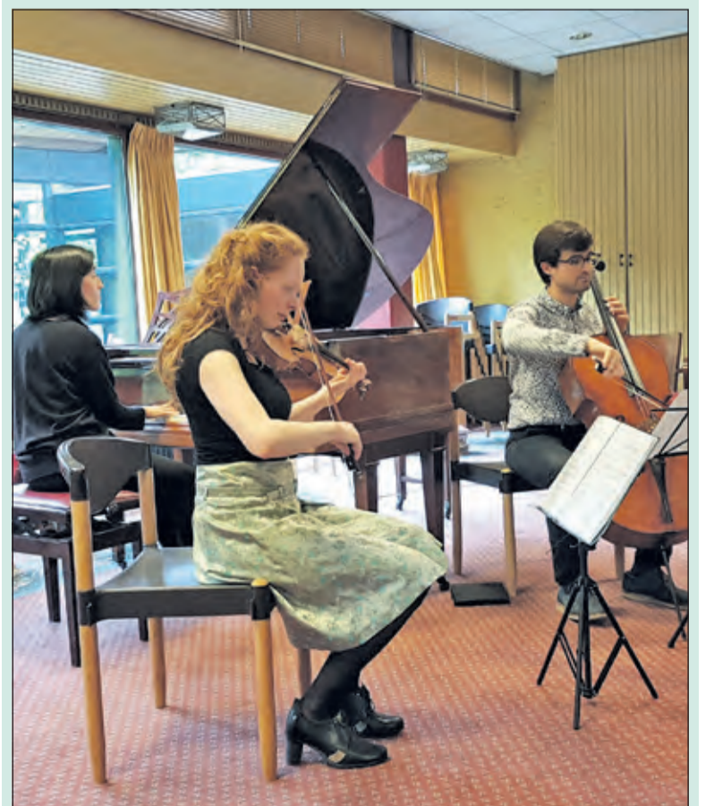
Zondag 5 mei gaf het ensemble Camus Trio een bevrijdingsconcert in Schutsmantel in Bilthoven.