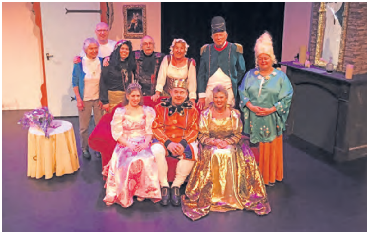
De cast van het in maart uitgevoerde toneelstuk voor kinderen ‘Floriana en het wonderflesje’.

blijspelen, kluchten en komische thrillers. De repetities vinden wekelijks plaats op de dinsdagavond in een zaaltje van Het Lichtruim. Ervaring in toneelspel is niet noodzakelijk, maar de regisseur houdt van tevoren wel een kleine auditie. Binnen de toneelvereniging is daarnaast ook een aantal (oudere) leden dat speciaal voor ouderenverenigingen en instellingen eenakters instudeert, het zogenaamde Seniorentoneel. De repetities van dit groepje vinden meestal op donderdagmiddagen plaats. ‘Maar we hebben nu vooral jonge mensen nodig’, besluit Van Weelden, ‘In de leeftijd van pakweg 20 tot 60 jaar’. Voor meer informatie kan contact worden opgenomen met secretaris Anke van Doleweerd, tel. 030-2291021, e-mail secretariaat-steedsbeter@gmail.com