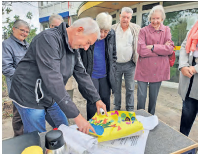
Foto's en tekeningen worden uitvoerig bekeken.

Uiteindelijk was het moment daar: de capsule kwam los. Nieuwsgierig naar wat zich in de capsule bevond, werd deze snel geopend. Naast diverse tekeningen en foto's van toenmalige leerlingen, kwam een brief tevoorschijn, met onder andere de tekst: 'heden, 13 mei 1996 wordt de eerste steen gelegd van de renovatie/verbouwing van de entree van de Buys Ballotschool. In deze koker zitten creatieve uitingen van de kinderen die op dit moment op de Buys Ballotschool zitten. Wij hopen dat de vinder van deze koker een indruk krijgt hoe blij wij met deze verbouw zijn. Wij danken al-