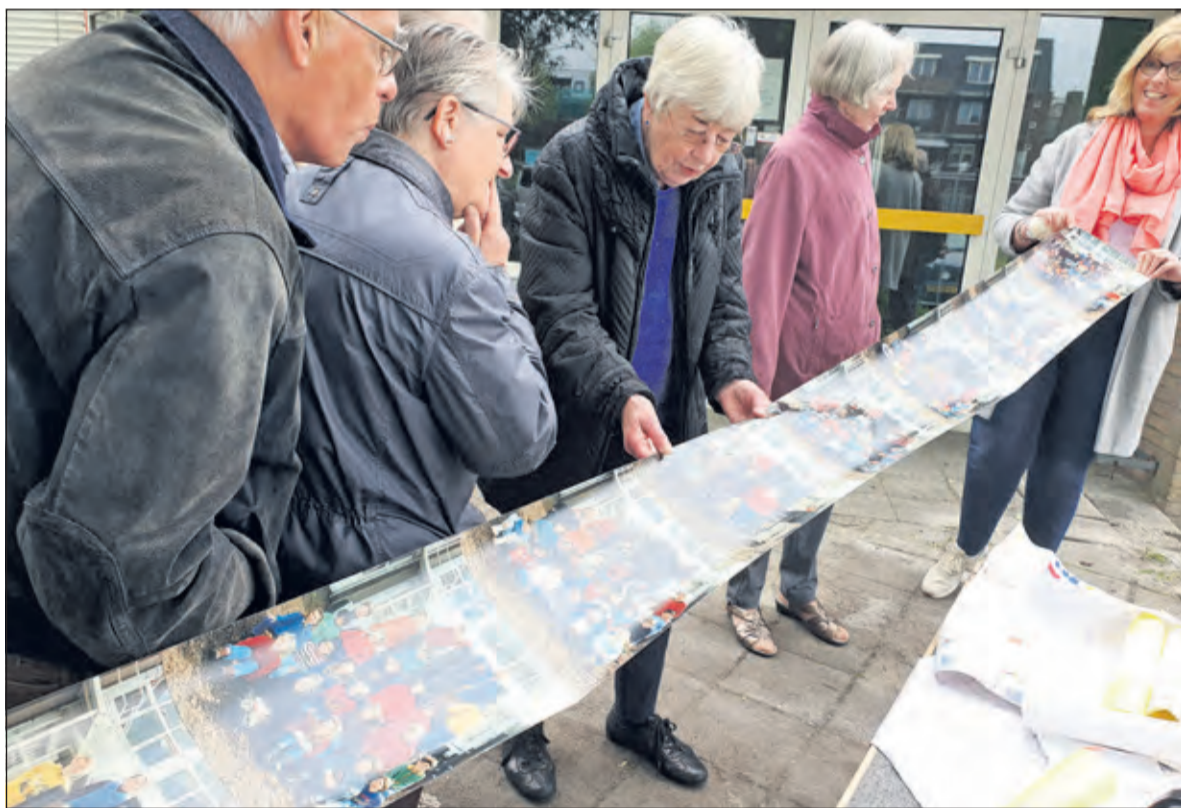
De klassenfoto's worden onder de loep genomen.

Waarschijnlijk wordt in het nieuwe pand, nog voor de zomervakantie, een nieuwe tijdscapsule geplaatst. In overleg met de gebruikers van het nieuwe gebouw wordt bekeken wat in de nieuwe koker komt. Oud-directeur Henk Smits: 'Waarschijnlijk wordt ook de inhoud van deze koker in de nieuwe tijdscapsule geplaatst'.