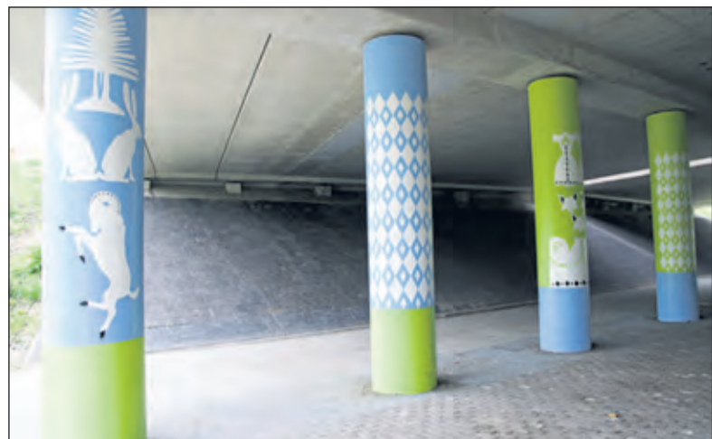
Aan de Dorpsweg in Maartensdijk: Scènes uit Reynaert de Vos op 24 pilaren.

volgens Eline trots op hun grote dassenpopulatie: 'Tijdens de wegverbreding van de A27 zijn meerdere dassen in de omgeving van Maartensdijk voorzien van een GPS halsband, waardoor we veel over de gewoontes én ontmoetingen van dassen weten. De dassen zijn uit elkaar te houden dankzij hun zwart/witte tekening op de snuit. De dassen met een GPS hebben ook een eigen naam. Als een ode aan de belangstelling van de inwoners van Maartensdijk voor 'hun' dassen hebben de ontwerpers van dit kunstwerk voor een moderne eigentijdse weergave van het