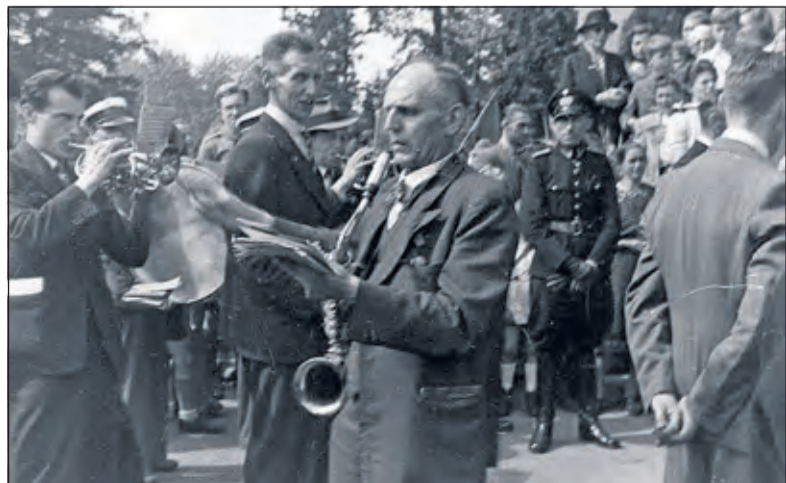
bevrijdingsconcert door de Koninklijke Biltse Harmonie.