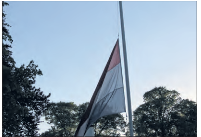
De Nederlandse driekleur halfstok bij het oorlogsmonument.