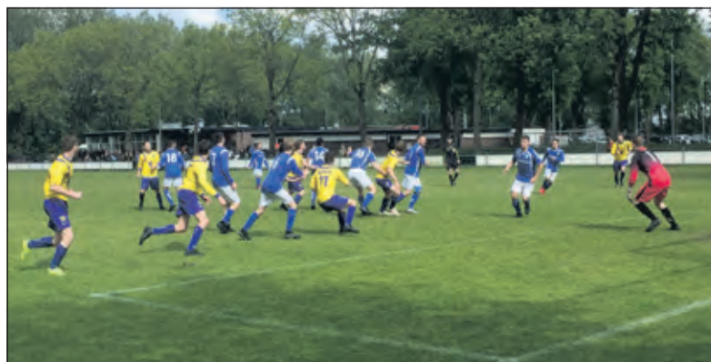
Grote drukte voor het doel.

kwam ook nog veel te gemakkelijk op 2-1. SVM speelde alles of niets maar scoorde niet. VVJ profiteerde van de ruimte en bepaalde met een counter de eindstand op 3-1. Hercules is de lachende derde en kan bij winst a.s. zaterdag de kampioensvlag hijsen SVM kan zich gaan voorbereiden op de nacompetitie voor promotie naar de 3e klasse. SVM gaat 11 mei uit naar de Utrechtse fusieclub Faja Lobi KDS.