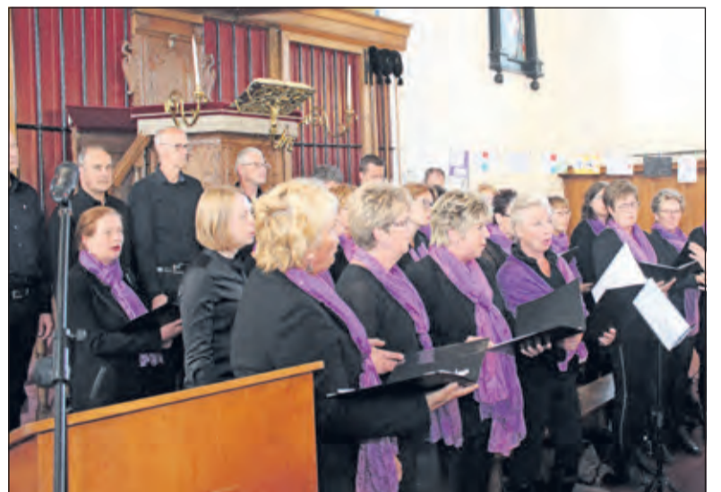
Er was zang van gospelkoor Sparks of Joy.

In stilte stelde men zich vervolgens op bij het monument voor het kerkgebouw, waar Vriendenkring koralen speelde. Na het taptoesignaal waren er twee minuten stilte en begeleidde Vriendenkring het zingen