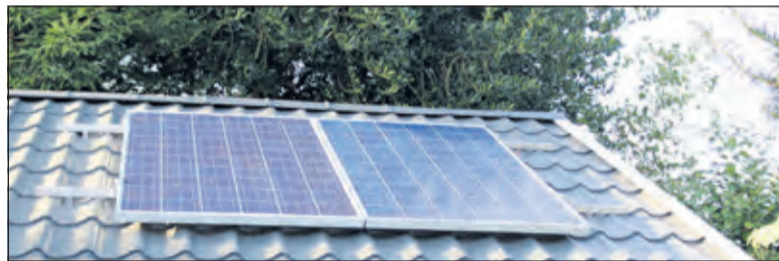
Investeren in zonnepanelen blijft aantrekkelijk.

Op de informatieavond kun je al jouw vragen kwijt over zonnepanelen op het eigen dak, bijvoorbeeld