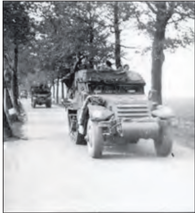
The Polar Bears reden op 7 mei 1945 Maartensdijk binnen.

'Op maandag 7 mei 1945 kwamen vanuit Utrecht als eersten de Engelsen in Half Tracks Maartensdijk binnenrijden. Half Tracks zijn licht gepantserde voertuigen met achter rups- en voor luchtbanden. Op het linker voorspatbord van de wagens stond een ijsbeer afgebeeld. Dit was de mascotte van de Polar Bears. De divisie behoorde tot de Second British Army, die toegevoegd was