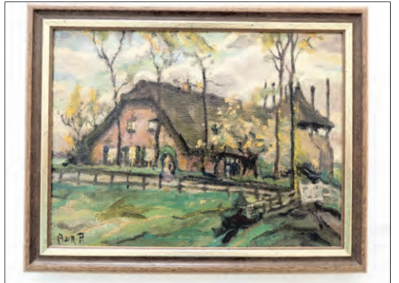
Het Veldhuis aan de Planetenbaan; het laatste schilderij van haar hand (215x250mm). Van het schilderij werd een foto gemaakt en beschikbaar gesteld door Arie van Zijveld te Woerden.