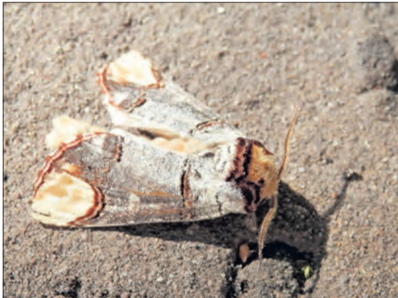
De wapendrager is een veelvoorkomende nachtvlinder, die vliegt tussen eind april en begin augustus

De vlindernacht eindigt om 1.00 uur. Tot dat tijdstip kunt u zich verwonderen over wat er al zo niet rondvliegt. Opgeven voor de vlindernacht kan tot 28 augustus via Robtimmer@scarabae.nl .