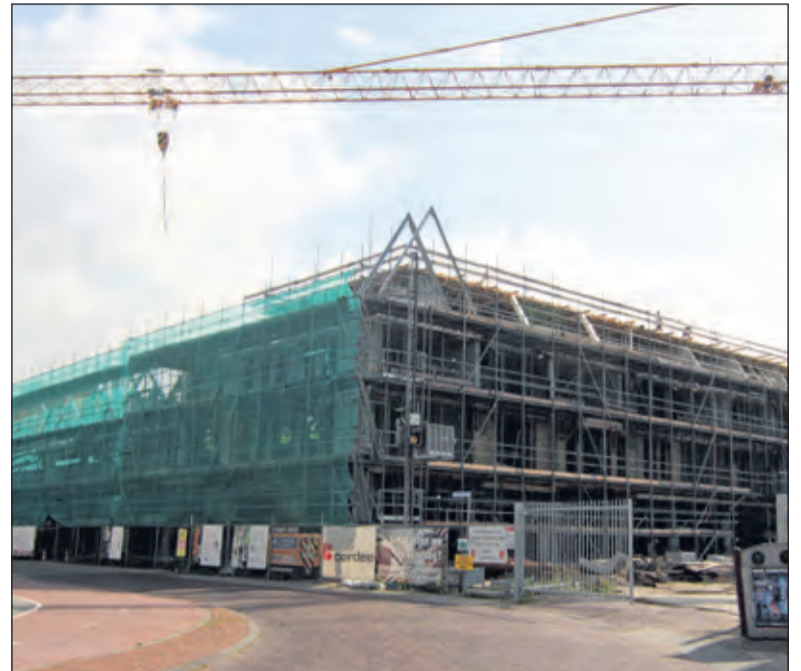
De belangrijkste reden voor Hart Voor Bilthoven (HVB) om een rechtszaak aan te spannen was de hoogte van het nieuwbouwpand aan het Vinkenplein.