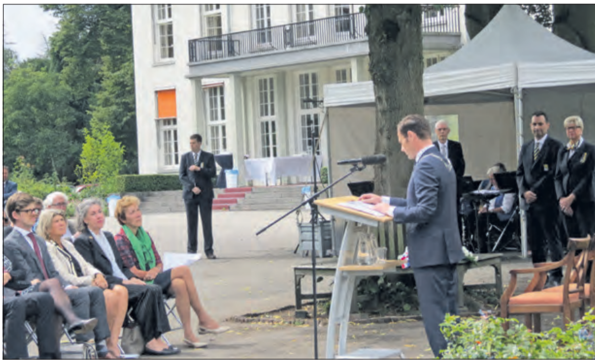
Burgemeester Sjoerd Potters tijdens zijn toespraak.

en beslissingen van volwassenen. 'Toch is er veel aan het veranderen.' Hij noemt het zelfbeschikkingsrecht van groot belang. 'We leven in een wereld waarin we dat steeds meer gaan beseffen. Het is steeds meer te zien bij ontwikkelingen in het onderwijs, in de zorg en binnen bedrijven en organisaties.' Hij vindt een verlaging van het actieve kiesrecht naar 16 jaar daarbij passen. 'In elke oorlog vallen slachtoffers. Wij herdenken deze slachtoffers maar we kijken ook met vertrouwen naar de toekomst.'