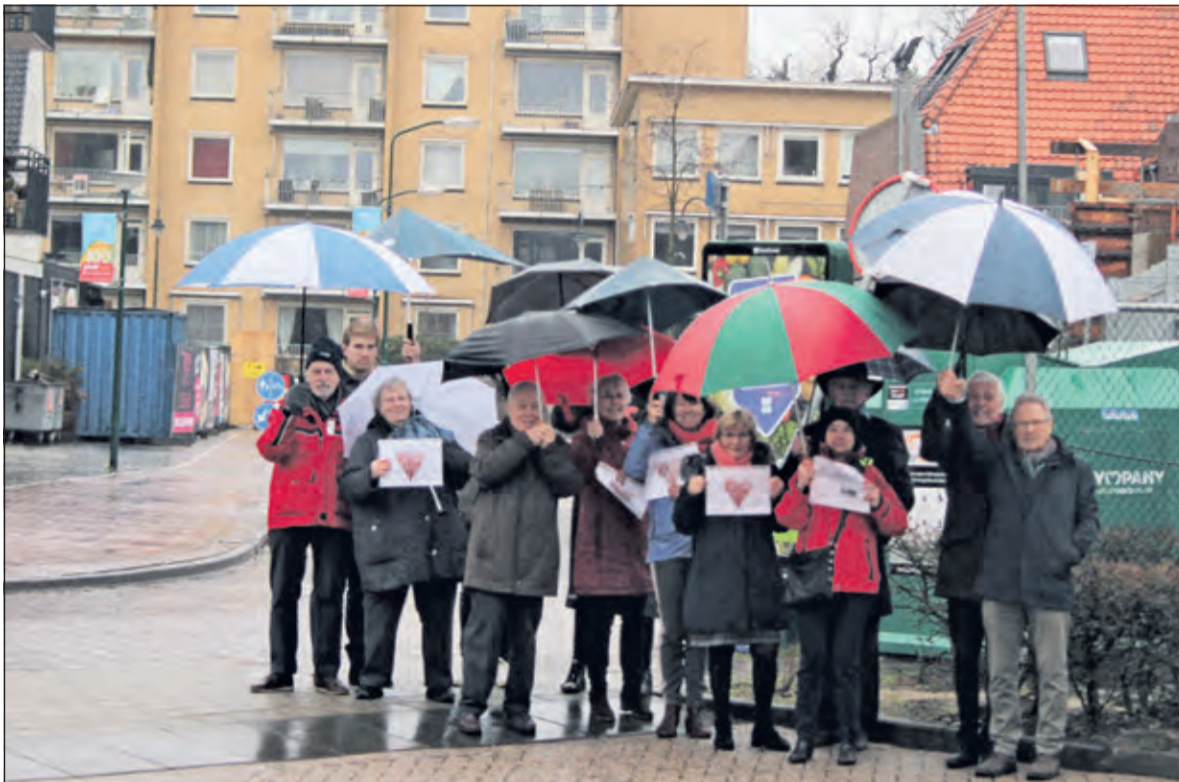
Op 10 februari 2019 stonden vertegenwoordigers van alle bewonersorganisaties, die zijn aangesloten bij Hart Voor Bilthoven in de stromende regen om van hun verontrusting blijk te geven.

‘De gemeente dient zich te houden aan door haar zelf gestelde regels en dient gedegen onderbouwde inbreng van burgers aantoonbaar mee te nemen in haar besluitvorming’. In dit door de rechterlijke macht op 2 augustus uitgesproken vonnis vernietigt het rechtswezen tevens het besluit van het Biltse College van B&W om de bezwaren van HVB niet te erkennen en draagt zij het College op een nieuw besluit te nemen, rekening houdend met de bezwaren van Hart Voor Bilthoven.