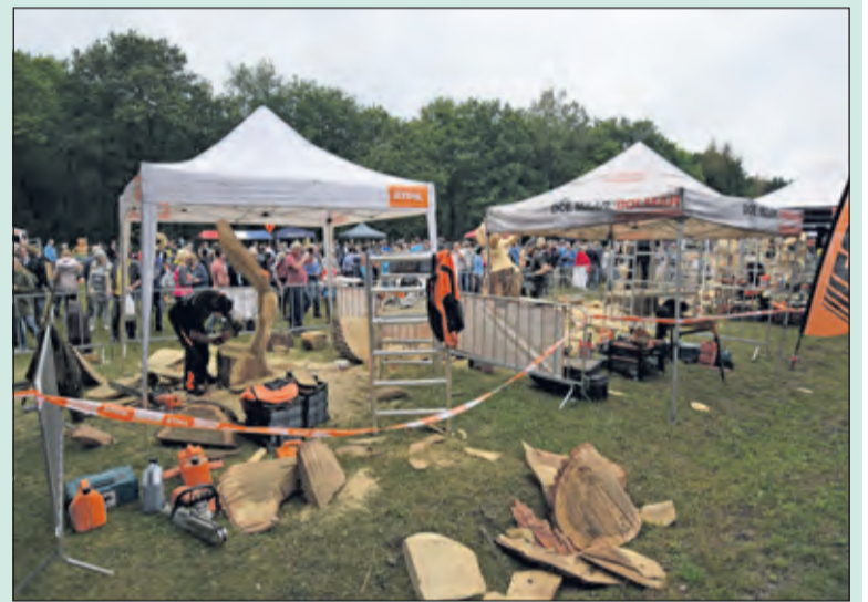
Ondanks het regenachtige weekend stroomden liefhebbers van bos, natuur en werken in het groen van heinde en verre toe naar de Kuil van Drakensteyn in Lage Vuursche.