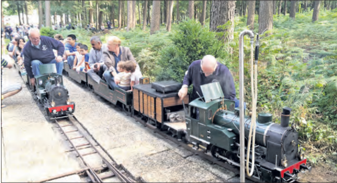
Er is altijd veel belangstelling voor de Open Dag.

In de bossen in Hollandsche Rading heeft de vereniging een spoor, 3.5"- en 5"-spoorbaan met een lengte van ca. 330 meter en een vaste gecombineerde vaste 7.25"-grondbaan van ca. 400 meter. De leden verzorgen jaarlijks een aantal thema-stoom dagen met als hoogtepunt de Open Dag.