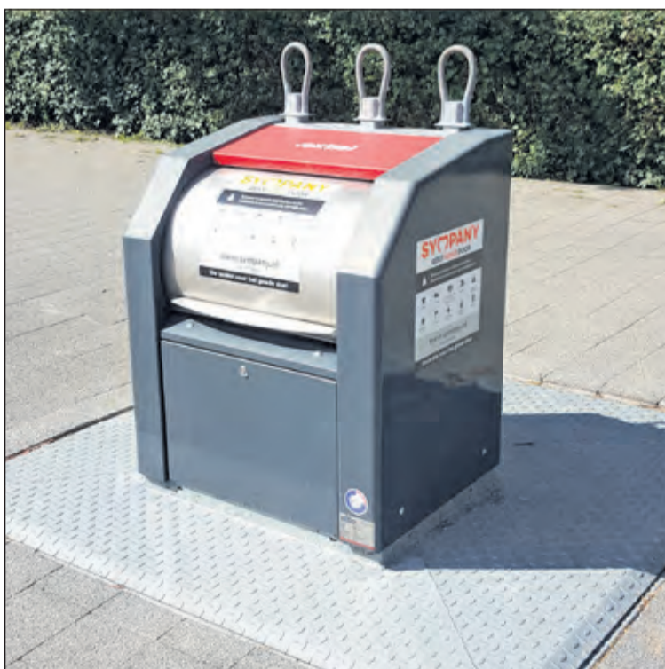
De container aan de Planetenbaan in Bilthoven.

De Bilt Sympany zamelt al lange tijd het textiel in De Bilt in. Verspreid door de gemeente staan op centrale locaties textielcontainers. Er zijn zeven textielcontainers in Bilthoven, vijf in De Bilt, twee in