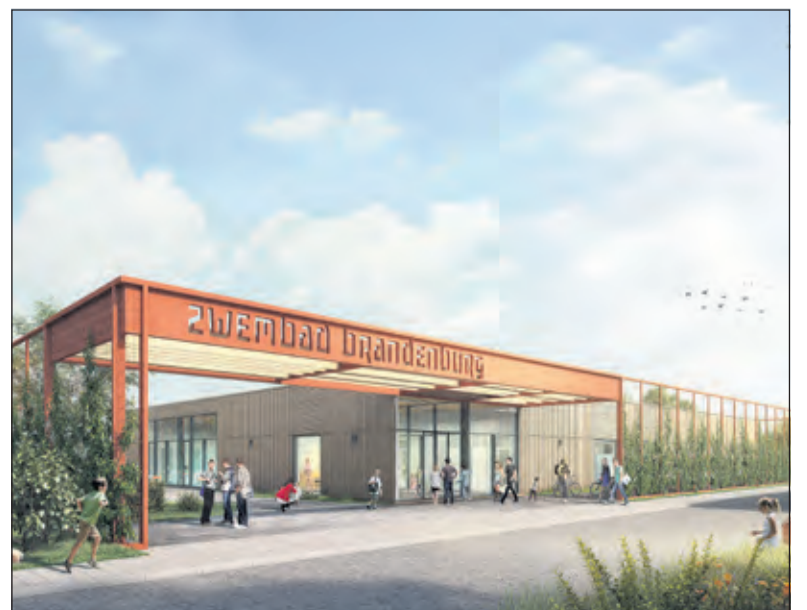
In 2017 gepubliceerde impressie van het bad.