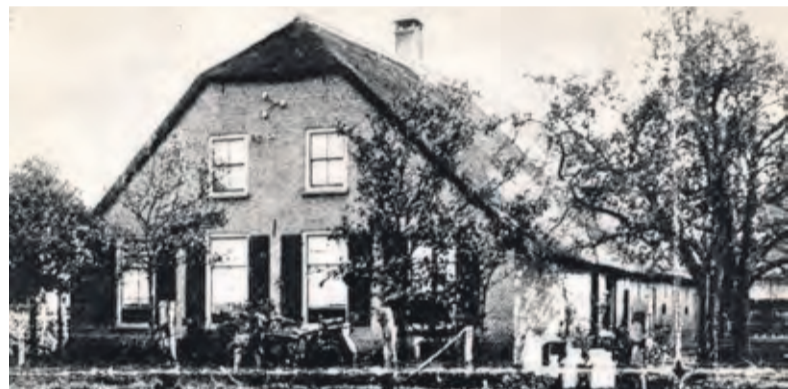
In W.O. II waren Duitse soldaten ingekwartierd op boerderij 't Veldhuis in Maartensdijk.

In de Kiek van 22 maart 1995 stelt Koos ons voor aan Adri Pieck (1894 – 1982), die precies 100 jaar geleden in Hollandsche Rading (tot haar overlijden) in Hollandsche Rading woonde. HvdB