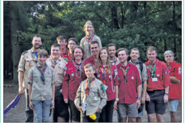
De Maartensdijkse deelnemers.