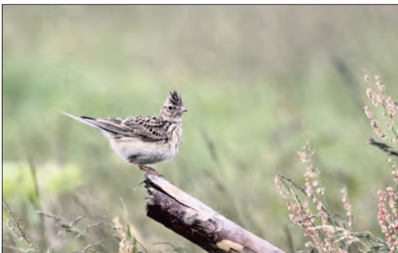
De veldleeuwerik is nog tot september te zien.

Op 16 augustus heeft Utrechts Landschap de hekken van de hoofdlandingsbaan op Park Vliegbasis Soesterberg weer opengezet. Het broedseizoen is ten einde en wandelaars en fietsers kunnen weer volop genieten van het weidse uitzicht en de stilte op de 3 kilometer lange baan.