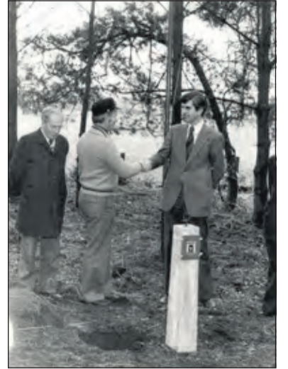
De eerste paal in 1979.

Dit jaar vindt deze plaats op zaterdag 31 augustus van 10.00 uur tot 16.00 uur. Er komen naast de eigen leden ook veel gasten met hun stoommachines uit het hele land en uit het buitenland. De toegang is gratis en de kinderen kunnen meedelen met de treinen door het bos. Er is een springkussen en verkoop van eten en drinken. Ook zal een uniek, historisch, draaiorgel de sfeer verhogen. De locatie is Karmemelksweg 8 in Hollandsche Ra-