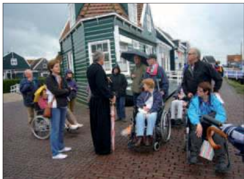
Dankzij een match op de beursvloer konden 17 MS-patiënten een heerlijk dagje uit.