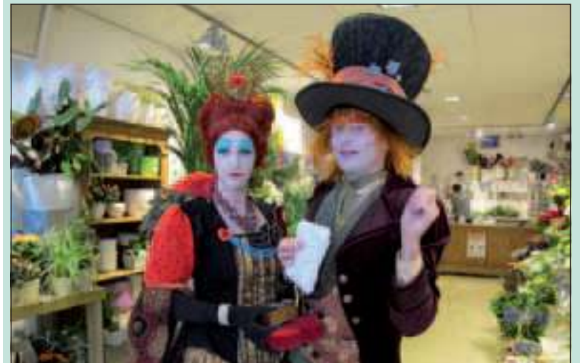
De gekke hoedenmaker en de hartenkoningin deelden ook bonnen uit bij Bloemsierkunst H. van Burken op de Hessenweg in De Bilt.

Als Vaderdagattractie had de winkeliersvereniging Hessenweg en Looydijk een tweetal bijzondere figuren op pad gestuurd. De gekke hoedenmaker en de hartenkoningin, die in de film Alice in Wonderland van regisseur Tim Burton gespeeld worden door Johnny Depp en Helena Bonham Carter, deelden op 18 juni overall op de Hessenweg en de Looydijk bonnen uit waarmee leuke prijzen waren te winnen. [LVD]