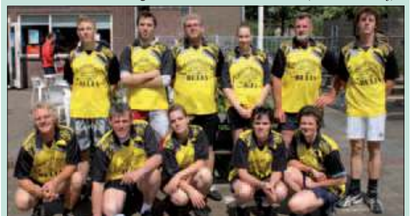
De spelers die deze dag met elkaar het team vormden.

Het weer was zaterdag 18 juni wisselend met zon en een regenbui, maar de onderlinge sfeer was prima tot aan het allerlaatste fluitsignaal. De finale ging tussen de winnaar van vorig jaar 't Opperend en het team van gospelkoor Sparks of Joy. Het koor won deze wedstrijd met 2-1 en mocht de wisselbeker hierna in ontvangst nemen. (Wilco de Rooij)