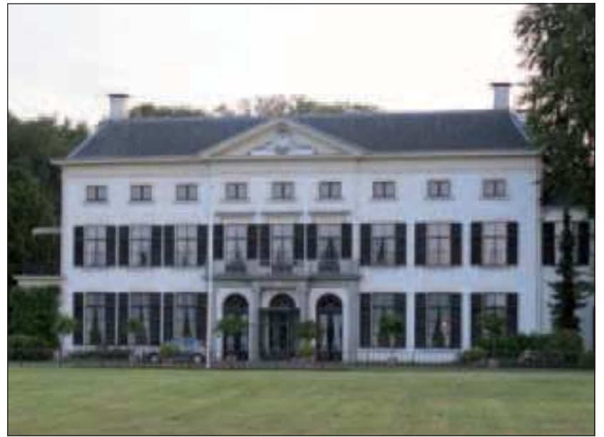
Landgoed Vollenhoven heeft een rijke geschiedenis. Begin negentiende eeuw vertoefde Lodewijk Napoleon, die van 1806 tot 1810 koning van Nederland was, hier graag met zijn gezin.

ambachtelijk vervaardigde huis- en tuindecoratie, keramische vogelhuisjes en terrasdecoratie. Ook gespecialiseerde kwekers presenteren zich tijdens de Tuindagen. De stands bevinden zich in en om het koetshuis, in de wei voor het huis, in een gedeelte van het Engelse landschapspark en de moestuin en in en om de orangerie. Bezoekers kunnen deelnemen aan workshops op tuingebied, bijvoorbeeld tuinonderhoud, bloemsierkunst en tuindecoratie, en naar demonstraties kijken, zoals van mandenvlechtes en snoeien. In de tent in de moestuin worden lezingen en workshops gehouden. Voor twee workshops kunnen plaatsen worden gereserveerd: 1. Kruidenzout maken door Puur & Edel in het koetshuis op zaterdag, zondag en maandag om 11.30 uur. Deelnemers gaan aan de slag met verschillende soorten mengsels, zout en kruiden en ervaren op die manier hoe ze de verfijnde smaken en creaties tot stand kunnen brengen en aan gerechten een originele draai kunnen geven. 2. Bloemschikken door Veronique Flowers in het koetshuis. Deze workshop vindt plaats op zaterdag, zondag en maandag om 13.30 uur. Veronique leert haar deelnemers een tafelstuk vervaardigen, gestoken op oasis op een schotel die wordt weggevoerd. Zie ook www.landgoedvollenhoven.nl