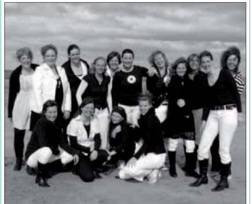
Vocalgroup Esperanto: veertien zingende vrouwen, die met hun enthousiasme en energieke uitstraling een verrassende en boeiende vocale omlijsting van de Zomerfair voor hun rekening nemen.

Een grote markt met zo'n 30 kramen met voor elk wat wils. Creatieve kramen, beeldenkraam, leuke activiteiten voor de kinderen, een rommelmarkt, een Oosterse kraam en een echt Oosters Theehuis. Het Rad van Fortuin en een loterij met veel mooie prijzen, lekker eten en drinken en veel muziek. O.a.: de Vocalgroup Esperanto uit Hilversum: 14 vrouwen o.l.v. dirigent Hans van Breugel en vierstemmig zingend, vooral lichte popmuziek. Zij treden rond 11.00u. 12.00u. 13.30u. en 14.30u. op. Maar ook een pianist die op deze mooie locatie concerten zal geven en natuurlijk het enige echte Smartlappenkoor, bestaande uit enkel en alleen medewerkers en vrijwilligers van St. Elisabeth. Kortom het belooft een prachtige, gezellige dag te worden. Komt u ook? Verpleeghuis St. Elisabeth, Kloosterlaan 29 te Lage Vuursche