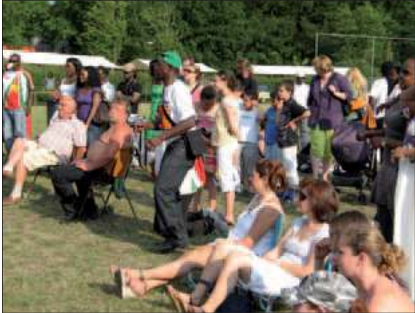
Uprising I trok nog niet zo heel veel publiek, maar dit jaar verwacht de organisatie dat het hele veld vol komt te staan.