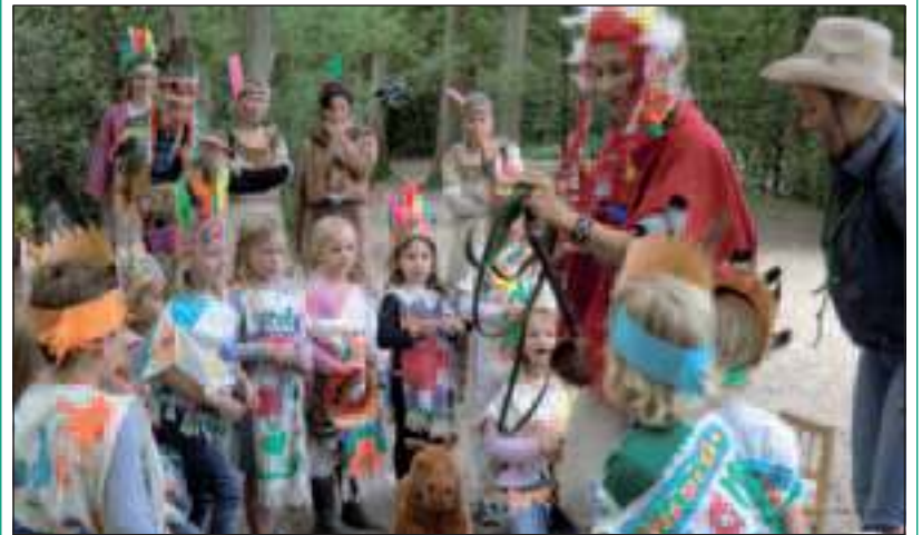
Kleine en grote indianen in Bilthoven.

Deze week hadden de kleuters van de Bilthovense Van Dijckschool hun zomerfeest. Het thema was indianen. De kinderen hadden in de week voorafgaand aan het indianenfeest allemaal hun indianenkleding geleverd, eigen indianennamen verzonnen, totempalen beschilderd, indianen tooien gemaakt, etc. 's Ochtends werd op het achterplein van de school een indianenspeltjescircuit uitgezet. De kinderen mochten met 'bootjes' tussen krokodillen door varen, goud zoeken, indianetekeningen maken, indianen tenten bouwen en een vredespijp roken. In de 2e helft van de ochtend was er een speurtocht door het bos bij het heidemeertje. De indianen gingen op pad langs allemaal wigwam vlaggetjes. In het bos zaten ouders die als indianen verkleed waren. De ene indiaan was zijn totempaal kwijt, er moest gezocht worden naar de totempaal en deze samen weer opbouwen. Bij een andere indianenstam werd een regendans opgevoerd en weer anderen indianen werd geholpen met het zoeken naar een hoofdtooie die gelukkig net op tijd werd gevonden in de kookpot, voordat het vuurtje aanging. Het was een fantastische dag, mede door de inzet van vele enthousiaste ouders, leerkrachten en droog weer! Na een heerlijke pannenkoekenmaaltijd op het indianenplein gingen allen kleine indianen moe maar voldaan weer naar huis. (Yvonne Pennings)