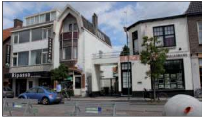
Gemeentelijk monument op het Emmaplein Oostzijde. Eén van de vier panden, die volgens het Beeldkwaliteitsplan van 2010 het verdienen te blijven.