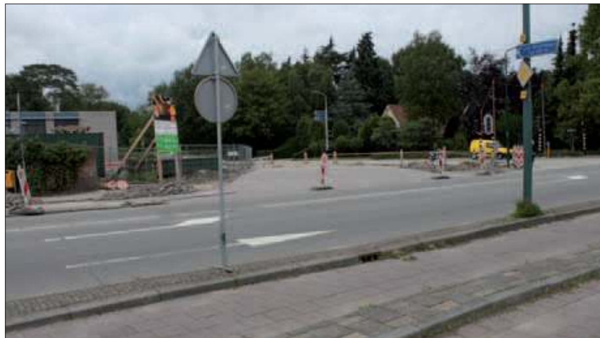
Voorafgaand aan de werkzaamheden wordt in de week van 20 juni de Jan Steenlaan verlegd. De aansluiting op de Soestdijkseweg komt daarmee dichterbij het treinstation te liggen. Zo blijft de Jan Steenlaan gedurende het werk toegankelijk voor fietsverkeer, dat met geleiders van werkerterrein en autoverkeer wordt gescheiden.

Tijdens de werkzaamheden op het Emmaplein blijven de winkels bereikbaar voor winkelend publiek. De ventweg is die periode alleen bereikbaar voor fietsers. Parkeren blijft wel mogelijk; langs de Soestdijkseweg en aan de overzijde.