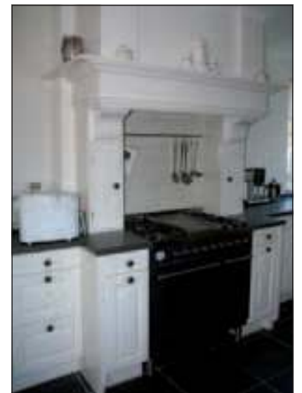
Een keukenbetimmering uitgevoerd door De Bruijn Meubel- en Interieurbouw.

lemaal naar wens van de opdrachtgever ontworpen en vervaardigd wordt. Dit maakt zijn interieur eigentijds en exclusief. In deze tak van het bedrijf zwaait zoon Freek de scepter, regelmatig bijgestaan door zijn vader'.