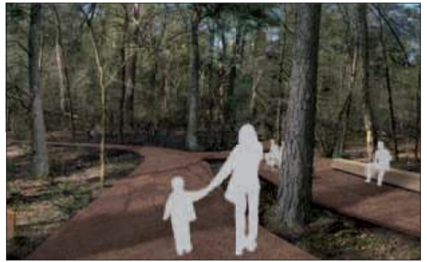
Een impressie van de natuurbegraafplaats.

Willen mensen toch een oplossing met meer tierelantijnen? 'Dan raden wij een plaats op de natuurbegraafplaats af. We gaan hele duidelijke afspraken maken met de nabestaanden. Ligt er aan het eind van de dag nog een aandenken dat niet bij het karakter van de begraafplaats past, dan wordt deze meegenomen door de beheerder', aldus Glastra. De natuurbegraafplaats bij Den en Rust heeft een beperkte capaciteit. 'We gaan uit van