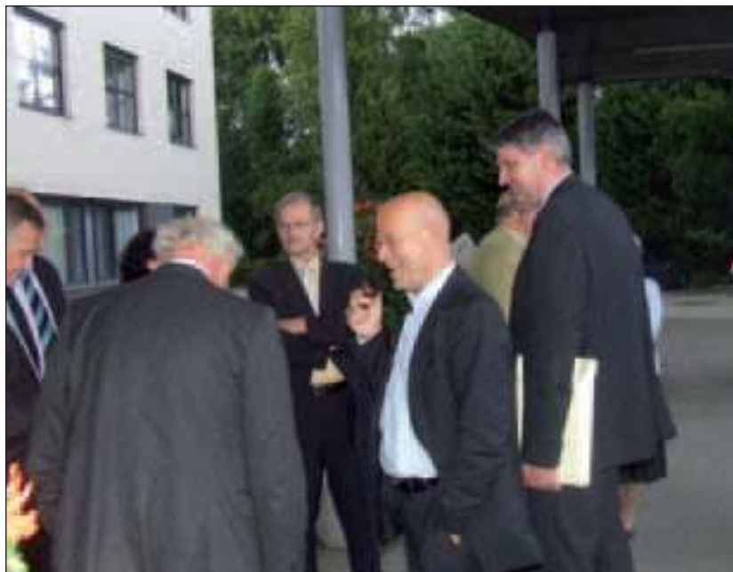
Pauze bij de behandeling van de voorjaarsnota.