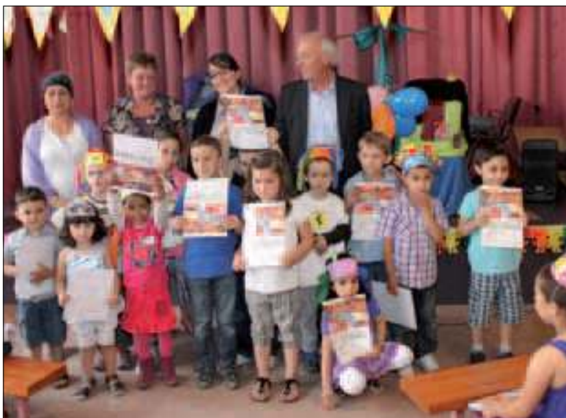
Een deel van de kinderen, die vorige week woensdag hun diploma en een cadeautje ontving.