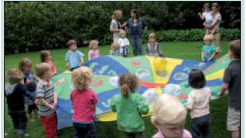
Kleuters proberen de bal in één van de gaten te krijgen.