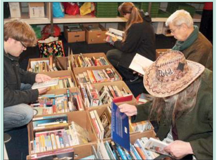
Bijna duizend boeken kregen een nieuwe eigenaar.

De totale opbrengst - 974 euro - gaat naar de goede doelen, die ook j.l. september tijdens de Dorpskerk Marktdag werden gesteund, t.w. Hillcrest Aids Centre Trust in Zuid-Afrika en het Morgenster Ziekenhuis in Zimbabwe.