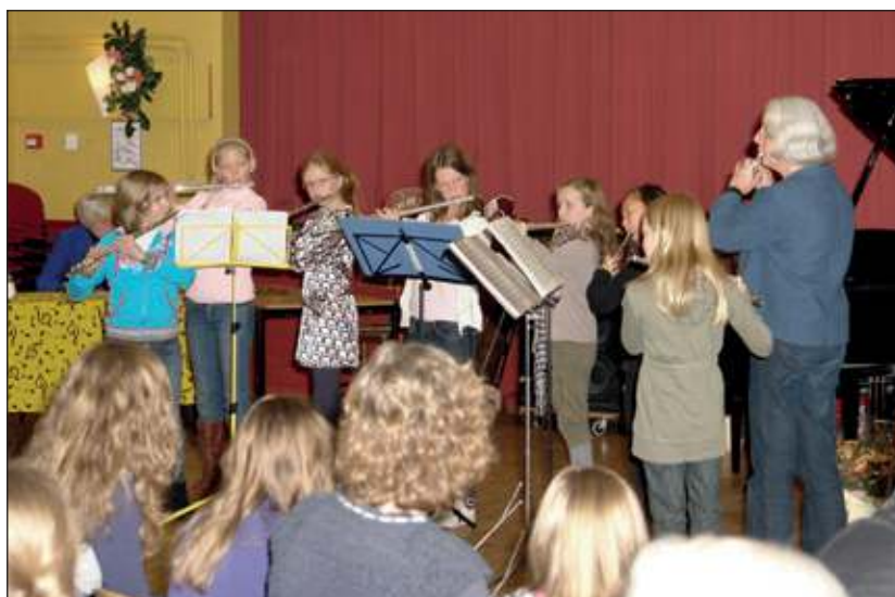
Een foto van de Muziekmarathon 2011.

Het amateurfestival is vooral voor kinderen en jongeren van 7 tot 18 jaar. Maar ook volwassenen kunnen zich aanmelden. Je kunt als solist optreden, in een duo of in een ensemble of koor. Toelatingseisen zijn er niet. Je neemt je eigen instrument mee en wil je graag begeleid worden op de