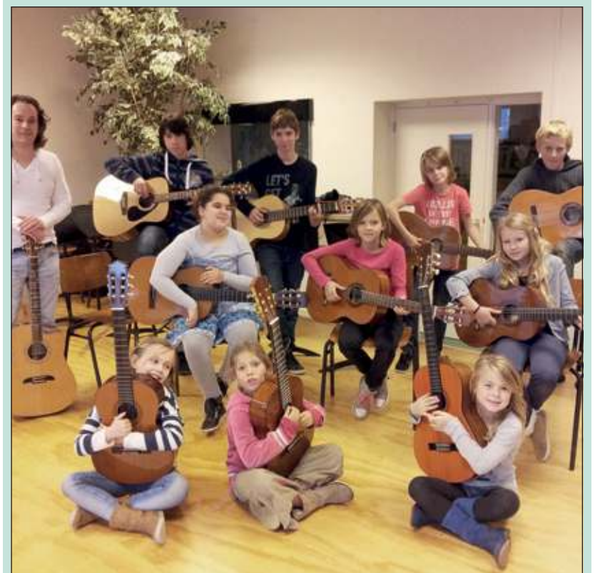
Leerlingen van De Rietakker volgden een workshop gitaar.

Afgelopen vrijdag was de laatste van drie workshops gitaar die werden gegeven door gitaardocent Menno Schaaïj. De lessen vinden plaats op de muziekschool, zodat de kinderen in een inspirerende omgeving kennis maken met en plezier krijgen in het zelf muziek maken. Later in het seizoen volgen nog sessies dwarsfluit en cajon. Lessen volgen van echte muzikanten is absoluut een meerwaarde om de leerlingen kennis te laten maken met het bespelen van een instrument en te stimuleren een muziekinstrument te gaan bespelen.