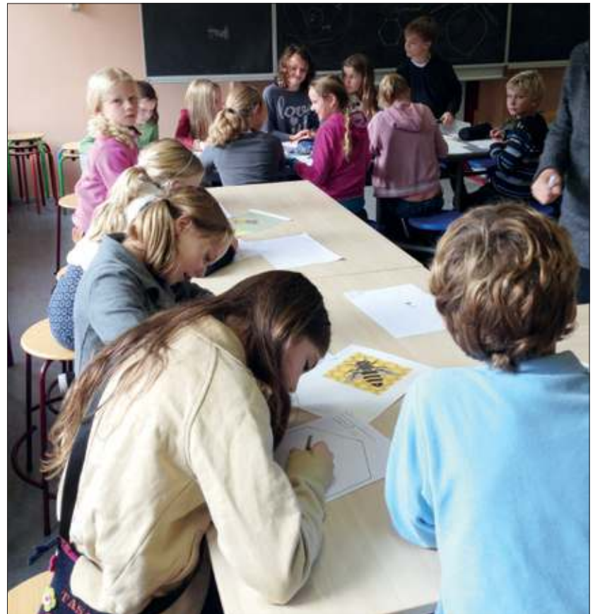
Op de Nijepoort gingen de kinderen enthousiast aan de slag.

In de eerste les werd er verteld over het leven van de bijen, de gemeente De Bilt en het kunstwerk in totaal. Er werd geschetst en getekend en de basisvorm van de bij wordt gemaakt in geel-bakkende klei. De bijtjes worden minimaal een week te drogen gelegd. In de tweede les worden de bijtjes als kunstwerk verder afgewerkt.