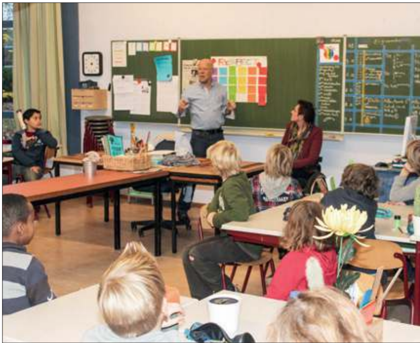
Het Platform Respectvol Samenleven in De Bilt verzorgde samen met het Gehandicaptenplatform een les op de WP (basisschool).

Ook liet ze kinderen met een blinddoek door de klas en buiten lopen. Andere kinderen moesten dat begeleiden. Weer anders was het om met watjes in de neus en alleen door een rietje ademend te moeten rennen. Hoe voelt het om astma te hebben? Ook liet ze de kinderen lopen met de benen aan elkaar gebonden. Hoe loopt het als je geen kracht hebt? Bij een korte afsluiting bleek dat de kinderen het heel leerzaam vonden om het effect van een beperking te voelen.