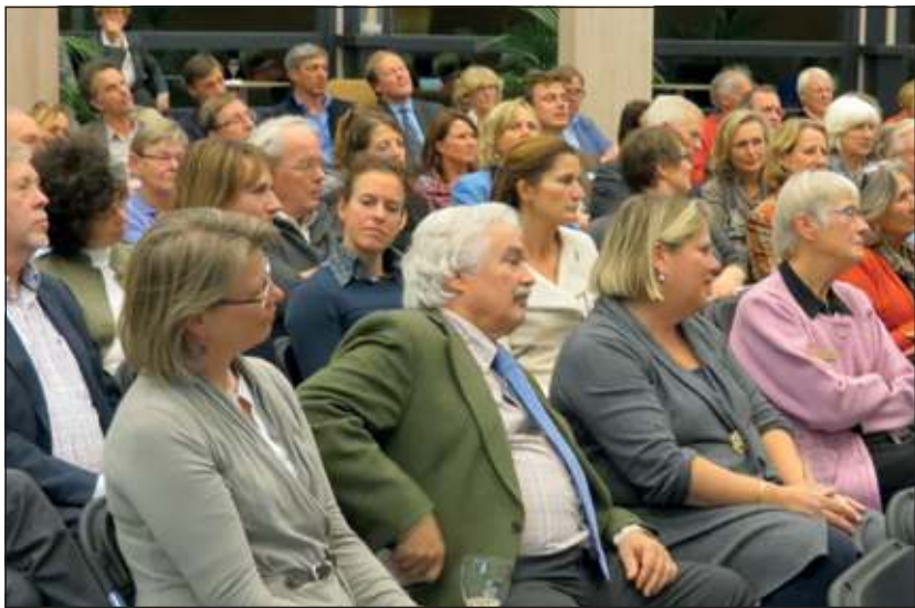
De debatavond over kunst trok veel bezoekers.

De kunstenaar moet vrij zijn in zijn expressie.' Gelet op de grote hoeveelheid kunstwerken in de depots van musea pleit Van Breugel ervoor de bevolking eigen collecties uit die stukken te laten samenstellen en die op veel plaatsen te laten zien. 'Daarmee verklein je de kloof tussen kunst en bevolking.'