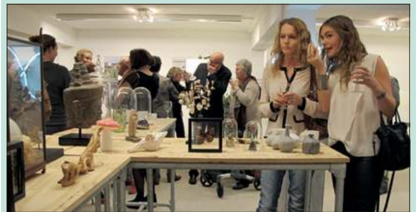
Bezoekers van de expositie Wonderkamers in galerie MaCloud keken hun ogen uit.