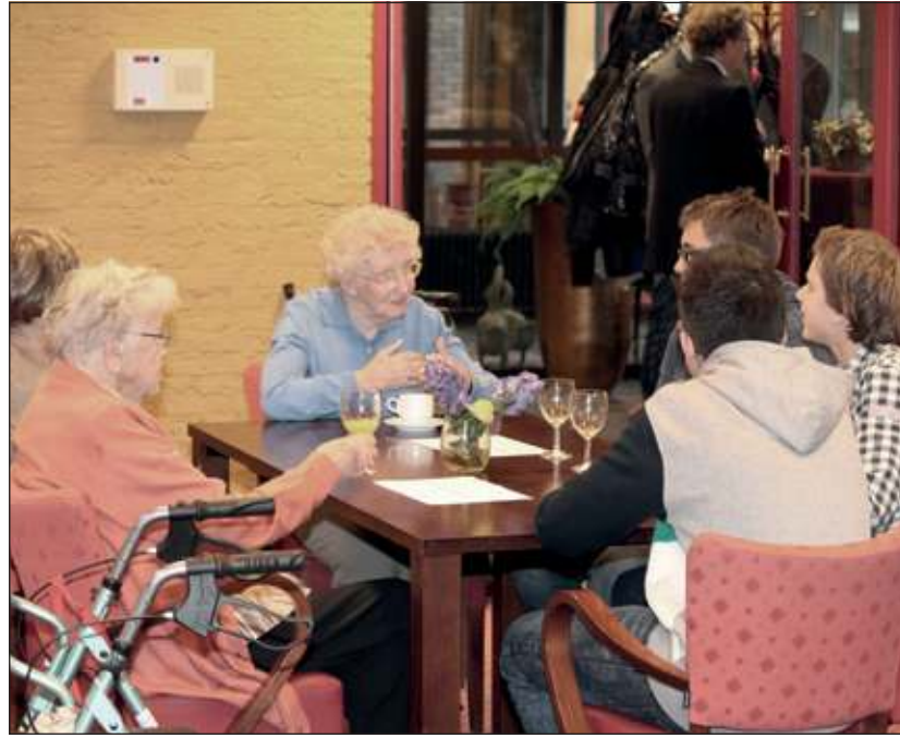
De stelling 'Ouderen hebben geen begrip voor de jeugd van tegenwoordig' maakte de tongen meer dan los.

Een andere stelling luidde: 'Jongeren van tegenwoordig hebben geen respect voor ouderen' en er was veel overeenstemming bij de stelling: 'Door wat er tegenwoordig op TV is verschuiven de grenzen'. Velen herkenden zich in deze stelling. Een mooie doordener was de uitspraak van een leerling: 'wanneer ik geen respect voor ouderen zou hebben zou ik hier niet naar toe hebben durven gaan'. Het feit dat zij respect had gaf haar ook houvast om te weten hoe ze