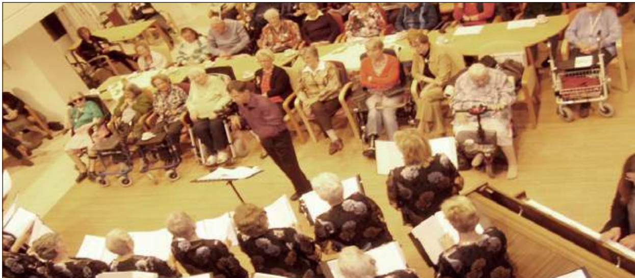
De aanwezige bewoners genoten zichtbaar, mede ook wanneer zij - door de tekst uit het programmaboekje - uit volle borst mee konden zingen.