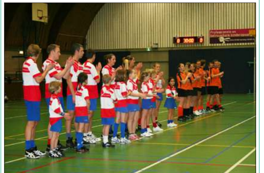
Nova presenteert het team van de week!

De kaarten zijn voor de eerste keer geschud, Nova houdt twee punten thuis en speelt volgende week de derby in Maartensdijk tegen DOS Westbroek om 20.35 uur in De Vierstee.