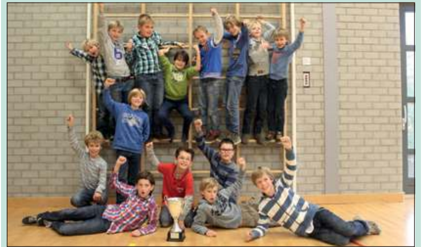
Alle deelnemende teams van de Julianaschool en de beker.

De winnaar werd het eerste team van de Julianaschool en kon zowel een wisselbeker als een taart mee naar huis nemen. De organisatie was in handen van de schaakvereniging De Biltse Combinatie (DBC) en het toernooi werd gesponsord door het Fonds Sportbevordering De Bilt. Het team van de Julianaschool won alle zeven wedstrijden en eindigde daardoor bovenaan met 14 punten.