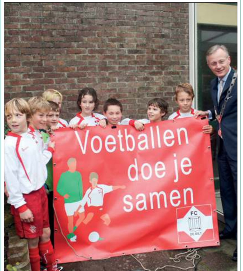
Het team en de burgemeester met het zojuist verwijderde doek, dat – exact gelijk aan het bord zelf – tot dan toe het bord had bedekt.

De commissie sportiviteit en respect van FC De Bilt heeft dit jaar de kick-off verzorgd met de theatershow Positief coachen. Als vervolg hierop heeft deze commissie in het teken van de Dag van Respect de eerste burger van De Bilt gevraagd om een bord te onthullen. FC De Bilt vindt het belangrijk dat met respect met elkaar wordt om gegaan, dat men elkaar positief coacht, want... voetballen doe je samen. [HvdB]