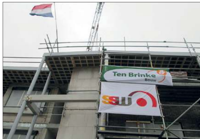
De vlag kon er op.

'Wanneer het project eenmaal is opgeleverd kunnen we er trots op zijn dat we een feitelijk verrommelde lo-