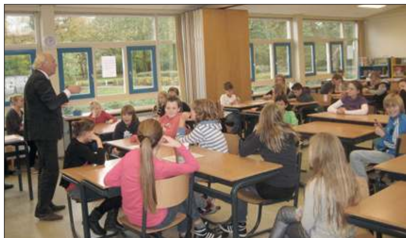
Wethouder Mittendorff voor de klas.

Zijn uitleg over respect in de politiek en de gemeenteraad wordt nog stil aangehoord. Maar als hij overschakelt naar respect op de voetbalvelden, dan gaan er vooral bij de jongens veel vingers omhoog. Zij weten precies wat hij bedoelt. Dat gebeurt ook als hij overschakelt naar internationale politiek. Want nog voordat hij landen en presidenten kan noemen doen leerlingen dat al. In zijn docerend verhaal