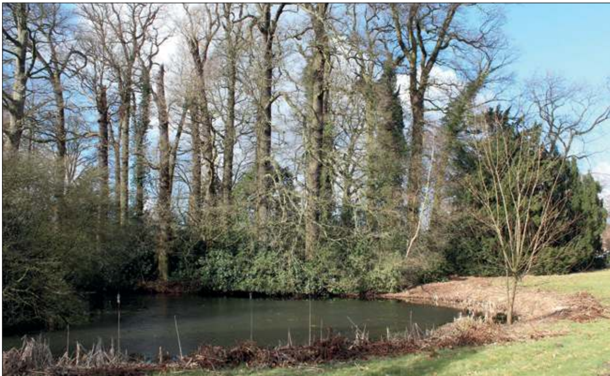
Sandwijck is ook overdag mooi.

toegang is gratis en aanmelding niet verplicht. Het geheel staat onder leiding van natuurgidsen van het IVN en ook zullen leden van de werkgroep Sandwijck aanwezig zijn. Inlichtingen vooraf: Jaap Oskam (030 22118310, Roel Maas-Bakker (030 2721611) en Rob Timmer (06 10896796).