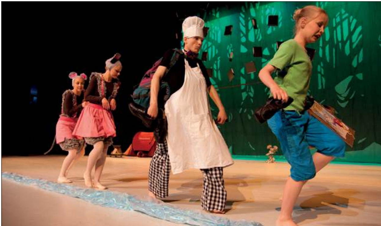
Werkschuitleerlingen in Theater Figi.

maken van een werkelijk wervelende en zeer gevarieerde dansvoorstelling met een ruime verscheidenheid aan dansstijlen. Na de zomervakantie start er weer een nieuw dansseizoen bij De Werkschuit in Zeist en De Bilt.