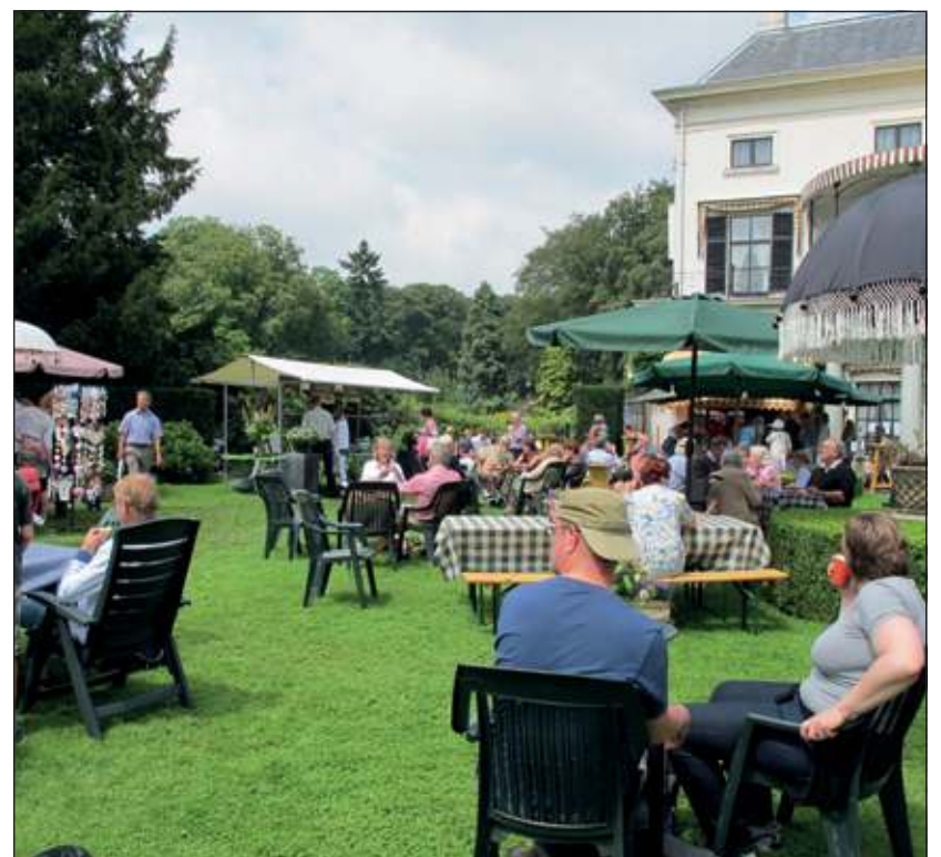
Zien, ruiken en voelen horen bij een bezoek aan de Tuindagen op Landgoed Vollenhoven.

van het landgoed en het beheer en het huidige gebruik van de gebouwen. Vervolgens worden de deelnemers in de Engelse tuin opgevangen door de volgende rondleider. Ze krijgen uitleg van iemand die zelf verantwoordelijk is voor het onderhoud en de beplanting van deze tuin over het ontstaan van de tuin en de beplanting. Bij de moestuin begint het derde deel van de rondleiding met uitleg over de geschiedenis, de beplanting, het onderhoud en de afzet van de producten uit de moestuin. Tijdens de Tuindagen is Landgoed Vollenhove open van 10.00 tot 17.00 uur Het adres is Utrechtseweg 59, De Bilt. [LvD]