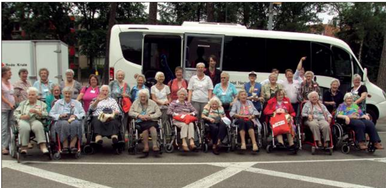
Dit jaar is de collecte om de spaarpot te vullen voor een jubileum vakantie-week in 2013 voor mensen die veel zorg nodig hebben. Deze foto is van het recente uitstapje naar de dierentuin in Amersfoort (30 mei).

Nieuw dit jaar is de collecte per SMS. U kunt direct via SMS een klein bedrag aan het Rode Kruis in De Bilt overmaken. Voor meer informatie over de collecte in De Bilt en over de SMS-methode: info@rodekruis-debilt.nl .