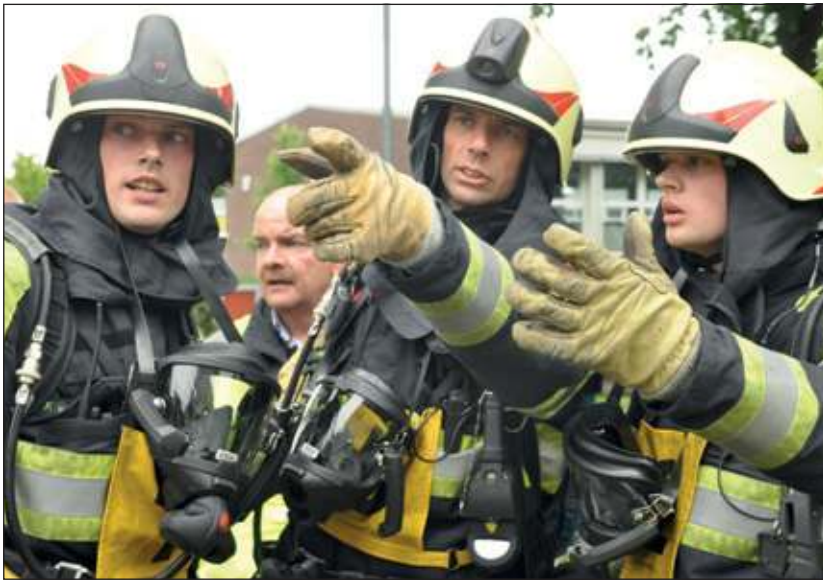
Brandweerploeg van Asselt stoot door naar de 2e ronde in de gewestelijke wedstrijden.

De ploeg van Van Asselt bestaat uit 5 broers, aangevuld met een niet Van Asselt chauffeur / pompbediende. Vier van de broers zitten bij de Groenekanse brandweer, de 5de zit bij het Maartensdijkse korps. In Beilen moesten ze een leuk en goed ge-enceneerd scenario bestrijden. Er was een bankoverval in scene gezet, waarbij met een shovel een ramkraak op de pinautomaat was gedaan. Hierbij was een invalide man klem komen te zitten onder een wiel van de shovel. Door de klap tegen de pinautomaat was er in de bank een brandje ontstaan, en ook was binnen in de bank een bankmedewerker vastgebonden door de bankrovers. Deze laatste kwamen schietend (met een klapertjes pistool...) naar buiten op het moment dat de brandweer ter plaatse kwam. Dit zorgde voor enigszins verwarring en tumult, mede omdat op dat moment ook de politie met loeiende sirene kwam aanrijden. Al met al een pittige klus voor de ploeg om de slachtoffers te bevrijden en de brand te blussen.