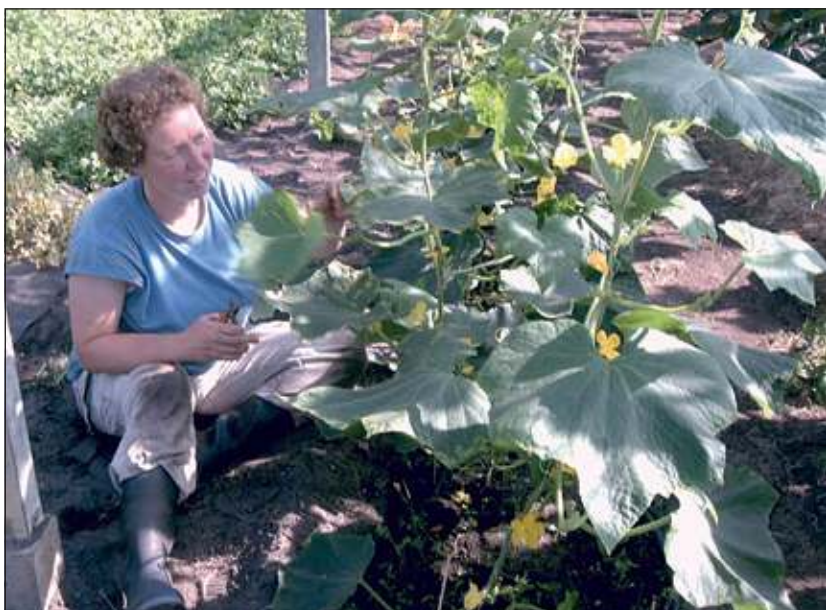
Zaterdagavond staan verse seizoensgroenten uit de tuin op het menu.

Voor meer informatie of opgave kunt u terecht bij: Biologische Tuinderij 'n Groene Kans, Groenekansweg 142, Groenekan. www.groenekans.nl