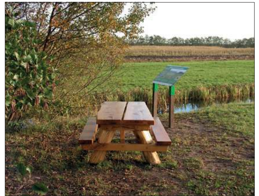
Het mooie bankje in de herfstzon.

Toen was het toch wel tijd geworden voor de onthulling. De gasten begaven zich naar de picknickbank die vlak bij de boerderij, in de bocht van de weg bij een geriefbosje, was te vinden. Het was bedekt onder een blauw zeil. Koe Trijntje stond er al te wachten. Voor deze gelegenheid was zij bedekt door een keurig fris gewassen dekje. Het dier bleef uiterst rustig bij alle drukte. Vanwege die eigenschap was zij ook verkozen voor de ceremonie. Over het weer hadden de genodigden overigens deze woensdagmiddag niet te klagen. In de stralen van de laagstaande herfstzon was het best uit te houden. Gedeputeerde Krol vatte letterlijk de koe bij de horens. Het zeil dat was vastgemaakt aan het tuig van de koe werd zo weggeslept en daar verscheen de mooie picknickbank. Kloek en degelijk gemaakt van het hout van Biltse bomen. Het mooie informatiebord kon ook worden bewonderd. Er volgde nog een demonstratie hoe zo'n Q-code precies werkt. Je moet, als je gaat wandelen, dan wel een moderne smartfoon bij je hebben. Het is verbluffend dat je dan midden in het weidse landschap zo'n mooi verhaal kunt horen. Na de onthulling volgde nog een geanimeerd samenzijn in de stal. En Trijntje? Die sjokte met haar begeleider weer terug langs de lange Korsesteeg op weg naar haar vriendinnen.