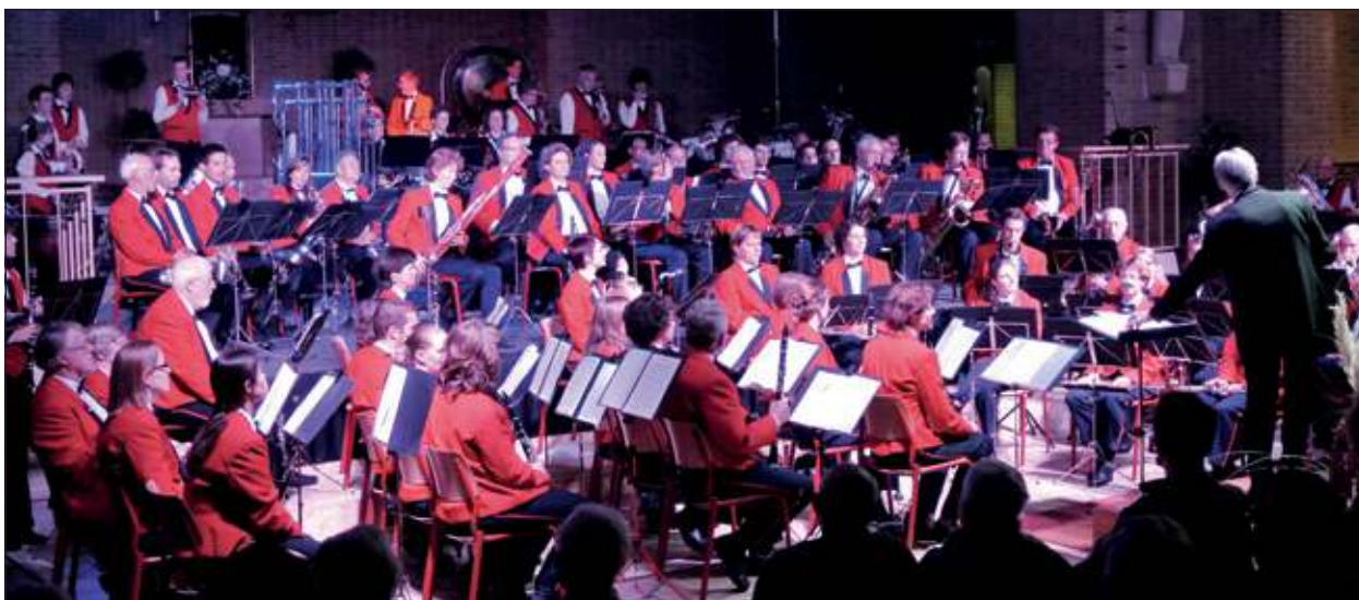
Het gezamenlijk concert van KBH en Brandweerharmonie is zo'n moment, waarop je beseft welke rijkdom onze gemeente bezit.

Zaterdagavond gaven de KBH en de Brandweerharmonie Bilthoven een uniek concert. Voor het eerst in hun bestaan speelden beide harmonieën samen. Geen spoor van rivaliteit, nee het was een muzikaal feest in een goed gevulde Michaëlkerk in De Bilt. Het zijn van die momenten dat je niets merkt van de economische tegenwind waarin ons land en ook De Bilt nu verkeert. Het zijn vooral momenten waarop je beseft welke rijkdom onze gemeente bezit.