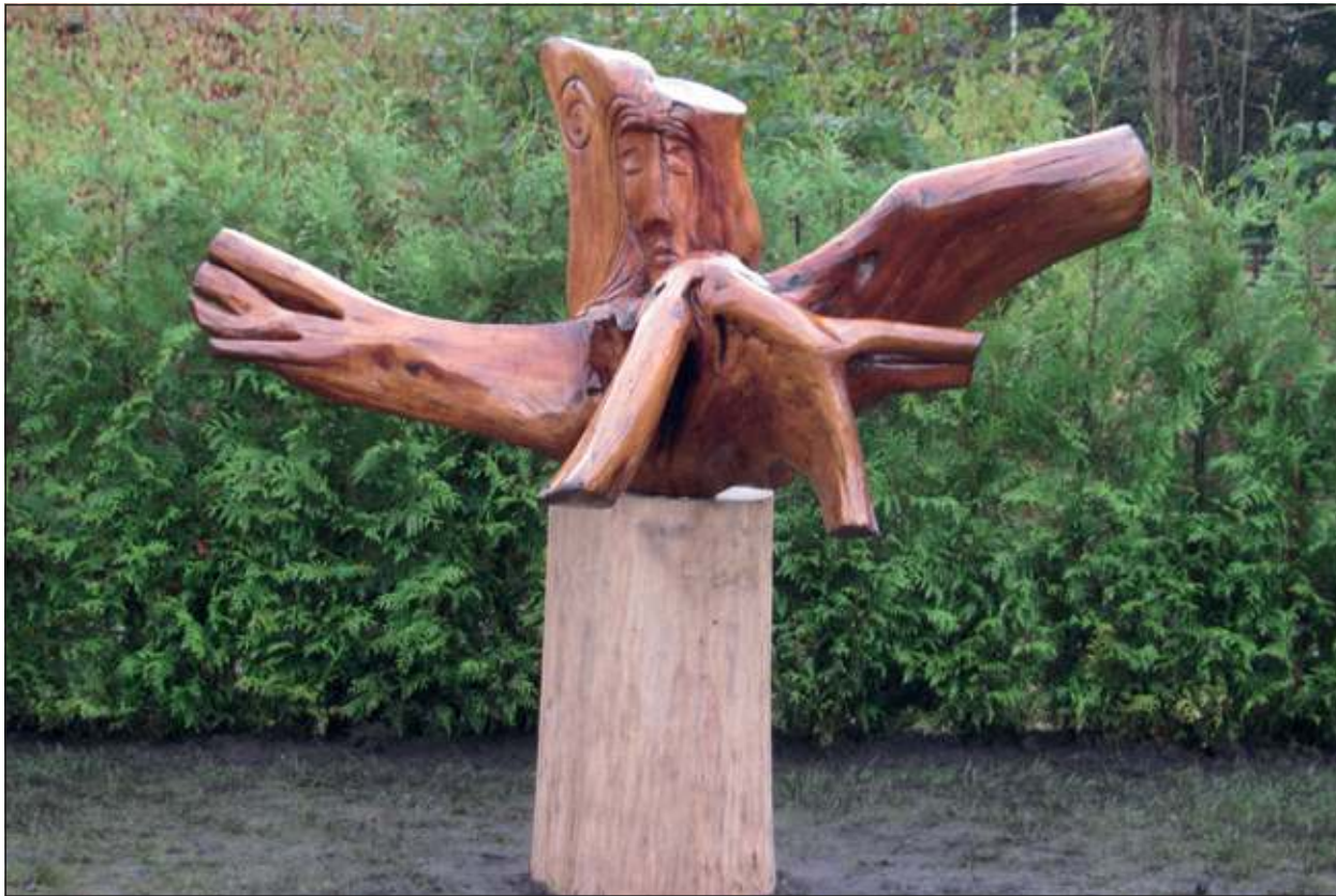
Het symbool voor Ontmoeting, Afscheid en Vertrouwen.

tig beeld dat voor ons Ontmoeting, Afscheid en het Vertrouwen in God symboliseert. Wij zijn er heel blij mee'. De begraafplaats voorziet duidelijk in een behoefte, er hebben al drie begrafenissen plaatsgevonden. De urnengraven worden op korte termijn gerealiseerd en ook aan de plannen rond het plaatsen van de urnenmuur wordt gewerkt.