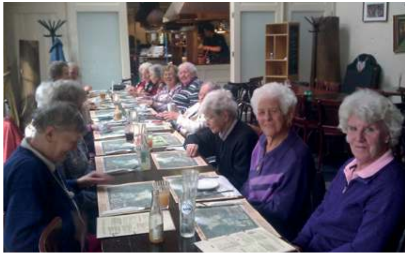
(Joke Ruiter) Gezelligheid troef aan de tafel van de Bremhorstbewoners.

De warme maaltijd in de Bremhorst werd koud bewaard of afgezegd en nu kwam er een heerlijke pannenkoek of een stapel poffertjes voor in de plaats. Er waren naast bewoners ook een verzorgende, een vrijwilliger en een stagiaire mee. En na het eten stond er nog een mooie rondrit op de agenda. De route liep door allerlei dorpjes zoals Tienhoven, Loosdrecht, Maartensdijk. En overal de mooie herfstbomen met hun kleurenpracht.