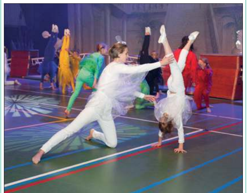
Lenigheid en symboliek kwamen samen in de jubileumshow.

Alle onderdelen van de vereniging (damesturnen, herenturnen, kidsdance, showdance, bodyfit, recreatief hardlopen, kleutergym) presenteerden zich ondersteund door professioneel licht en geluid in Olympische omgeving. De verschillende groepen vertegenwoordigden een land en hadden daarbij behorende kleding en muziek uitgezocht. De verschillende groepen vertegenwoordigden een land en hadden daarbij behorende kleding en muziek uitgezocht. [HvdB]