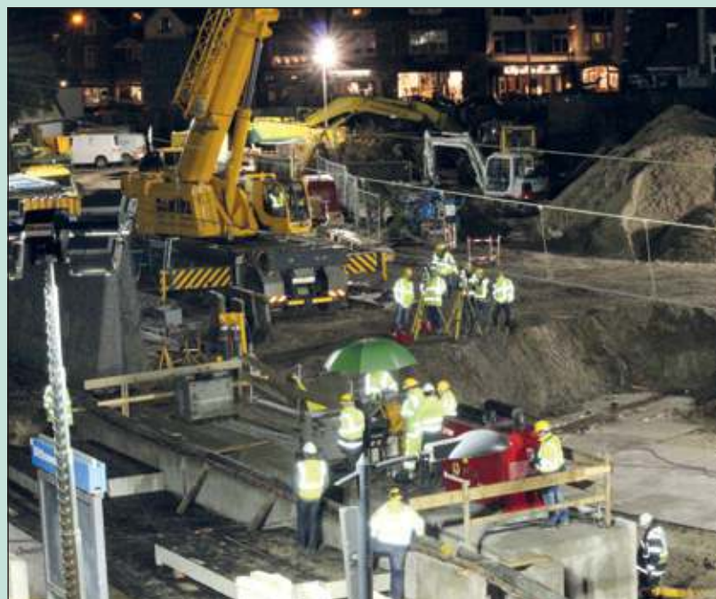
Prorail liep afgelopen zaterdag fors in op het schema.

Maarten Teunissen, Bouwmanager bij ProRail: 'Ja, het ging allemaal een stuk sneller dan gedacht. Punt bij dit soort dingen is dat het simpelweg niet te verantwoorden is om te wachten met uitvoering, je kunt de tijd later nog hard nodig hebben. Wel jammer dat veel mensen nu de activiteit niet konden volgen'.