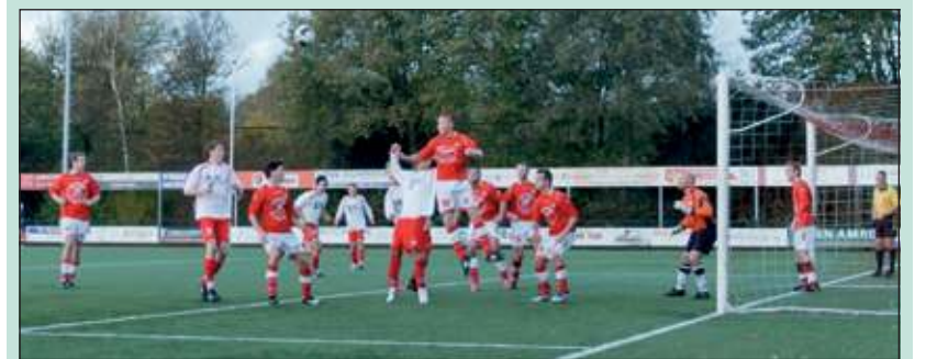
De achtse overwinning van FC De Bilt