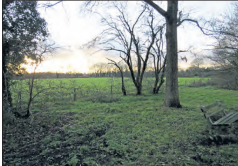
Amendementen en moties over de Schapenweide werden verworpen.