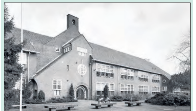
Het Nieuwe Lyceum in vroegere tijden.

Zaterdag 20 november organiseert HNL een grote reünie voor iedereen die op HNL onderwijs heeft gehad of gegeven. De reünie vindt plaats in het schoolgebouw aan de Jan Steenlaan 38 in Bilthoven. De school opent haar poorten voor alle reünisten om 15.00 uur. Vanaf 14.00 uur zijn oud- en huidige medewerkers welkom. De reünie duurt tot 19.00 uur. Momenteel zijn er 410 inschrijvingen voor de reünie. Degenen die zich nog niet hebben ingeschreven, kunnen een toegangsbewijs reserveren via de website van de school: www.hetnieuwelyceum/reunie.nl