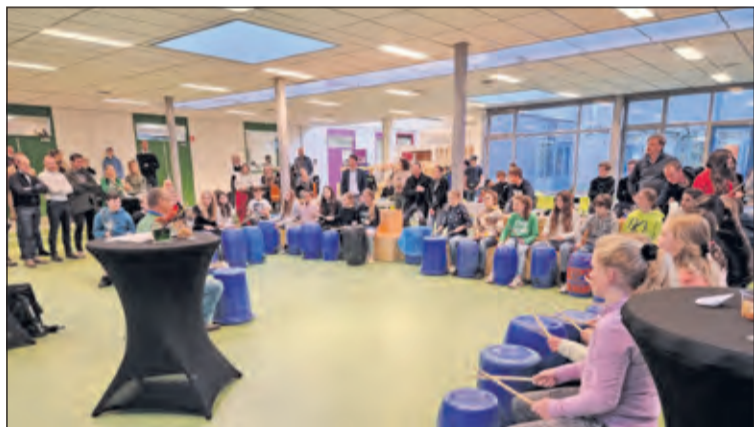
Het feest begint met muziek.

Voor de 453 leerlingen en 75 medewerkers gaat in 2024 één en ander veranderen. Casteel: 'In 2024 verdwijnen de gemengde leerweg en de theoretische leerweg. Hiervoor komt een nieuwe leerweg in de plaats, die voorbereidt op vervolgonderwijs in het mbo of de havo. In deze nieuwe leerweg doen onze leerlingen examen in vijf theorievakken en één praktijkgericht vak. Alle vmbo-scholen van Aeres zijn al bezig met de voorbereidingen voor deze nieuwe leerweg'.