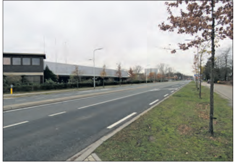
Het Hessingterrein langs de Utrechtseweg in De Bilt.

Over het spoorzonegebied zegt Smolenaers dat dit een groot plangebied is waarbij een integrale visie ontwikkeld moet worden. ‘Het gaat niet alleen om huizenbouwen. Daar is meer tijd voor nodig en er wordt pas na de verkiezingen met participatie begonnen. Het wordt nu besproken omdat we een subsi-