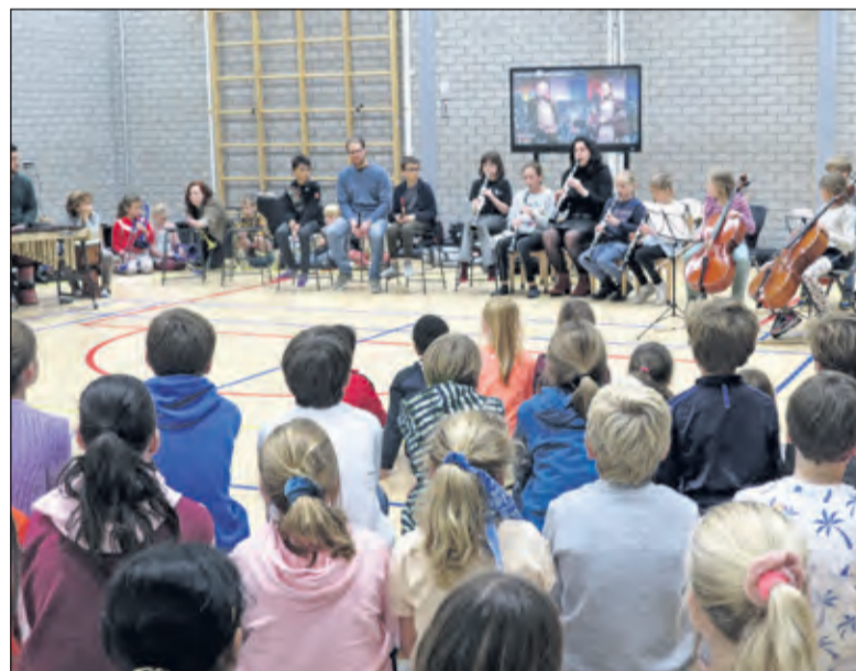
In de gymzaal werd gezongen en werden verschillende muziekinstrumenten bespeeld.