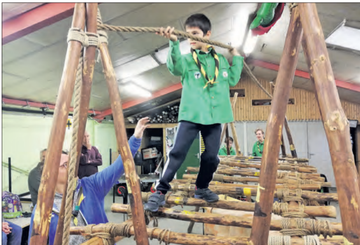
Oversteken op de speciale brug.