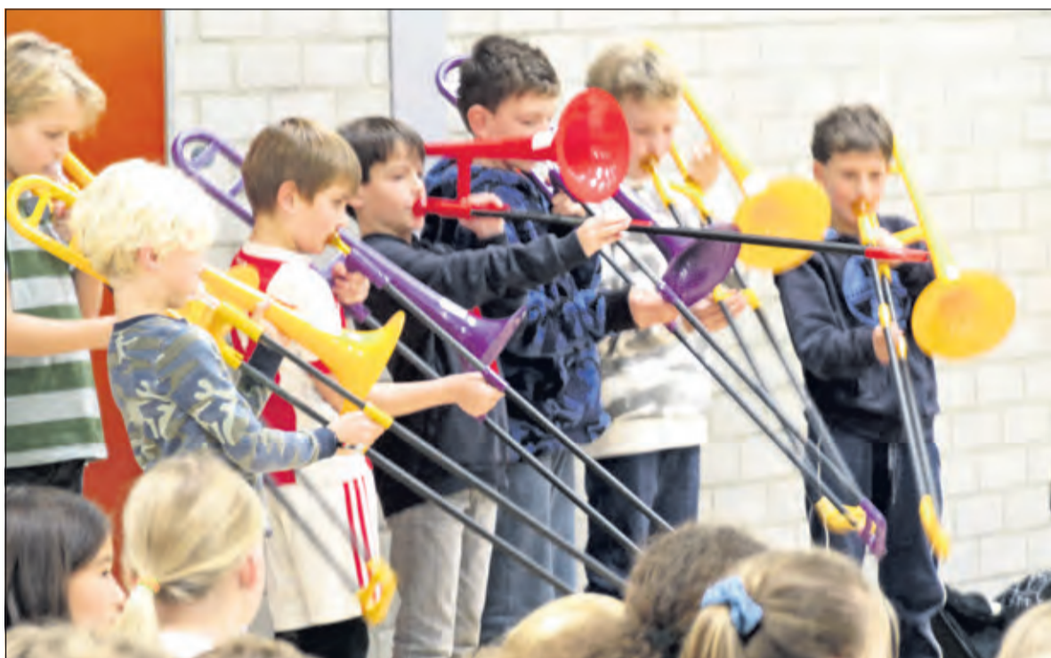
Leerlingen musiceren enthousiast tijdens de uitreiking.

groep 1 t/m 3 tot het leren bespelen van een instrument. In groep 4 t/m 7 kunnen de kinderen kiezen uit verschillende instrumenten als trombone, trompet, (melodisch) slagwerk, klarinet, cello, viool, contrabas of blokfluit. Bij de leerlingen uit de groepen 8 komt muziek terug in de musical. Dit jaar hebben onze leerlingen uit de groepen 7 meegedaan met het Korenfestival.’