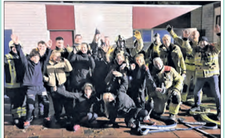
Spelers van NOVA C1 en de vrijwillige brandweer van De Bilt enthousiast over hun gezamenlijke oefening.