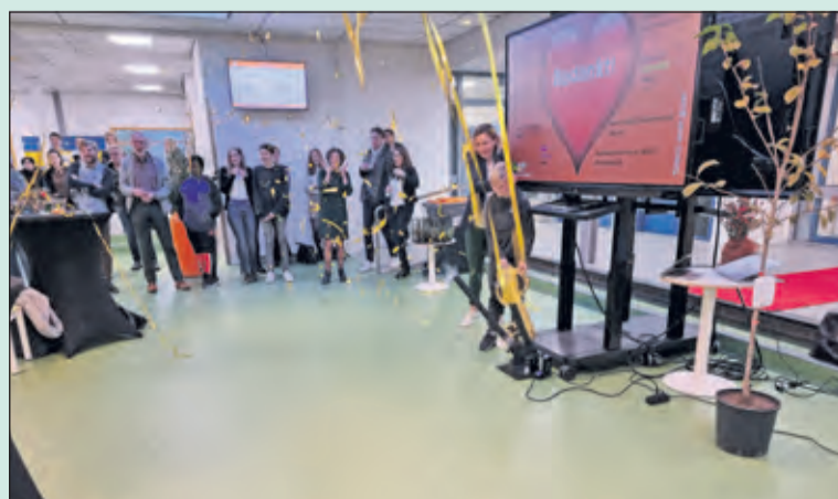
Met het afschieten van een confettikanon starten de feestelijkheden bij het vernieuwde Aeres gebouw in Maartensdijk. (lees verder op pag. 13)

In de gymzaal werd gezongen en werden verschillende muziekinstrumenten bespeeld.