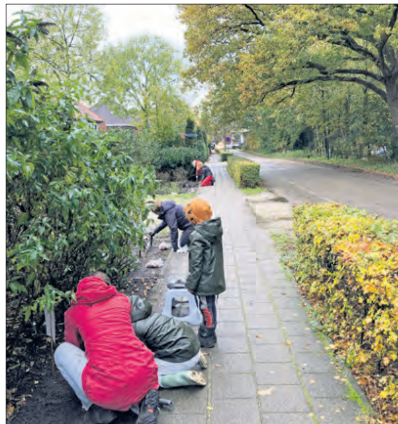
Jong en oud helpt mee met potten.