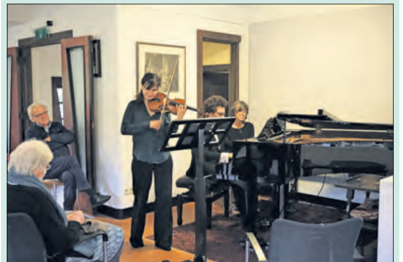
Het virtuoze spel van het duo ontlokte het publiek een warm applaus.