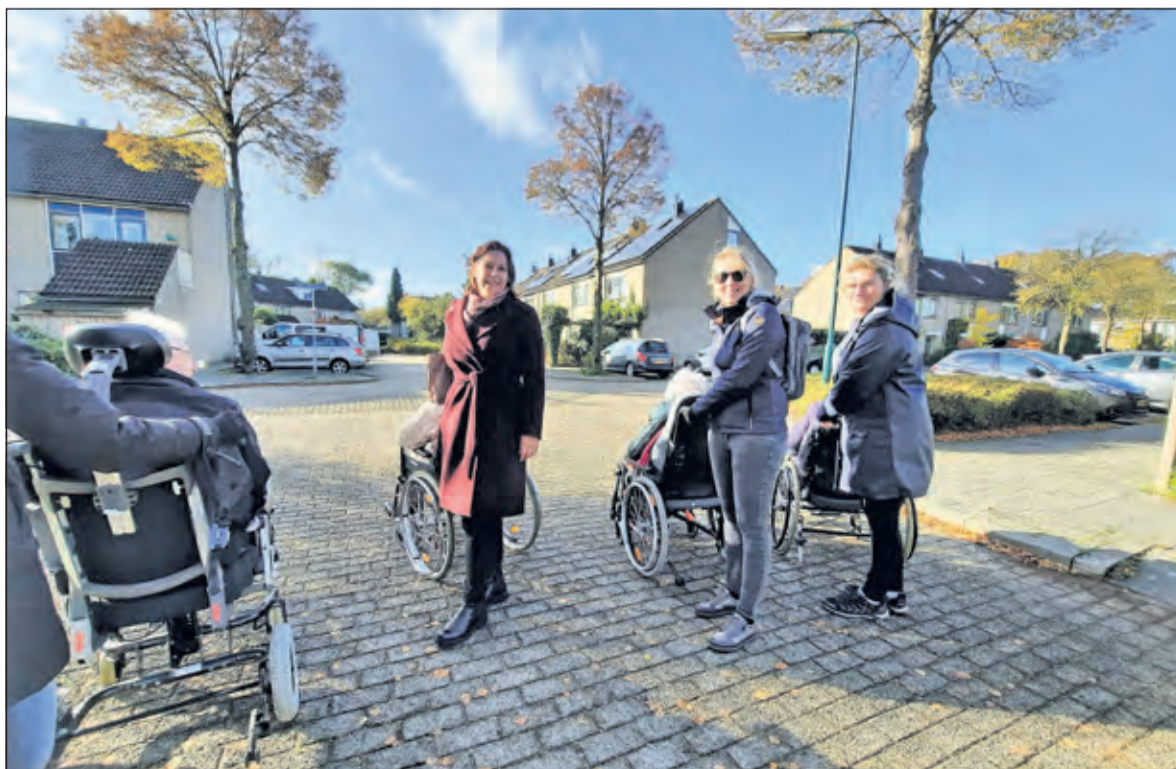
Vrijwilligers gaan met bewoners van Huize het Oosten op pad.