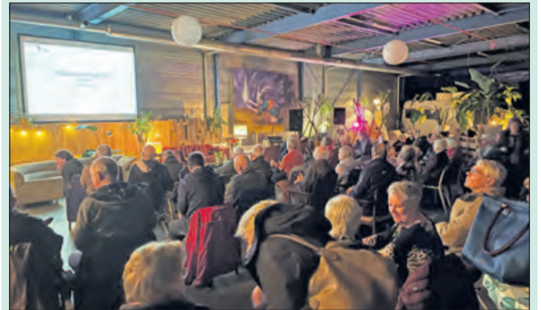
Meer dan 100 inwoners schoven aan bij de Wijkraadbijeenkomst.