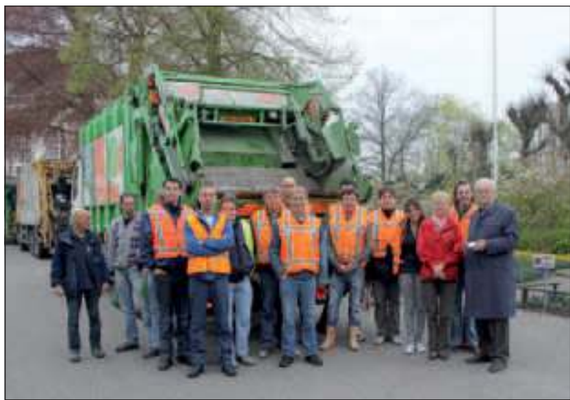
Zaterdag 16 april jl. stonden de 'werkers' alweer gereed.

inzamelen van oud papier gemakkelijker. Ik roep alle inwoners van deze gemeente op hun oud papier te verzamelen en dit op de ophaaldagen aan de weg te zetten. De (sport-)verenigingen zijn u daar zeer dankbaar voor'.