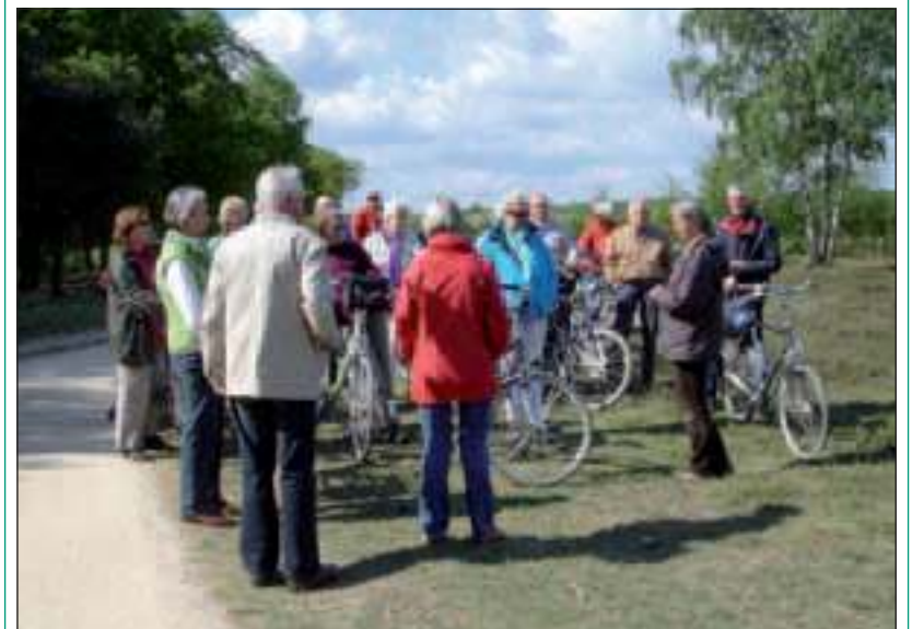
De gids vertelt over de geschiedenis van het gebied

Fietsgilde 't Gooi rijdt zaterdag 14 mei de dagtocht 'Vechtstreek Noord', vertrek 10.00 uur van Kerkbrink Hilversum (Museum) en op zondag 15 mei de middagtocht 'Dudok Hilversum', vertrek 13.30 uur van Kerkbrink Hilversum (Museum). Voor meer informatie over deze en de overige tochten van Fietsgilde 't Gooi, zie www.fietsgilde.nl