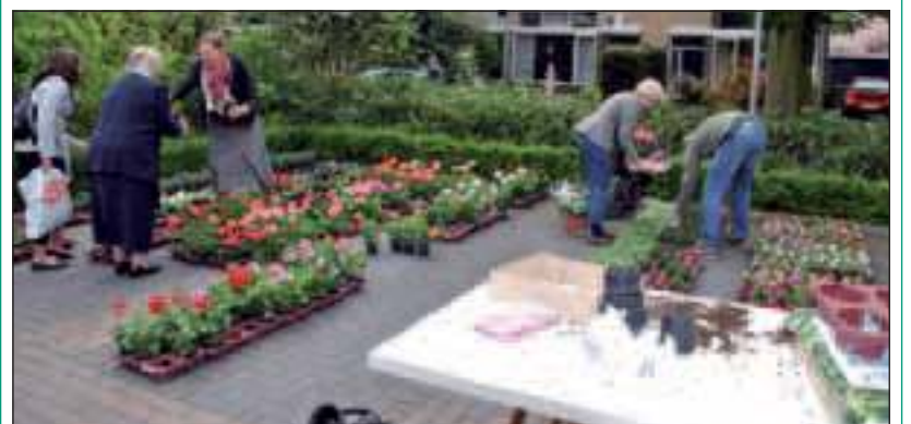
Ook dit jaar zal er weer volop zomergeod te koop zijn.

In de zaal lingeerie en ondergoed en op het buitenterrein: ambachtelijke cake, kwarkbolletjes, heerlijke worst, fruit, kaarten, enz. Er is ook gelegenheid om een kopje koffie te drinken en van een broodje hamburger te genieten. Verder is er een rommelmarkt en kan men de auto laten wassen. Ook voor de jeugd zijn er leuke spelletjes te doen. De opbrengst van deze dag is voor de schulddelging van de kerk.