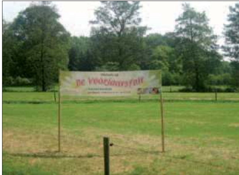
De plaats van het evenement vanaf de Dorpsweg gezien.

De organisator is de werkgroep HCR = Hulp door Christenen in Roemenie.