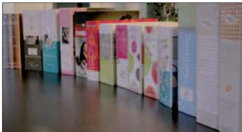
Parel Promotie beschikt over een enorme collectie standaard kaartjes.

Zeker in de eigen ontwerp sfeer ontstaan soms leuke 'series'. Veelal wordt er dan gebruik gemaakt van een bepaald thema en dat komt dan eerst bij een trouwkaart en later ook in de geboortekaartjes terug.