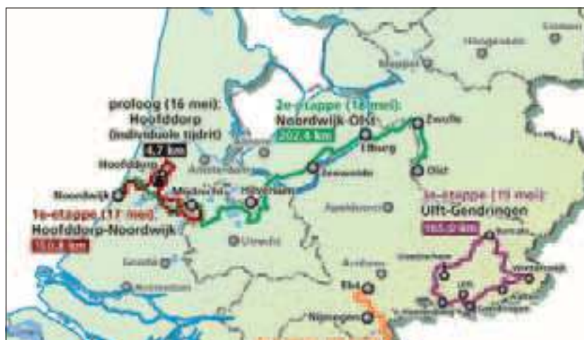
Een overzicht van de tweede etappe, die woensdag 18 mei Maartensdijk c.a. zal aandoen.

weg ter hoogte van Vliegveld Hilversum om vervolgens via de rotonde met de Utrechtseweg/N417 de route via de Tolakkerweg, de rotonde met de Maartensdijkse Dorpsweg, de Dorpsweg en de Maartensdijkseweg rond 13.24 uur linksaf op de Vuursche Steeg, de Dorpstraat en de Hoge Vuursweg in Lage Vuursche naar de Hilversumsestraatweg/N415 deze regio weer te verlaten.