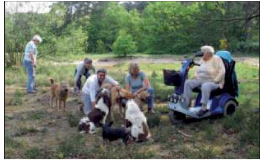
De meeste mensen die meehelpen het heideveld te schonen zijn honden-eigenaren, die een paar keer per dag in het Heidepark wandelen.

Sindsdien onderhouden omwonenden vier keer per jaar het heidegebied weer helemaal zelf, inclusief het nieuw herwonnen terrein, dat weer mooi begroeid begint te raken met