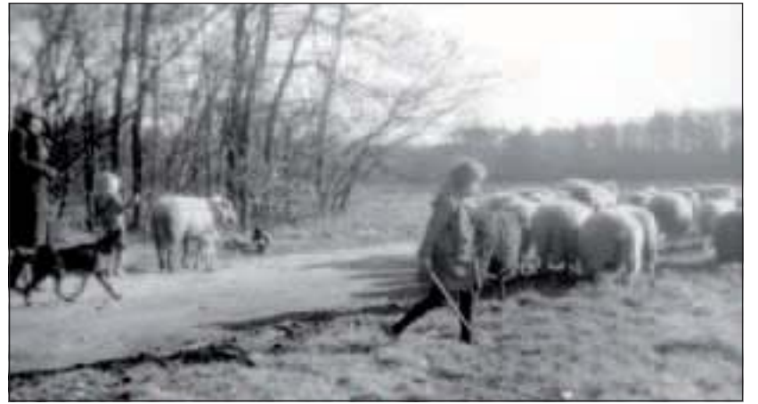
Op de Oude Gezichtslaan met Lex en Beatrijs van Boetzelaer.