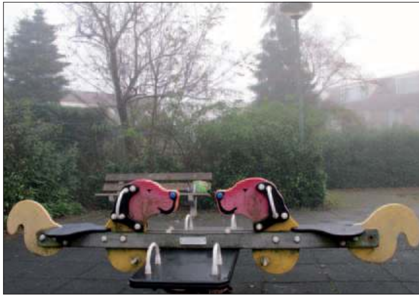
In dit speeltuintje kwam een grote groep jongeren zich in het weekend indrinken. Bewoners vragen zich af of de groep na de gebruikelijke "winterstop" opnieuw voor overlast gaat zorgen.

Het is de bedoeling dat de partijen op deze avond met elkaar in gesprek gaan over wat die nacht is gebeurd. 'Na het incident waren er geluiden dat