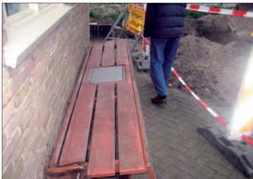
De bank moest worden weggehaald. De planken ervan staan voor en naast het Dorps huis tegen de muren.