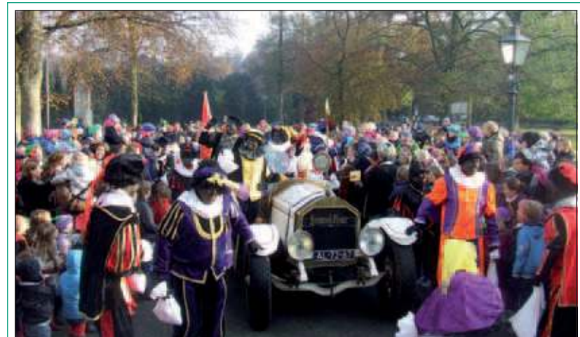
Sinterklaas was afgelopen weekend druk in bijna alle Biltse kernen. Meer Sinterklaasnieuws op pagina 15.