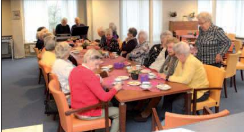
Ook in De Toutenburg aan de Maartensdijkse Kievitlaan zat maandag jl. de stemming er goed in.