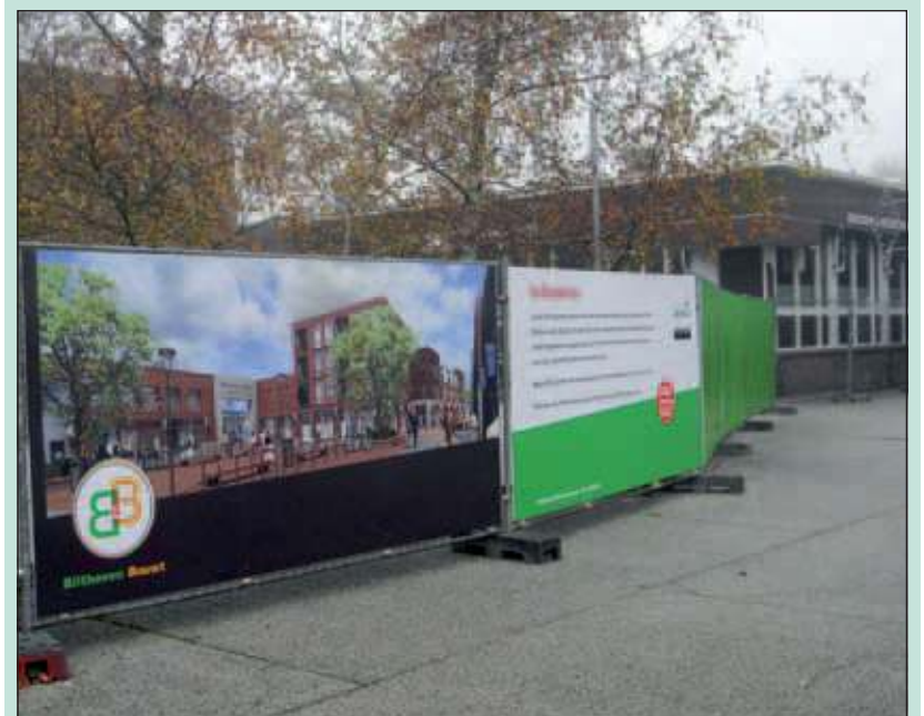
Kleurrijke panelen aan de bouwhekken.

Gedurende de hele bouwperiode kunnen belangstellenden met vragen terecht in het informatiecentrum Bilthoven Bouwt, thans gevestigd aan de Julianalaan 8. Of kijk op www.bilthovenbouwt.nl voor het laatste nieuws of een actuele planning.