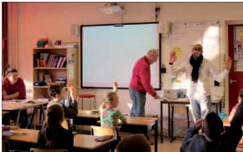
Aan de hand van vragen en voorbeelden werd Respect bespreekbaar gemaakt.