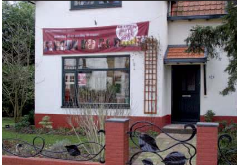
Gluren bij de Buren maakt zich op voor 2012.

Het festival wordt gehouden op 17 en 18 maart 2012 en wordt georganiseerd door de Stichting Kunst en Cultuur en het Kunstenhuis De Bilt/Bilthoven waarin ondergebracht voorheen de Werkschuit en de Muziekschool. Tijdens een optreden kunnen meestal ongeveer 20 mensen aanwezig zijn om te luisteren en op een middag zijn er 3 optredens; dus als gasthuis zullen ongeveer 20 mensen 'geplaatst' kunnen worden. Er zijn ook kleinere optredens( bijv. poëzie), deze trekken wat minder publiek en zijn geschikt voor kleinere ruimtes