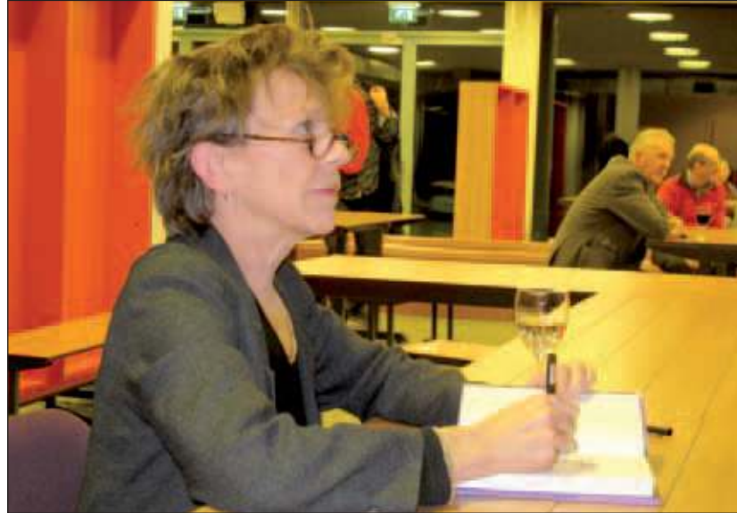
Tussen de lezing en het vragen beantwoorden door was een lange pauze ingelast, waarin Connie Palmen haar nieuwste boek signeerde. Een ellenlange rij bewonderaars nam de gelegenheid te baat voor deze korte ontmoeting met de beroemde schrijfster.

Palmen wil zich niet met de situatie verzoenen, benadrukt ze. 'Er bestaat niets dat je niet tot op zekere hoogte kunt begrijpen. Ik geloof nog steeds dat dat iets is wat literatuur kan doen.' Daarom geeft ze het rouwproces vorm in haar boek. 'Rouw is verliefdheid zonder verlossing', stelt Palmen. Ze bedoelt dat je net als bij verliefdheid je volledig overgeeft aan het gevoel en je afsluit voor al het andere. Ze verklaart waarom ze haar boek