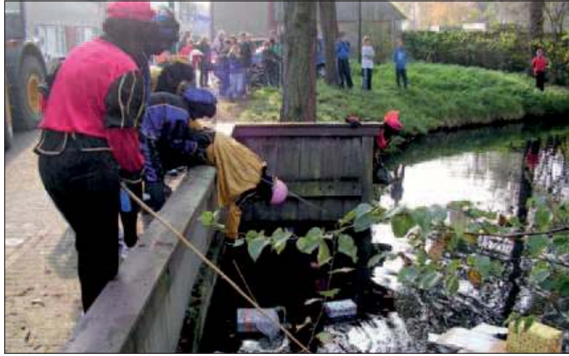
De pieten proberen de pakjes weer uit het water te vissen.

Al gauw ging het bericht rond dat Sint zich deze middag persoonlijk zou gaan bezig houden met de verbouwing van het Dorpshuis. Daar is al lange tijd sprake van maar is nog steeds niet van de grond gekomen. Vanuit richting Tienhoven kwam er inderdaad een grote shovel in zicht. In de bak zaten of lagen een paar zwartepieten, compleet met bouwhelm op. Tussen hen in een grote hoeveelheid pakjes. Achter dit voertuig dook Sinterklaas op in hetzelfde oude autootje van vorig jaar. Hij werd weer hartelijk welkom geheten door Henriette van Barneveld. Sint ging alle kinderen langs terwijl de pieten strooigoed uitdeelden.