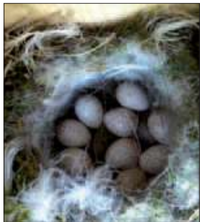
De gespikkelde eitjes.