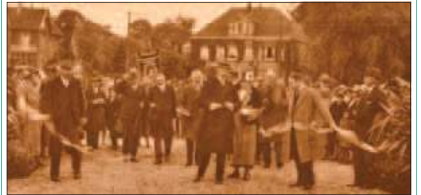
De bewuste foto van de opening in 1931.

Op 29 mei 2011, de Nationale Dag van het Park, is er van 12.00 tot 16.00 uur een presentatie met foto's van het park vroeger. Loop gerust eens langs en geniet van de foto's van toen (met dank aan de Historische Kring de Bilt en Fred Meijer die veel foto's hebben aangereikt) en van het park van nu. De foto van de opening in 1931 is er op groot formaat, ook is er een foto van het spontane feest in mei 1945. Website: www.vriendenboetzelaerpark.nl