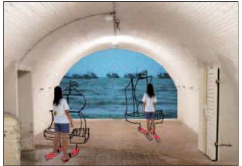
Kunst bij KAAP is nooit wat het lijkt.

KAAP wordt zondag 29 mei officieel geopend door wethouder Kamminga. Kaap en is t/m 10 juli elke zaterdag en zondag van 10.00 uur tot 18.00 uur geopend. Ook met Hemelvaart (donderdag 2 juni), vrijdag 3 juni en op Pinkstermaandag (13 juni) is Kaap geopend voor bezoek. Kijk voor meer informatie op www.kaapweb.nl .