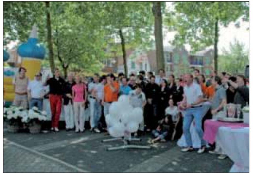
Deelnemers, leden van De Ronde Tafel en enkele sponsors poseren op het Vinkenplein vlak voor aanvang van het toernooi.