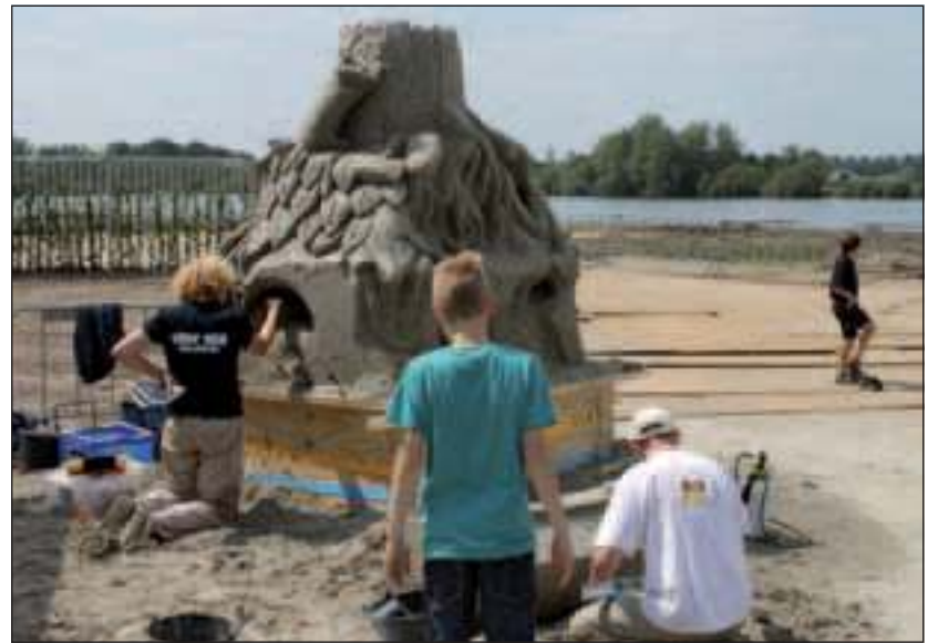
De komende weken is de zandsculptuur die tijdens de open dag door kunstenaars werd gemaakt, nog volop te bewonderen.

Dekker van de Kamp bracht ook een cadeau mee. Onder grote belangstelling werd een staande verrekijker ontuld. Wandelaars en fietsers kunnen zo de flora en fauna op de plas en de oevers van dichtbij bekijken. De dag, gezegend met mooi weer, leende zich uitstekend voor zowel een leerzaam als een aangenaam vertoeven aan het eigen water in Groenekan. De komende weken is de zandsculptuur die tijdens de open dag door kunstenaars werd gemaakt, nog volop te bewonderen.