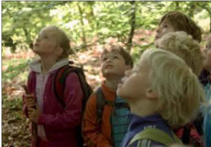
Kinderen van de Rudolfsteinerschool brachten een bezoek aan de nestkastjes.

Niet lang na Pasen is dezelfde groep vrijwilligers met ladders en fotocamera's op stap gegaan om te kijken of de kasten in gebruik zijn genomen. De kasten zijn een keer opengemaakt, wat volgens de echte vogelkenners geen kwaad kan. Het monitoren was een bijzondere ervaring! Het was leuk om te zien dat veel van de mezenkasten in gebruik zijn genomen. In bijna alle nesten zaten eieren of kuikentjes. In sommige gevallen zat er een pimpelmees te broeden die zich niet weg liet jagen. De kasten moesten voorzichtig worden geopend, want er vloog nogal eens een vogel uit. Zo nu en dan begon er zelfs eentje te blazen! In veel kastjes zaten dus al kleine pimpelmeesjes; heel aandoenlijk, kleine roze wormpjes met open, gele snaveltjes. Helaas waren