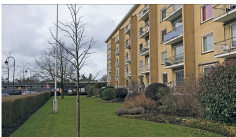
Het Julianacomplex geniet bescherming als gemeentelijk monument.

Een dergelijke afweging is aan de orde naar aanleiding van een toekomstige aanvraag voor een omgevingsvergunning op basis van de Erfgoedverordening voor de sloop van een monument'.