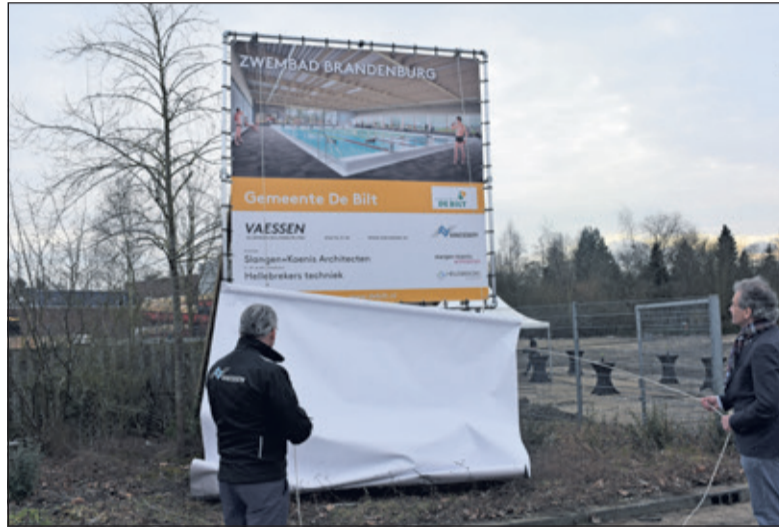
Met het verwijderen van het doek, wordt het startschot gegeven.

aan het programma van eisen: hieraan is de bouwondernemer gebonden. Vaessen BV is inmiddels geen onbekende meer binnen gemeente De Bilt. Ook de renovatie van De Vierstee in Maartensdijk heeft zij vorig jaar, tot volle tevredenheid, afgeleverd.