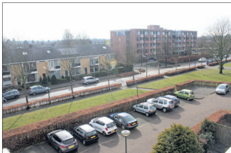
Voor de bewoners van de Vijverhof komt de inzamelcontainer aan de overzijde van de Alfred Nobellaan; deze locatie deelt men met de appartementencomplexen aan de overzijde (foto genomen vanuit het appartement van een bewoner van de Vijverhof).

In de Sperwerlaan-situatie moeten inwoners straks 'het huisvuil deponeren aan de overzijde van de Sperwerlaan, tegenover de afslag naar de Merellaan en komt de huidige (eigen) container op de parkeerplaats te vervallen. De gemeente dicteert, zonder overleg of inspraak, laat staan maatwerk; slechts de gestelde kaders tellen'. De bewoners van de Vijverhof aan de Alfred Nobellaan dienen straks een sterk daarop gelijkende voettocht te ondernemen: ook fietspaden en een drukke onoverzichtelijke weg dienen overgestoken te worden, alvorens hun huisvuil 'gestort' kan worden in een nog te plaatsen ondergrondse container nabij verzorgingshuis Weltevreden.