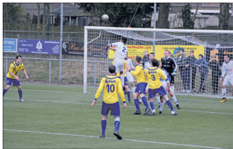
Belangstelling en betrokkenheid van alle kanten bij het doel.

de zeer belangrijke scorebordpunten naar Maartensdijk te halen; met nog zeven wedstrijden te spelen heeft Kockengen 16 punten, SVM 15 punten, Voorwaarts Utrecht 14 punten en rode-lantaarn-dragers Driebergen 11 punten.