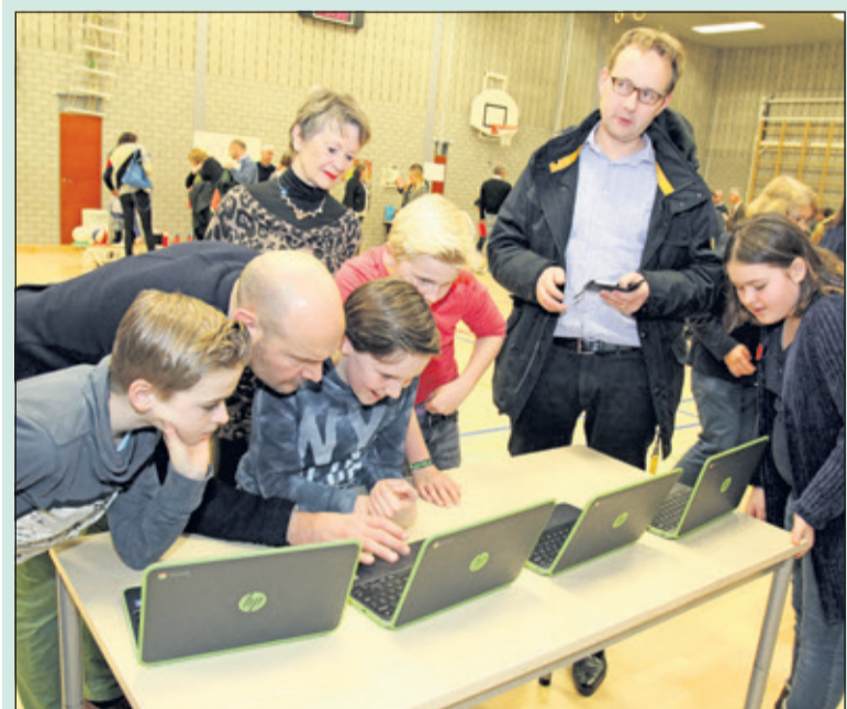
Bij het Boeiend onderwijs gaat het leren van leerkrachten en leerlingen hand in hand. Ook ouders worden hierin meegenomen.

In het Glossy-blad, waar de school aan werkt samen met de ondernemers van het Centrum van Bilthoven wil de school laten zien hoe hard men elkaar nodig heeft om tot ontwikkelen te komen. [HvdB]