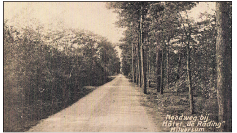
De Noodweg zo omstreeks 1910. Op de hoek Noodweg-Utrechtseweg stond toen nog hotel De Rading. Dit hotel is in de jaren '70 afgebroken en vervangen voor de huidige uitspanning.