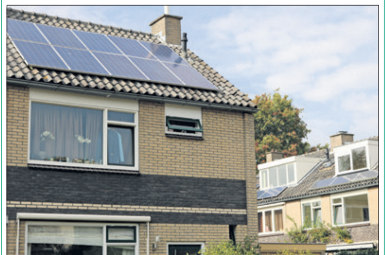
Zelf zonnestroom opwekken wordt steeds aantrekkelijker.

Energiecoöperatie BENG! organiseert op dinsdag 20 maart een informatieavond over zonnepanelen voor inwoners van gemeente De Bilt. De bijeenkomst wordt geleid door een onafhankelijk deskundige en vindt plaats in De Bilt bij één van de vrijwilligers thuis.