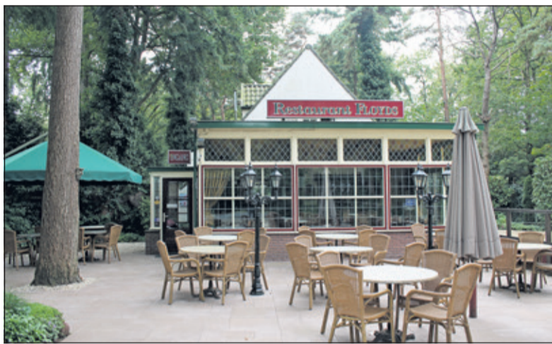
Floyds met terras in volle glorie.

'We bestaan nu 20 jaar. Daarom organiseren wij van maandag 12 t/m donderdag 15 maart van 15.00-21.00 uur open dagen, zodat belangstellenden onze sfeer kunnen proeven en kennismaken met onze mogelijkheden om speciale gelegenheden bij ons te komen vieren. Dit alles gaat onder het genot van een hapje en een drankje. Iedereen is van harte uitgenodigd op Noodweg 35 in Hilversum. We hopen dat velen ons restaurant de komende dagen zullen weten te vinden.'