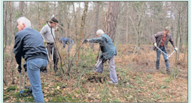
De vrijwilligers bezig met het wegnippen van boomopslag.

Veel vrijwilligers zijn 10 maart in het kader van NL Doet druk geweest met allerlei werkzaamheden op Landgoed Eyckenstein in Maartensdijk. Naast enkele vaste vrienden waren er ook enkele anderen actief.