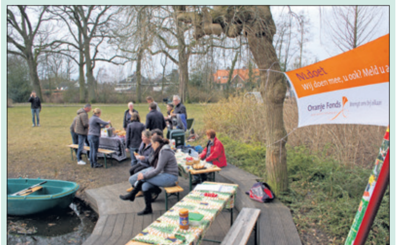
Versterking van de inwendige mens tijdens de klusdag.

Bomen werden met professioneel materiaal omgezaagd, woekerende bramentakken verwijderd, vuil opgeruimd en de boomgaard werd weer gereed gemaakt voor de lente. Ook tal van andere klussen zijn geklaard.