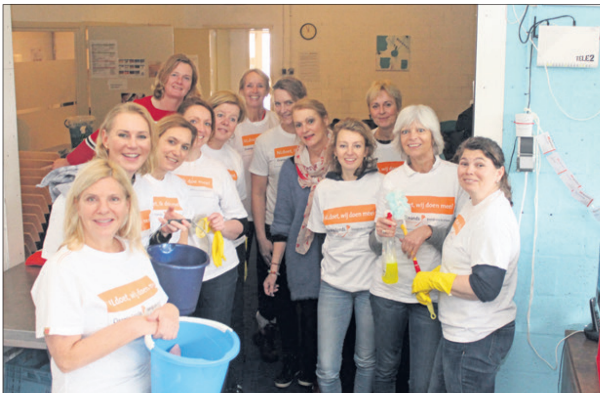
De leden van Rotaryclub Bilthoven-Zandzegge komen regelmatig in actie voor lokale maatschappelijke initiatieven. Op de diverse jaarmarkten in De Bilt worden vrijwilligers geworven voor de Voedselbank. En op zaterdag 10 maart, in het kader van de actie NL Doet kwamen maar liefst zeventien clubleden de Voedselbank onder handen nemen.