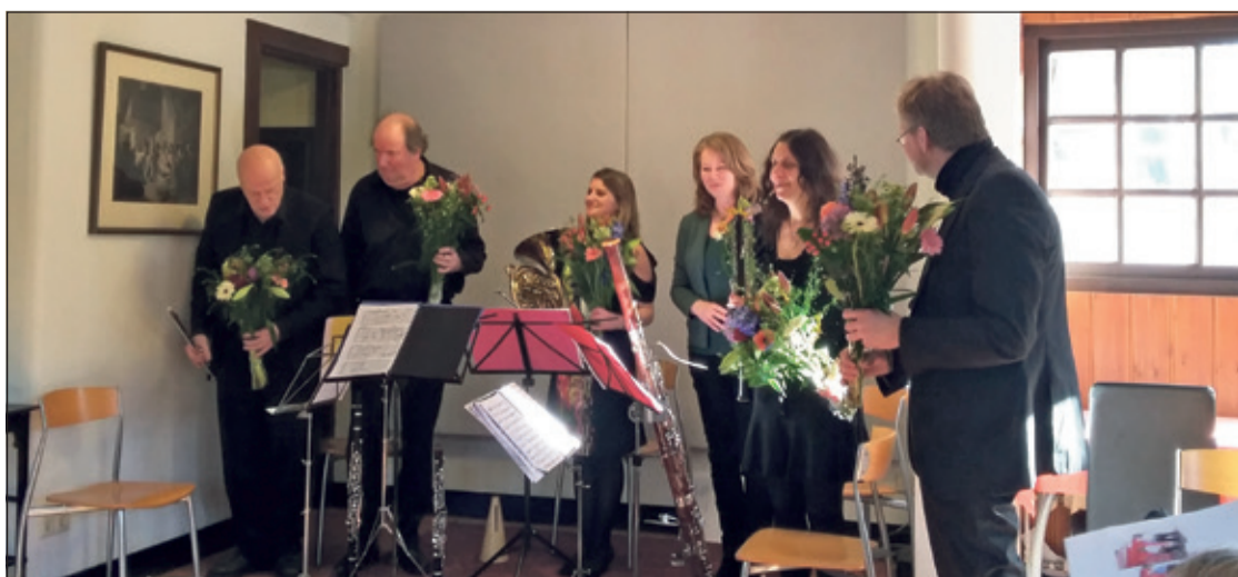
Bloemen voor Dwarl.