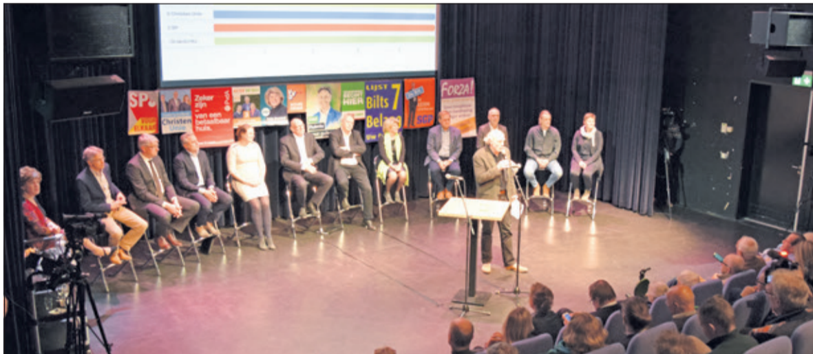
Alle lijststaandevoerders werden flink aan de tand gevoeld.

(VVD); actieplan om rattenplaag aan te pakken middels integrale samenwerking (SGP). Stelling vier: wat vinden de partijen van het nieuwe zwembad?: groter zwembad (PvdA/ SP/ SGP/); zwembad dat nu wordt gebouwd is goed; (Beter de Bilt/ CDA/ D66). Publiek in zaal: groter zwembad. Stelling vijf: meer of minder boa's?: meer boa's op straat (SP, (door OZB te verhogen en daarvan meer boa's te betalen, bijstandsgerechtigden opleiden tot boa); VVD voor meer boa's. Stelling zes: meer wegen aanleggen in De Bilt? Oplossingen zijn: meer wegen: (Bilts Belang); meer wegen betekent meer auto's, dus beter Openbaar Vervoer en meer fietsen (GL); burgers meer betrekken bij dit onderwerp (PvdA) Stelling zeven: Gemeente moet zich actief bemoeien met isolatie van huizen?: niet verplichten, wel stimuleren (CDA/ Beter de Bilt). Stelling acht: Koopzondag ja/nee?: Tegen koopzondag (CU/Forza De Bilt/ Beter de Bilt); iedere winkelier bepaalt dit voor zichzelf: (Bilts Belang); zaal (helpt voor/ helpt tegen). Het debat werd live uitgezonden door Regio TV De Bilt.