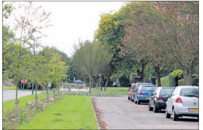
Al vanaf 2014 wordt gepleit voor het doortrekken van de Asserweg naar de Biltse Rading.

De gemeente De Bilt kan door het debacle met de Uithoflijn 1,8 miljoen euro mislopen aan subsidies voor lokale verkeersprojecten, die dit en volgend jaar op de lokale agenda staan. Dat schrijft het Biltse College naar aanleiding van schriftelijke vragen van de Biltse fractie van de VVD. Er komt een extra raadsvergadering donderdagavond 15 maart, vlak voor de gemeente-