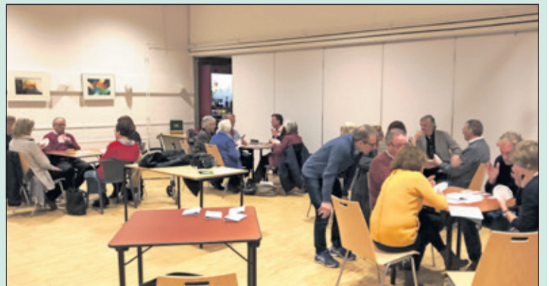
Donderdagmiddag 8 maart startte de bridgecursus voor beginners in de Maartensdijkse Vierstee. 16 deelnemers speelden, na een theoretische uitleg, gelijk al een vijftal spellen, waarbij zij aan iedere tafel vakkundig geïnstrueerd werden door geschoolde en ervaren bridgers.