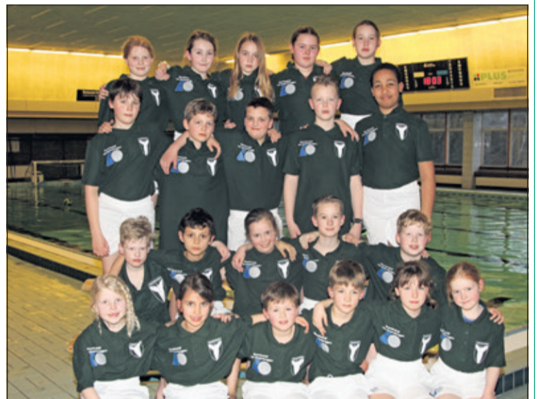
De twee jeugdteams (tot 11 jaar) van waterpolovereniging BZC Brandenburg zullen in de nieuwe shirts en broeken.