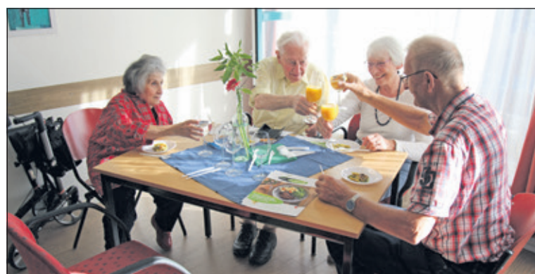
Proeven in servicecentrum Maartensdijk..

In Servicecentrum Maartensdijk wordt 4 dagen per week 's avonds samen gegeten. Voor de gasten en de vrijwilligers zijn het gezellige bijeenkomsten. Iedere dag is er weer een andere hoofdmaaltijd en een nagerecht. Donderdag 27 sept. was er een goed bezochte proeverij in de ontmoetingsruimte van het servicecentrum. Meer info via tel 0346 214161 of servicecentrummaartensdijk@mensdebilt.nl .