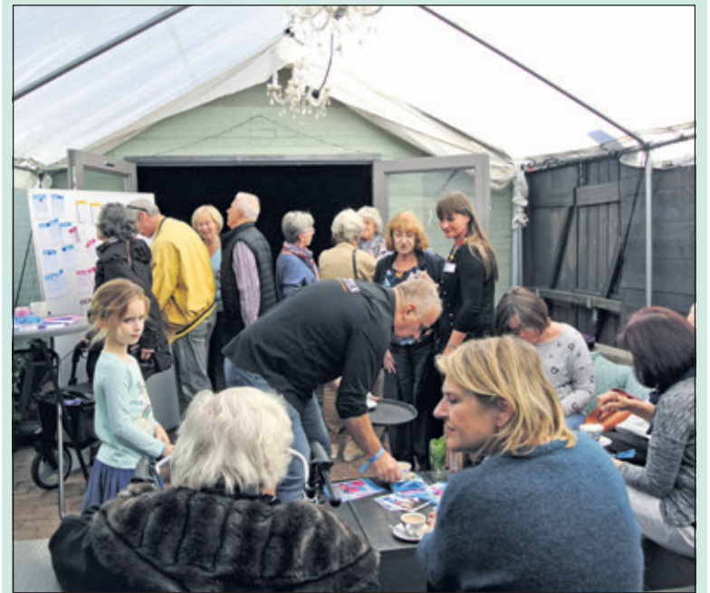
Samen leuke dingen doen start in een café.