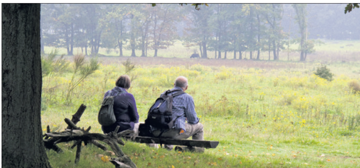
Utrechts Landschap werft nieuwe Beschermers om natuur in de provincie blijvend veilig te kunnen stellen.

Utrechts Landschap startte dit weekeinde een wervingsactie voor nieuwe Beschermers. Juist in deze tijd van het jaar trekken veel mensen erop uit om te genieten van een herfstwandeling in de natuur. In de provincie heeft Utrechts Landschap zo'n 5.000 hectare natuur veiliggesteld. De stichting wil daar met de steun van nieuwe Beschermers de komende jaren nóg 500 hectare natuur aan toevoegen.