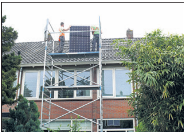
Zonnepanelen plaatsen op huis in De Bilt.

WVT-gebouw, Talinglaan 10, Bilthoven, 11 oktober, start 19.30 uur, inloop 19.00 uur.