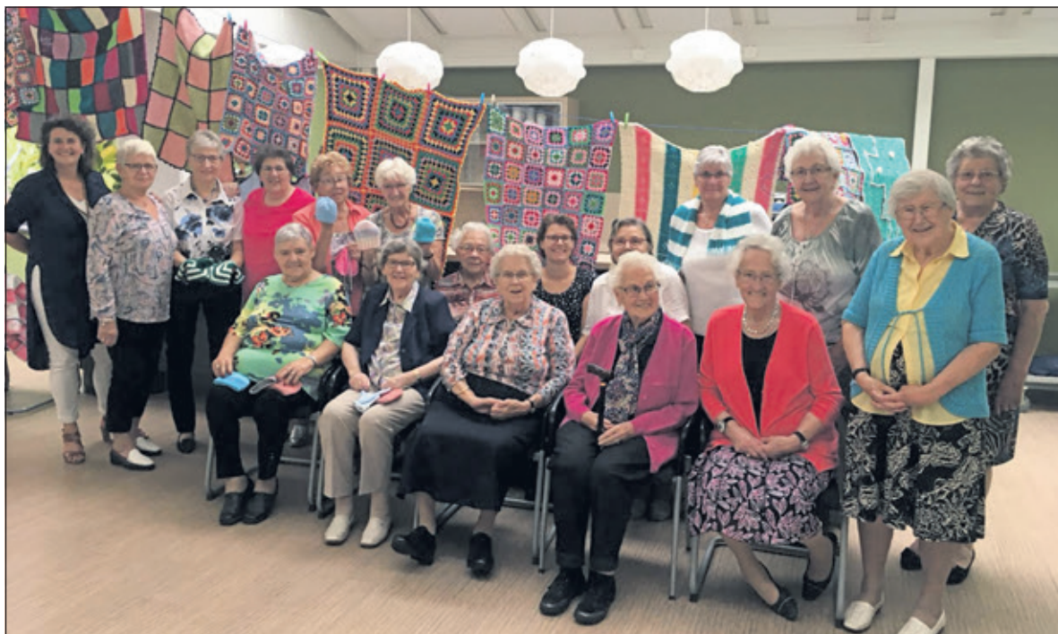
De stichting is ontzettend blij met de dames van de breigroep in Dijkstate. De productie van de dames is hoog. Achter de dames hangen de dekentjes die aan de stichting Babyspullen geschonken worden.