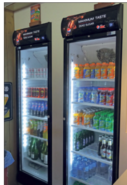
Energie slurpende koelkasten zijn vervangen door energiezuinige inbouwkoelkasten.

Energie besparen door verenigingen met een eigen accommodatie is een kwestie van