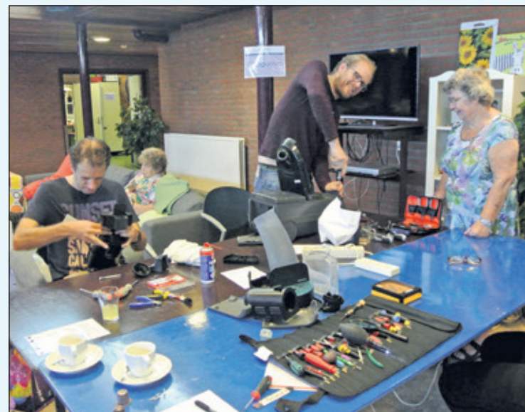
Het Repair Café wordt georganiseerd door Transition Town de Bilt in samenwerking met welzijnsorganisatie WVT.

Op zaterdag 6 oktober is er Repair Cafe bij de WVT in Bilthoven Talinglaan 10 in Bilthoven, van 11.00 tot 15.00 uur, waar kapotte spullen gerepareerd worden met hulp van ervaren reparateurs.