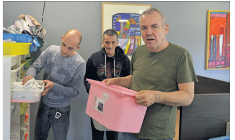
Het sorteerteam van de Arbeidscentrum van Reinaerde Maartensdijk is druk bezig.

Bij Reinaerde wordt een sorteerslag gemaakt op soort kleding, ontbreken van knoopjes en of de kleding niet kapot is. Er wordt ook op rein-