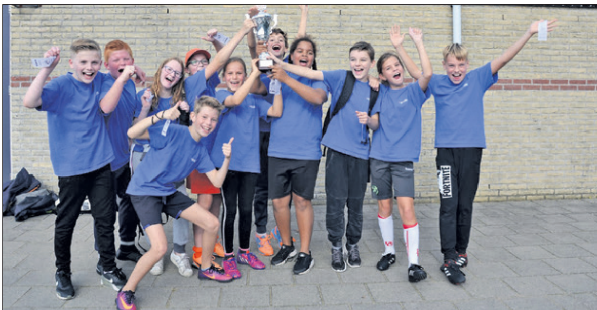
De wisselbeker voor groep 7 en 8 is veroverd door de Martin Luther Kingschool.