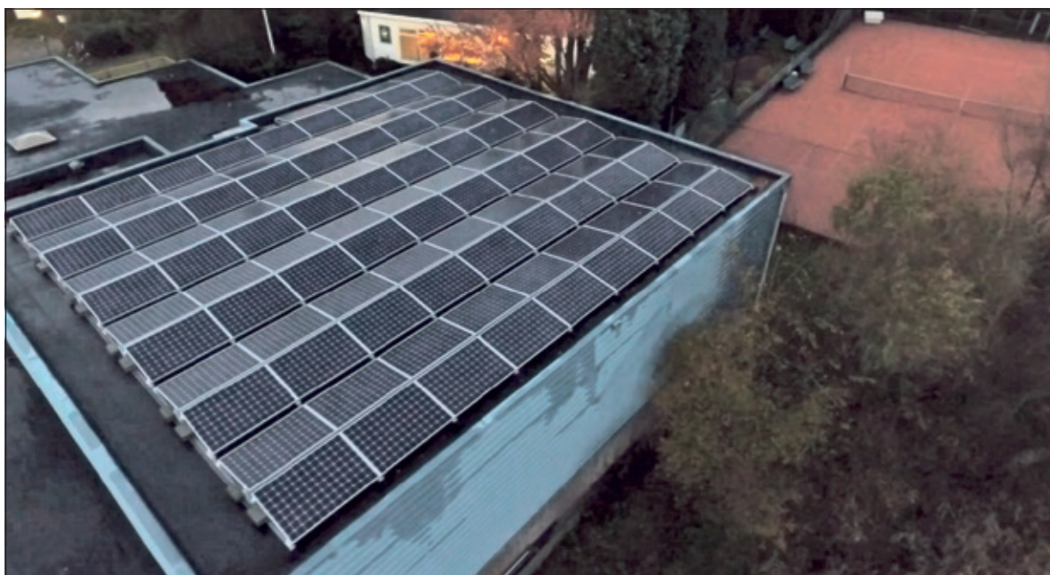
Op het dak liggen sinds een half jaar 103 zonnepanelen.

Het samen met Transition Towns georganiseerde Repair Café sluit daar naadloos op aan: wat stuk is, kan vaak gerepareerd worden. Weggooien kan altijd nog. Het eerstvolgende Repair Café vindt plaats op 6 oktober. Tussen 11.00 en 15.00 uur kun je naast het (laten) repareren goederen tevens deelnemen aan de workshops KlimaatGesprekken. [HvdB]