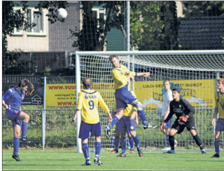
SVM was gedurende de gehele wedstrijd de bovenliggende partij.

Aanstaande zaterdag is er al met al gelijk al sprake van een heuse topper, wanneer SVM naar het eveneens ongeslagen boven-aan-standende EDO (U) aan de Manitobadreef (8) mag afreizen.