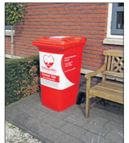
Vanaf september 2016 is er in Maartensdijk bij Familie de Jong op Drakensteyn 37 een inzamelpunt van Stichting Babyspullen gevestigd.

Voor informatie over de landelijke Stichting Babyspullen zie de website: www.stichtingbabyspullen.nl .