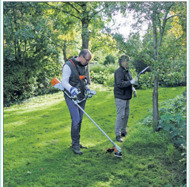
Zaterdag staken vrijwilligers de handen uit de mouwen om dit mooie park een maandelijkse onderhoudsbeurt te geven. Gras in de boomgaard werd gemaaid. Bomen en struiken gesnoeid. Enkele nieuwe vrijwilligers hadden zich aangemeld. En natuurlijk was er weer een pauze met koffie, thee en versnaperingen. (Frans Poot)