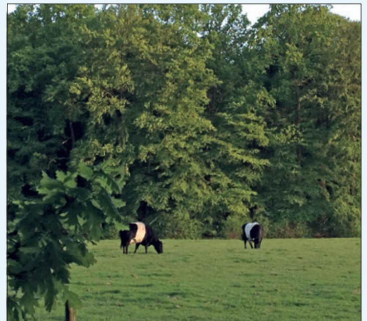
Een duurzaam De Bilt creëer je mét elkaar.

ontmoetingen tussen bedrijven en maatschappelijke organisaties om een positieve bijdrage te leveren aan de Biltse samenleving. Organiseert nu mede de Week van de Duurzaamheid.