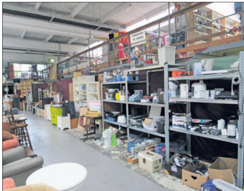
Bij kringloopwinkel Emmaus Bilthoven krijgen spullen een tweede kans.

We willen ongeveer drie projecten realiseren. Toen we begonnen dachten we jaarlijks vijfduizend euro binnen te halen en nu is dat al voor het derde jaar het dubbele. We hebben een honderdtal supporters die ons steunen en werken samen met de Werkplaats. Ook Emmaus is ons altijd goed gezind en we zijn nog met andere sponsors bezig. Met bedragen tussen de 3500 en 5000 euro kunnen we daar het verschil maken. Het is een enorme