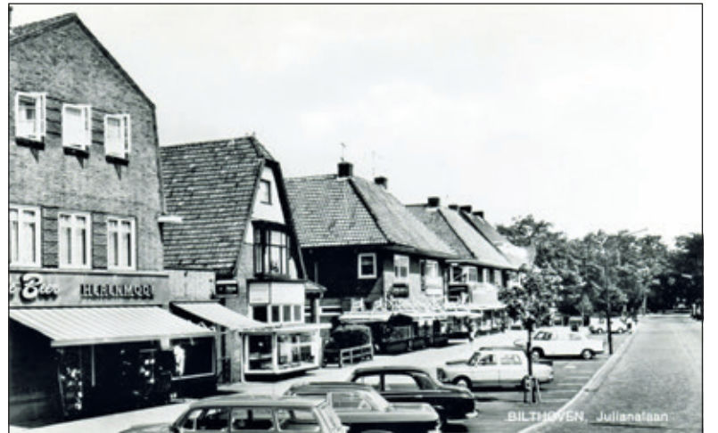
De Beer Herenmode aan de Julianalaan 57. (foto 1969 uit de digitale verzameling van Rienk Miedema)

ratie. Betty is geheel autodidact; dat wil zeggen dat ze gewoon aanleg had en dat met de juiste begeleiders heeft ontwikkeld. In het verleden gaf ze aan de Vrouwen van Nu in Maartensdijk nog wel een schilder-cursus.