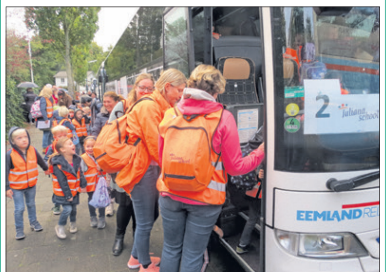
Het instappen gebeurt heel gedisciplineerd.