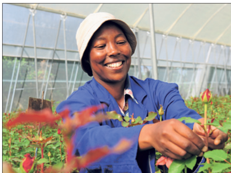
Rozenkwekerij Bilashaka in Kenia.

en de omgeving. In haar presentatie zal zij ook ingaan op de oplossing die Bilashaka Flowers heeft gevonden om het watergebruik sterk terug te dringen. De bijeenkomst begint om 16 uur en de toegang is gratis. Wel wordt ieder die wil komen, verzocht zich van tevoren telefonisch aan te melden (030 2200112). Bouwman Boeken zorgt voor fairtrade koffie/thee, de Werkgroep Fairtrade voor sap uit de Wereldwinkel en BonbonMargo voor iets lekkers daarbij. Na afloop ontvangt elke bezoeker een Fairtrade roos van Bloemenboutique Fonville.