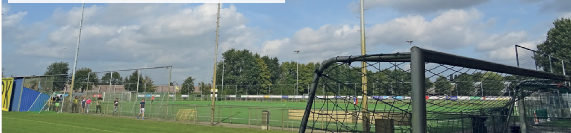
Een grote wens van SVM is lichtmasten met ledverlichting.

Voetbalvereniging SVM uit Maartensdijk heeft in drie jaar tijd al veel duurzaamheids-maarteregelen genomen. Voorzitter Frans van de Tol draait er niet omheen dat bezuinigingsmaatregelen de aanjager zijn geweest om ook goed naar duurzaamheidsmogelijkheden te kijken waardoor het mes aan twee kanten snijdt.