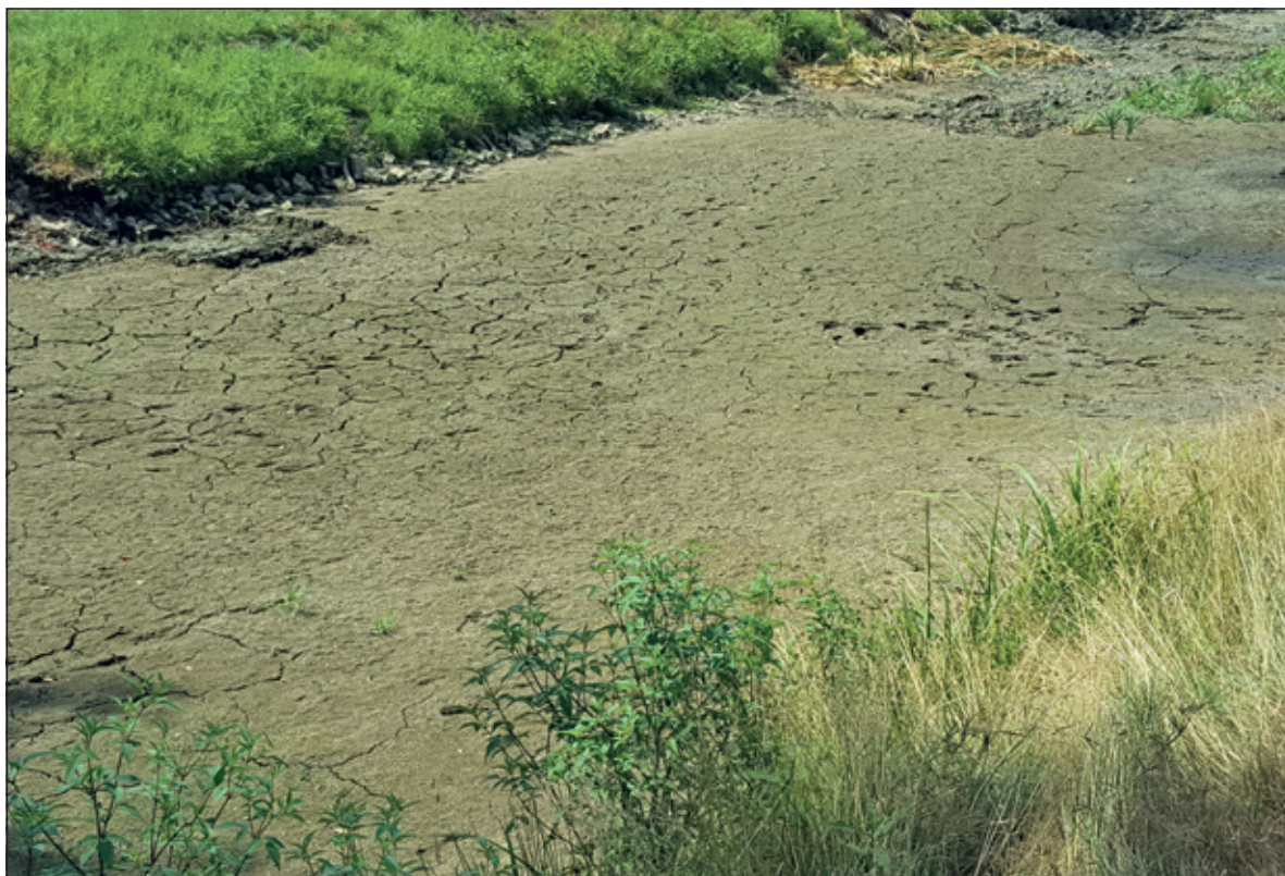
Afgelopen zomer kende extreme droogte.

Het klimaat verandert al miljoenen jaren continu, onder invloed van natuurlijke factoren. Vulkaanuitbarstingen, El Nino, een wisselende hoeveelheid zonlicht. Vanaf de jaren '50 speelt echter de mens de grootste rol, dankzij de uitstoot van vooral broeikasgassen als methaan en koolstofdioxide.