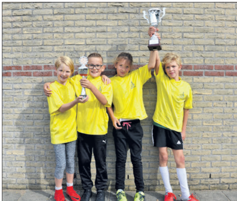
De winnaar van de wisselbeker voor groepen 5 en 6 is 't Kompas geworden.

Lijkt korfbal je leuk ga dan eens een keertje mee met een al korfbalend klasgenootje. Iedereen mag 4 keer gratis mee trainen op de TZ-velden. Kijk op de website voor de trainingstijden. www.tweemaalzes.nl . Voor de kinderen van 4 t/m 6 jaar is er 'training' in spelvorm (Kangoeroetjes) op zaterdag van 9.30 tot 10.30 uur. Voor de kinderen van 7 t/m 9 jaar (Pupillen) en ouder is er door de weeks een training en op zaterdag een wedstrijd.