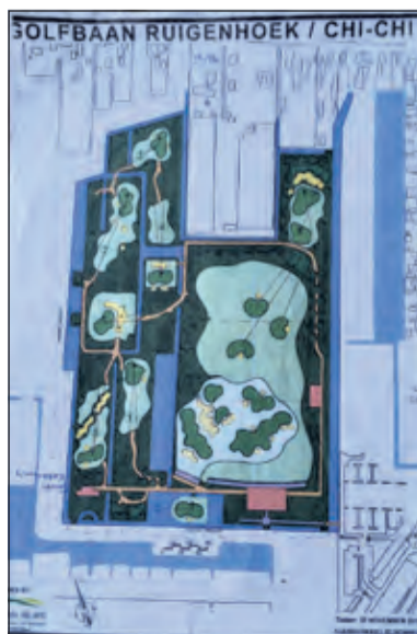
Een overzichtstekening met de verontrustende plannen.

is om UNESCO werelderfgoed te worden. O.a. de gemeente De Bilt heeft de verantwoordelijkheid voor het voortbestaan en de bescherming van de natuurwaarde van het gebied. Dit Chi-chi concept komt in de verste verte niet overeen met wat er in het bestem-