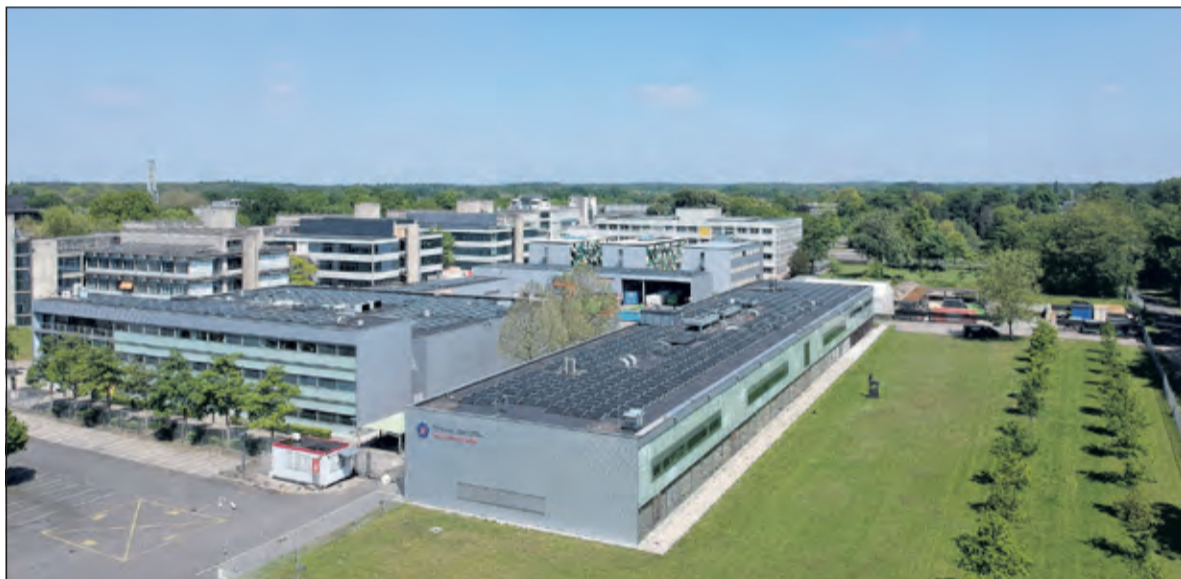
Veel zonnepanelen op de daken van het RIVM.