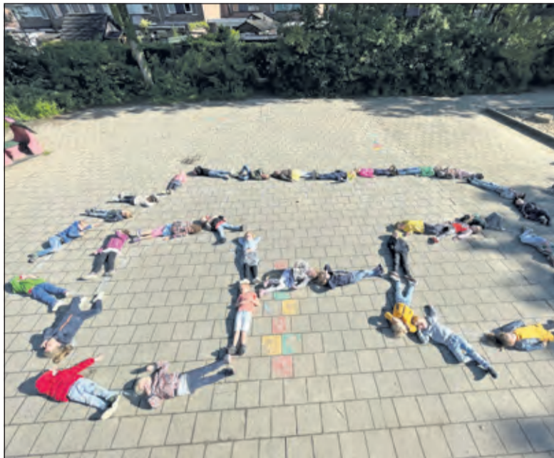
Leerlingen beelden een auto uit.