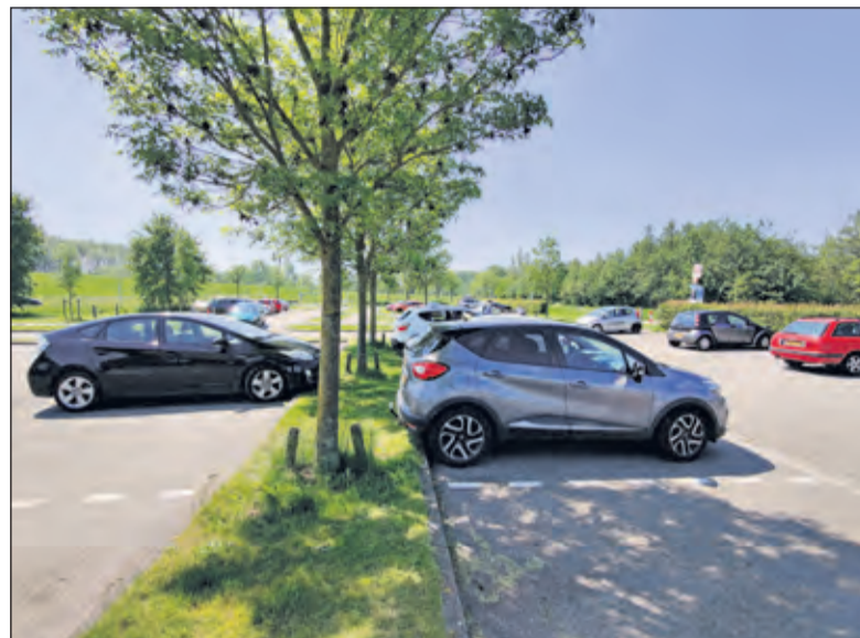
Op de parkeerplaats is het in het weekeinde vooral 's ochtends druk sinds corona.

'Dat betekent kleinschalige horeca voor de gebruikers van het park, wandelaars, fietsers en golfers. Het park is onderdeel van de groene buffer tussen Utrecht en Hilversum. Het gebied maakt onderdeel uit van het Groene Hart en de Nieuwe Hollandse Waterlinie, het grootste rijksmonument van Nederland, dat genomineerd