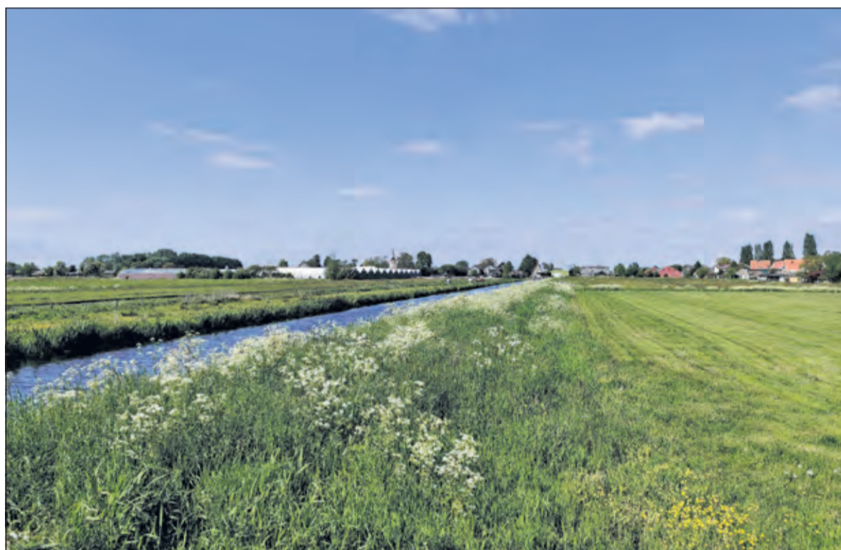
Golfbaan en partycentrum staan hier gepland.