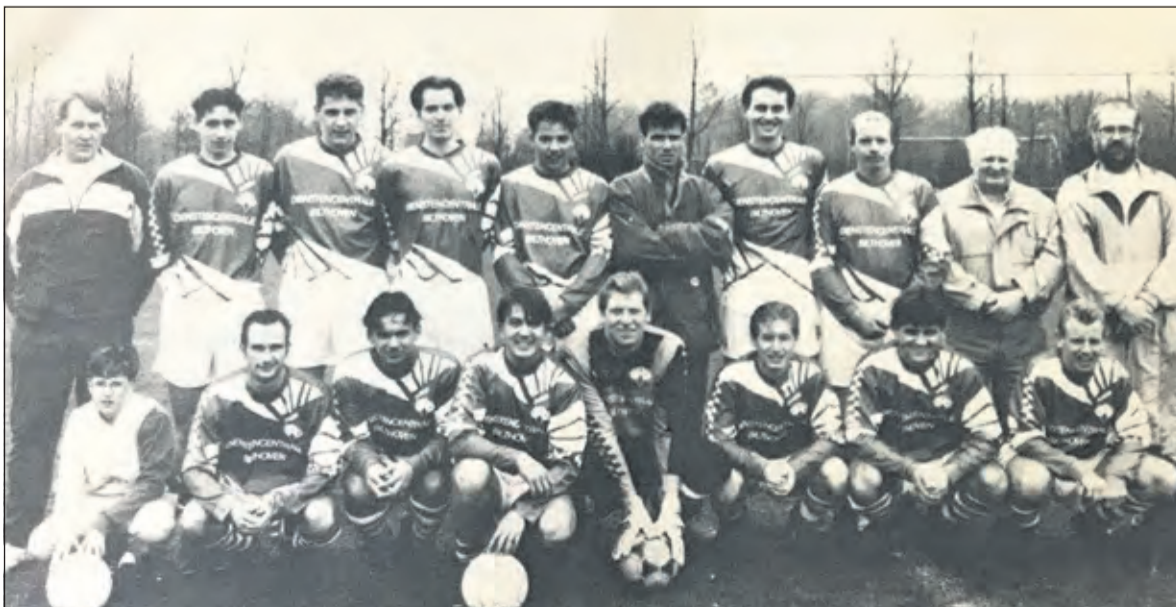
Zaterdag 24 juli 1993 speelde FAK op sportpark Weltevreden tegen Feijenoord.

De verenigingskleuren oranje zwart zijn eigenlijk bij toeval tot stand gekomen; bij één van de leden de heer G. Slot (hij was administrateur van het ziekenhuis Berg en Bosch) lag op zolder nog een grote oranje zwarte vlag van een organisatie van voor de oorlog, die niet meer was heropgericht. Een zichzelf respecterende vereniging behoorde in die dagen een vlag of vaandel te hebben. Om kosten te besparen was dit de oplossing; deze vlag zou de vlag van RKS V Bilthoven worden en oranje en zwart werden de clubkleuren'.