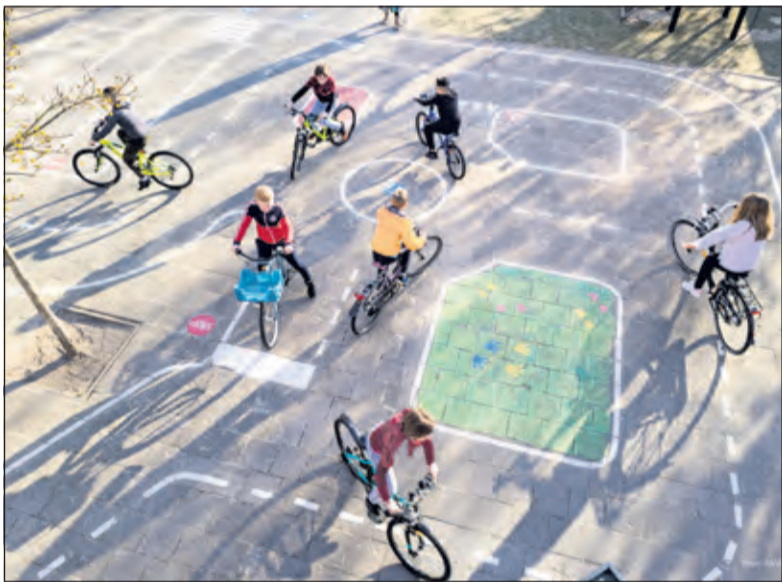
Zo ziet een ANWB verkeersplein eruit.

In totaal zijn er in Utrecht 14 scholen die kans maken op het ANWB Verkeersplein. Om het ANWB Verkeersplein te winnen, wordt per provincie de top drie scholen met de meeste stemmen voorgelegd aan de Adviescommissie van het ANWB Fonds. Hierbij wordt ook rekening gehouden met de grootte van de school. Op basis van het aantal stemmen en de motivering op het aanmeldformulier, bepaalt de Adviescommissie uiteindelijk wie er wint. De winnaars worden op 21 juni geïnformeerd, waarna het ANWB Verkeersplein tussen 5 juli en 10 september wordt aangelegd. Na de zomervakantie wordt het plein feestelijk geopend. Gun je Maartensdijk een ANWB Verkeersplein? Stem dan tussen 21 mei en 10 juni via anwb.nl/verkeerspleinen .