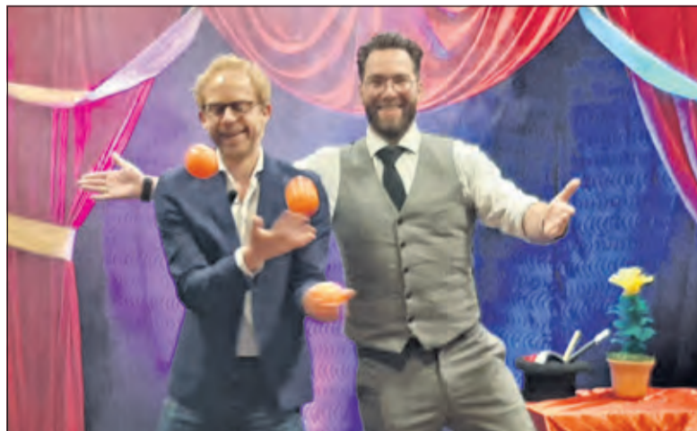
Theater in het zorgcentrum. Met hulp van verschillende vrijwilligers waren er deze middag 3 shows.