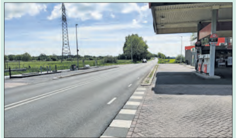
Het gaat om het gedeelte tussen de rotonde Achterweteringseweg en de aansluiting bij de A27.

Het aanbrengen van ontbrekende bermverharding langs provinciale wegen is een van de maatregelen die de provincie Utrecht neemt om de verkeersveiligheid te verbeteren. Een verharde berm vergroot de 'vergevingsgezindheid' van een weg. Als automobilisten onverhoopt buiten de rijbaan terecht komen, krijgen zij via de verharde berm de kans om hun koers veilig te corrigeren. [HvdB]