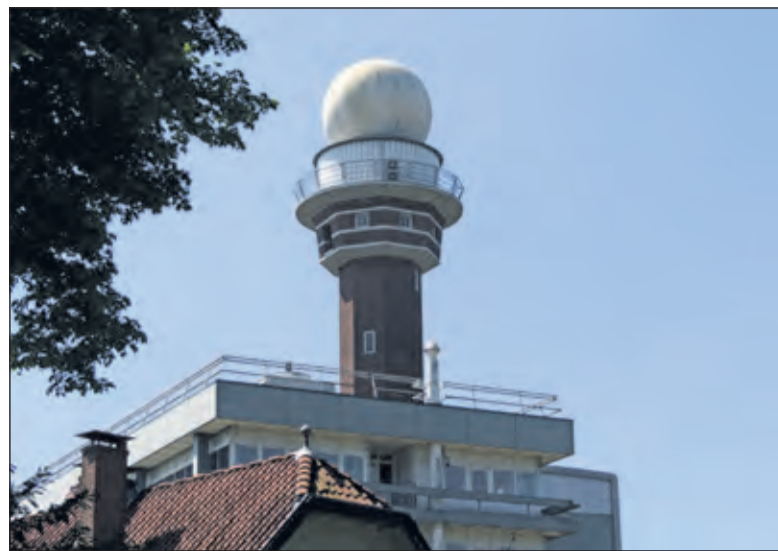
Het KNMI in De Bilt doet veel onderzoek naar klimaat.