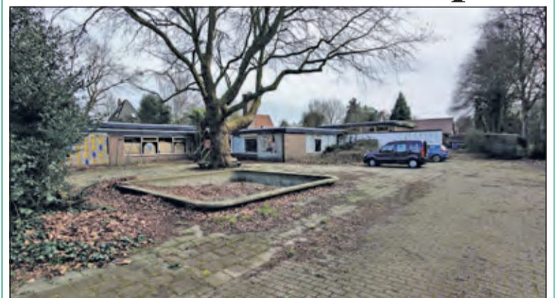
Het oude schoolgebouw van De Nijepoort is een van de 7 gebouwen in De Bilt die op de nominatie staan voor circulaire sloop. Dat houdt in dat de materialen voor hergebruik aangeschaft kunnen worden. Het geeft ook de mogelijkheid tot aanschaf van souvenirs, wellicht uit nostalgisch oogpunt de kapstok of de wc-rolhouder uit je oude basisschool. In week 25 zijn er kijkdagen in De Nijepoortschool, zie debilt.nl/wonen-en-bouwen/projecten voor meer informatie.