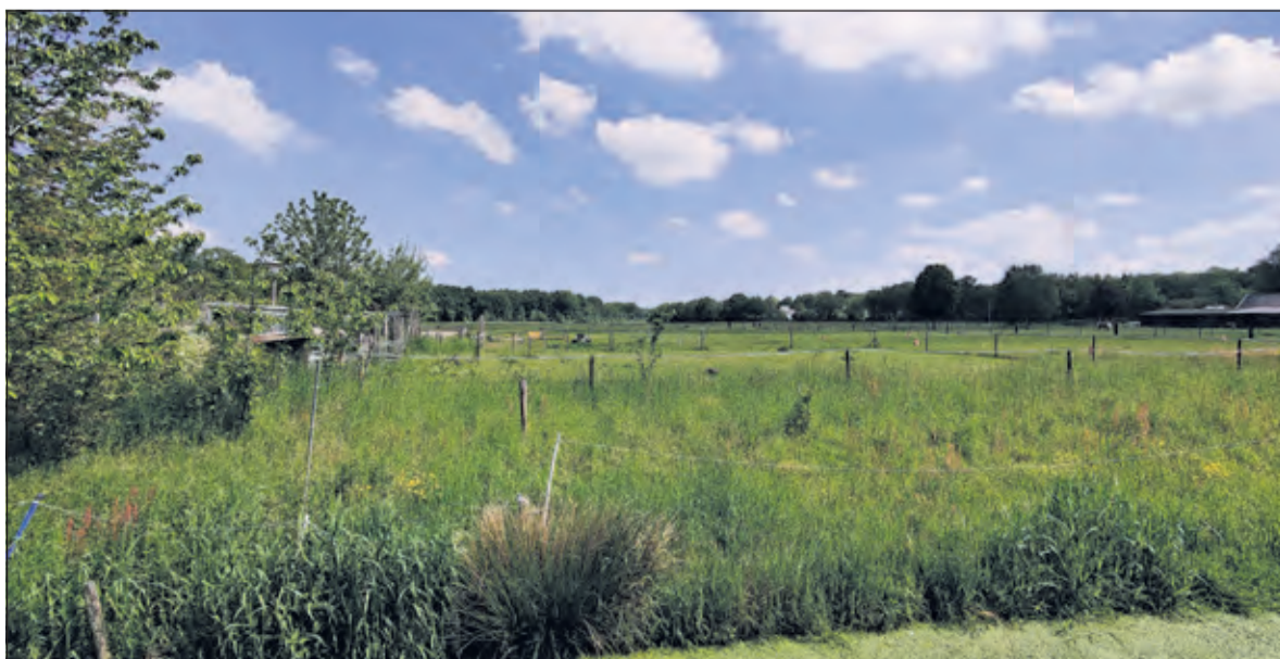
Er zijn plannen om op deze agrarische grond in Groenekan een voedselbos aan te leggen met daarin twintig zogenaamde 'Tiny Houses'.

Op 12 mei antwoordt de Gemeente De Bilt De Vierklank desgevraagd: 'Er is nog geen formeel voorstel ingediend bij de gemeente voor dit project. De gemeente oriënteert zich op dit moment wel op de eventuele (on)mogelijkheden voor Tiny Houses binnen geldend beleid. Tonneke ten slotte: 'Ik begrijp dat deze mensen graag hun project willen realiseren. Toch hoop ik ook dat de gemeente inziet, dat het op deze wijze omzeilen van de democratische besluitvorming vele stappen terug is op de weg die we de afgelopen eeuw zo moeizaam hebben bevochten in de ruimtelijke ordening en alsnog een besluitvorming door de gemeenteraad vereist bij dit soort experimenten'.