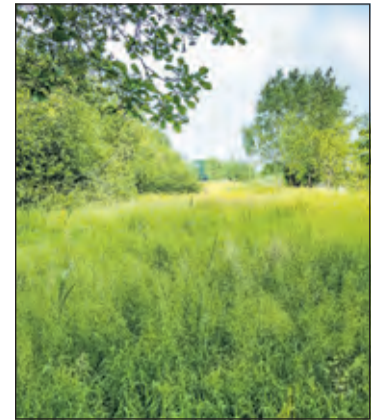
De prachtige tuin gaat naadloos over in de zodden, die beheerd worden door Staatsbosbeheer. (foto Joyce Reimu - mei 2016)

Op 12 juni staat de volgende openstelling op het programma. De tuin (ingang Kerkdijk 132) is vrij toegankelijk tussen 10.00 en 17.00 uur. Dan zullen waarschijnlijk de eerste moerasorchideeën bloeien.