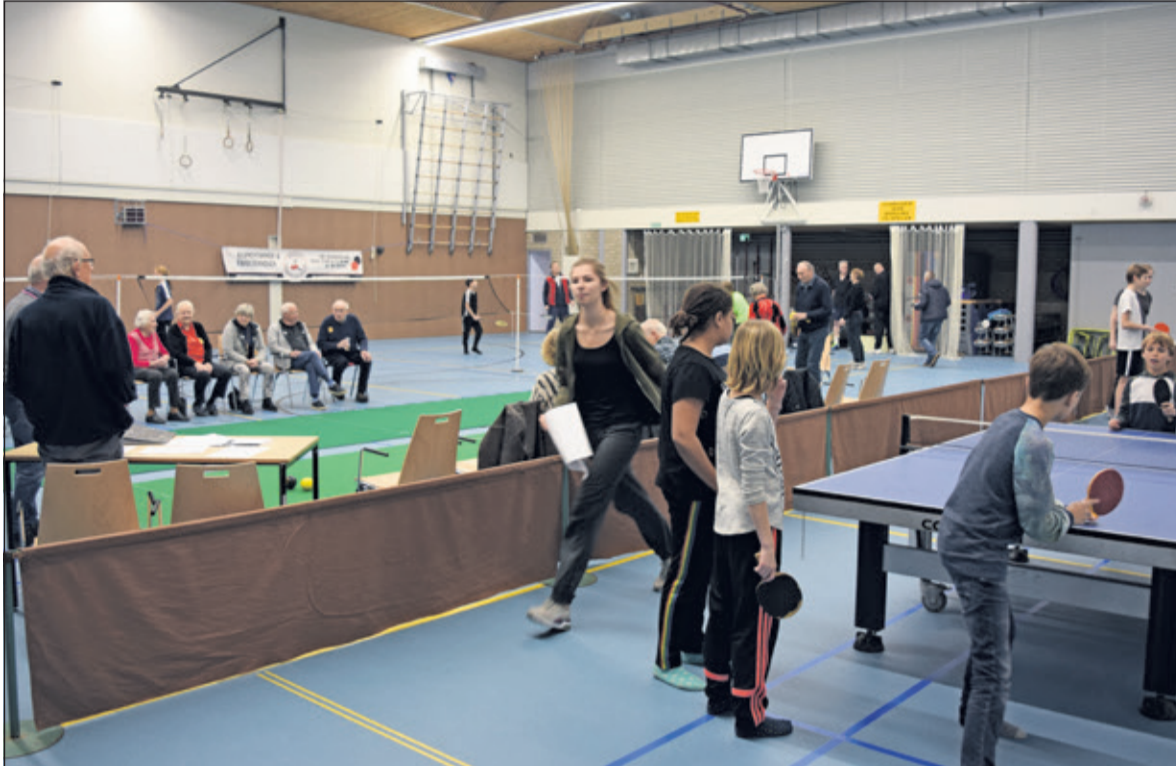
Van jong tot oud sport tijdens twee dagen Moving Maartensdijk.

De Vierstee was twee dagen lang vergeven van de activiteiten: sporten, mindfulness, e-games, 65+-hockey, het kon niet op. En voor wie geen zin had, om zich twee dagen te laven aan allerlei vermoeiende activiteiten, kon vrijdag nog altijd even langskomen voor een nieuwjaarsborrel.