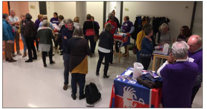
De infoavonden worden goed bezocht, zoals hier eerder in Het Lichtrium.

Op vrijdag 28 en zaterdag 29 juni is de eerste SamenLoop voor Hoop in De Bilt; een wandelevenement op het terrein voor gemeentehuis Jagtlust. Naast drie ceremonies zijn er