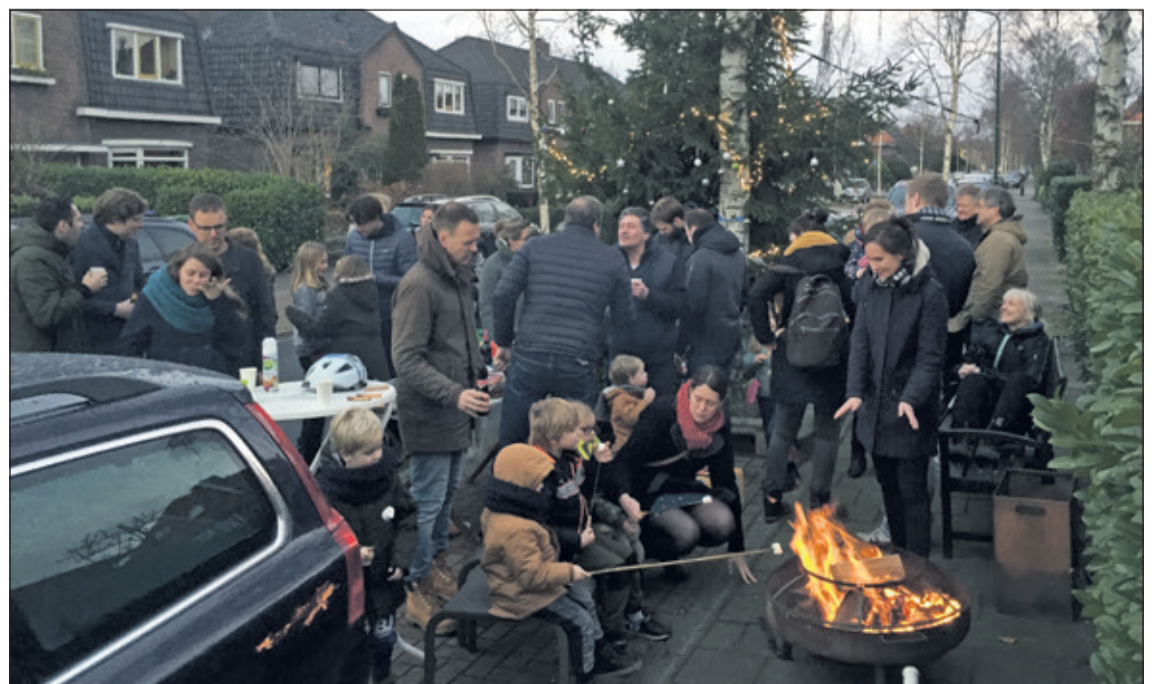
Buurtbewoners ontmoeten elkaar op de Waterweg.

was gesteld. Een prachtig initia- tief van de gemeente om de buurt te verenigen waardoor er tijdens de donkere dagen van december op de Waterweg een grote kerst- boom met versiering en verlich- ting viel te bewonderen.