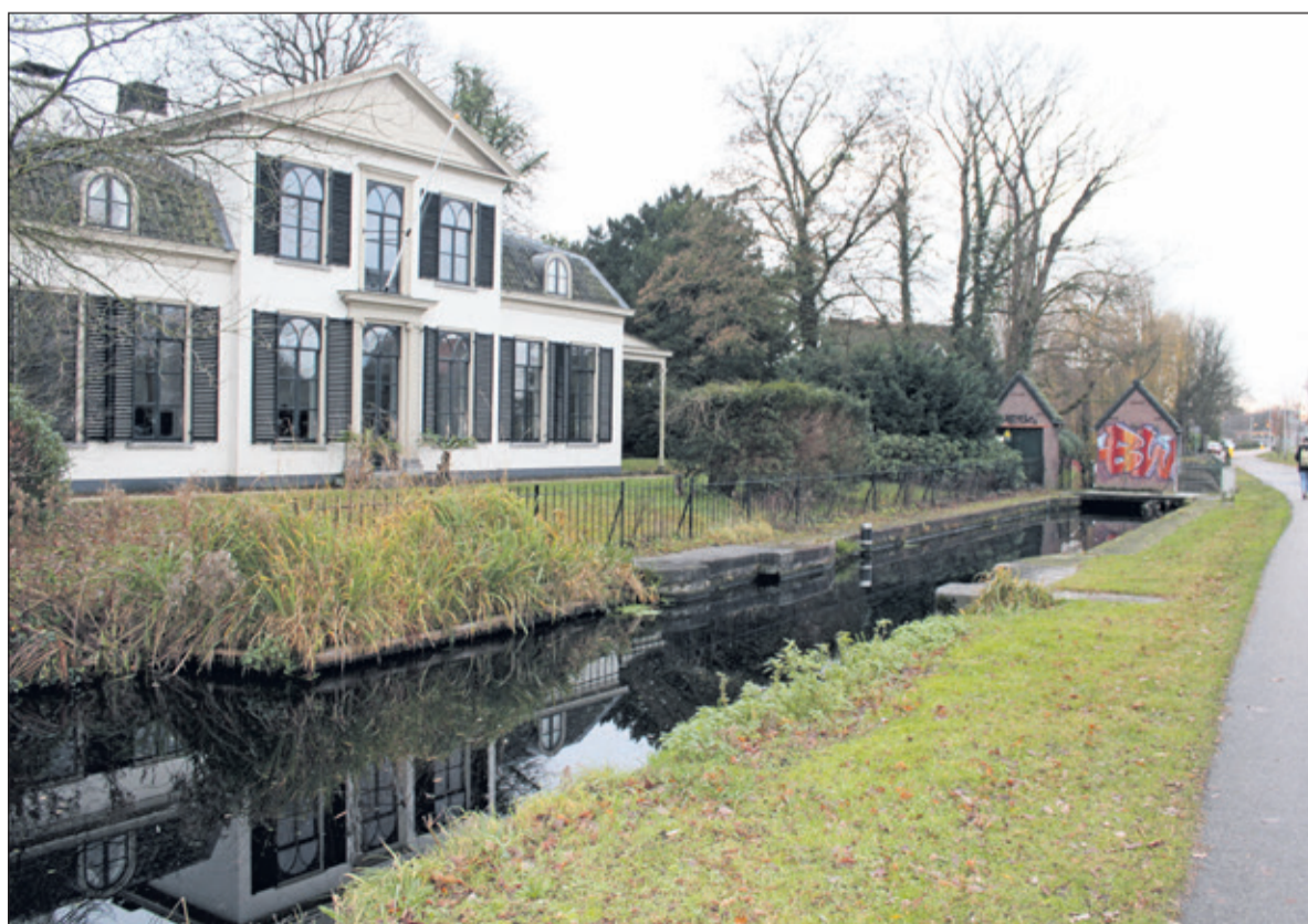
Blauwhoef met ervoor de restanten van de oude sluis.

Mens heeft stemmen nodig om te winnen. Via https://appeltjevanoranje.nl/mensdebilt kunt u stemmen. Wacht niet te lang want na 14 januari kunt u niet meer nomineren.