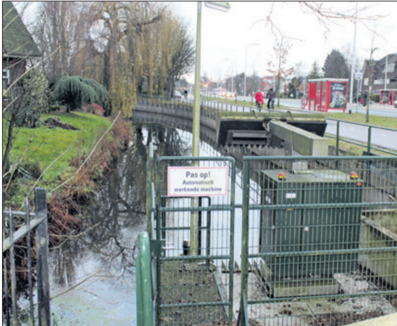
Tegenwoordig is ter plekke een stuw te vinden.

De sloten en vaarten, die in de Middeleeuwen in het veengebied werden gegraven waren in eerste instantie bedoeld om de waterhuishouding te reguleren. Ze werden echter ook gebruikt als vaarwegen. Omstreeks 1640 werd de Biltse Grift, gelegen aan de zuidkant van de huidige Utrechtseweg - de vroeger Steenstraat - uitgediept, verbreed en doorgetrokken tot Zeist. De vaart begon bij de stadsgracht van Utrecht en liep naar de 'Stoetwegens Dijk'.