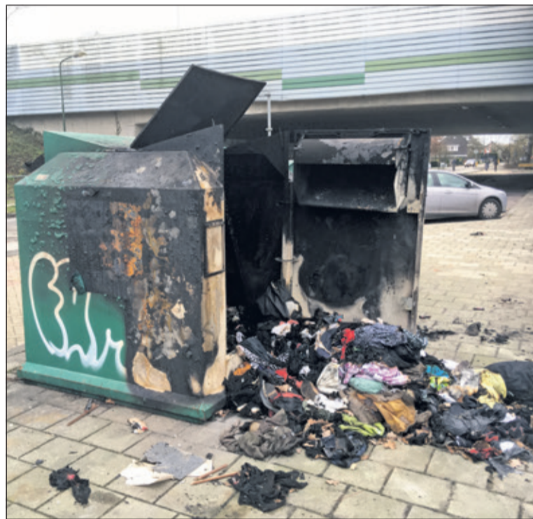
De kledingcontainer aan de Groenekanseweg werd nieuwjaarsnacht opgeblazen.

De container in Groenekan is op vrijdag 4 januari direct vervangen. Het opgeblazen exemplaar is meegenomen en wordt indien mogelijk gerepareerd. Voor Sympany is het een aardige kostenpost, alleen de container kost al €1500,-. De kleding kan bij het restafval en brengt dus niets meer op. De hoeveelheid kleding in de container viel mee aangezien de container kort voor de jaarwisseling extra geleegd worden. Het is dus aan te raden om in aanloop naar de jaarwisseling geen gebruik te maken van de containers.