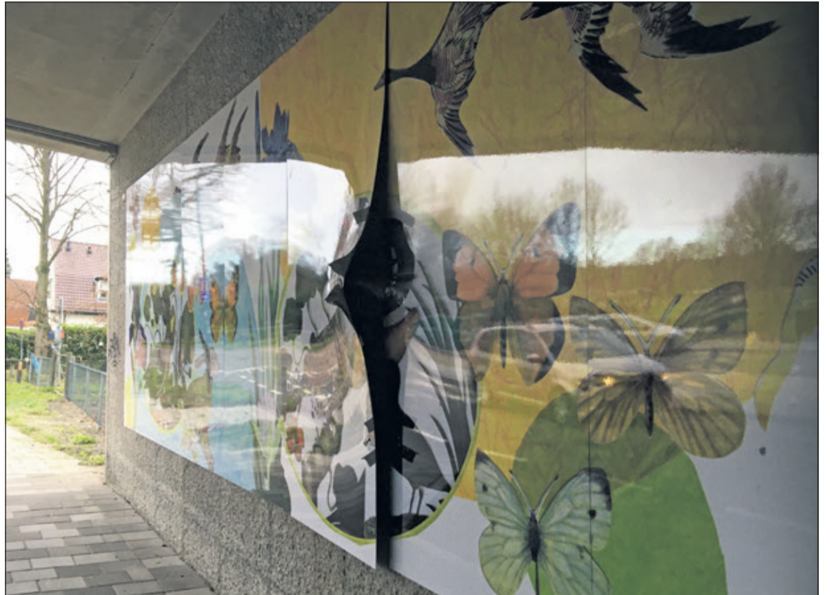
De fleurige panelen onder het viaduct in Groenekan zijn beschadigd.

dingen van vogels en planten. Lang konden de voorbijgangers niet genieten van een ongeschonden staat want in de nacht van 31 december op 1 januari richtte zwaar vuurwerk enorme schade aan de panelen aan.