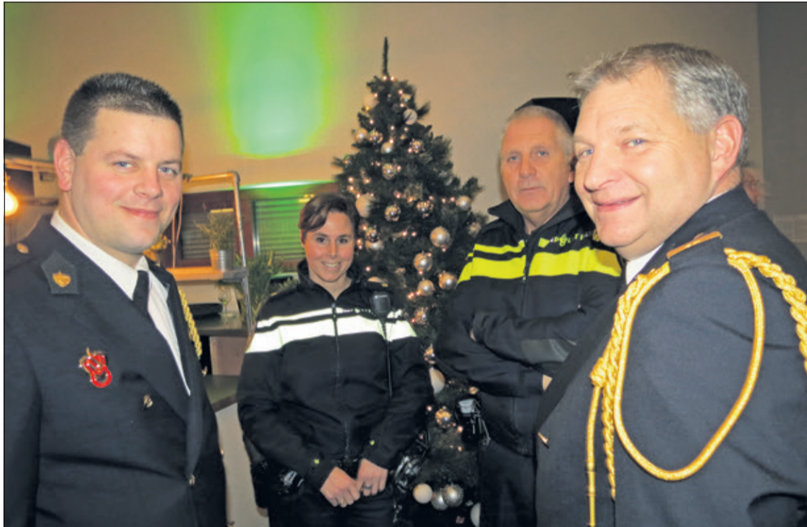
Hulpdiensten konden terugzien op een vrij rustige nieuwjaarsnacht.