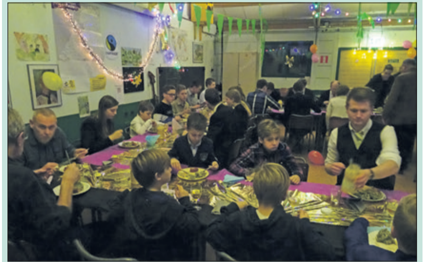
Iedereen geniet van de heerlijke boerenkoolmaaltijd in het feestelijk versierde scoutinggebouw.

Rond 18.00 uur werd de boerenkool met worst geserveerd aan mooi gedekte tafels. Iedereen was in stijl gekleed. Velen lieten zich ook een tweede bord goed smaken. Als toetje waren er twee grote schalen met soesjes. Ook deze vonden grif aftrek. De kookploeg van de Scoutinggroep heeft een prima prestatie geleverd. Na de maaltijd werd er gedanst en spellen gespeeld waarmee de kinderen een diploma konden verdienen.