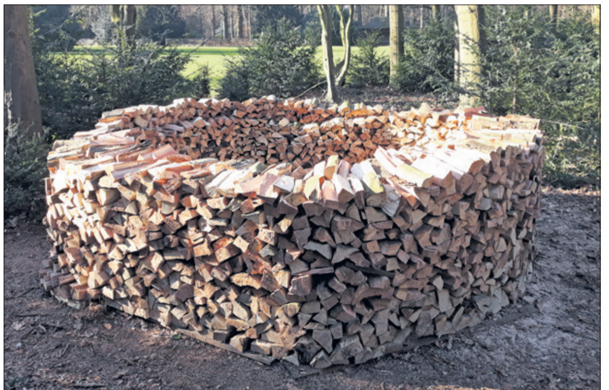
Het gekloofde hout ligt in ringen gestapeld om op natuurlijke wijze te kunnen drogen.

Op landgoed Eyckenstein is hout te koop, op natuurlijke wijze gekloofd en gedroogd.