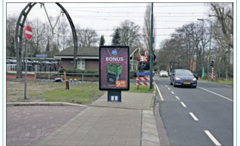
Reclamebord ontnemt het zicht volledig bij het verlaten van de parkeerplaats.

Bij het verlaten van de parkeerplaatsen onder het viaduct over de Vuurse Dreef in Hollandsche Rading is het opletten geblazen. Het uitzicht op de weg wordt totaal ontnomen door een reclamebord. Zowel om links (richting Tolakkerweg) als rechtsaf (richting Lage Vuursche) te gaan moet er echt de weg opgereden worden om het verkeer te kunnen zien. Rudy Klunder (RWS) reageert desgevraagd: 'Het ontwerp is in goed overleg met bewoners en gemeente tot stand gekomen. Echter hebben we ook geconstateerd dat dit bord er staat tijdens de opnameronde met de gemeente ten behoeve van de oplevering. Hier was reeds tijdens de informatieavond met bewoners aandacht voor gevraagd. Theorie en praktijk lopen dan soms wat uit elkaar. Ook dit punt is bij ons en de gemeente bekend'.