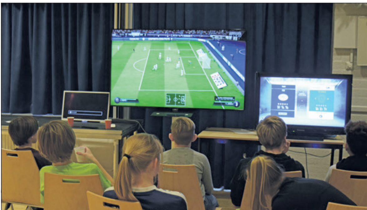
Iedereen vermaakt zich in De Vierstee

Moving Maartensdijk was simpel gezegd, een groot succes. Plug: ‘Wij begonnen dit evenement zonder enige verwachting, maar de opkomst overtrof werkelijk alles. Niet normaal, dat zoveel mensen op zo’n evenement afkomen. Natuurlijk ook dankzij al onze vrijwilligers, die twee dagen flink aan de bak moesten, maar dat was het wel waard’. Het evenement werd afgesloten met de Maartensdijkse Nieuwjaarsborrel. Ook daar kwam menigeen op af. Met 70 tot 80 man was het één groot feest.