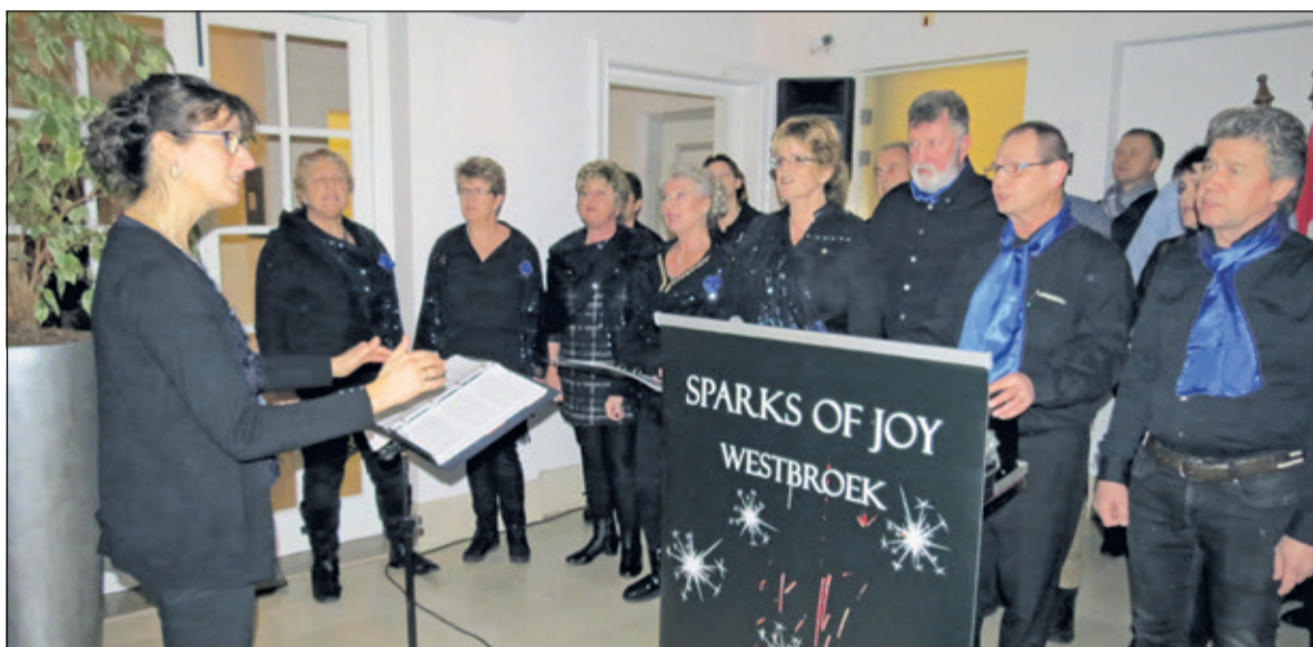
Gospelkoor Sparks of Joy uit Westbroek verwelkomde de bezoekers bij binnenkomst.