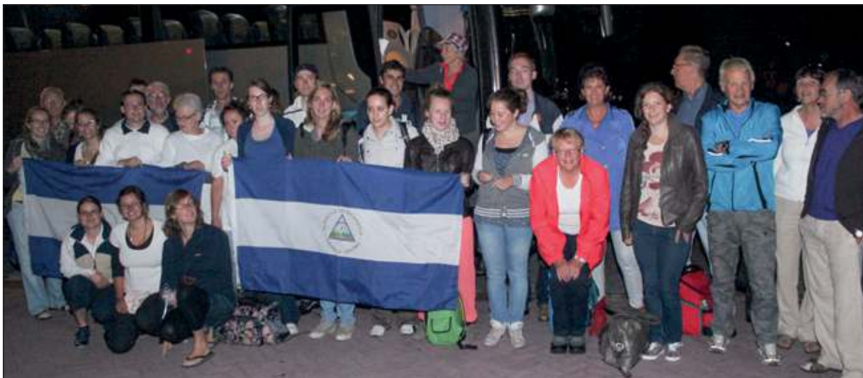
Voor het vertrek en voor de bus. Op vrijdag 3 augustus staat de terugreis gepland.

Naast de bouwwerkzaamheden zal er tijdens de diaconale reis ook een