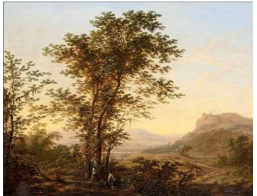
Herman Saftleven (1609-1685), Rijnlandschap met reizigers op een slingerend pad, berken op de voorgrond en een kasteelruïne op een heuveltop in de verte.

De politie kwam twee verdachten van deze kunstroof op het spoor toen op 12 januari 2012 een schilderij ter veiling werd aangeboden bij veilinghuis Christie's in Amsterdam. De kunstspecialisten stuitten bij onderzoek naar een aangeboden paneel van Herman Saftleven op diverse onregelmatigheden en vroegen om aanvullende informatie. De politie en het veilinghuis stelden een 100% match vast met de Saftleven die sinds 1999 als gestolen stond geregistreerd en de politie constateerde dat het schilderij onderdeel uitmaakte van de in 1999 gestolen partij. Het onderzoek naar de kunstroof werd heropend en de politie kwam uit bij twee mannen uit Heino