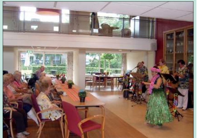
Bewoners genieten van de zomerse muziek.

Het voelde alsof iedereen meegenomen was naar Hawaï. De gezellige muziek en de dans deed aan zonnige vakantieoorden denken. Het repertoire bestaat uit Hawaiian songs, traditionele Indische Krontjong-liederen en Soft-Swing muziek. In de pauze was er een grote verrassing er was voor iedereen een ijssorbet met Hawaiaanse versiering. Helaas werd het weer er buiten niet beter op maar daar keek, door de gezellige sfeer, niemand meer naar. De mensen vonden het een heerlijke middag. (Joke Ruiter)