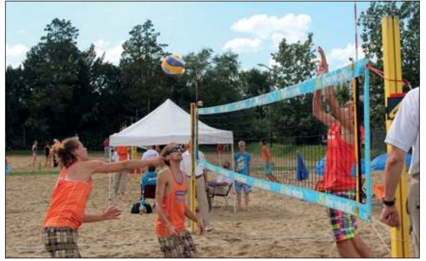
De kleine finale (om plek 3 en 4, zie foto) ging tussen de teams Agterberg/van Gilst (links) en Beijer/de Koning. Het laatstgenoemde koppel wist te winnen en de laagste trede van het podium te bezetten (foto Henk van de Bunt).