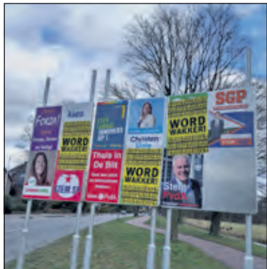
Binnenkort zijn de gemeenteraadsverkiezingen.

De avond was opgedeeld in 2 delen: aan het begin een presentatie van het project toekomstvisie De Bilt 2040 en de 4 ontwikkelde visies die daarbij horen. Het tweede deel bestond uit rondetafelgesprekken, waarbij het gezelschap werd verdeeld over twee tafels. Aan deze tafels kon worden gesproken over de visies om te kijken welke visie ons het meest aansprak. Voor ons lag een kaart op tafel met daarop een rode grens rondom ons dorp; de zogenaamde rode contour. Dit is de grens waar binnen tot nu toe gebouwd mag worden. Aan onze tafel zaten nog vijf andere mensen. Drie van deze mensen kende ik. Twee van hen wonen in het buitengebied van ons dorp in het groen, dus buiten de rode contour. De andere precies op de rode contour met uitzicht op het groen. Bij ons aan tafel waren we het er snel over eens: er