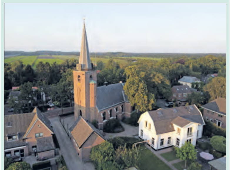
De Maartensdijkse kerk vanuit de lucht gefotografeerd.