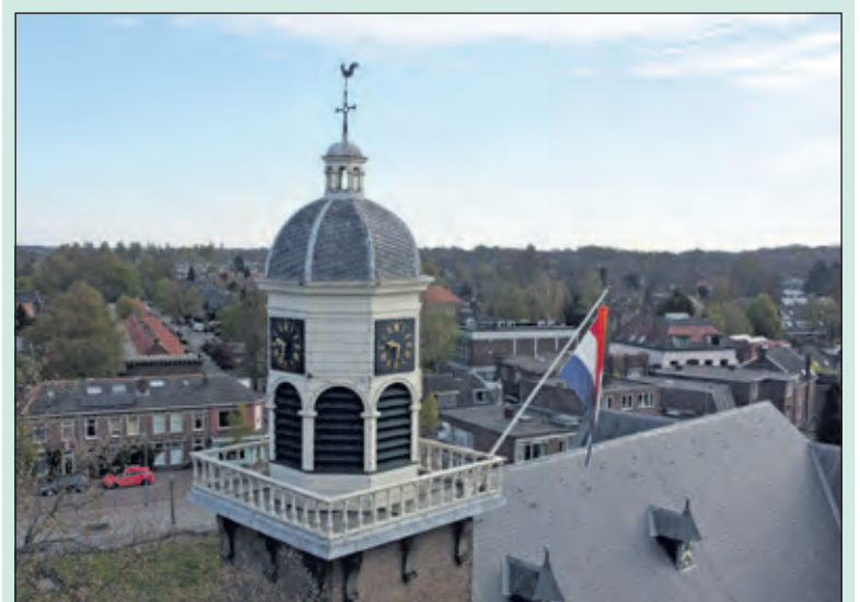
Dorpskerk De Bilt.

Het kerkgebouw aan de Dorpsweg in Maartensdijk heb ik ook op een mooie zomeravond gefotografeerd. Hierbij viel mij op dat de wijzerplaten van de klok er slecht aan toe zijn. [HvdB]