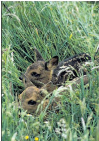
Reekalfjes houden zich schuil voor predatoren.

Als een reegeit in de zomer succesvol bevrucht is, groeit er al vrij snel een zogenaamde embryonale kiem. Daarna staat de ontwikkeling tot een embryo een tijdje stil. Er volgt tot eind december/begin januari een rustpauze, de zogenaamde diapauze. Een slimme zet van moeder natuur! Immers, zonder deze verlenging van de draagtijd zouden de reekalfjes eind december/begin januari geboren worden. Uiterekend zo'n beetje de koudste tijd van het jaar met het minste aanbod van energierijk voedsel. En dat is nou juist wat een zogende moeder nodig heeft. Bij de dan doorgaans lage temperaturen is er voor de dieren bovendien nauwelijks dekking te vinden door het ontbreken van begroeiing. De kleintjes zouden makkelijk slachtoffer kunnen worden van predatoren en onderkoe-