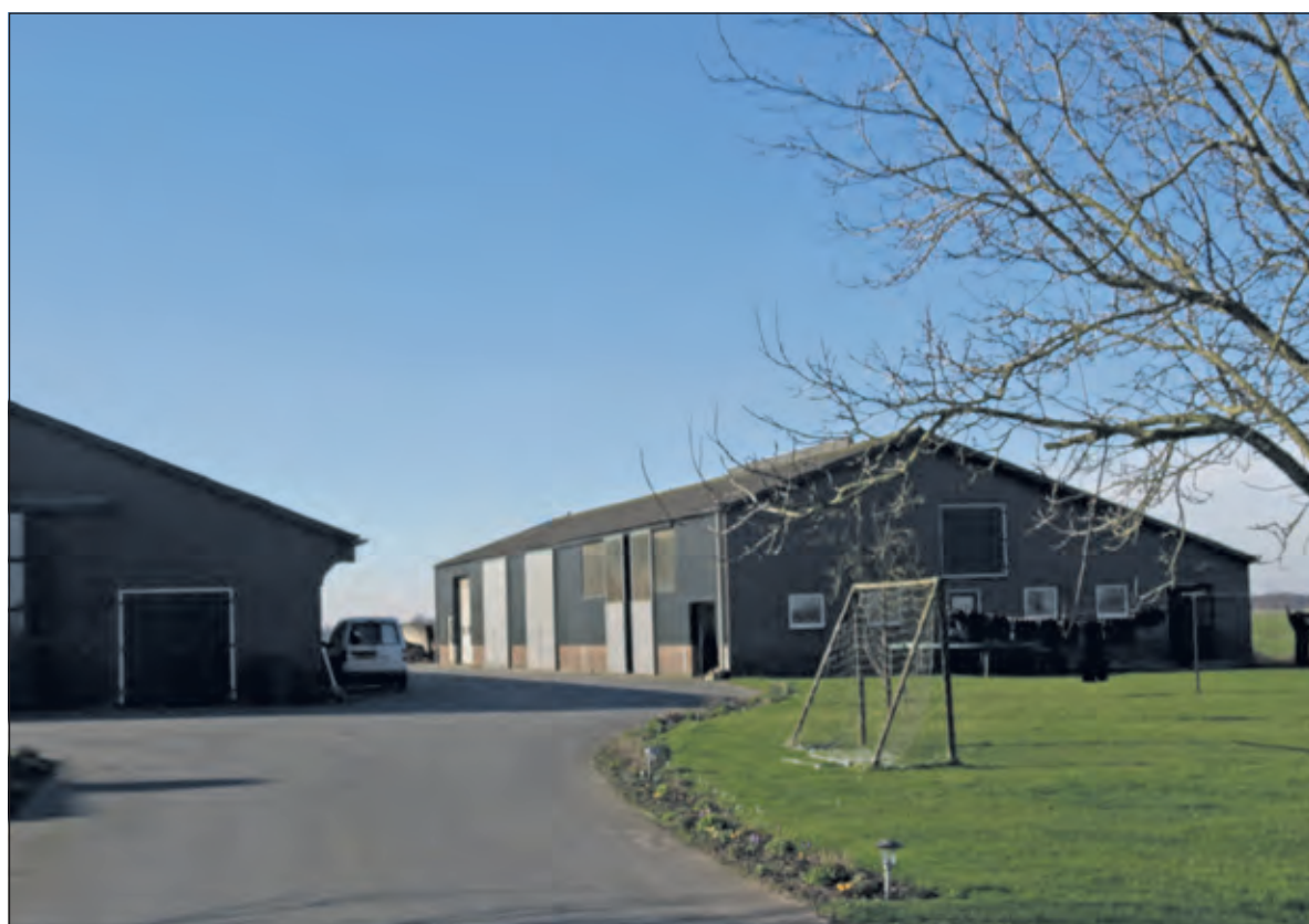
De raad ging akkoord met de ontwerpverklaring van geen bedenkingen Korssesteeg 5 Westbroek.