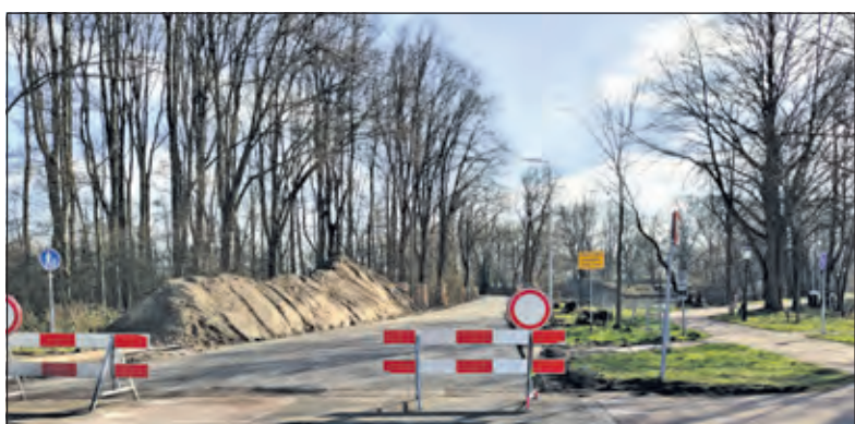
Bastionweg blijft open voor verkeer uit Groenekan (maar nu even nog niet).

Wethouder Brommersma is blij met de aanpassing van het plan. 'Dit is heel goed nieuws voor onze Groenekanse inwoners. Ik ben blij dat de Bastionweg straks een stuk veiliger is, maar ook beschikbaar blijft voor mensen uit Groenekan die bijvoorbeeld in De Gaard boodschappen doen. Het Robert Kochplein is, zeker in de spits, niet altijd een fijne route om te gebruiken. En ik ben blij dat we op deze manier kunnen samenwerken met de gemeente Utrecht. Dat doet ook recht aan onze inwoners'.