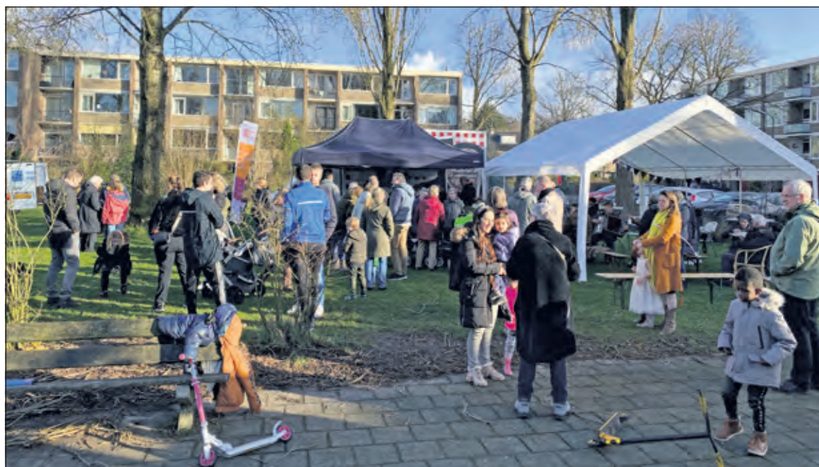
Ca. 120 mensen kwamen naar het centrale grasveld bij NoordOost De Bilt.

pende handen of het verspreiden van een uitnodiging via flyers en buurtapps. Het is belangrijk elkaar te leren kennen in de buurt, zowel buurtbewoners, bedrijven als maatschappelijke organisaties. Het neemt een drempel weg om elkaar op te zoeken. Ontmoetingen als dit versterken de sociale samenhang en verbeteren de leefbaarheid in de buurt. En natuurlijk, samen wordt een feestje een stuk leuker.'