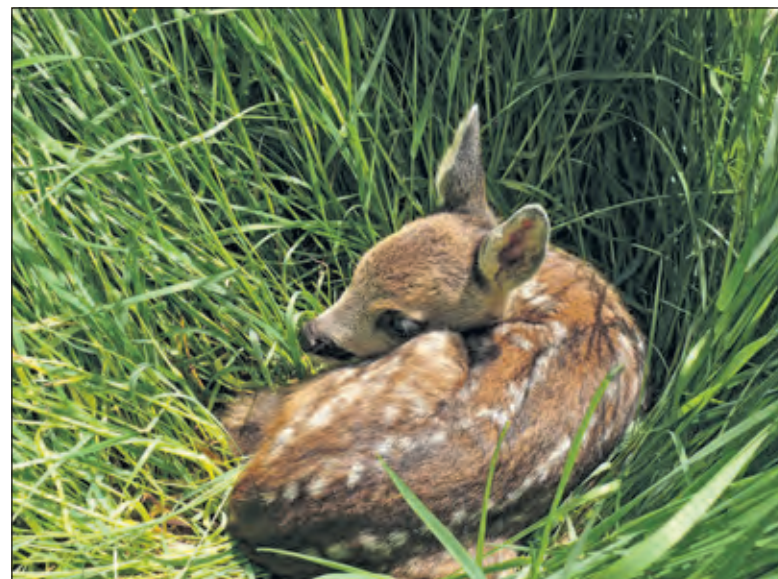
Reekalf vindt dekking in het hoge gras.

Heb je een hond? Houd deze dan aangeliend tijdens het gehele broedseizoen, het liefst óók in een hondenloosgebied. Want al is je