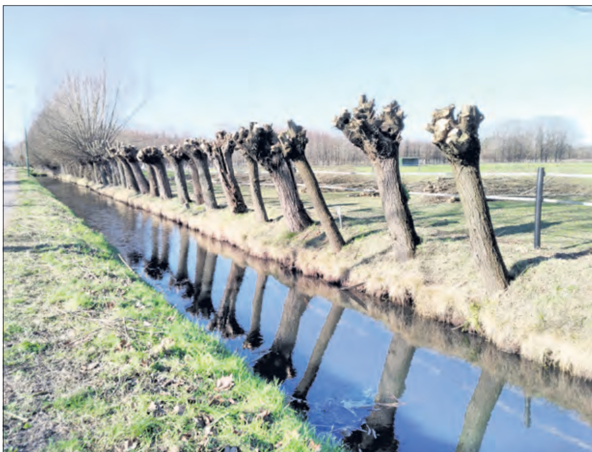
Deze wilgen, die vorige week geknot werden op de Groenekansweg kunnen er weer tegen.