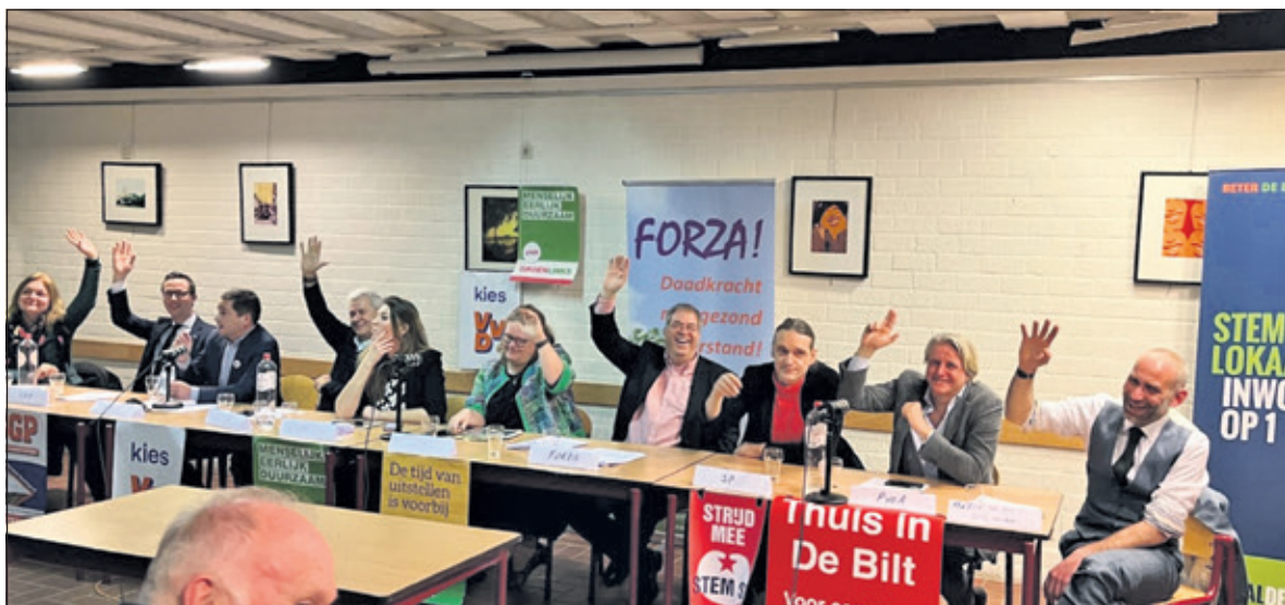
Alle politici beloofden zich voor het behoud van een gymzaal hard te maken.

Op 16 maart worden de gemeenteraadsverkiezingen gehouden en Groenekanners willen wat te kiezen hebben. Daarom organiseerde de Vereniging Groenekan op 21 februari een paneldiscussie voor de afvaardigingen van alle politieke partijen in De Bilt.