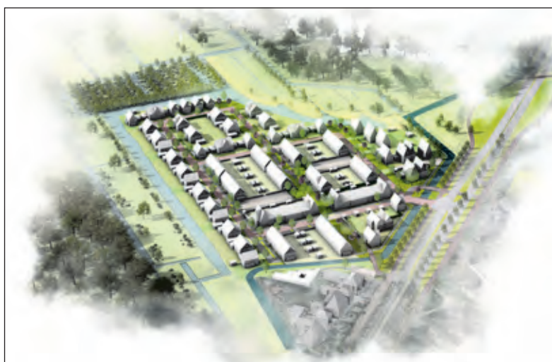
Het artikel sluit af met dit beeld van IMOSS BV van de bouwplannen voor Utrechtseweg 341 De Bilt.