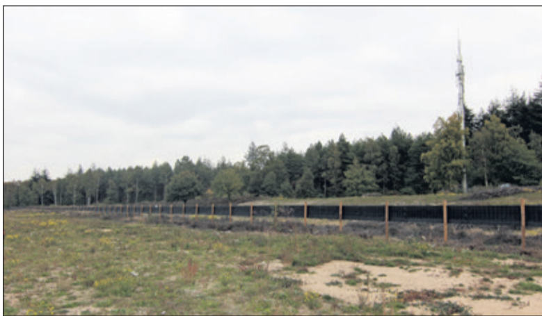
De keuze voor het specifieke groen past in de omgeving. Voor de A27 zal dit voornamelijk bestaan uit heide, jonge struiken, bomen en grotere laanbomen.

Voor de A27/A1 is voornamelijk gekozen voor heide, jonge struiken, bomen en grotere laanbomen. Rond de A27 Zuid worden zoom-, mantel- en boszones en solitaire bomen geplant.