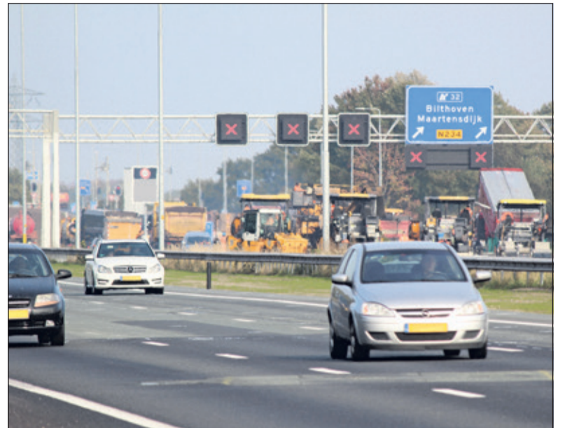
Terwijl richting Utrecht het verkeer drie-baans voortsnel wordt aan de oostelijke overzijde - tussen Utrecht-Noord en aansluiting Bilthoven tweelaags zoab aangebracht.