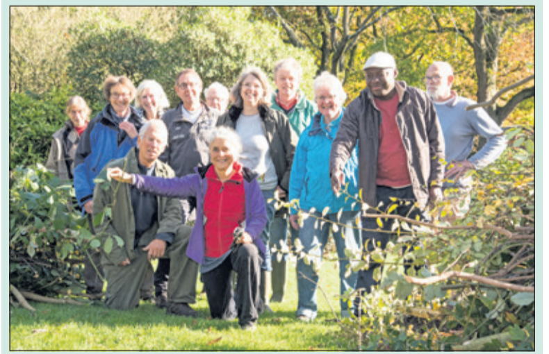
De deelnemers aan afweer de 39ste werkdag.

Een andere klus die op het programma stond, was het verwijderen van informatiepalen. Heel nuttig die palen, maar de bomen waar ze informatie over geven, waren helaas al gesneuveld. De palen gaan terug naar de gemeentewerf zodat ze opnieuw gebruikt kunnen worden. En ook een terugkerende klus, het drijvende vuil en de rommel in de vijver is weer weggehaald. Degenen die van het weekend in het park zijn geweest, zullen de nodige stapels met takken hebben aangetroffen. Deze worden altijd door de gemeente weer opgehaald.