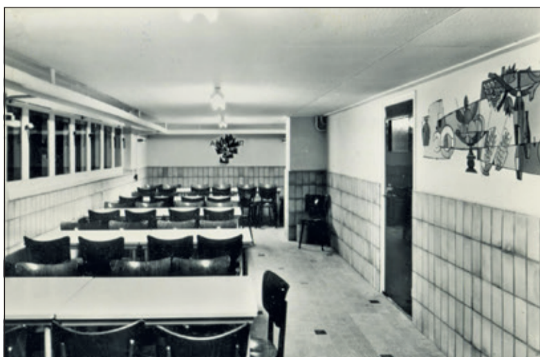
De eetzaal in het souterrain met muurschilderingen; aangebracht om daar eventueel ook ochtend- of avondwijdingen te houden.

Alle zwartwit-foto's uit de digitale verzameling van Rienk Miedema.