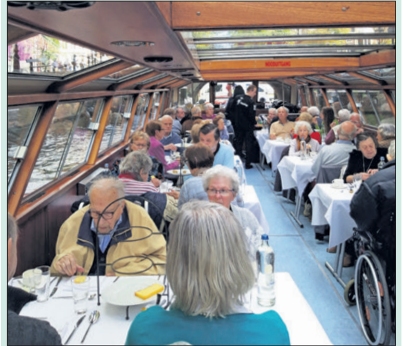
Tijdens de tocht wordt er lekker gegeten en gekletst.