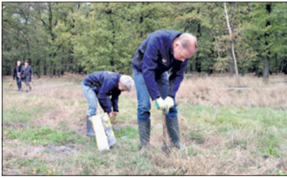
Tijdens de natuurwerkdag op zaterdag 3 november gaan vrijwilligers bolletjes toevertrouwen aan de aarde.

De herfst lijkt maar geen echte herfst te willen worden. Met temperaturen passend bij een Hollandse zomer én de voortdurende droogte, had ik tot op heden nog maar weinig zin om met bloembollen aan de gang te gaan. Toch, wie nu niet plant, heeft in het vroege voorjaar geen lente te vieren en dus aan de gang met die hap! Privé ben ik diverse potten en kuipen aan het voorbereiden. Met tulpen, sneeuwkllokjes en krokussen. In het vroege voorjaar kan ik dan her en der kleur toevoegen in een ongetwijfeld nog sombere tuin.