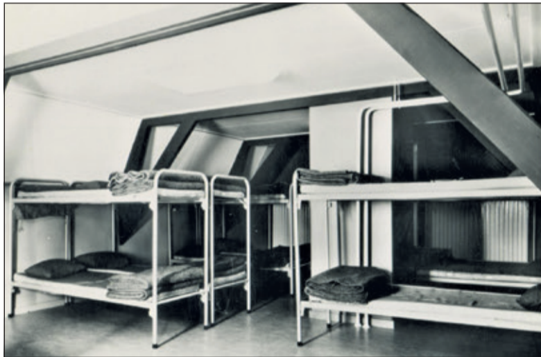
De slaapzaal (jongens) met op de bedden de dekens zoals deze altijd werden opgevouwen.