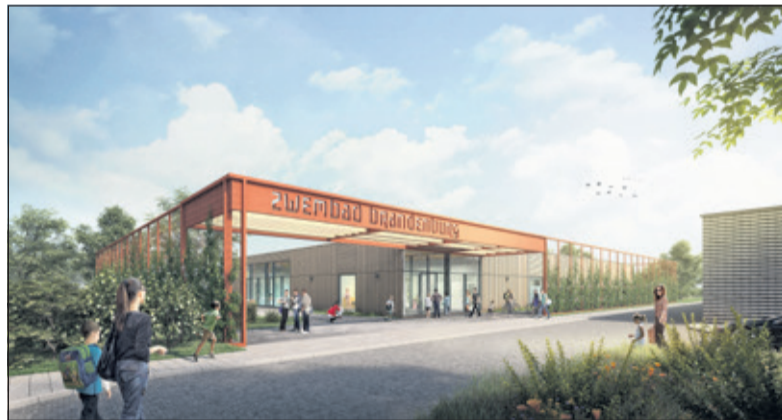
Impressie van het nieuwe zwembad.

De aannemer doet onderzoek waaruit moet blijken hoe deze scheuren ontstaan zijn en hoe dit gerepareerd kan worden. Hoeveel vertraging dit gaat opleveren, is nog niet bekend. Vorige week werden de lopende werkzaamheden afgerond en sloten bouwvakkers de bouwplaats af. Het bestaande combi-bad Brandenburg blijft in bedrijf tot het nieuwe zwembad geopend wordt. Dit was gepland vóór de zomer van 2019. Ook de zwemlessen gaan gewoon door in het huidige bad. [HvdB]