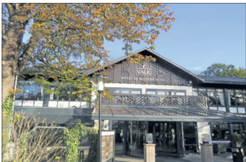
De uitnodigende hoofdingang van De Biltsche Hoek op een zonnige herfstdag.