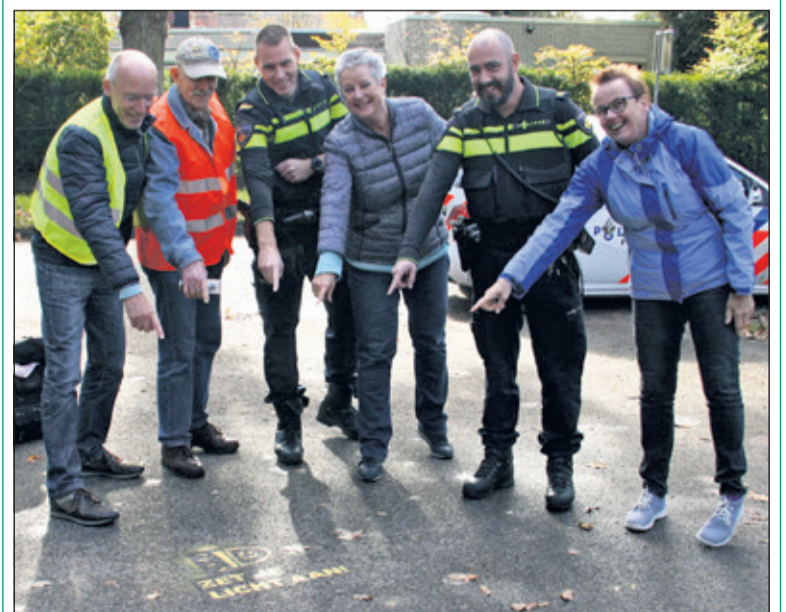
Zaterdag 27 oktober heeft de Wijkraad De Leijen in Bilthoven de tags geplaatst op locaties, waar veel fietsers langs komen, onder goedkeurend oog van de politie.

De ANWB wil het verkeer veiliger maken en fietsers er aan herinneren hun licht aan te zetten. Het idee: een sjabloon met de tekst: 'zet je licht aan', met een smiley erachter. Met uitwisbaar spuitkrijt kan het op het fietspad worden gezet op strategische en drukke punten, waar het ongeveer twee weken zichtbaar is en daarna verdwijnt. (Hetty Loeb)