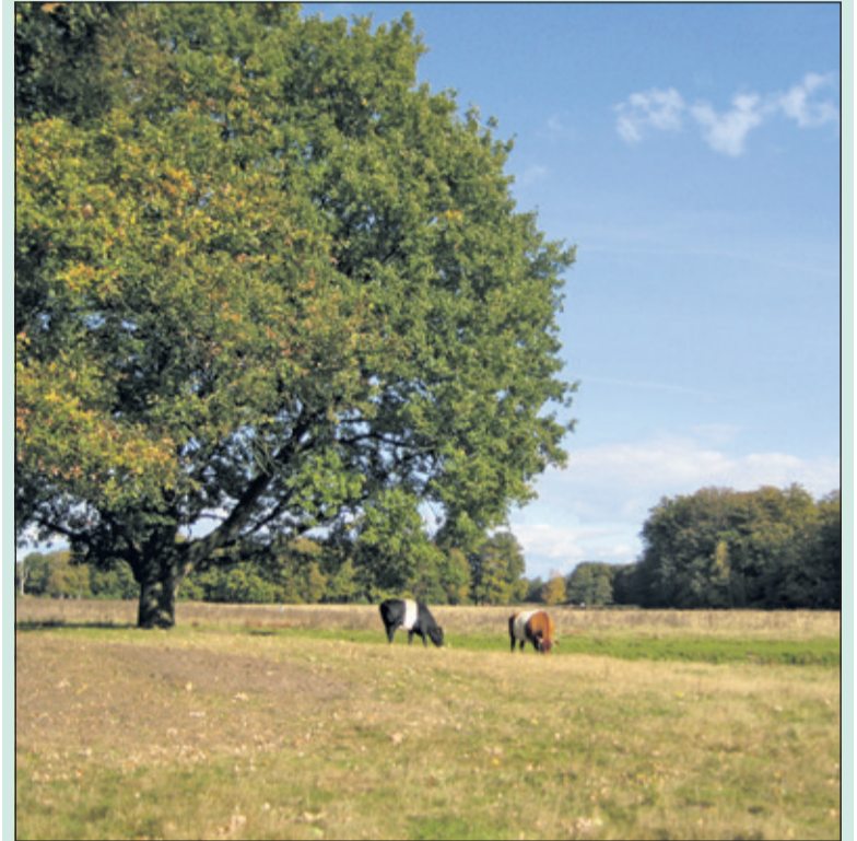
Zondag 4 november wordt een wandeltocht over Houdringe georganiseerd.

De start is om 14.00 uur vanuit Paviljoen Beerschoten, gelegen aan de Holle Bilt 6 te De Bilt voorbij de parkeerplaats van de Biltse Hoek linksaf. De wandeling duurt anderhalf tot twee uur. Vooraf aanmelden is gewenst i.v.m. het maximaal aantal deelnemers en kan op de website van Utrechts Landschap bij 'activiteiten'. Deelname is gratis.