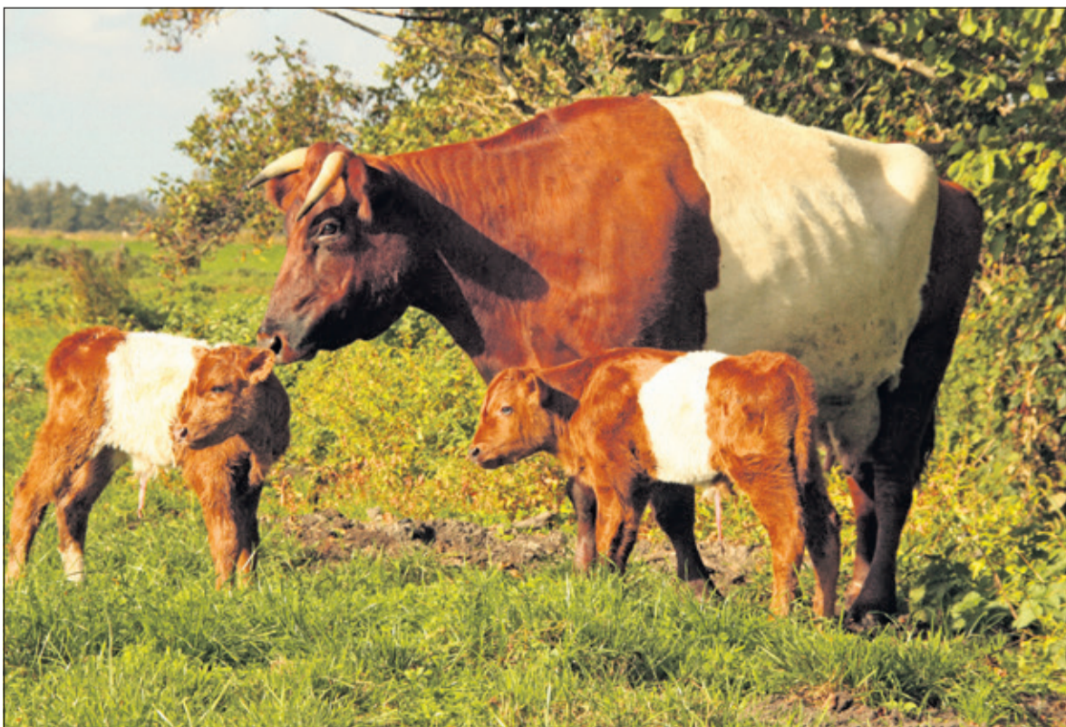
De lakenvelder is een runderras dat vooral herkenbaar is aan de witte band tussen de voor- en achterpoten om de borst en rug van een verder zwart of rood dier.

uiteindelijk zelfstandig het uier. Het was een uniek gezicht zo in de najaarszon. Uit zorg voor de drie zijn ze later tijdelijk naar binnen gehaald omdat ze gevaarlijk dicht langs de waterkant bleven op hun wankale beentjes. Later zullen ze weer langs de vaart te bewonderen zijn. (Elke Rabé)