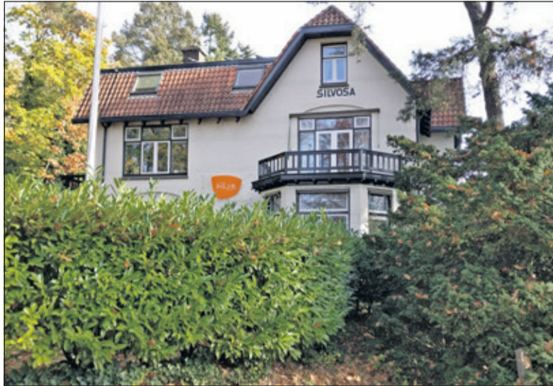
Silvosa aan de Prins Bernhardlaan (1) te Bilthoven.