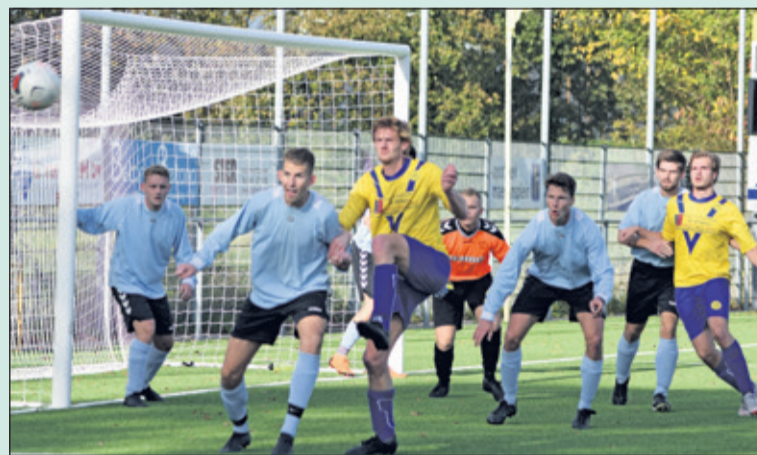
SVM probeert uit een hoekschop te scoren.