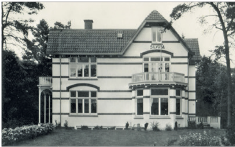
Henk Veldhuizen: 'Deze foto (1964) is uit 'onze' tijd; de kamer bij het balkon was onze huiskamer. Helemaal onderaan zie je nog een beetje de ramen van de eetzaal in het souterrain'.