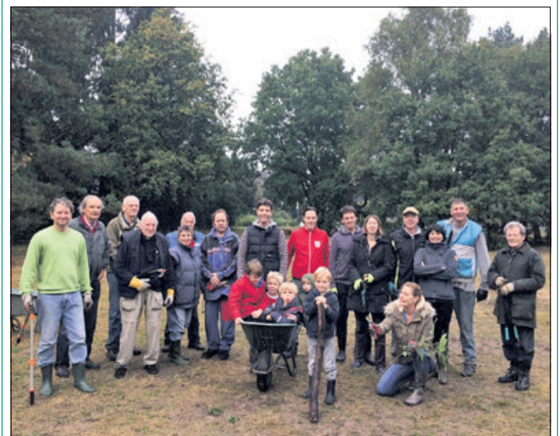
Ook in 2016 zette jong en oud zich in voor het Biltsche Meertje.

Op deze snoei-middag wordt u gelijk even 'bijgepraat' over de inmiddels opgerichte Stichting Vrienden van het Oude Biltsche Meertje. Iedereen, jong en oud, is welkom. Neem snoeigereedschap zelf mee (even labelen met uw naam). Als altijd zal er afgesloten worden met een hapje en een drankje. Aanmelden kan via advangameren@ziggo.nl of gitta.van.eick@xs4all.nl . (Ad van Gameren)