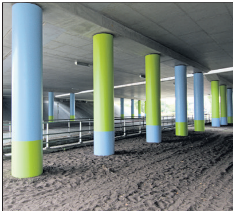
Kunst in wording: De pilaren onder het viaduct over de Maartensdijkse Dorpsweg staan er alvast gekleurd op.

In Bilthoven-Centrum parkeren dan kun je een boete riskeren plaats de schijf voor je ruit want boa's gaan er op uit om dat heel streng te controleren