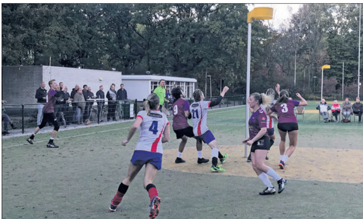
De laatste veldwedstrijd van Nova in 2018 werd verloren.