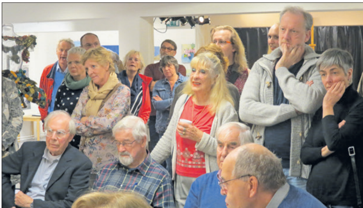
Veel bezoekers woonden de opening bij.