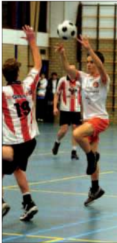
Ondanks een 18-25 nederlaag tegen koploper DeetosSnel/Volhuis heeft TZ nog volop kans op handhaving in de zaalhoofdklasse.

een gelijkspel van deze wedstrijd en verlies van TZ tegen Tempo zal er een driekamp voor de 2e degradatie plek nog noodzakelijk zijn. De wedstrijd Tempo - Tweemaal Zes is zaterdag 12 maart a.s. aanvang 20.00uur in Alphen aan de Rijn (Limmeshallen)