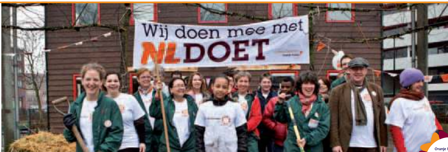
Collega's steken met jongeren handen uit de mouwen bij een kinderboerderij