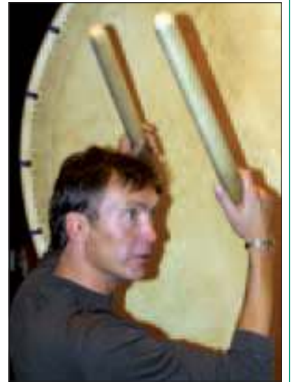
Kijk voor meer informatie op www.gijstrommel.nl of bel 06-51403025.

'Het gaat allemaal om toewijding, eenvoud en samenspel. Je speelt geconcentreerd, op je eigen niveau en eventueel met een gezamenlijke verantwoordelijkheid. Zo ontdek je je eigen innerlijk vermogen.'