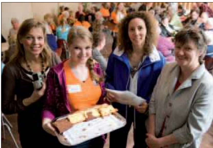
Gezellige middag voor senioren in De Voorhof (bij) de Dorpskerk in De Bilt.

Rabobank Utrechtse Heuvelrug steunt de vrijwilligersactie NL Doet ook financieel vanuit het Stimuleringsfonds. Dit fonds steunt lokale projecten, die een effect hebben op een grote groep mensen. NL Doet sluit hier goed bij aan en kan als een olievlek werken op het vrijwilligerswerk in het algemeen. Samen voor De Bilt treedt dit jaar op als initiatiefnemer en intermediair van NL Doet De Bilt. Samen met vrijwilligers van het Meldpunt Vrijwilligerswerk wordt er campagne gevoerd en ondersteuning verleend aan alle deelnemers van NL Doet in De Bilt. Dit wordt mede mogelijk gemaakt door de financiële ondersteuning van de gemeente De Bilt en het Rabobank Stimuleringsfonds.