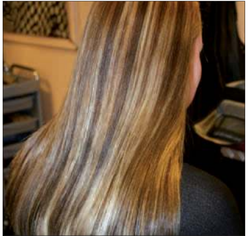
Na 2 uur zien we het eindresultaat.

onder ogen, soms nog wel erger dan dit. Veel kappers durven het niet aan om daar mee aan de slag te gaan. Voor ons is het een sport om er weer wat moois van te maken. En dat doen we met veel aandacht en zorg voor het haar.'