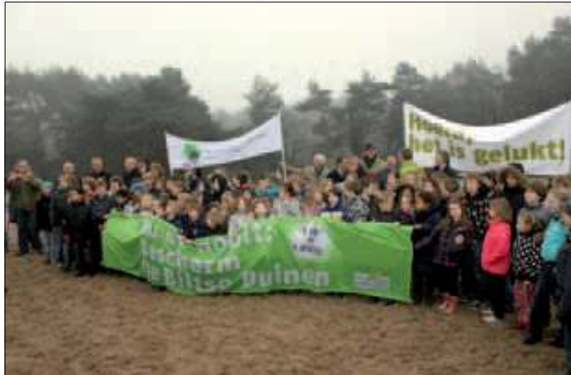
Vier basisscholen uit Bilthoven zijn op pad geweest om de Biltse Duinen te kunnen beschermen. Leerlingen van de Van Everdingenschool, de Juliana-school, de Theresiaschool en de Van Dijkschool uit Bilthoven hebben met elkaar een bijdrage van ruim 700 euro binnengehaald.