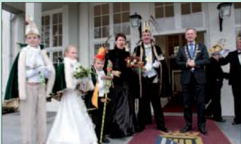
De prinses zorgden ervoor dat de feesten in Speikerreik zonder wanklank en voor iedereen plezierig verliepen.