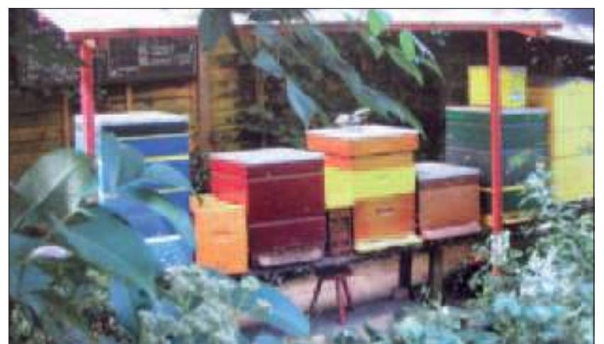
Een kleurrijke bijenstal.