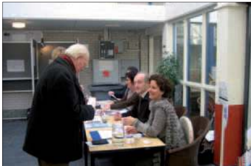
Erst legitimeren, dan stemmen.

De uitslag in kernen laat zien dat het CDA in Westbroek de grootste aanhang heeft. In Hollandsche Rading scoren de VVD en D66 hoog. De SGP trok in het dorp Maartensdijk de meeste kiezers. De Partij voor de Dieren zou in alle kernen een zetel behaald hebben. De opkomst was overal ruim boven het landelijk gemiddelde van 55,9 procent. In de Staten werden vijf inwoners van de