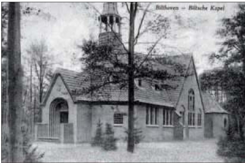
De Biltse Kapel in 1920

Een groepje omwonenden concentreert zich op de Zuiderkapel en gaat op verzoek van veel verontruste buurtgenoten in de wijde omgeving na, wat er mogelijk is om deze kapel te behouden.