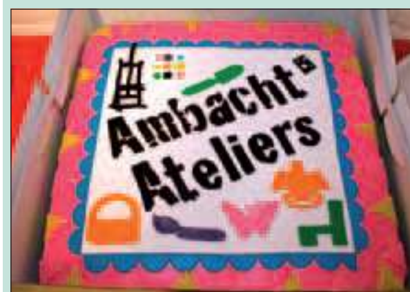
Ook werd er een prachtige taart aangesneden.

Wethouder Bert Kamminga was aanwezig tijdens de opening op persoonlijke uitnodiging, samen met naar schatting zo'n 700 tot 1000 anderen. Het liep storm, het was dringen op de gang en in de ateliers. Er was op veel bezoek gerekend, maar dit was ongekend.