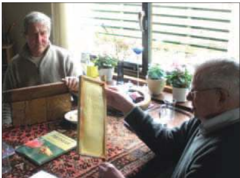
Groenekanse imkers inspecteren bijenraten.

den langs akkers in het buitengebied van Groenekan weer in ere te herstellen onder het motto Bij zoekt Boer. Bovendien probeert men in het dorp zelf in grote tuinen en plantsoenen weer verruigde perceeltjes met drachtplanten te laten ontstaan. In de komende maanden zal de actiegroep ook met zakjes bijenzaad weer acte de présence geven op tuinbijeenkomsten en plantenmarkten etc. om Groenekanners te bewegen bijenvriendelijk bloemzaad in hun tuinen in te zaaien. Meer informatie over geschikte bijenplanten en over de activiteiten van de actiegroep kunt u vinden op hun website: www.debijenwij.nl .