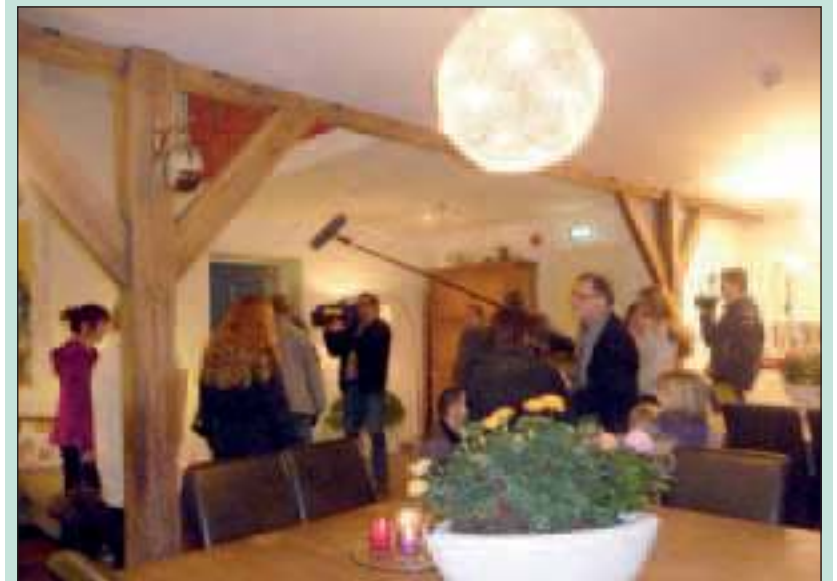
Uitending van De Tuinruimers is op maandag 26 maart vanaf 17.00 uur op SBS.