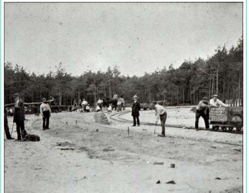
De Bachlaan bij de aanleg omstreeks 1920. Deze foto geeft een goed beeld van de beplanting van het gebied van het toenmalige 'Oosterpark'.

Inmiddels zijn selecties uit dit tentoonstellingsmateriaal op een wandeling langs woon- en zorgcentra in De Bilt en Bilthoven. De Historische Kring D' Oude School wil u in deze serie artikelen van hun hand graag laten meegenieten van dit interessante beeldmateriaal.