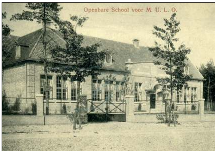
Uit 'De Bilt-Bilthoven in oude prentbriefkaarten van Ellen Drees en Rienk Miedema'.

Aanvankelijk zou het een school voor voortgezet lager onderwijs worden, gelet ook op de eerste foto's/ ansichtkaarten van het gebouw. Het werd echter een openbare lagere school. De doelstelling van de school was de leerlingen veel kennis bij te brengen en ze klaar te stomen voor het mid-