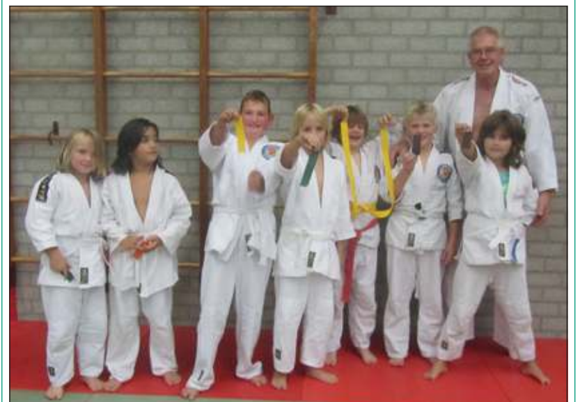
Dinsdag 2 oktober werden er bij Judokan examens afgenomen. Al met al weer een drukke avond, die uitliep tot 22.00 uur. Ook de senioren kwamen dit keer aan bod. Zij moesten voor de hogere banden ook kata's laten zien.