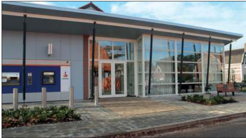
Voor de precieze invulling van de avonden wordt ook beroep gedaan op ideeën van de inwoners.

De avond zal worden geopend door de jongste inwoner van Westbroek. Wie dat is weet nog niemand. Misschien is hij/haar op dit moment nog niet eens geboren. Het is de eerste keer dat de dorpsborrel wordt gehouden, een experiment dus eigenlijk. Wat willen en verwachten de inwoners van Westbroek van zo'n avond? Daarom is er een bord aanwezig waarop iedere bezoeker zijn of haar ideeën en suggesties kwijt kan. De organisatoren hopen dat het een blijvertje gaat worden, die dorpsborrel en zijn erg benieuwd naar de reacties van de bezoekers. Tenslotte roepen ze iedereen op die nog oud filmmateriaal heeft over Westbroek dat beschikbaar te stellen om vertoond te worden op toekomstige dorpsborrels. [MN]