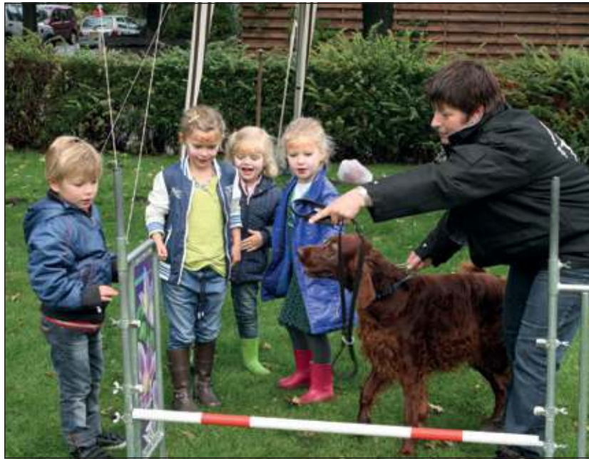
Het 5-jarig bestaan van de kliniek werd feestelijk gevierd.

Met groot enthousiasme werden zaterdag 6 oktober knuffeldieren geopereerd en speurtochten gehouden in de kliniek aan de Alfred Nobellaan. Het 5-jarig bestaan werd feestelijk gevierd met een Open Dag. Kinderen én volwassenen mochten bij uitzondering in alle onderzoeks- en operatiekamers rondlopen. Gewapend met een vragenlijst, leerden zij hoe de kliniek te werk gaat. Een bezienswaardigheid met niet-alledaagse tafereel als spoelwormen, blaasstenen van honden en een bezoek aan de röntgenkamer. Met een hondenparcours en informatiestands over fysiotherapie, kattendrag en dierenopvang, vermaakten dierenliefhebbers zich ook buiten de kliniek. Voor de kleinsten was er een springkussen en voor de liefhebbers een ritje op een echte pony.