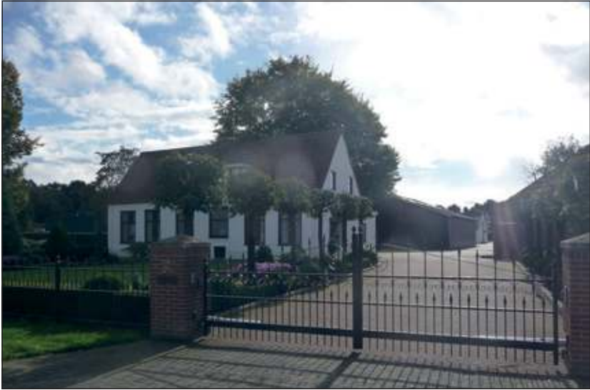
Hij woonde op de boerderij van zijn ouders aan de Nieuwe Wetering, waar zij vaak wel een kwart liter melk kreeg en soms ook wel een boterham.