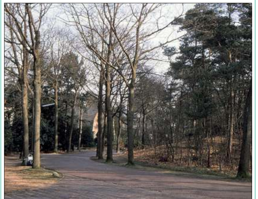
Het huidige beeld gezien vanaf de hoek van de Schubertlaan.