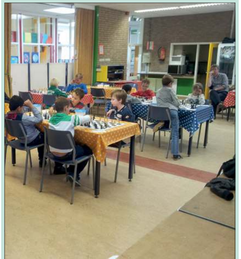
Opvallend is de hoeveelheid jongens die de schaaksport interessant vindt. Kom op meiden!