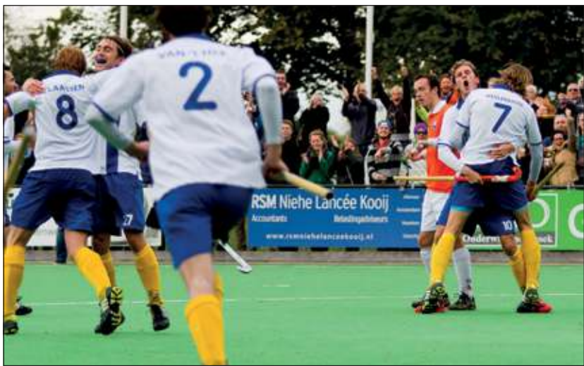
Er viel zondag genoeg te juichen voor het hockeypubliek in Groenekan. De drie goals van Voordaan tegen Bloemendaal werden helaas niet met punten beloond.

Dames 1 kon op eigen veld niet voor een verrassing zorgen tegen HIC. De koploper uit Amstelveen was met 3-0 te sterk. Volgende week spelen de dames uit tegen Tilburg.