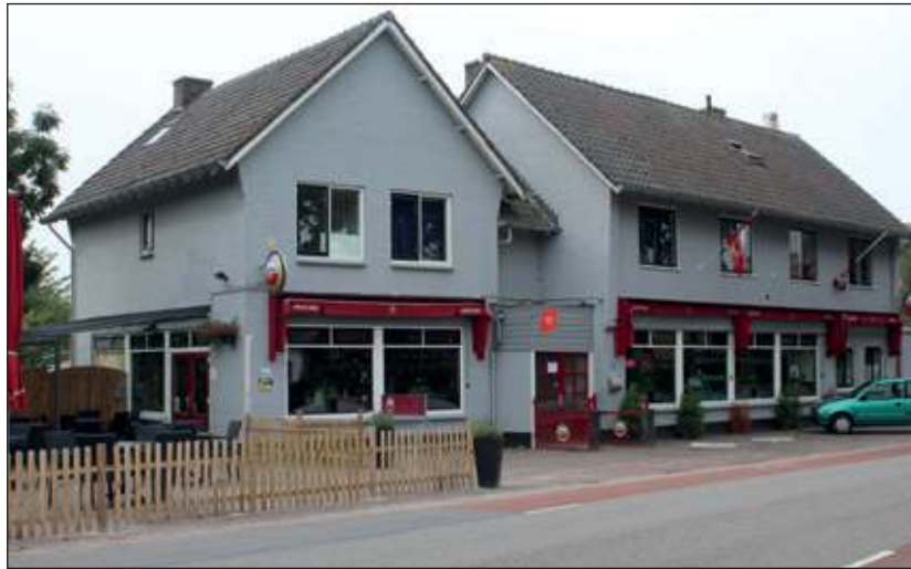
't Wapen van Maartensdijk is al weer sinds jaar en dag een begrip in Maartensdijk en omstreken.

Heeft u oude foto's die betrekking hebben op de voormalige vier kernen van de gemeente Maartensdijk? Of bent u benieuwd naar een speciaal Maartensdijks plekje? Meld dit de redactie op info@vierklank.nl en wij zullen proberen de reis vanuit het verleden op te pakken.