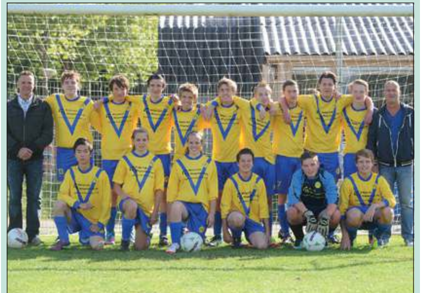
De B1 van van SVM wordt ook dit jaar weer gesponsord door Meijerink Wegenbouw.