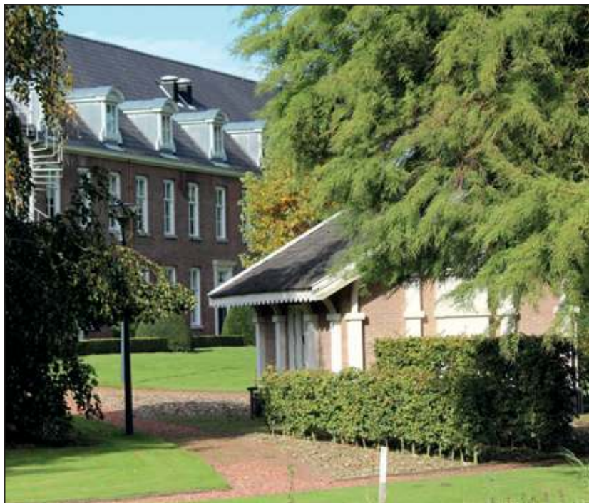
Het speelhuis is nog steeds, zij het op een andere plek, bij Houtringe terug te vinden. Het moest in 2003 verplaatst worden in verband met uitbreiding van het naast gelegen kantoorgebouw. Aangezien het een Rijksmonument is mocht het niet worden afgebroken. Op maandag 30 juni 2003 werd het 45.000 kilo wegende huisje 1,80 meter opgevoerd en, kijkend naar het huis, schuin rechts voor het huis geplaatst.

In het park stond al een speelhuisje in 1858. Het in baksteen uitgevoerde rechthoekige gebouwtje van één bouwlaag met zwart geschilderde plint heeft een met gesmoorde tuiles du nord pannen gedekt flauw hellend zadeldak met breed overstek, dat aan alle zijden geschoord wordt. Tegen het midden van de blinde achtergevel is een schoorsteen gemetseld, die boven het dakvlak zwart en onder het dakvlak wit is geschilderd. Rondom het speelhuisje liggen gele klinkers. [HvdB]