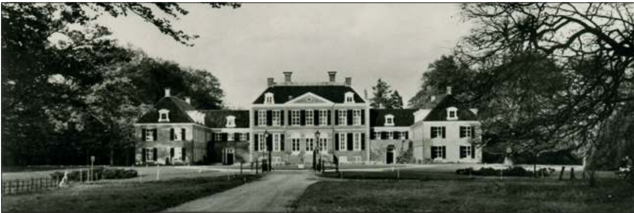
Een foto van Holle Bilt 22; het huidige hoofdkantoor van de Grontmij.