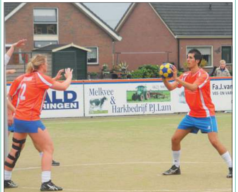
Na een laatste koude buitenwedstrijd kijkt Dos uit naar de zaalcompetitie.

Na de herfstvakantie en hierna beginnen de trainingen in de zaal. Zaterdag 27 oktober a.s. speelt DOS haar eerste oefenwedstrijd tegen Tiel'72 in Maartensdijk om 19.30 uur.