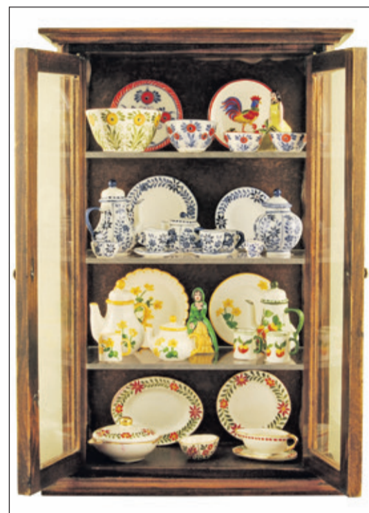
Een porseleinkast in miniatuurformaat met eigen gemaakt en beschilderd porselein (een bord heeft een doorsnee van 2 centimeter).

in de Eusebiuskerk aan het Kerkplein in Arnhem. Daar wordt ook het zogenaamde Rembrandt Huys gepresenteerd. Inspiratiebron voor dit poppenhuis is het Museum Het Rembrandthuis in Amsterdam. Het huis is gebouwd in 1:12 en heeft in totaal acht vertrekken. Elk vertrek is met grote precisie en vakmanschap ingericht. Heel veel typisch Nederlandse meubels en accessoires en de typisch Nederlandse ramen en deuren zijn speciaal voor dit project gemaakt. Na de beurs wordt het huis overgedragen aan het Rembrandtmuseum in Amsterdam waar het huis een permanente plek krijgt.