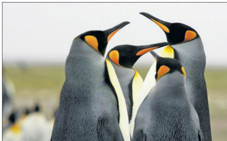
Fotowerk van Jack Folkers.

Jack Folkers doet zijn verhaal in foto en film op dinsdag 6 maart van 14.30 tot 16.30 uur in Het Dorpshuis van Westbroek. Kosten zijn 3 euro, inclusief koffie of thee. Wanneer u wél wilt komen, maar niet weet hoe, kunt u vervoer regelen via de familie Kalisvaart, tel: 0346-281181. Ook wanneer u niet in Westbroek woont, bent u van harte welkom.