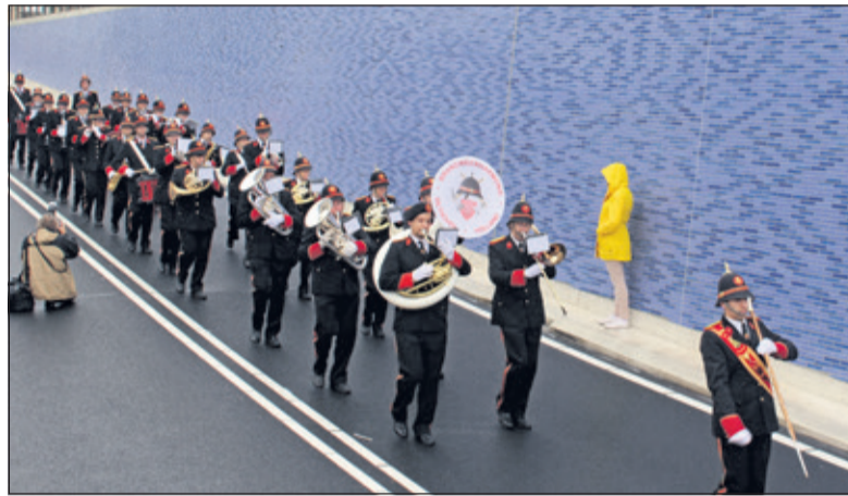
De brandweerharmonie klonk afgelopen jaar bij de opening van de tunnel.

film geschreven, waarbij de Brandweerharmonie in vlammen opgaat. En wat er dan verschijnt? Daarvoor moet u echt aanwezig zijn bij dit bijzondere concert. De toegang is gratis. Aanvang 20.00 uur, deur open 19.30. HF Witte centrum, Henri Dunantplein 4, De Bilt Verzekerd zijn van een plaats? Graag aanmelden via muziekdag@brandweerharmonie.nl. (Donja Hoevers)