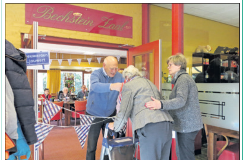
Aan het einde van de tocht wachtte er voor alle deelnemers een medaille en een warm applaus.

Onder begeleiding van vrijwilligers, familieleden en medewerkers volgde iedereen de route langs de elf steden, nadat per groepje het startschot was gelost. Bij iedere stad had de stempelpost een opdracht klaarliggen waaronder zing een stukje van het Friese volkslied, schilder de Friese vlag, verschillende Quizvragen en maak zoveel mogelijk woorden met de letters uit het woord Elfstedentocht. Ook waren er Friese versnaperingen als suikerbrood, Friese kruidkoek, nagelkaas, worst en roggebrood met haring en ontbraken de erwtensoep en de broodjes warme worst niet. (Marlies Dijkkamp)