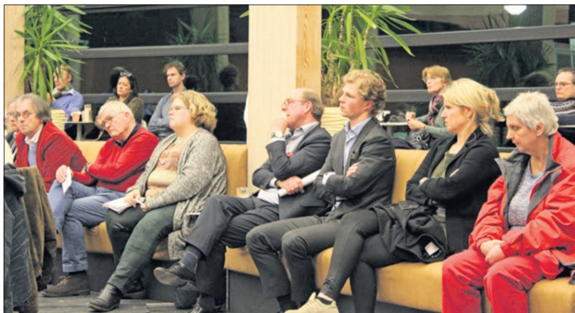
Inwoners uit Groenekan volgen nauwlettend de ontwikkelingen in de raadszaal.