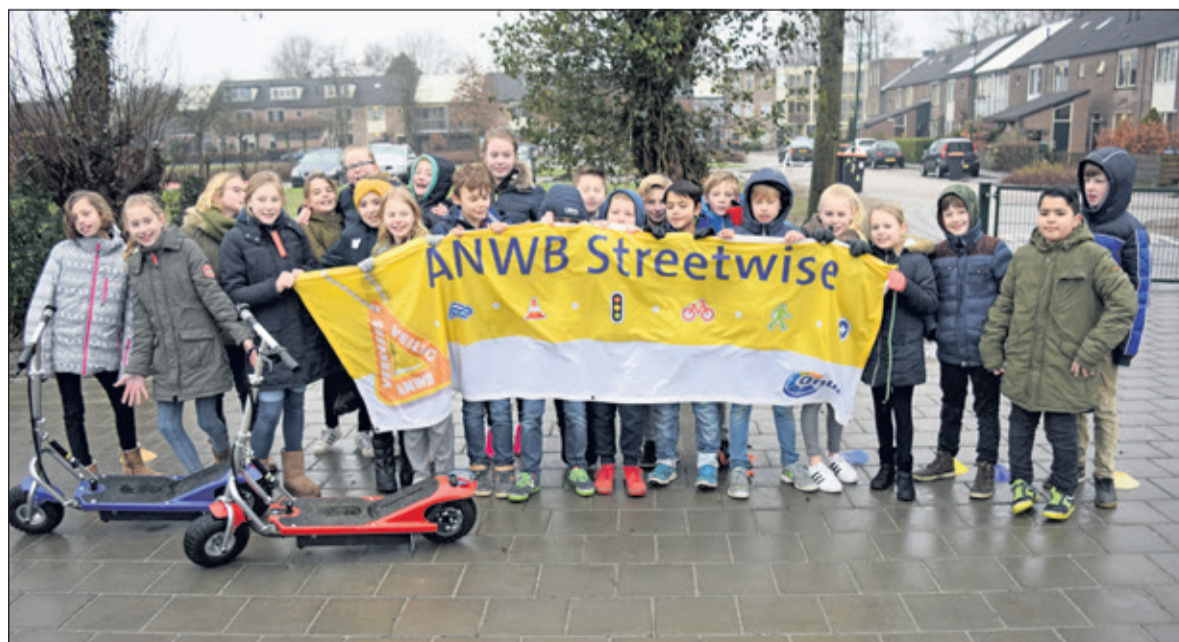
Dankzij Streetwise wordt het steeds veiliger in het verkeer.

Nijepoort. 'Als school vinden wij het belangrijk dat onze leerlingen zich veilig in het verkeer begeven en daarom hebben wij de ANWB