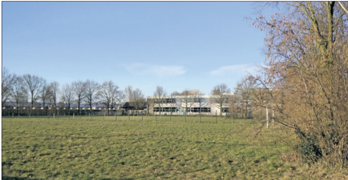
De kavel aan de Dierenriem tussen het sportcomplex van SVM en de Aeres VMBO-school Maartensdijk is maar voor een deel gemeentelijk eigendom.

daar is haalbaarheidsonderzoek gedaan dat uitwijst dat deze op de betreffende locatie niet haalbaar is vanwege het verkeerslawaaï van zowel de Rijksweg A27 als de Dierenriem, industrielawaai en lichthinder van de naastgelegen sportvelden. Aangezien de initiatiefnemer ook openstaat voor de ontwikkeling van bedrijfsbebouwing aan de Dierenriem, heeft B en W vervolgens ook die mogelijkheid onderzocht. Uit dat onderzoek is gebleken, dat de locatie aan de Dierenriem geschikt is voor bedrijven in milieucategorie 1 of maximaal milieucategorie 2. Aangezien niet de gehele benodigde locatie aan de Dierenriem gemeentelijk eigendom is, heeft ook overleg plaatsgevonden met de eigenaar van het naburig perceel.