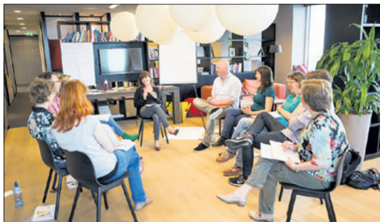
Deelnemers aan een KlimaatGesprekken-workshop motiveren elkaar om in actie te komen.