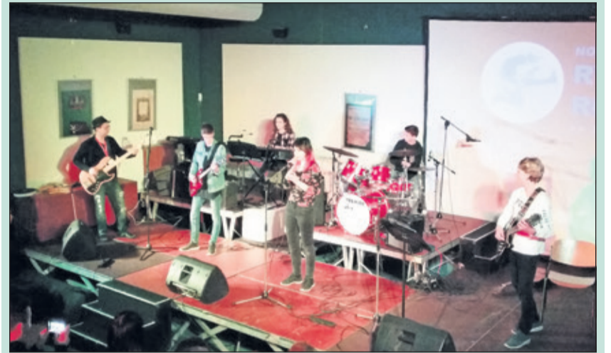
Rhythm & Roses uit Bilthoven vertolkt Zombie van The Cranberries.