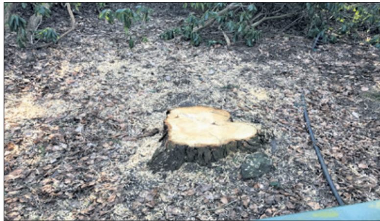
Wat rest is slechts een stompje.

De politieke vragen werden door de gemeente ambtelijk beantwoordt: 'Onze rol is het beoordelen/toetsen van alle vergunningsaanvragen aan de hand van de ingediende stukken. Vaak schakelt de aanvrager voor het indienen van zijn aanvraag een gemachtigde in of onderbouwt hij zijn aanvraag aan de hand van een rapportage van een ter zake kundig adviseur of bureau. Indien wij twijfelen aan de motivering, zoeken wij de aanvrager alsnog om een goede motivering te overleggen. Slechts in incidentele gevallen is onderzoek ter plekke nodig.