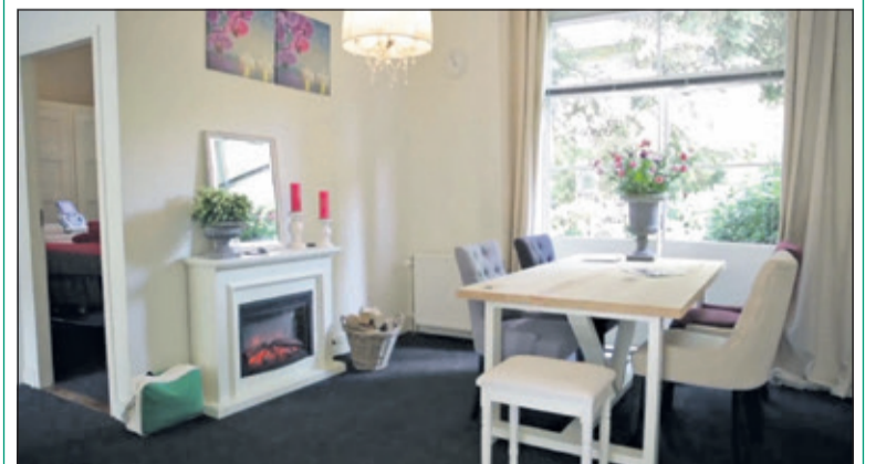
Bij Easyslim.nu kunt u rekenen op een warme ontvangst.

Kijk op www.easyslim.nu voor meer informatie of bel voor een afspraak 06-19442003. Heeft u het kortingsbonnenboekje gemist? U kunt alsnog een exemplaar halen op o.a. het kantoor van De Vierklank. Kijk voor een volledig overzicht van de afhaaladressen op www.vierklank.nl