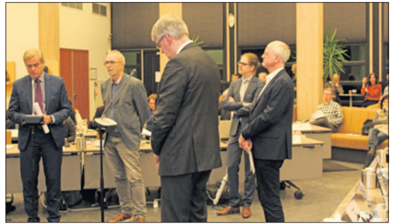
Drukte bij de interruptiemicrofoon.

Een soortgelijke motie ingediend door Forza waarin de nadruk op handhaving ligt wordt na hoofdelijke stemming met 1 tegen 26 stemmen verworpen. Een motie van de PvdA om aan de hand van een checklist een onderzoek uit te voeren naar de onafhankelijke cliëntondersteuning wordt verworpen evenals de motie afvalinzamelingsbeleid ingediend door Peter Schlamilch. De raadsvergadering werd geschorst en wordt donderdag 15 maart voortgezet.