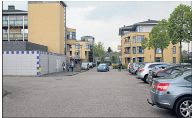
De minder intensief gebruikte noordelijke parkeerplaats is inzet voor realisatie van een appartementengebouw.

Voor de mogelijke grondruil was een locatie aan de Dierenriem in Maartensdijk op het oog. Naar de mogelijkheden van woningbouw