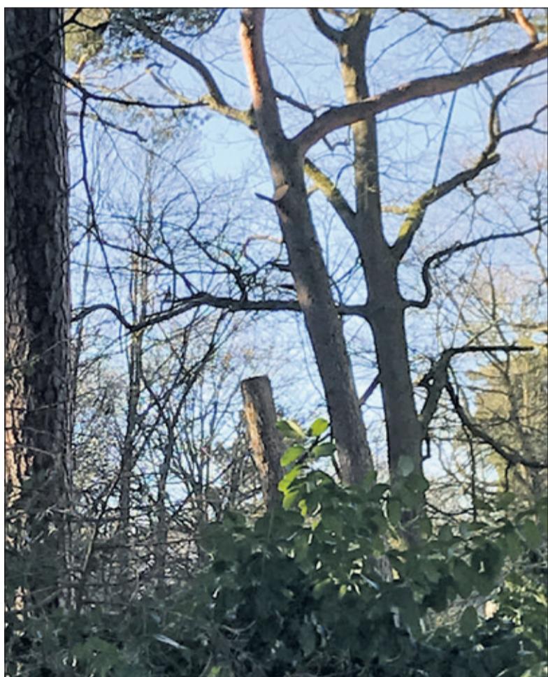
Wel of niet legaal kappen is door de gewijzigde regels niet altijd even duidelijk.

volstaat het huidige kapbeleid en is op het punt van het eisen van een onafhankelijk deskundigenrapport bij een aanvraag voor een (nood) kap geen aanpassing nodig. De hevige sneeuwval op 11 december 2017 veroorzaakte een extra aantal aanvragen voor noodkap. Wij zijn van mening dat wij bij de beoordeling daarvan adequaat hebben gehandeld in de afweging van de veiligheid van personen en zaken enerzijds en het beschermen van het groen anderzijds. Daarnaast geldt dat ook bij aanvragen voor een noodkap een complete en duidelijke aanvraag moet worden ingediend die wij vervolgens objectief en zorgvuldig beoordelen aan de hand van de wettelijke toetsingskaders'.