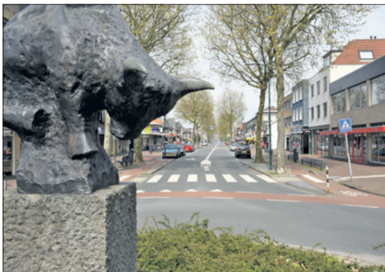
Bepaal mee over de toekomst van bijvoorbeeld de Hessenweg.

De omgevingswet komt eraan. Daarmee wil de overheid de regels voor ruimtelijke ontwikkeling makkelijker maken. Ook biedt de wet straks meer ruimte voor lokale initiatieven en maatwerk. In de kern De Bilt is de gemeente al aan de slag met een pilotproject. Doel is