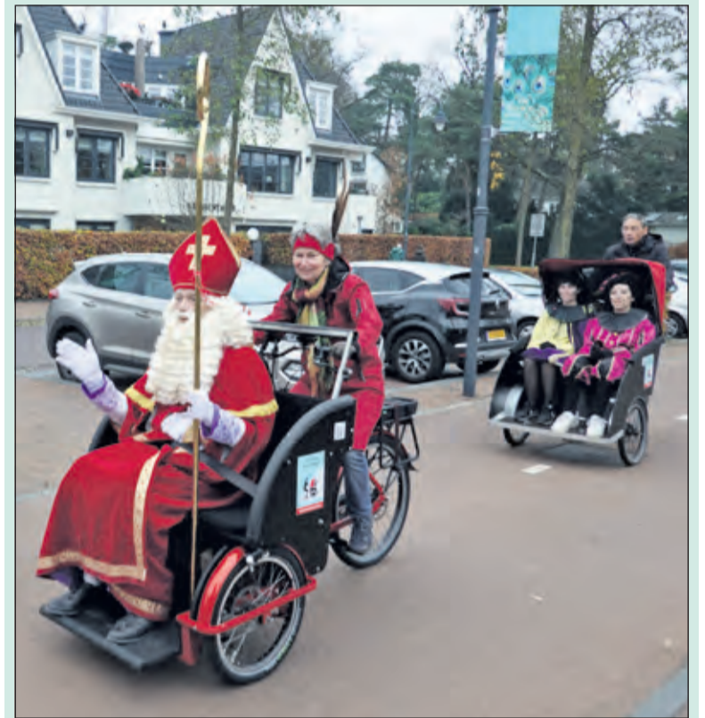
Sinterklaas wordt comfortabel vervoerd in een Riksja.