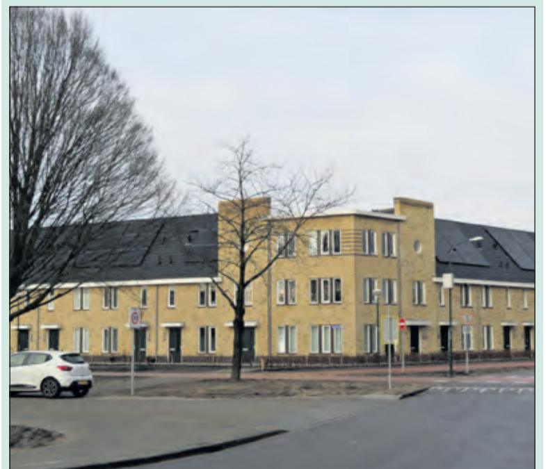
De Hof van Bilthoven is onlangs gerealiseerd.

De Toekomstdebatten voor de Omgevingsvisie zijn gepland voor volgend jaar. Inwoners worden nadrukkelijk uitgenodigd om hun kennis en kunde in te blijven inzetten om tot een gedragen invulling te komen van de woningbouwopgave, in samenhang met andere opgaven in de fysieke leefomgeving. De Woonvisie staat vanaf donderdag 2 december op www.debilt.nl/woonvisie . De visie wordt op 9 december besproken in de Raadscommissie Openbare Ruimte en 23 december in de vergadering van de gemeenteraad. Voor inspraakmogelijkheden zie www.debilt.nl/wonen-en-bouwen.nl . [HvdB]