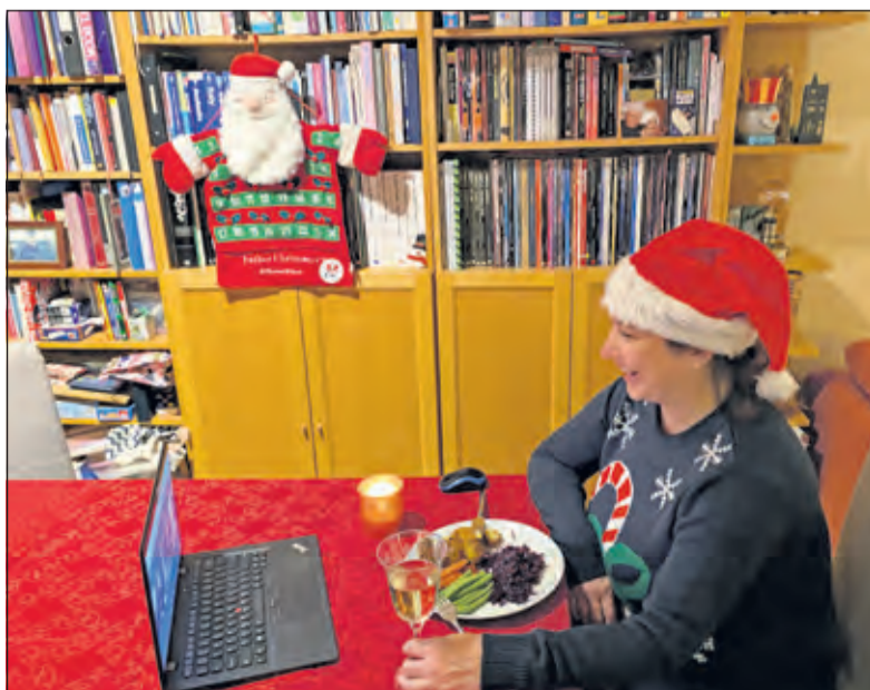
Een Eet Mee Kerst-video-etentje.

Wil jij gasten aan je (virtuele) eettafel ontvangen tijdens de feestdagen of graag als gast aanschuiven voor een etentje bij iemand thuis of een video-etentje? Meld je dan aan via www.eetmee.nl en maak een account aan in de speciale matchapplicatie. Gasten voor een etentje thuis kunnen zich ook telefonisch aanmelden via 030 2213498. Bij de etentjes thuis worden de dan geldende coronamaatregelen door het eetadres en de gasten opgevolgd. Heb jij nog een plaatsje over aan het kerstdiner, of heb je nog geen kerstplannen en zou je graag aanschuiven? Aanmelden voor een kerstmatch kan tot en met 15 december. Meer informatie en aanmelden via www.eetmee.nl of 030 2213498.