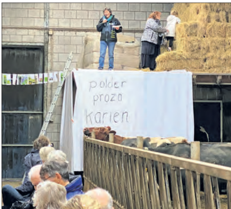
Een hoog podium boven de koeien.

Voor lezers van De Vierklank is een aantal exemplaren ter beschikking gesteld. Om hiervoor in aanmerking te komen stuurt u een mail naar info@vierklank.nl met in het onderwerp Haiku. De exemplaren worden onder de lezers verloot. Iedereen krijgt bericht.