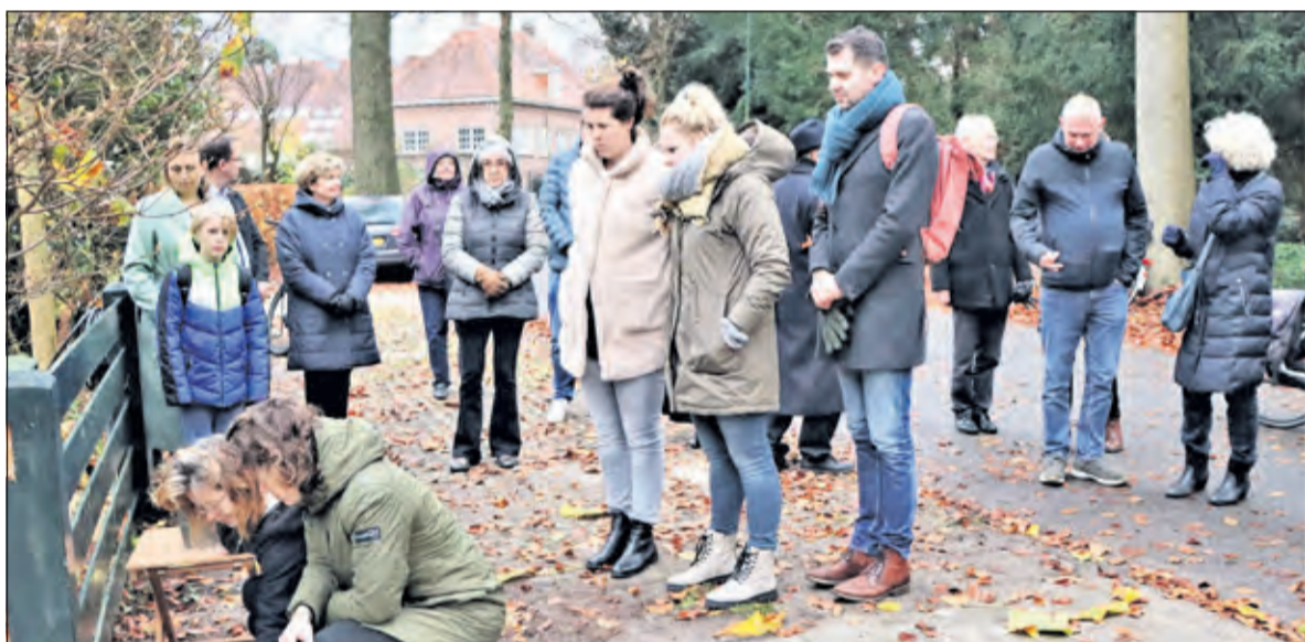
Grote belangstelling voor de steenlegging op de Rembrandtlaan.