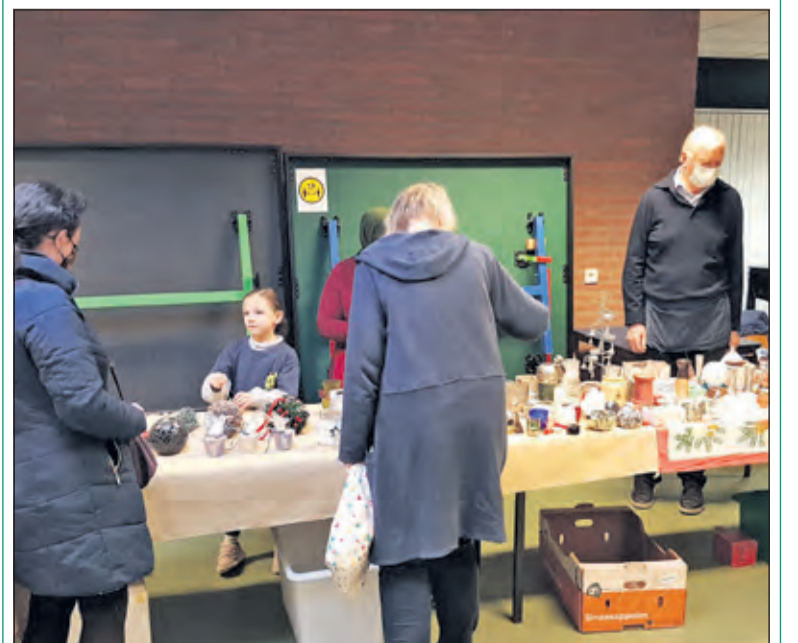
Op de Kerstmarkt van WVT kon men alvast in kerststemming komen.

Dankzij de enthousiaste vrijwilligers van WVT en Transition Town De Bilt was het wederom een geslaagde samenkomst, waarvan de opbrengst geheel ten goede kwam aan WVT. (Peter Schlamilch)