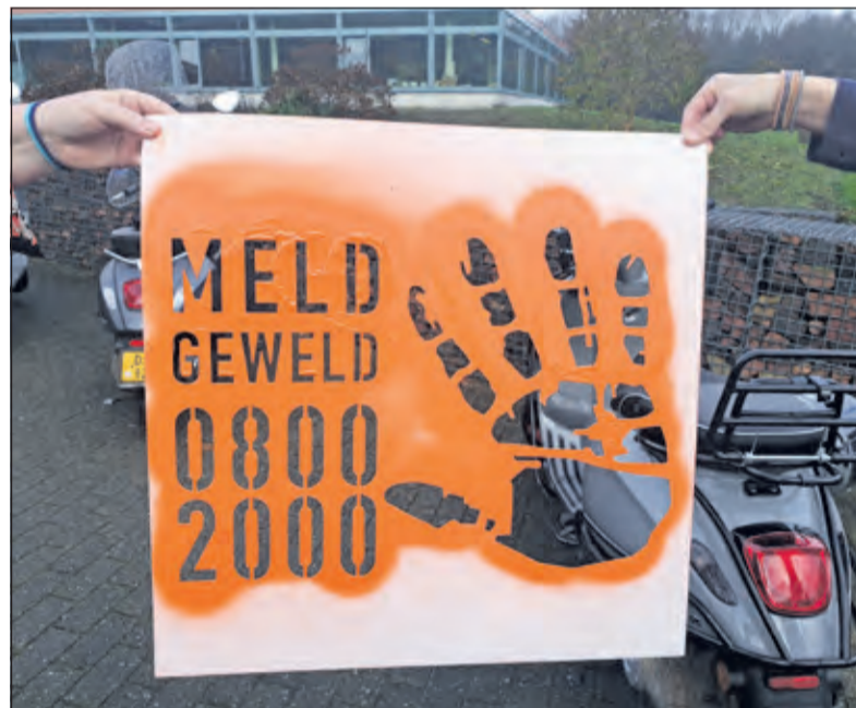
Met het sjabloon ‘Meld geweld 0800-2000’ wordt de boodschap duidelijk verkondigd.

waarop ze mogen reageren. Bijvoorbeeld of schelden een vorm van geweld is. Direct bij de eerste les bleken de meningen uiteen te lopen, waardoor in de klas discussie ontstond. Een deel van de leerlingen kreeg gedurende de les een ruimere blik op het onderwerp’. Het tweede deel van de thema-les is een praktische opdracht. 4 mavo- en 4 gymnasiumleerlingen van de Werkplaats maakten hun eigen poster om de campagne ook bij andere leerlingen onder de aandacht te kunnen brengen. De posters worden de komende periode opgehangen in de school’.