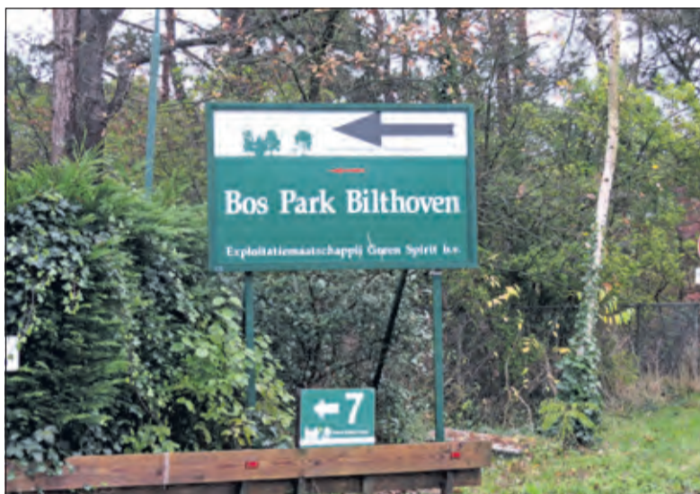
De ingang van Bos Park Bilthoven.