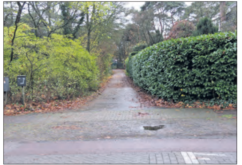
De oorspronkelijke entree van de camping en tennisvereniging Bilthoven aan de Julianalaan.