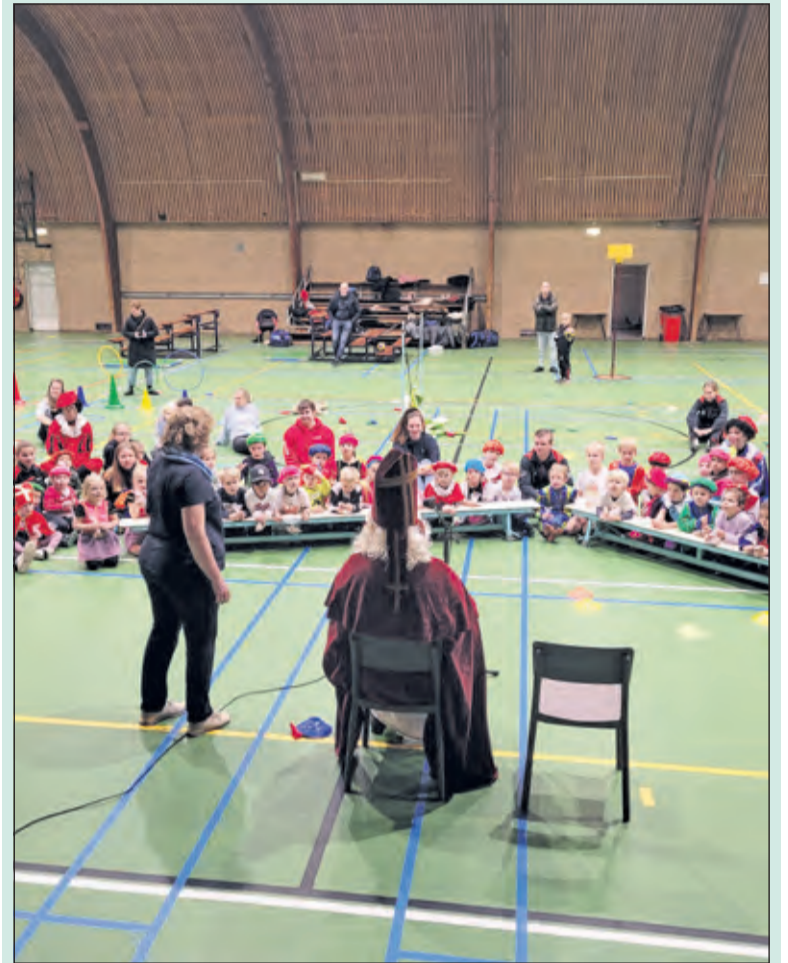
Aan het einde van de training volle aandacht voor Sinterklaas.