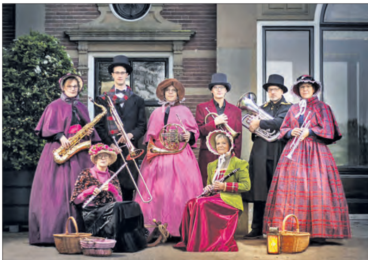
De Dickensband van het NBO.