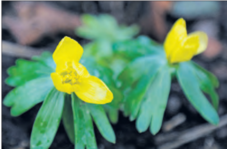
De winterakonie is een van de stinzenplanten van Sandwijkstraak.

Samen met IVN-natuurguiden kunt u de stinzenplanten en vroege voorjaarsbloeiërs bekijken die vanwege de zachte winter in de