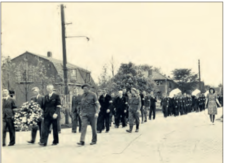
Deze foto van een begrafenisstoet voor verzetsstrijders is opgenomen in de expositie.

De tentoonstelling is van 12 t/m 21 maart 2020 - di t/m za van 10.00 tot 16.00 uur te bezoeken in Regionaal Historisch Centrum Vecht en Venen, Schepersweg 6E, Breukelen. Vrij toegankelijk.