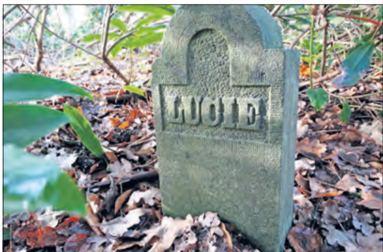
De laatste rustplaats van het paard van de barones.

Terug naar de wandeling en de verstilde plek in het bos van de baron. Of misschien beter, het bos van de barones. Je moet het weten. Strak naast het pad bij de mammoetboom, een beetje verstopt in de roodendrons staat een lieflijk klein grafsteentje. Een herdenkingsmonument voor Lucie. Een hondengrafje? Navraag bij een oude tuinman van het landgoed leert ons dat Lucie de naam was van het geliefde paard van de barones. Ergens in de tweede helft van de 19e eeuw moet hier een gigantisch graf gegraven zijn. Overmand door verdriet vraagt de barones aan de baron om hier naast het steentje een 'statement' plaatsen voor haar geliefde viervoeter. Dat is goed gelukt. Honderdvijftig jaar later groeit hier de gigant van De Bilt.