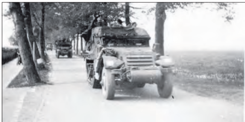
De bevrijders - Engelse Polar Bears - reden op 7 mei 1945 met hun Half Tracks Maartensdijk binnen.

Na de capitulatie liepen sommige Duitse soldaten met appelbloesem op hun pet. Soms zongen ze mee wanneer de eveneens in het huis verblijvende evacués het Wilhelmus zongen. Op maandagmorgen 21 mei trok een grote stoet Duitse soldaten achter uit het dorp via de Dorpsweg en de Tolakkerweg richting Hilversum. In de stoet waren, hoewel de capitulatie een feit was, ook een aantal gevorderde paarden met wagens. Later kon de eigenaar zijn paarden bij een