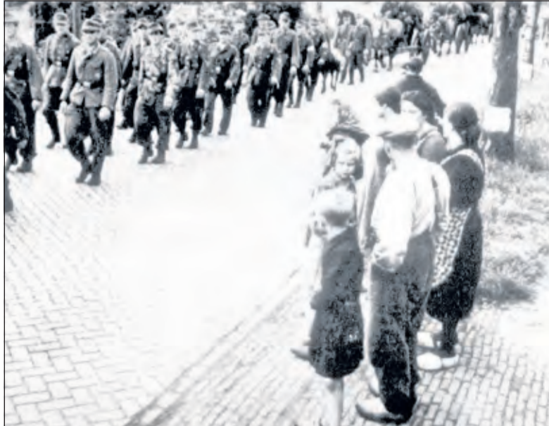
De familie van Zijtveld kijkt voor hun boerderij aan de Tolakkerweg in Hollandsche Rading naar de richting Hilversum wegtrekkende Duitse soldaten.

Zaterdag 5 mei 1945 capituleerden de Duitsers. Op maandagmorgen 7 mei reden de Engelse Polar Bears in Half Tracks vanuit Utrecht Maartensdijk binnen. Half Tracks zijn licht gepantserde militaire voertuigen met achter rups- en voor luchtbanden. Op het linker voorspatbord stond een ijsbeer afgebeeld. Dit was de mascotte van de Polar Bears, die tot de Second British Army behoorden en toegevoegd waren aan het Canadese bevrijdingsleger. De Duitsers gaven zich zonder gevechtshandelingen over en werden