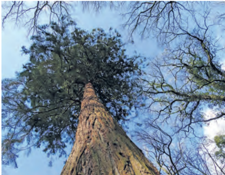
De 150 jaar oude Gigant van Sandwijkstraak.

Zaden van deze 'exoot' werden pas in 1852 naar Europa gebracht en alle hier verblijvende weeshuisboompjes zijn dus net de crèche ontgroeit. Opgeroeid zonder ouders noemt bestseller auteur Peter Wohlleben het straatjochies. Deze bomendromer gelooft, net als ik,