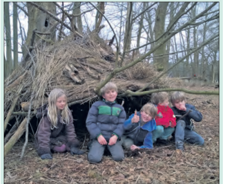
Hutten bouwen op Beerschoten.

Tijdens deze middag leer je hoe je een hut bouwt waar je in kunt overleven als het regent en ook nog koud is. Deze middag leer je alles over het bouwen van een hut met natuurlijke materialen die je kunt vinden in het bos. Je leert wat de meest geschikte plek is om een jut te bouwen, maar ook hoe je een hut waterdicht krijgt als je geen zeil hebt om te gebruiken. Leeftijd: 6 t/m 10 jaar. Aanmelden kan tot uiterlijk 7 maart kinder Natuuractiviteiten@gmail.com .