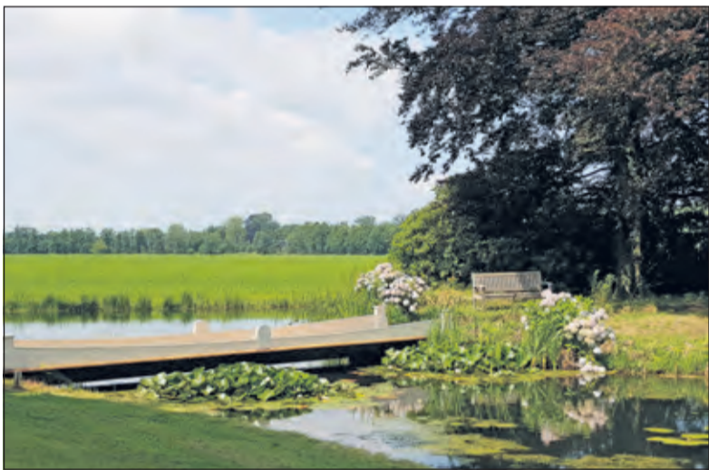
De restauratie van de vlotbrug is gereed.