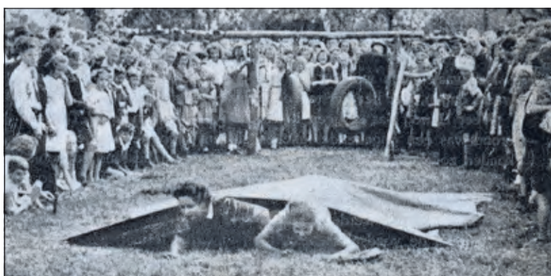
Volksspelen tijdens het bevrijdingsfeest in Maartensdijk.

Drukkerij Voordaan in Groenekan gaf in 1947 een herdenkingsboekje uit over de bevrijdingsfeesten in Maartensdijk en Groenekan. Aan de hand van de in het boekje afgedrukte foto's krijgt men een indruk van de activiteiten tijdens het bevrijdingsfeest. In de kern Maartensdijk werd feest gevierd op het weiland links naast de voormalige Dokterswoning aan de Dorpsweg 23. Volksspelen zoals tonnetje ste-