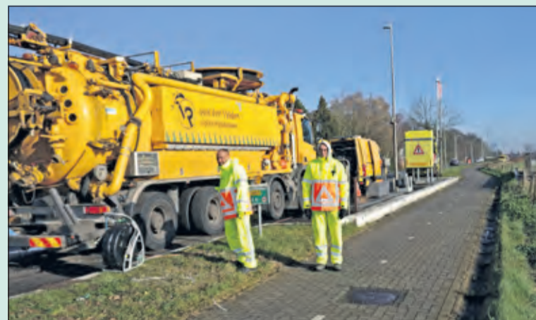
Gedurende 1 maand vindt rioolinspectie plaats.

Tijdens de werkzaamheden versmalt de aannemer ter plaatse de rijbaan er is dan één rijstrook beschikbaar. Verkeersregelaars zijn aanwezig om het verkeer beurtelings langs de werkzaamheden te leiden. De reinigingswerkzaamheden kunnen enige geluidshinder met zich meebrengen. Alle aanliggende panden blijven tijdens de werkzaamheden bereikbaar. Evenals het doorgaande verkeer, kan ook het openbaar vervoer gewoon doorgang vinden. Fietsers kunnen zonder hinder het fietspad/de parallelweg gebruiken. (Clara van Foreest)