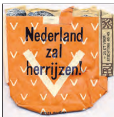
Wikkel van een pakje sigaretten dat tijdens de bezetting door de geallieerden werd gedropt.

Tijdens de laatste dagen van de bezetting was de stemming onder de in het dorp ingekwartierde Duitse soldaten mat. Ze verlangden naar huis. Bij een gezin aan de Dorpsweg was in de voorkamer een Funkstelle (radiozender) gevestigd. Eén van de Duitse soldaten luisterde ook naar Radio Oranje en schreef voor de bewoners van het huis berichten over de vorderingen van het geallieerde bevrijdingsleger op en gaf dit verstoppt in de kolenkit door. Bij sommige families was er