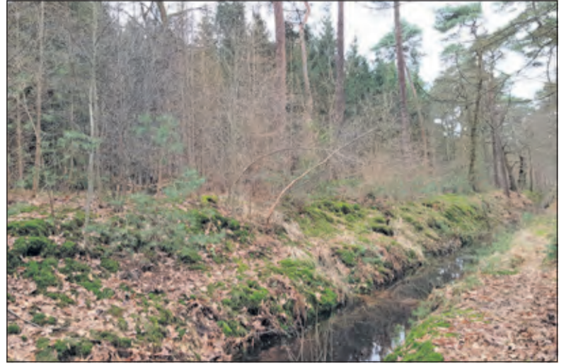
De oostelijke oever van de Zinksloot is dichtgroeid met boomopslag, waardoor de sloot vanaf het pad niet meer goed zichtbaar is.