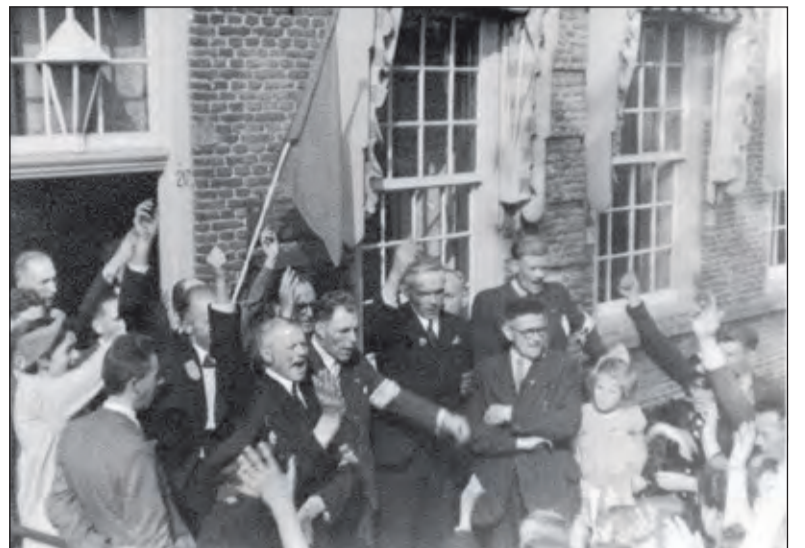
Kort na de bevrijding de gemeenteambtenaren op de stoep van het gemeentehuis.

Op 5 mei 2020 is het 75 jaar geleden, dat Nederland werd bevrijd. In De Vierklank van 29 april 2007 verhaalt Koos Kolenbrander de herinneringen van enkele -toen al - 80 plussers. In de aanloop naar het a.s. bevrijdingsjubileum herplaatsen wij graag die bijdrage. Henk van de Bunt