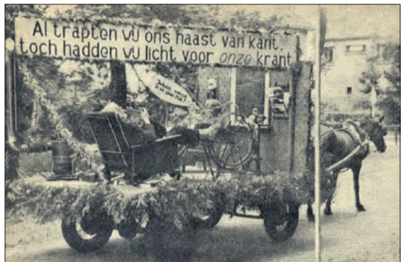
Allegorische voorstelling hoe het lichtprobleem werd opgelost.

Een poosje na de bevrijdingsroes moest het gewone leven weer op gang komen. Sommige schaarse producten waren nog zeker twee jaar alleen op de bon verkrijgbaar. Trouwen vlak na de bevrijding was vaak improviseren. Een jongen en een meisje, die in ondertrouw gingen, mochten ieder maar 200 gulden van hun bankrekening opnemen.