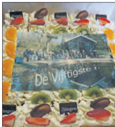
Bakkerij van Ingen schonk een feestelijke taart.

De werkochtenden vinden iedere laatste zaterdag van de maand plaats. Dan steken gemiddeld 15 vrijwilligers de handen uit de mouwen. Tijdens de koffiepauze op die ochtenden in het parkhuisje is hun enthousiasme telkens weer merkbaar.