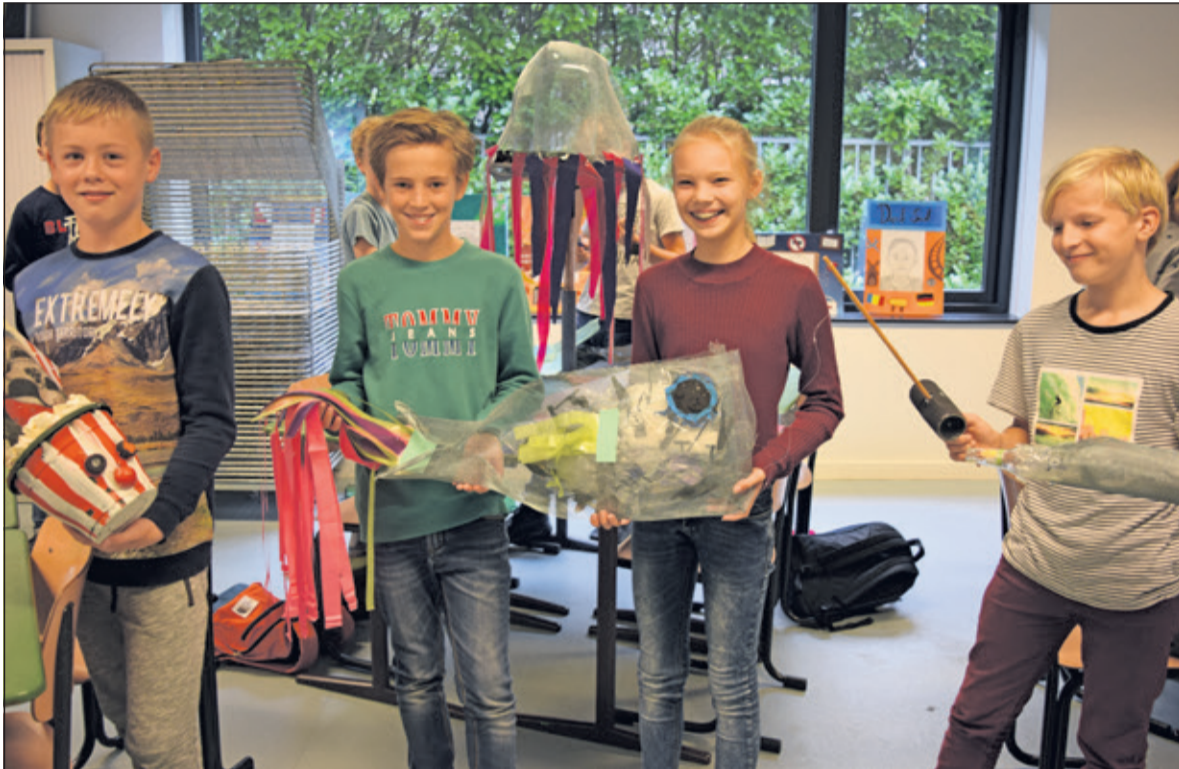
Leerlingen van de brugklas met hun kunstwerk 'Stinkvis'.

Tussen maandag 17 september en vrijdag 21 september gingen alle brugklassers van Het Nieuwe Lyceum in Bilthoven de strijd aan met het zwerfafval rond hun school. De school heeft maar één doel voor ogen, namelijk jongeren aanzetten tot een mentaliteitsverandering voor wat betreft zwerfafval en plastic soep.