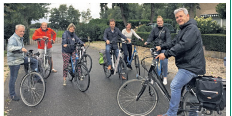
Het CDA fietste aan de start van het nieuwe seizoen door Hollandsche Rading, Maartensdijk en Westbroek. Het CDA fietst ook bij u langs!