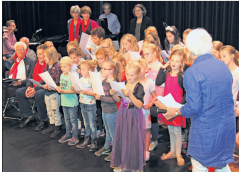
Leerlingen van de Julianaschool (Bilthoven) en bezoekers van het Ontmoetingscentrum De Bilt vormen een gelegenheidskoor.

Brommersma meldde dat de gemeente De Bilt dit probleem hoog op de agenda staat: 'Met huisart-