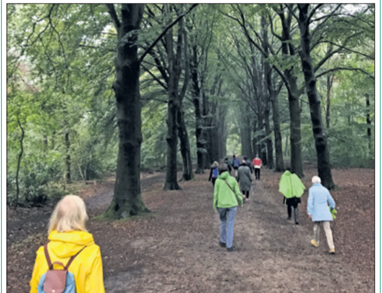
Zondagochtend 23 september liepen 15 deelnemers in stilte mee met de stiltewandeling, vanuit de OLV Kerk in Bilthoven.