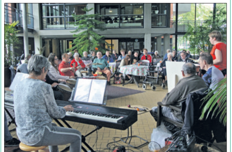
De Tornado's krijgen het publiek mee.

Zaterdag 22 september gaven de Tornado's een theeconcert in het atrium van de Woongroep Lugtensteyn. De leden, die een beperking hebben, speelden en zongen bekende Nederlandse en Engelse nummers. Te horen waren o.a. 'Streets of London', 'De Zilvervloot', 'Er zaten twee Motten', 'Aan de Amsterdamse Grachten', 'Het kleine Café aan de haven' en 'Raindrops keep falling on my head'. Er waren 2 zangers en als instrumentale begeleiding trommels, djembés, een lyra, 2 keyboards, klein slagwerk en een mondharmonica. (Frans Poot)