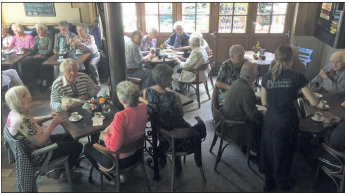
Gezellig samen lunchen in het Grand Café van Deurne.