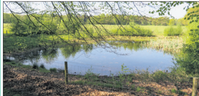
Eén van de verscholen poeltjes op Houdringe.

Op landgoed Houdringe liggen vier poelen, aan het oog onttrokken door bomen en bosschages en niet vrij toegankelijk voor het algemeen publiek. Op 30 september biedt IVN De Bilt de mogelijkheid meer te weten te komen over deze poelen en z'n fauna en flora. Het schepnet gaat mee. De excursie start om 13.30u en duurt ca. 1,5 uur. De verzamelplek is bij Vissersteeg 1 in De Bilt (einde parkeerplaats bij IJscub Het Biltse Meertje). De excursieleiding is in handen van Judith Barke en Marijke Wulp. Aanmelden en info s.v.p. bij marijkewulp@gmail.com. Het maximale aantal deelnemers is 20. Er zijn geen kosten aan deze excursie verbonden. (Roel Maas-Bakker)