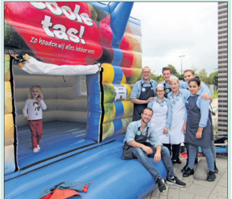
Het Coole springkussen onderstreept de festiviteiten rond het jubileum van Hoogvliet Bilthoven.

Op 20 september was het 5 jaar geleden dat de Hoogvliet supermarkt in Bilthoven aan de Leyenseweg feestelijk geopend werd. Dat werd van woensdag 19 tot en met dinsdag 25 september gevierd met spectaculaire extra aanbiedingen en op zaterdag 22 september kregen de eerste 250 klanten bij besteding vanaf 15 euro een gratis chocoladecake. Op het parkeerterrein van de supermarkt stond die dag het 'Coole tas' springkussen waarop kinderen zich konden uitleven.