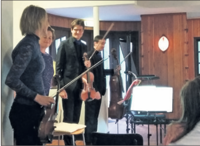
Ensemble d'Orion neemt het applaus in ontvangst.

'Oorspronkelijk was alle muziek slechts kamermuziek, bedoeld om beluisterd te worden in een kleine ruimte door een klein publiek.' Weinig kon Gustav Mahler, die deze woorden sprak, vermoeden dat zijn ideaal zo dicht benaderd zou worden, afgelopen zondagmiddag in het Walter Maashuis.