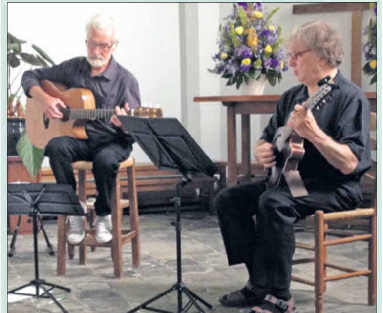
Beide heren speelden al enkele keren eerder met veel succes in Blauwkapel.

Zie www.onderwegkerkblauwkapel.nl (Ben van Hoeflaken)