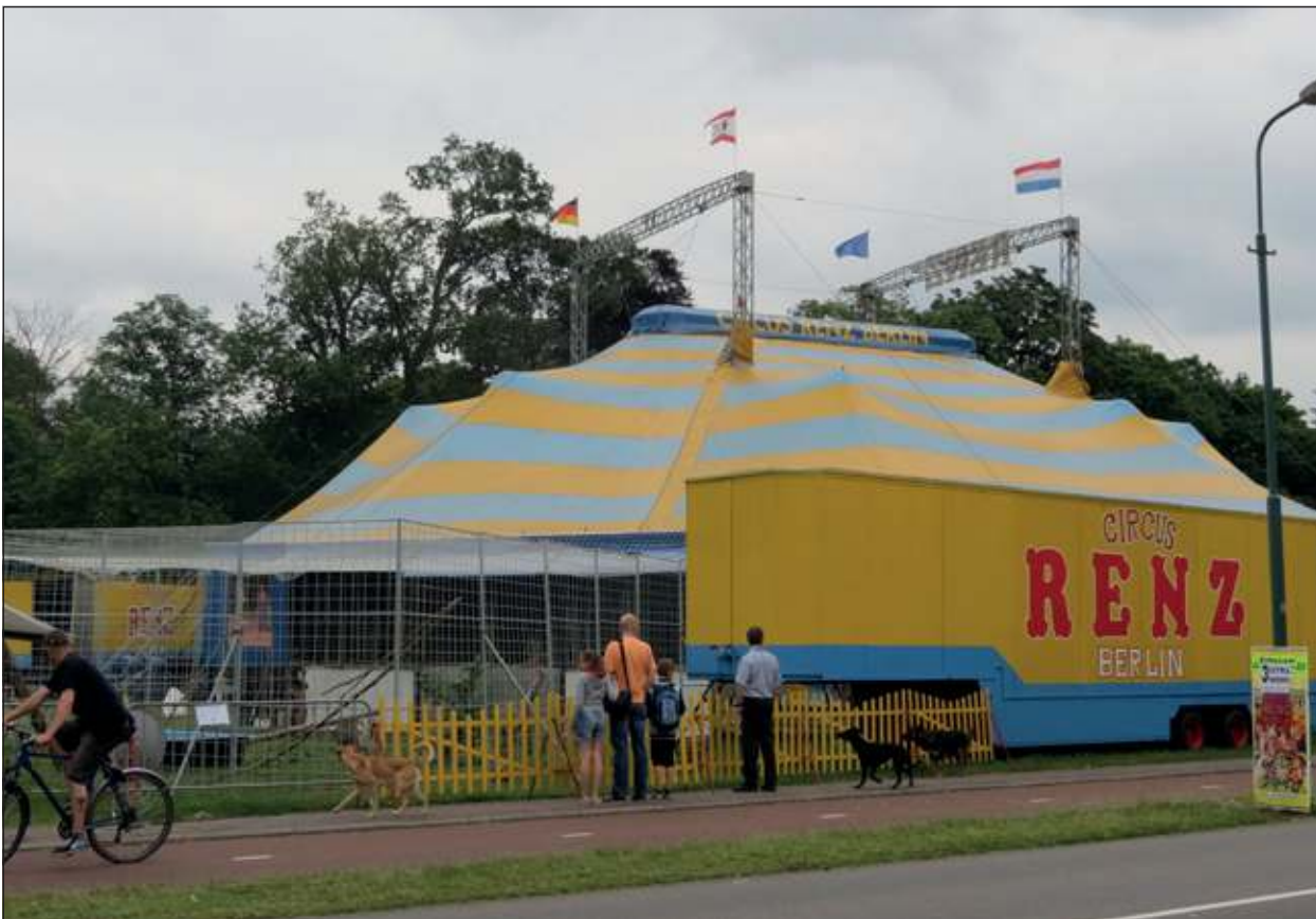
Circus Renz aan de Soestdijkseweg in Bilthoven.