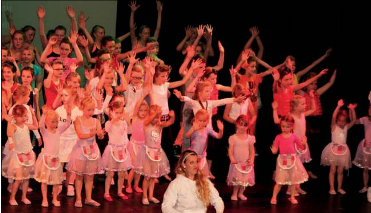
Met een podium vol enthousiaste dansers sloot Gymma het seizoen af.