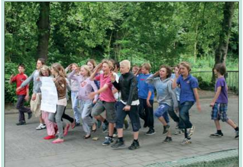
Na een korte nacht dwong groep 8 een aubade van de overige leerlingen af.

Deze ongebruikelijke actie werd bedacht omdat het afscheid van deze groep 8 bijzonder is. Maar liefst 13 leerlingen zijn de jongste telg van een gezin. De ouders van deze 13 kinderen tekenden voor de begeleiding gedurende de nacht. Hoewel er natuurlijk legio regels met deze actie werden overtreden, verliep de bezetting probleemloos en onderling in goede harmonie. Leerkrachten waren 's ochtends in eerste instantie 'not amused', maar herpakten zich later zeer sportief. Groep 1 t/m 5 zong het schoollied uit volle borst, waarbij groep 5 voor de leadzang tekende en de peuters vrolijk het refrein meezongen.