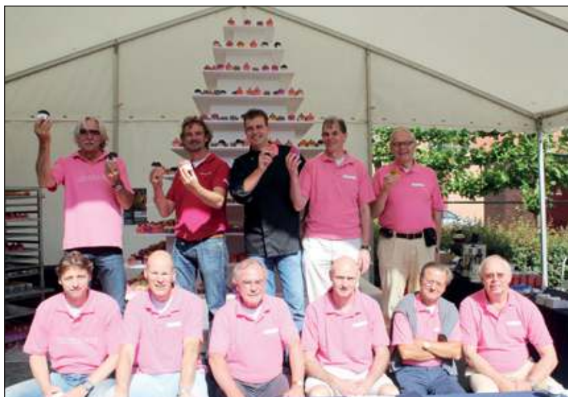
Taartjesdag is een initiatief van Kiwanis Bilthoven en werd mede mogelijk gemaakt door Top's Edelgebak, Segafredo en Wijnkoperij Baas & Zn.

gevoeligheid voor licht en aanraking. [HvdB]