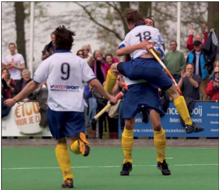
Voordaan hoopt komend seizoen in de Hoofdklasse ook veel doelpunten te kunnen vieren.