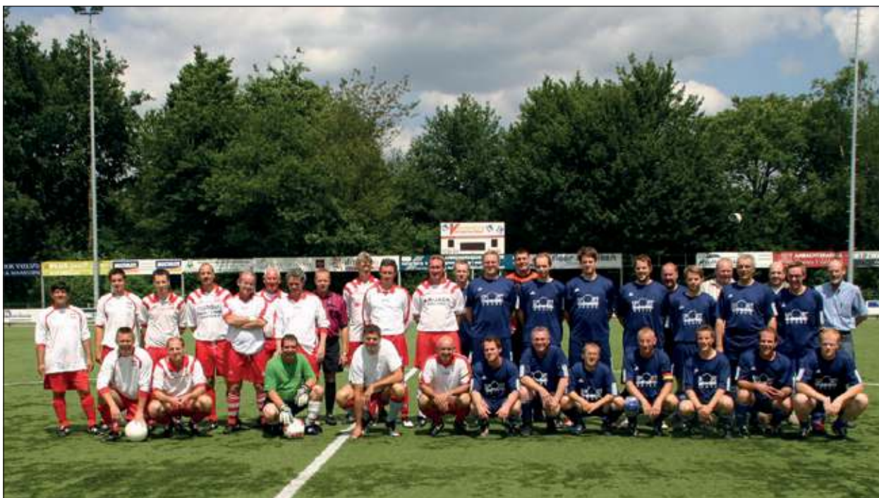
Sportieve ontmoeting op de grasmat van FC De Bilt.

De vriendschappelijke wedstrijd werd wederom beslist in het voordeel van onze oosterburen. De zonnige dag werd gezamenlijk afgesloten met een BBQ waarna het gezelschap uit Coesfeld om 19.30 uur huiswaarts keerde. (Fred van Ettikhoven)