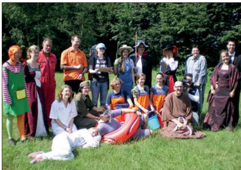
Deze vreemde types moesten 'opgebracht' worden.

Al met al was het een zeer geslaagde ochtend en kan er nu al met zekerheid gezegd worden dat er volgend jaar weer een vossenjacht gehouden wordt. Kun je niet zo lang wachten? Ga dan gewoon een keer kijken op scouting. Op de website www.aggermartini.nl vind je alle informatie en contactgegevens. (Kris Hekhuis)