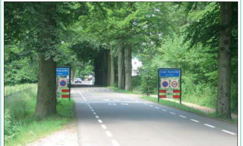
De plaats waar rechts de parkeerplaats wordt aangelegd.

Er komen 36 parkeerplaatsen waarvan er 2 invalideparkeerplaatsen zijn. De kosten voor de aanleg en het onderhoud zijn voor de gemeente Baarn. Met uitzondering van één slechte boom hoeven er verder geen bomen te worden gerooid. Vóór de in- en uitrit komt er een smalle brug over de sloot naast de Vuurse steeg. Onder de brug komt een hazelwormtunnel. Bewoners van het dorp zijn altijd blij met uitbreiding van parkeergelegenheid buiten het dorp maar vinden 36 plaatsen wel wat weinig.