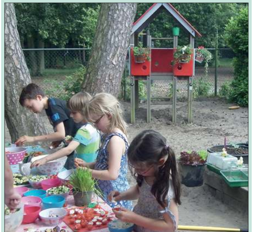
Kinderen van BSO de Leeuwerik zijn druk met de bereiding van de traktaties.