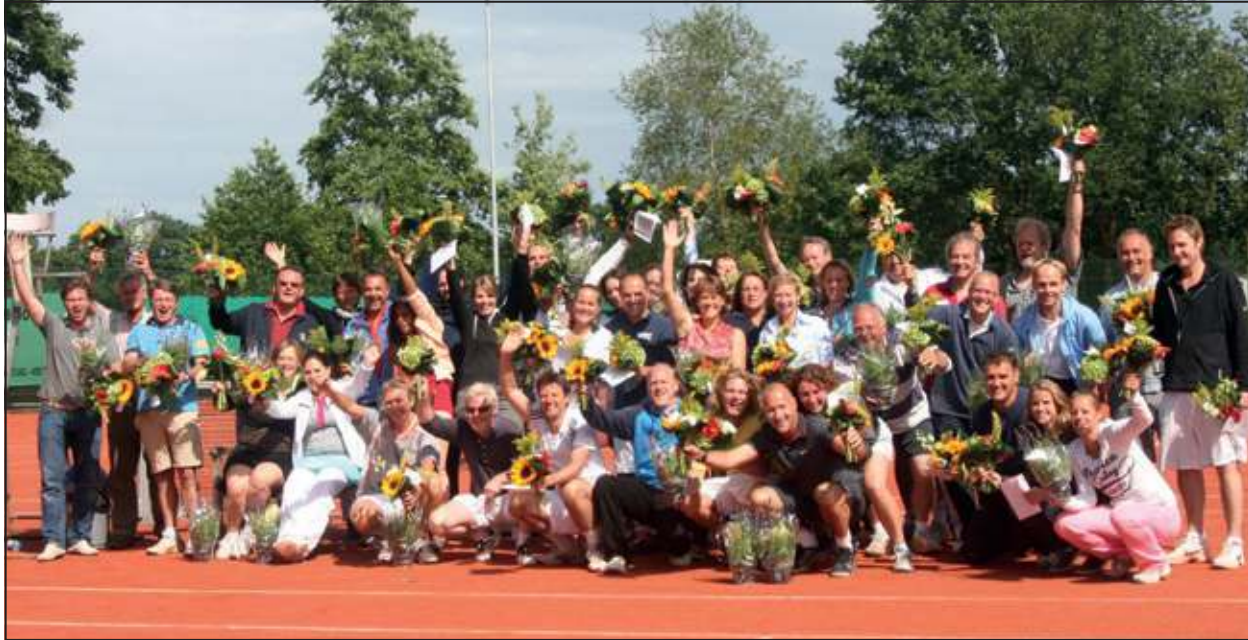
De prijswinnaars die hun finales op zondag speelden.

ren-80-bingo en met livemuziek van Laura Fygi gingen de beentjes van toernooispeleers en clubleden tot in de kleine uurtjes van de grond. Zelfs een stroomstoring en enkele hoosbuien hadden geen negatieve invloed op het feestgedruis.