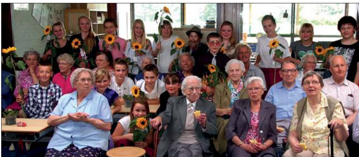
De Zonnebloem afd. Maartensdijk was te gast bij basisschool 't Kompas in Westbroek.