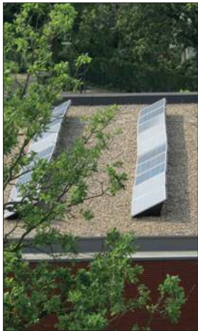
Duurzame energie op het dak van de Julianaschool in Bilthoven.