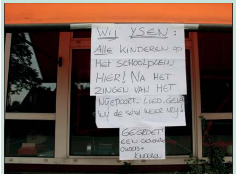
De eis was duidelijk of werd het nu toch ijs voor de leerlingen?