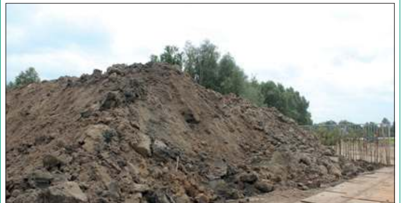
De ochtend van ons bezoek is er veel grond uit de Utrechtse wijk Hoograven aangevoerd en gekeurd. Na een wachttijd van 14 dagen zal nogmaals worden gekeurd, waarna de grond in de plas zal worden gebracht.

Wanneer we een foto maken en we luisteren goed horen we alarmerende Kleine plevieren en de zingende man Grote karekiet. Wigle vertelt dat de Kleine plevier een typische pionierssoort is, die verdwijnt als het eiland begroeit raakt en merkt op dat de Grote karekiet een zeldzame broedvogel betreft, waarvan nog slechts circa 250 paar in Nederland voorkomt. Waarneming van verstoringen of bijzondere flora & fauna kunnen worden doorgegeven aan de boswachter Hans Hoogwerf: 0651230679.