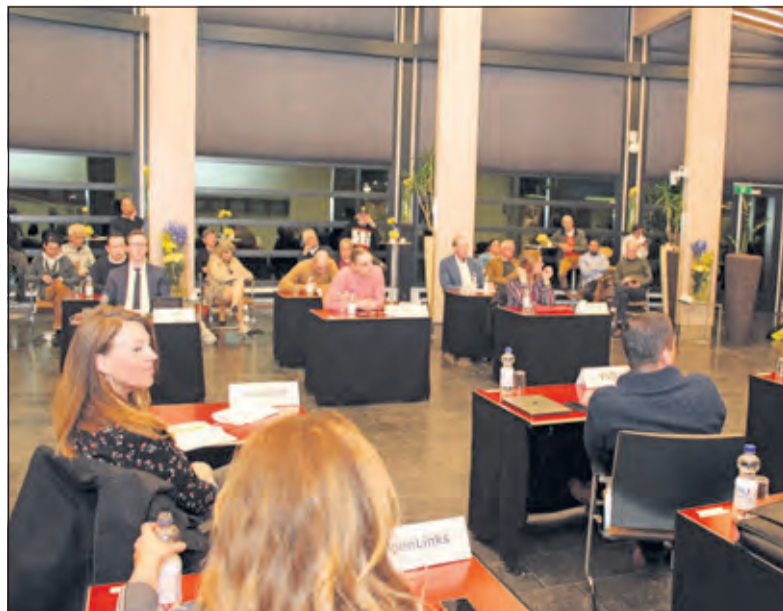
Het duidingsdebat over de verkiezingsuitslag.