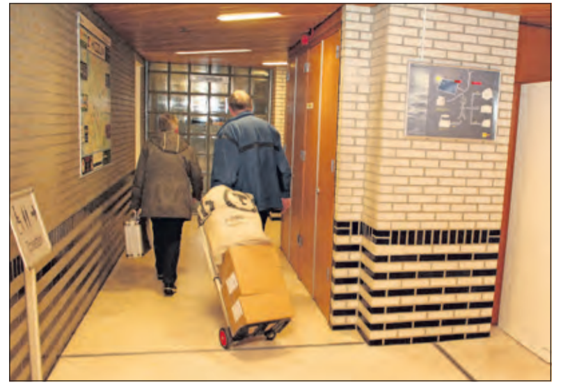
De stembiljetten van de stembureaus worden binnengedragen.

Uitslagen van kiezers die op 16 maart stemden op basis van 27 zetels.