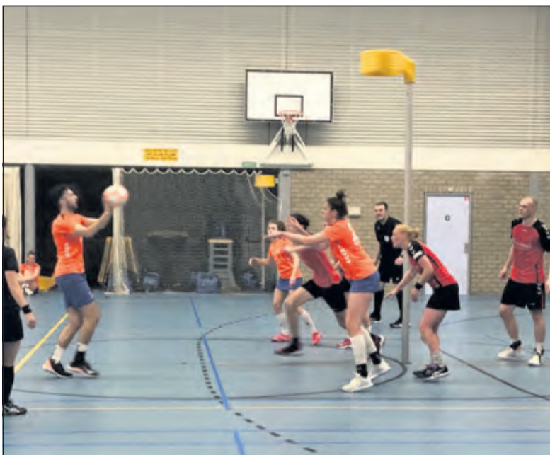
Het Westbroekse team laat zich van z'n beste kant zien.

DOS kon zaterdag 19-03 de Play Offs veiligstellen door te winnen van ZKC '19 uit Zuidwolde. De uitwedstrijd van enkele weken gelden verliep met name in de eerste speelhelft erg stroef. Dit keer was daar geen sprake van.