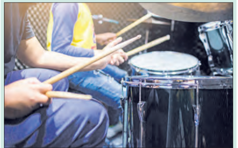
Drumles bij KBH.

Alle activiteiten vinden plaats in verenigingsgebouw De Harmonie, Jasmijnstraat 6B, De Bilt en zijn gratis. Wel vooraf aanmelden via opleidingen@biltseharmonie.nl onder vermelding van je naam, leeftijd en de activiteit waaraan je wil deelnemen (en voor deelnemers aan de open repetitie ook je muziekinstrument). Voor meer informatie zie www.biltseharmonie.nl .