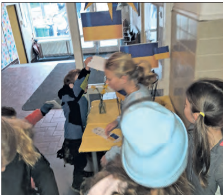
Kinderen van de Van Dijkschool zetten zich in voor Oekraïne.