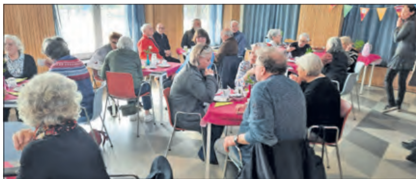
High Tea levert een vol dorps huis in Hollandsche Rading op.