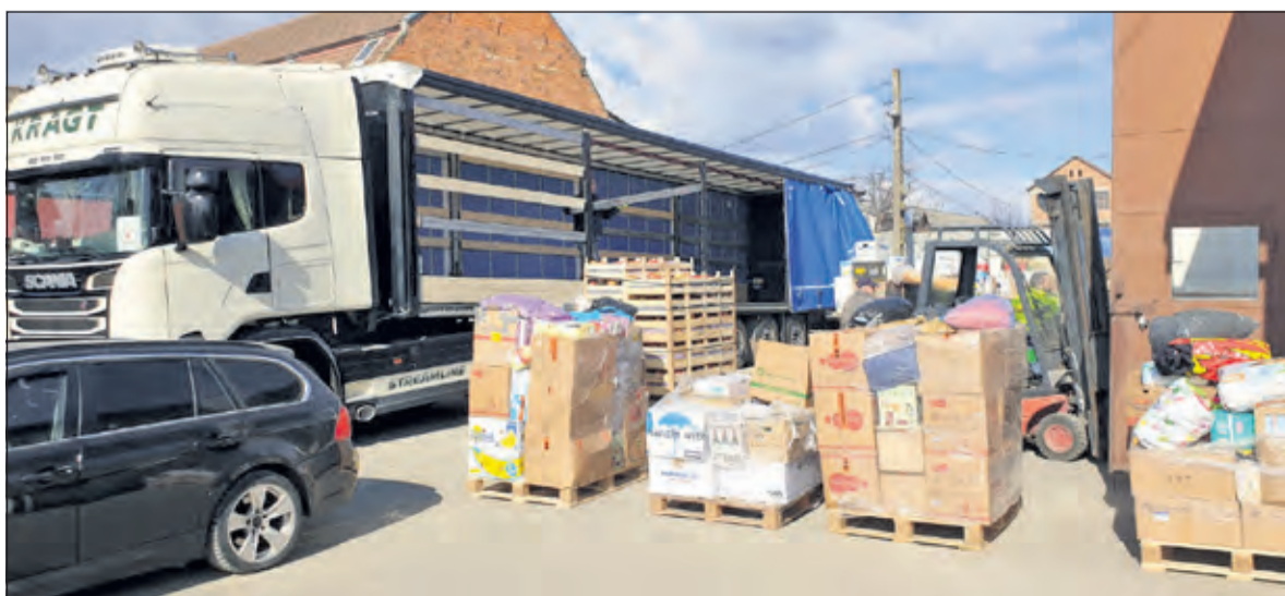
Een enorme hoeveelheid goederen staat klaar om ingeladen te worden.

Als Centrumkerk staan wij midden in de samenleving. Het is mooi wat je in korte tijd kunt bereiken. Wij beraden ons op wat wij nog meer kunnen doen voor de vluchtelingen uit Oekraïne. Ik wil ook iedereen hartelijk danken voor hun bijdrage om deze actie succesvol te maken. Niet alleen de vrijwilligers, maar ook alle mensen die levensmiddelen kwamen brengen'.