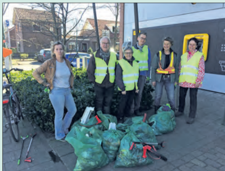
Ook Westbroek heeft meegedaan met de landelijke opschoon dag. Met een goed resultaat.