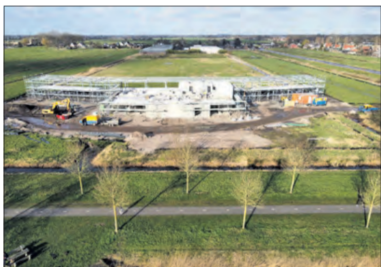
Er verrijst een groot gebouw in het Noorderpark.

Door de jl. woensdag gehouden gemeenteraadsverkiezingen is het huidige college in principe demissionair. Op de vraag of er überhaupt een beslissing te verwachten is van een demissionaire college is het antwoord van de wethouder kort en duidelijk: 'Ja, het college is hiervoor het bevoegde orgaan.