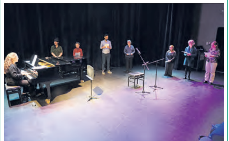
De leerlingen en hun begeleider.

Het concert begon met een samenzang van 'Dona Nobis Pacem' van Mozart: 'Geef ons Vrede', een zeer toepasselijke canon voor deze tijd, begeleid door Wynanda op de vleugel. Daarna zong iedere leerling één of meerdere zelf uitgekozen stukken. Solistische zang is voor iedere leerling spannend. Desondanks straalden deze leerlingen, van sterk verschillende leeftijden, veel plezier uit. Het publiek beloofde elke leerling na hun zangbeurt met een enthousiast applaus. (Frans Poot)