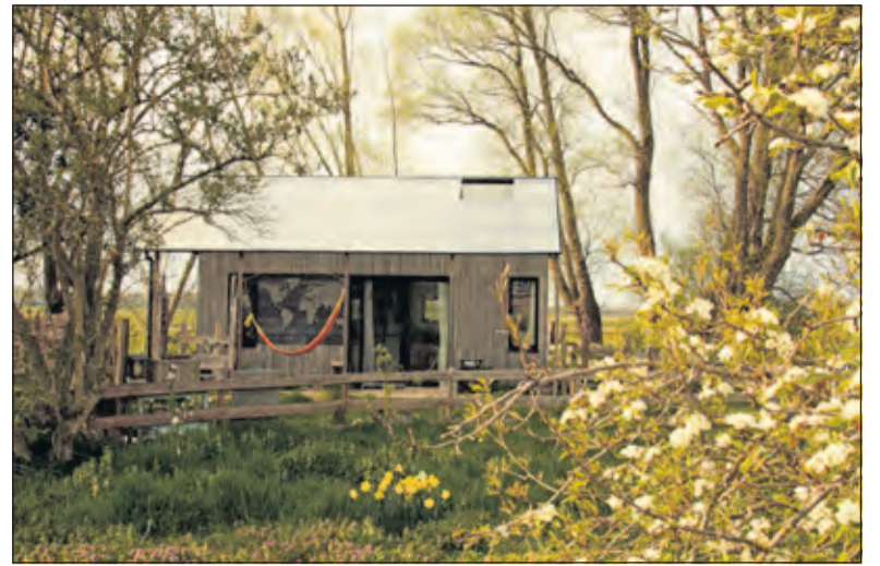
Elke woont klein en ontwierp en realiseerde haar duurzame huis zelf.

Sinds eind 2021 is Elke Rabé klimaatburgemeester van gemeente De Bilt. Ze woont in de polder in een zelf ontworpen en gerealiseerd duurzaam huis van zeventien vierkante meter. Sinds er in de lokale pers aandacht werd besteed aan haar klimaatburgemeesterschap is ze bij verschillende groepen betrokken geraakt, die actief zijn op het gebied van duurzaamheid. Zo was ze aanwezig bij een Voedselcafé over duurzame voedseleducatie en is ze actief geworden in de werkgroep Circulaire Economie. Ook staat een samenwerking met de kinderborgemeester nog op haar verlanglijstje. Ze wil graag de initi-