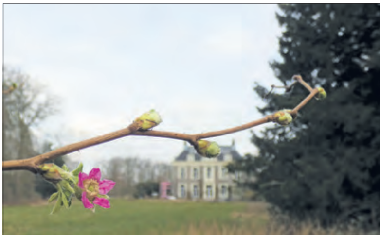
De bloeiende prachtframboos is een stinzen-begeleidende soort.

Startpunt parkeerterrein landgoed Sandwijck aan de Utrechtseweg 301, 3731 GA De Bilt, aanvang 11.00 uur. Deelname is gratis, stevig schoeisel is aanbevolen en honden zijn niet toegestaan. Voor meer informatie kunt u contact opnemen met Jaap Milius 030-2288636.