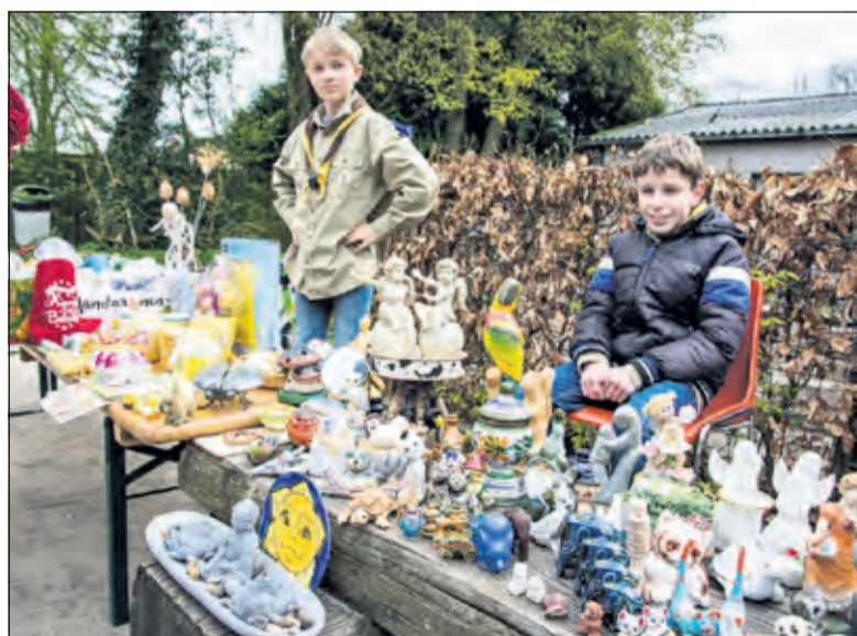
De vorige rommelmart was in 2019.

‘Scoutinggroep Ben Labre is een lokale organisatie waar vrijwilligers zich inzetten om een goed en gevarieerd programma aan de jeugd te kunnen aanbieden’, vertelt marktcoördinator de Jong. ‘Wij vinden dat scouting een maatschappelijke taak binnen De Bilt heeft en willen daarom voor iedereen toegankelijk zijn. Vandaar dat wij er elk jaar weer hard aan trekken om de rommelmart tot een succes te maken. Het is niet alleen leuk voor het dorp, het is ook goed dat veel spullen een tweede kans krijgen. Daarnaast is het een belangrijke inkomstenbron voor Ben Labre’. Voor actuele informatie: www.benlabre.nl .