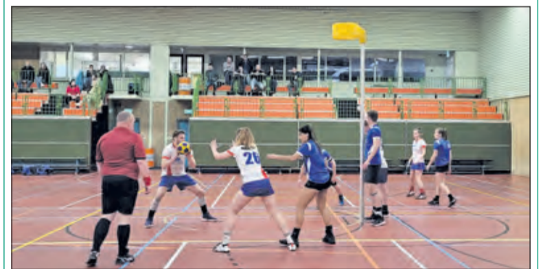
Geen punten voor Nova afgelopen zaterdag.