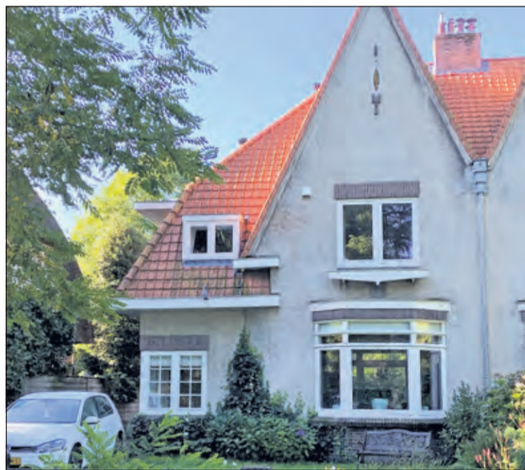
De 100 jaar oude woning is volledig verduurzaamd.

Huiseigenaar Koert Ruiken uit Bilthoven geeft op zaterdag 2 april om 10.00 uur een rondleiding in zijn duurzame jaren '20-woning. Tijdens deze thematour laat hij bezoekers zien hoe hij zijn bijna 100 jaar oude woning aardgasvrij heeft gemaakt met isolatie en een warmtepomp(boiler). Geïnteresseerden zijn van harte welkom om ideeën op te doen voor het verduurzamen van hun eigen woning en al hun vragen aan Koert te stellen. Inschrijven