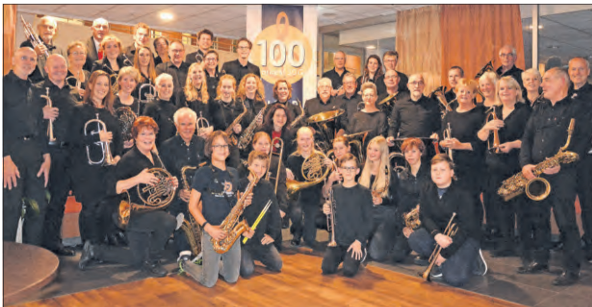
SDG in 2022.

Na deze formele opening van het seizoen staan een aantal concerten gepland. Als eerste op 5 mei het concert in De Ark te Maarssebroek. Met dank aan de Stichting 4-5 mei geeft Orkest SDG een Bevrijdingconcert. Het daarop volgend concert zal zijn op zondag 26 juni 2022 in de reeks van 10 zondagen van de Stichting Parkpodium Boom& Bosch te Breukelen. Ook zal SDG op 24 september 2022 de Dag "Tienhoven Toont" afsluiten met een concert bij Museum Vredegoed. En als klap op de vuurpijl verzorgt Orkest SDG op zaterdag 26 november 2022 een Feestelijk PROMS concert met artiesten in de Stinzenhal te Breukelen.