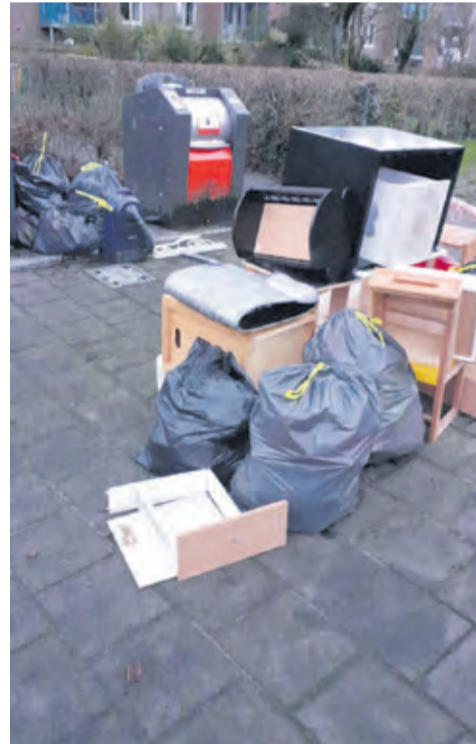
Onjuist aangeboden afval. U riskeert niet alleen een boete maar draagt bij aan verspreiding van zwerfafval.

ergernis voor veel inwoners ook een toenemende kostenpost voor de gemeente. Meerdere malen rijden de collega's van de buitendienst nu langs om niet aangemeld afval weg te halen.