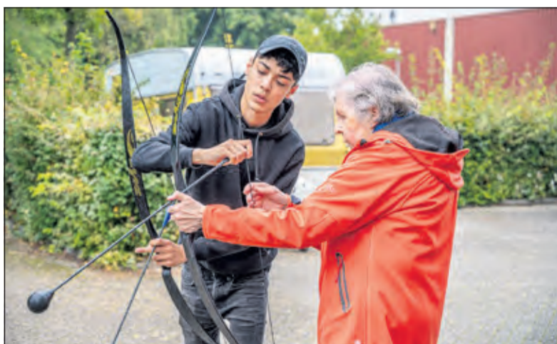
Er zijn rondleidingen langs de oude schietbaan

Informatie en het volledige programma is te vinden op www.burolou.nl .