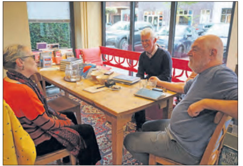
Levendige discussie aan de koffietafel in de Bilthovense boekhandel.