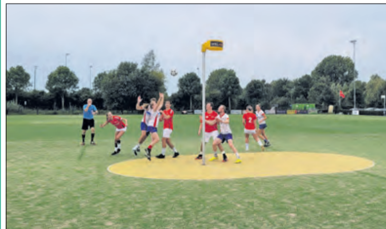
Een spannende wedstrijd, maar wederom geen punten voor NOVA.

Na de rust en na een goal vanaf Nova's kant waren de spelers uit Bilthoven niet scherp genoeg en kregen ze steeds gelijk weer een doelpunt tegen. Hierdoor kon de ploeg de voorsprong niet pakken en bleef het telkens op achterstand staan. Er waren genoeg mogelijkheden, maar het rendement lag te laag. Met nog 10 minuten te gaan was de stand 13-10. Het was dus een spannende wedstrijd, met een mindere eindstand van 15-13. De volgende tegenstander is Rust Roest. (Milou van der Weerd)