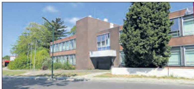
In de Leyensetuin aan de Leyenseweg is een mooie gemengde buurt te realiseren.

ontwikkeling vorm. Het is de tweede grote gemeentelijke locatie waar we deze ruimtelijke voorwaarden vaststellen en ik vind het prettig en fijn om u te kunnen melden dat het een plan is dat gebaseerd is op de woonwensen van de Biltse inwoners. Het is een prachtige wijk in een prachtige gemeente en dat blijft het ook. We moeten er vanaf dat iedere verandering leidt tot on-dorps en on-groen. Er is veel geïnvesteerd in uitleggen, maar natuurlijk gaan we evalueren, want we moeten blijven leren', aldus de wethouder. 'Maar participatie betekent niet, dat dit lijdend zou moeten zijn in de belangenafweging. Anderen noemen het geven en nemen waar ik me heel goed in kan vinden'. De wethouder gaat vervolgens in op een aantal gestelde vragen.