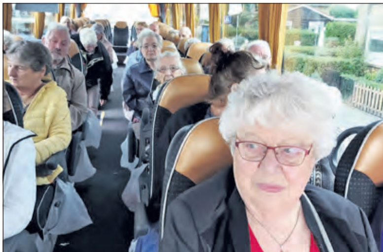
Zonnebloemgasten op weg naar de Utrechtse Heuvelrug.

Met een bustocht heeft de Zonnebloem, afdeling Maartensdijk, weer een uitstapje gemaakt. Donderdag 30 september vertrokken 31 deelnemers en vier vrijwilligers voor een tocht over de Utrechtse Heuvelrug. Chauffeur Sjaak kon tijdens de route leuke anekdotes vertellen over bezienswaardigheden. Bij terugkomst in Dijkstate stond koffie met gebak klaar om de dag af te sluiten. Syscon PTC uit Westbroek heeft er voor gezorgd dat de deelnemers een ontspannen en gezellige middag hadden. (Sofia Gijzen)