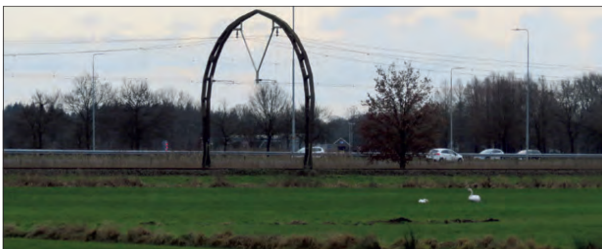
De Koningin Wilhelminaweg in Maartensdijk.