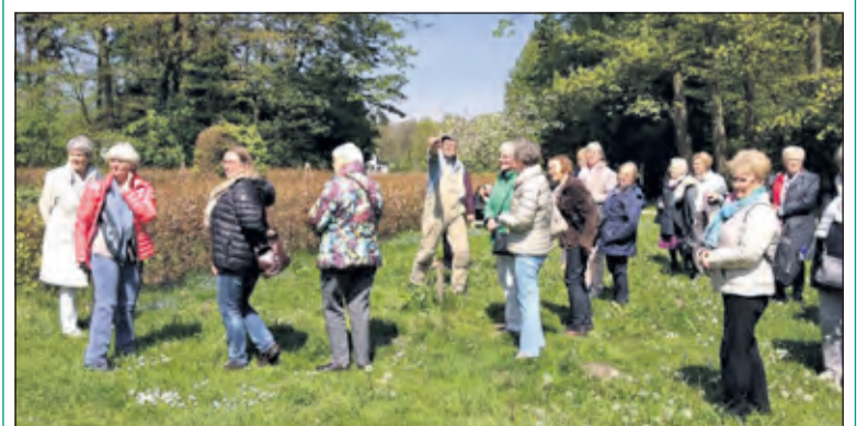
Bij Profeminae staan regelmatig activiteiten op de agenda.