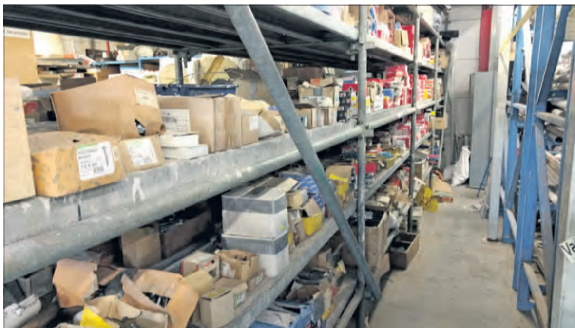
Geef je klusmateriaal een tweede leven.

'Ik wil laten zien dat het kan, dingen verkopen die anders vernietigd zouden worden. Als de één een goed stuk hout weggooit en een ander koopt een nieuw kozijn, dan is dat twee keer zonde. Je moet goed hout vernietigen én er moet een boom gekapt worden voor dat nieuwe kozijn. Als we die twee bij elkaar brengen scheelt dat zoveel. Het mooiste zou zijn dat we de cirkel rond krijgen: alles wat over is heeft een goede andere plek gevonden. En het zou fantastisch zijn als meer ondernemers zien dat het werkt.'