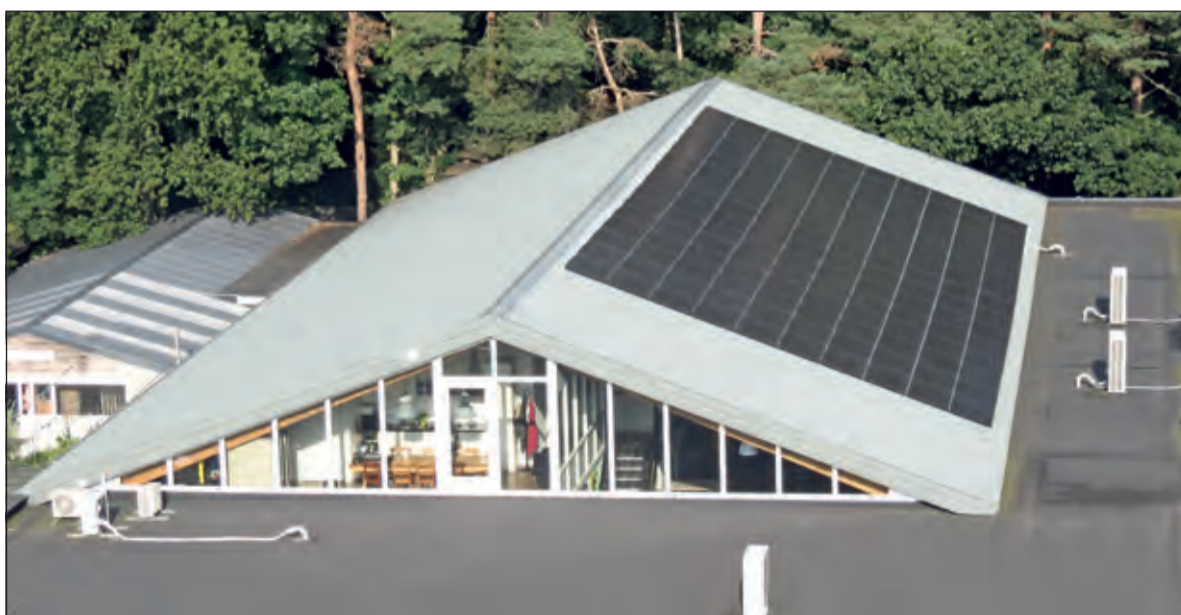
Zonnepanelen op het dak leveren een flinke besparing op.