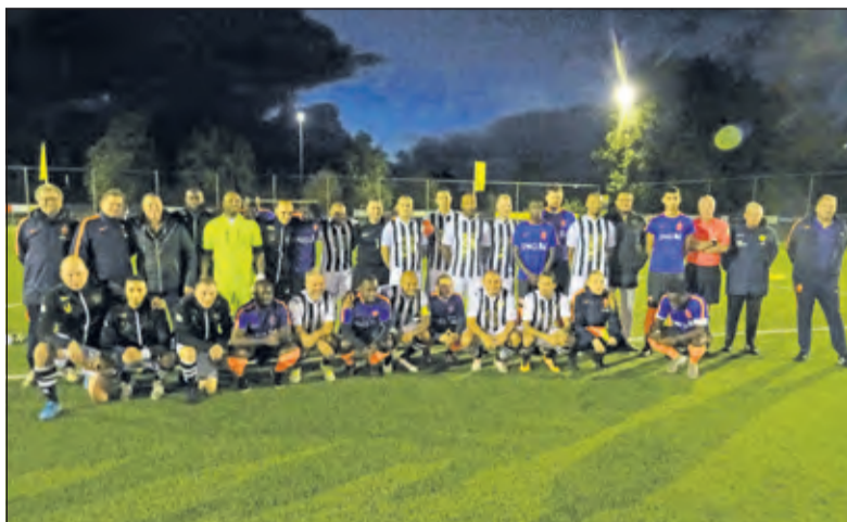
Voor aanvang op de foto.

De Stichting Pro Talents heeft het team van Oranje LD onder zijn hoede. De stichting staat los van de KNVB. Het team bestaat uit de beste spelers vanaf 15 jaar die praktijkonderwijs volgen of hebben gevolgd. Praktijkonderwijs is bedoeld voor leerlingen met een leerbeperking die zijn gescout op voetbaltoernooien voor de praktijkscholen. Wanneer speelsters talentvol zijn en hoger op kunnen, staat de stichting de speler bij in de contacten met de mogelijke nieuwe vereniging. Het LD team traint regelmatig in Maartensdijk