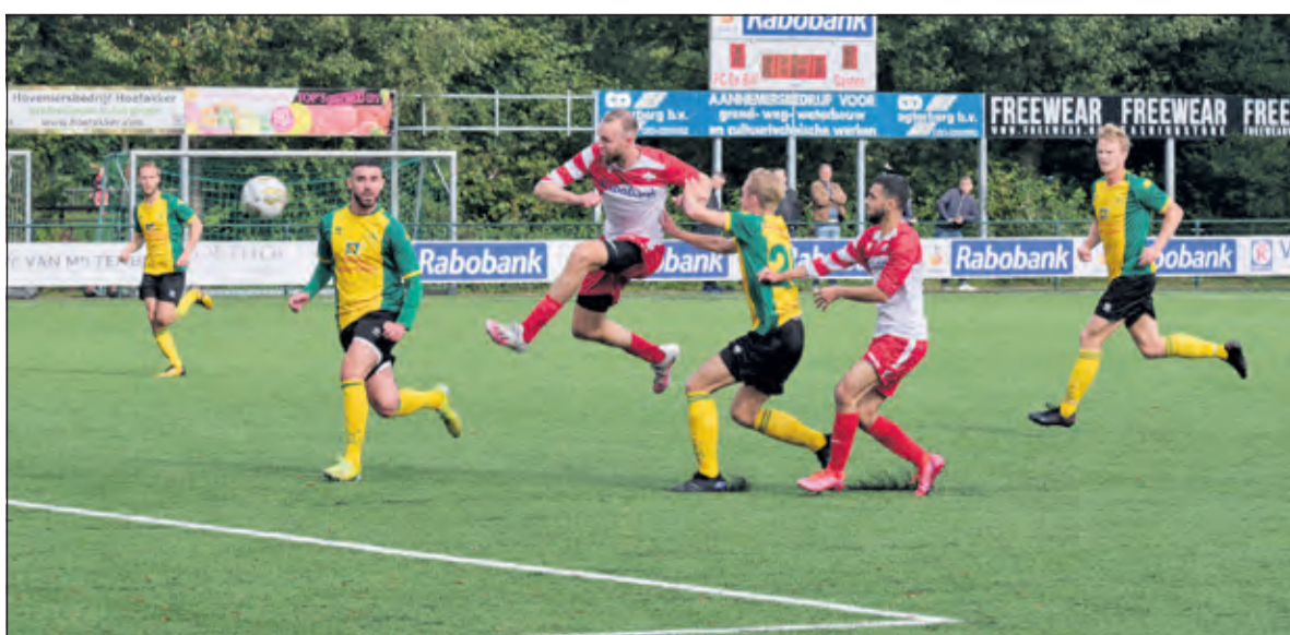
FC De Bilt aast op de gelijkmaker.

dit advies over. Kort daarna scoorde een aanval van Huizen na een mooie aanval de 0-2. De Biltse trainer bracht vers bloed in de ploeg en het leek er even op dat de aansluitingstreffer in de lucht hing, maar toen halverwege de tweede helft de 0-3 op het scorebord verscheen, hoefde De Bilt niet meer de illusie te hebben op een ander resultaat. Na 90 minuten kon Huizen de verdiende drie punten bijschrijven en met twee gewonnen wedstrijden stevig aan kop gaan. Volgende week speelt FC De Bilt uit tegen SVL in Langbroek en op 16 oktober begint om 14.00 uur de thuiswedstrijd tegen Almkerk.