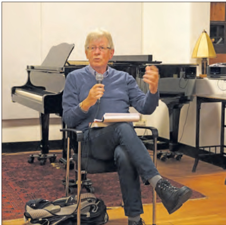
Hans Achterhuis vertelt over zijn boek 'Geloof in geweld'.