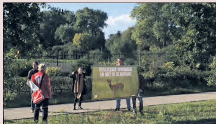
Hessingactie SP in duurzaamheidsweek 2020 nog steeds actueel.

SP gaat hierover graag in gesprek op de Planetenbaanmarkt, maar ook over betaalbare huren, aanpak van schimmelwoningen en stijgende energieprijzen.