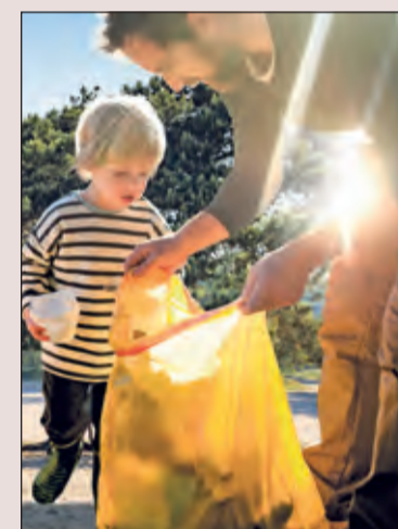
Jong en oud kan tijdens de herfstvakantie meedoen met de opschoonactie in de natuur.

Nederland Schoon werkt al 30 jaar intensief samen met bedrijven, burgers, maatschappelijke instanties en overheid om zwerfafval aan te pakken en ervoor te zorgen dat een schone omgeving de norm wordt. Door middel van onderzoeken, samenwerkingen, het delen van kennis en het geven van advies creëren zij bewustwording en verantwoordelijkheidsgevoel.