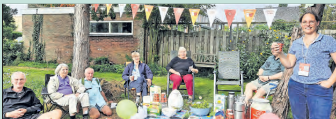
Even uitrusten van de speurtocht bij de Troelstraweg, waar bewoners voor een hapje en een drankje zorgen.

Wijkvereniging Noord-Oost De Bilt is opgericht voor en door bewoners, die willen dat de wijk een plek is waar men zich thuis voelt. Er is een nieuwsbrief voor alle leden, en de vereniging organiseert allerlei activiteiten waar burens elkaar kunnen ontmoeten. Het bestuur wil graag meer leden om de wijk met elkaar nog leuker te maken. www.noord-oostdebilt.nl