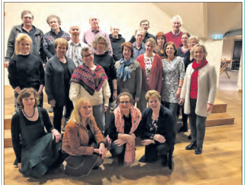
Kamerkoor De Bilt kan versterking gebruiken

Kamerkoor De Bilt zingt klassieke en modernere muziek uit allerlei tijden en landen. Er is elke 2 jaar een concert, er zijn soms optredens als een 'Evensong', of in de Domkerk in Utrecht bij de 'Night of Lights', en bij allerlei andere gelegenheden die op het pad van het koor komen. Het koor zoekt versterking; vooral mannen zijn welkom. De repetities zijn op maandagen vanaf 20.00 uur in het Lichtruim aan het Planetenplein 2 in Bilthoven. Info via kamerkoordebilt.nl