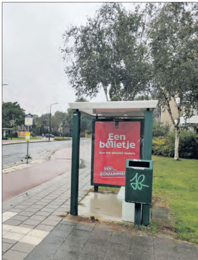
Bij de bedreigde bushalte aan de Walnootlaan een toepasselijk reclamebiljet: 'Een belletje kan het verschil maken'.

Op de aansluitende pagina (9) van het conceptplan staat te lezen: 'Gelijktijdig met de start van U-flex wordt de route van lijn 77 verlegd naar de Leyenseweg. Lijn 77 rijdt dan niet meer door Bilthoven - Noord, waardoor de haltes Walnootlaan en Rembrandtlaan vervallen. Reizigers van/naar deze haltes kunnen voortaan gebruik maken van U-flex en stappen dan op station Bilthoven over op lijn 77. De wethouder zal de berichtgeving door de Provincie Utrecht vanaf december hierover nauwgezet volgen en monitoren.'