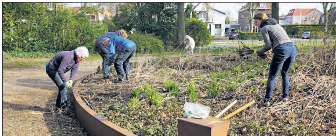
Vrijwilligers van de Vrienden van het Van Boetzelaerpark aan het werk op het Cirkelplantsoen bij de ingang van het park, waar het dode gewas en het onkruid weg wordt gehaald.