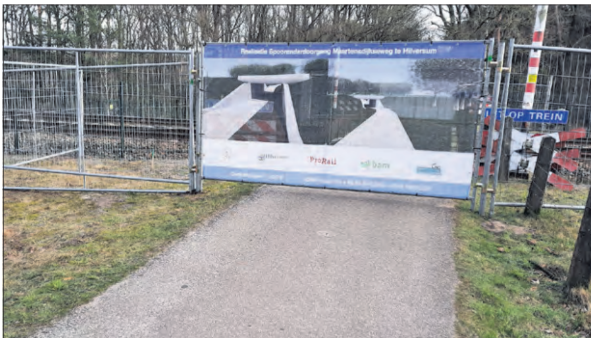
Bij de thans gesloten overweg wordt de a.s. tunnel nu al duidelijk aangegeven.

Hessenweg 4 * 3731 JK De Bilt hazekamparket.nl * 030 - 633 26 91