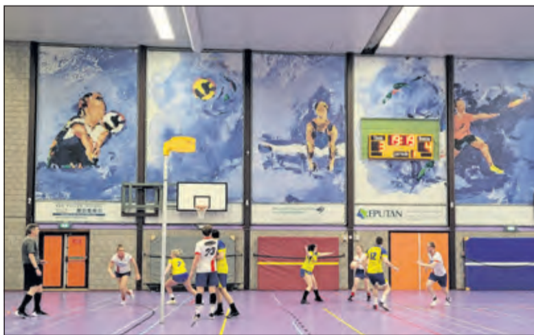
In de sporthal van Heerhugowaard ging de strijd gelijk op.