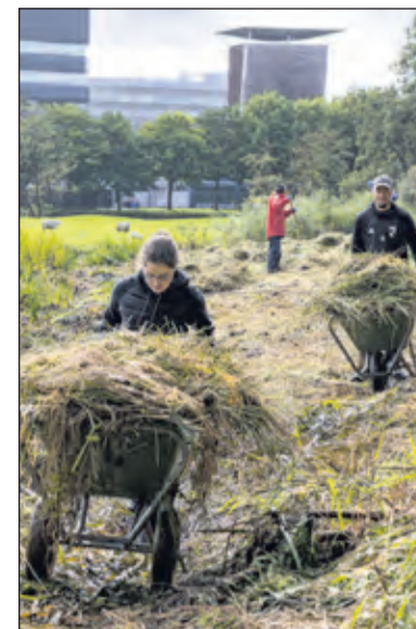
Universiteitsmedewerkers aan de slag in de natuur op het Utrechtse Science Park.

De Universiteit Utrecht is sinds 1636 de plek waar nieuwe samenwerkingen beginnen en kruisbestuivingen ontstaan. De universiteit is