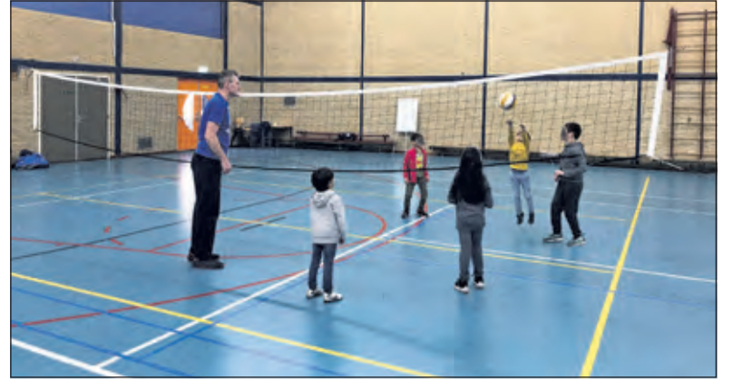
Volleybalvereniging Irene geeft clinic in Huis ter Heide.

Als er kinderen of volwassenen zijn die hier verder mee willen, dan wordt in overleg gekeken of het ook mogelijk gemaakt kan worden om met een van de teams binnen Irene mee te trainen en spelen.