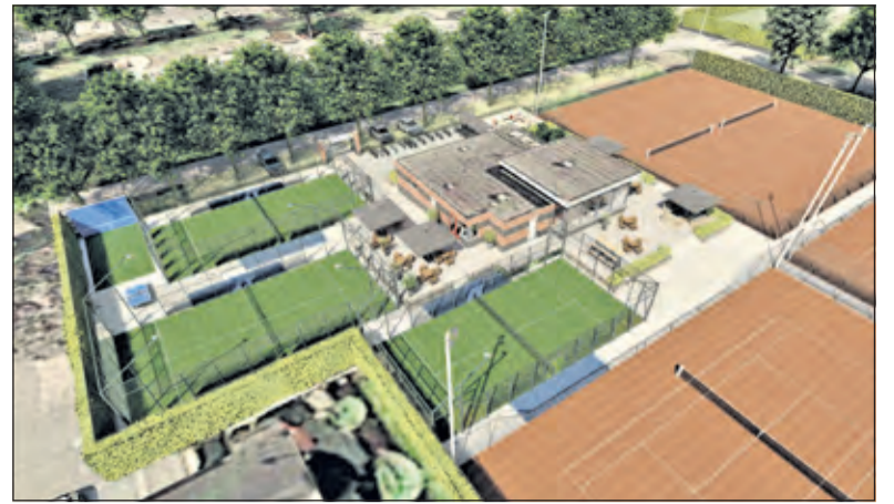
Artist impression, van hoe de banen er uit komen te zien.

De tennisbond KNLTB heeft padel eveneens omarmd, waardoor er voor leden direct veel mogelijk is. Assink is al volop evenementen aan het plannen: 'Dit jaar zullen we diverse (interne) toernooien en clinic's organiseren. Leden kunnen