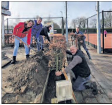
Enthusiaste Tautenburg-leden steken handen uit de mouwen.

Het afgelopen decennium is de sport over komen waaien uit Spanje en padel is nu de snelst groeiende sport in Nederland. Maatman: 'Veel tennisclubs hebben de sport omarmd. Deels om als club te groeien, maar ook omdat het een sport is waar de gezelligheid voorop staat. Als tennisvereniging hebben we een redelijk stabiel aantal leden, door de komst van padel kunnen we weer groeien. Het laatste zetje om padel te introduceren bij Tau-