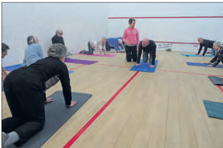
Deelnemers krijgen in de praktische les heel gerichte aanwijzingen hoe weer op de been te komen na een val.

Mensen die geïnteresseerd zijn in het project de Derde Helft kunnen contact opnemen met Gerda Vloedgraven, tel. 0628695669.