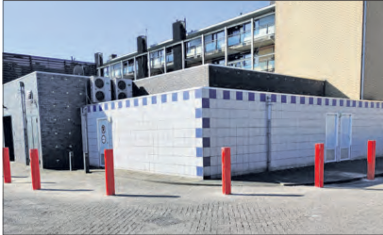
Paaltjes moeten de hoek overzichtelijker maken.

Door de uitvoering van dit plan wordt het parkeren anders geregeld, kunnen mindervaliden dicht bij de winkels parkeren, blijft de toegankelijkheid voor mensen met rollator of rolstoel gewaarborgd en blijft het plein toegankelijk voor hulpdiensten. Bewoners lieten via de verenigingen van eigenaren weten dat ze dit plan toejuichen en ook de winkeliers waren er mee