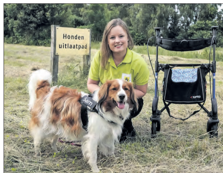
Binnenkort ook dierenbuddy's in De Bilt.

woensdag 16 maart en loopt tot zondag 27 maart. Wanneer er geen leerlingen aan de deur komen, zijn de violen bestellen via de mail: info@patioschool.nl .