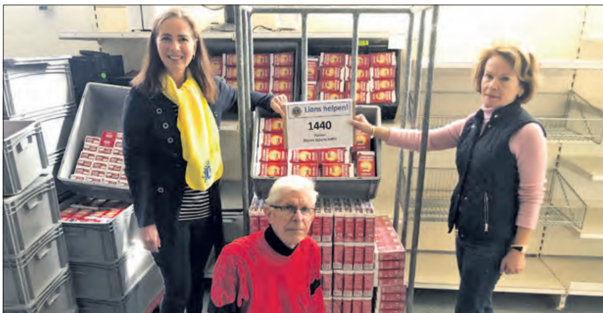
De pakken koffie zijn op De Voedselbank gearriveerd.

Afgelopen december hebben Lionsclub Bilthoven 2000 en Lionsclub Utrecht Kromme Rijn een inzamelactie georganiseerd, waarbij in diverse winkels in de gemeente De Bilt DE-waardepunten en vreemd en oud geld kon worden ingeleverd.