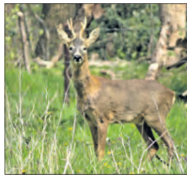
De natuur, waar reeën deel van uit maken, staat sterk onder druk van de groeiende recreatie.

Wie op kraamvisite gaat, weet dat rust, hygiëne en een beetje afstand