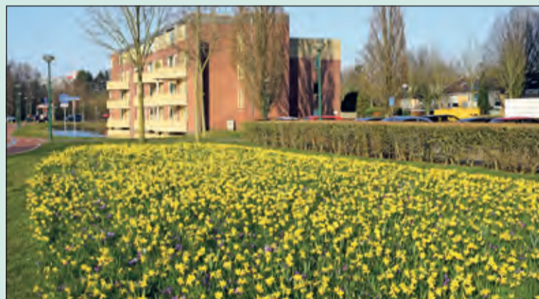
Het veld narcissen langs de Biltse Rading in De Bilt verkondigt het begin van het voorjaar 2022. De bewoners van de aanpalende hoogbouw zijn er heel blij mee, zo ook de fietsers en automobilisten, die hier de gemeente binnenkomen.