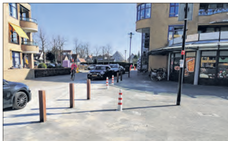
Vrije toegang tot het plein voor hulpdiensten.

voering vertraging opgelopen, maar inmiddels is het uitgevoerd.