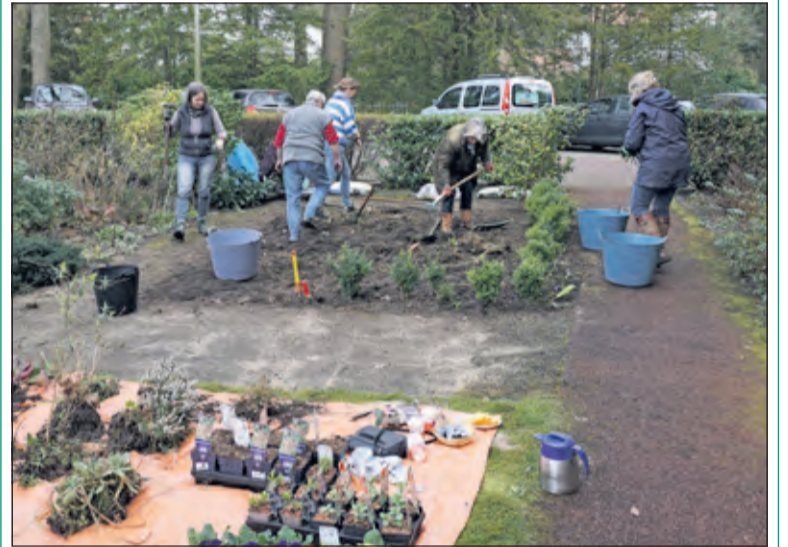
Leden van de Sorooptimisten De Bilt/Bilthoven kwamen in actie in de tuin van Huize het Oosten in het kader van NLdoet. Zij wieden een stuk van de tuin en zetten er nieuwe planten in.