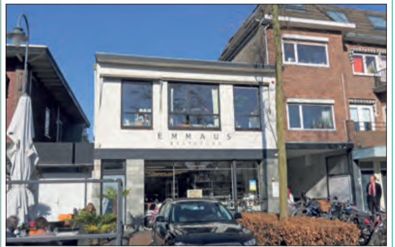
Emmaus Bilthoven verleent hulp aan Oekraïners.

Emmaus Bilthoven heeft besloten om de Oekraïense vluchtelingen aan de Poolse en Roemeense grens te steunen door financiële hulp te verlenen. De weekopbrengst van 7 tot en met 14 maart wordt daarvoor volledig ingezet. Bij alle kassa's komt ook een pot te staan voor een donatie voor financiële steun. Emmaus veroordeelt het geweld dat nu wordt gebruikt ten zwaarste. 'Onze beweging en de oprichter Abbé Pierre, hebben altijd voor vrede gewerkt', aldus oud-voorzitter Loes Steensma. 'Wij zullen ons te allen tijde hiervoor inzetten.'