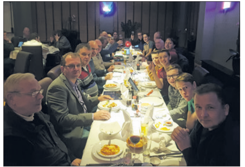
Een etentje bij de Chinees heeft de teambuilding binnen de grote en in leeftijd zeer verschillende scheidsrechtergroep zeker bevorderd.