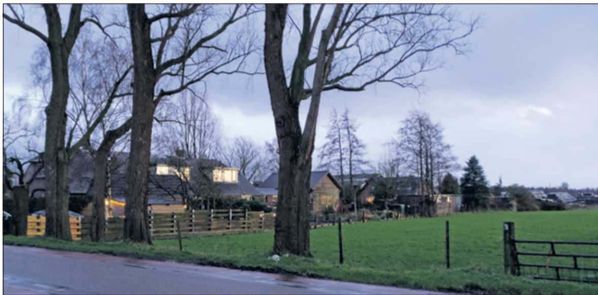
Een aantal van de in totaal 9 bomen langs de Westbroekse Kerkdijk die zullen worden verwijderd en op welke plaats herplanting plaats zal vinden.

De lijst vermeldt naast het wel of niet her-planten ook de redenen voor verwijdering; conditie, plaksel, dunning, korsthoutskoolzwam op stamvoet, rotting in stam, aanrijschade en geen toekomstverwachting.