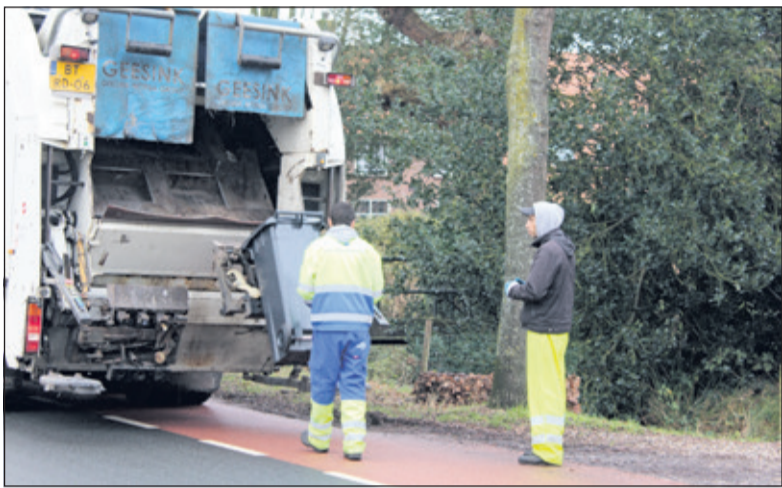
In verband met Nieuwjaarsdag werd afval in gebied 3 op zaterdag 6 januari opgehaald, dat was duidelijk niet bij iedereen bekend.

Met ingang van 2018 stapt de gemeente De Bilt over op een intensievere manier van afval inzamelen. Doel hiervan is om in het jaar 2020 de hoeveelheid restafval te hebben gehalveerd, van 200 naar 100 kilo per persoon per jaar. Iedereen heeft inmiddels een kleinere kliko voor restafval gekregen en de grote grijze rest-afval-kliko kreeg een oranje deksel. Hierin kan voortaan plastic, metalen en drankenkartons (PMD).