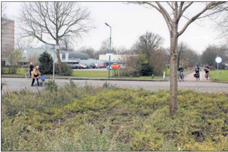
Het college ziet de woningbouwontwikkeling in relatie met de aansluiting van de Professor dr. T.M.C. Asserweg op de al aanwezige rotonde in de Biltse Rading.

Over de renovatie dan wel nieuwbouw van sporthal De Bilt vindt overleg plaats met de Biltse Sportfederatie en het bestuur van het H.F. Wittecentrum. Omdat de keuzes ter zake bepalend zijn voor de ontwikkeling van de omgeving van het H.F. Wittecentrum, is een snelle beslissing noodzakelijk. Het college verwacht de randvoorwaarden voor het gebied in het derde kwartaal van 2018 ter vaststelling voor te leggen aan de gemeenteraad.