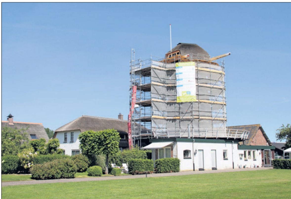
De Geesina stond lang ingepakt.