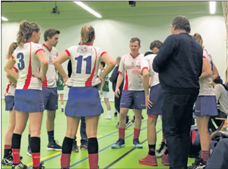
De spelers maken zich op voor de belangrijke wedstrijd.

Doordat er een voetbaltoernooi plaatsvond in het vertrouwde HF Witte, werd deze thuiswedstrijd (van Nova) in Vianen gespeeld. Door het slippertje van ASVD tegen Sparta aan het begin van het seizoen, kon Nova bij winst vier punten loskomen. Een belangrijke wedstrijd dus.