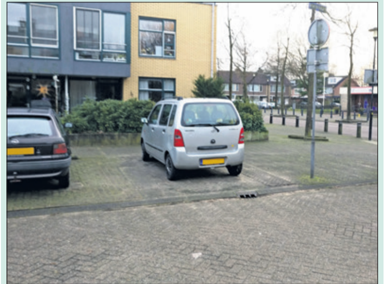
Op de locatie hoek Nachtegaallaan/Merellaan aan de noordzijde van Dijkstate (waar nu de rechter auto staat) komt een ondergrondse container voor restafval met een inzamelvoorziening voor GFT naast een container voor PMD-inzameling.

Dit locatieplan is vastgesteld en er is opdracht gegeven om de containers conform dat plan te plaatsen. Inmiddels is de feitelijke plaatsing gestart en het is de bedoeling dat de ondergrondse containers uiterlijk 31 maart 2018 operationeel zijn.