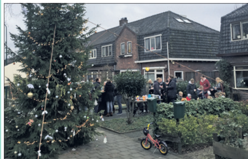
Buurtborrel bij de grote kerstboom op de Waterweg.

Tijdens de feestdagen hebben de buurtbewoners van de Waterweg in De Bilt gebruik gemaakt van het versieren van een grote kerstboom die door de gemeente beschikbaar was gesteld. Een prachtig initiatief van de gemeente om de buurt te verenigen, waardoor er tijdens de donkere dagen van December op de Waterweg een grote kerstboom met versiering en verlichting viel te bewonderen. (Fred van Dijen)