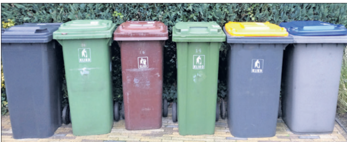
De diversiteit aan kliko's breidt gestaag uit waardoor op sommige plekken bijna geen plaats meer voor een 240-liter-kliko.

Voor inwoners, die om medische redenen een grotere kliko nodig hebben, bestaat de vrijstelling van betaling van de toeslag al. De SGP verwacht van de gemeente, dat zij royaal omgaat met het geven van de vrijstelling voor deze doelgroep.