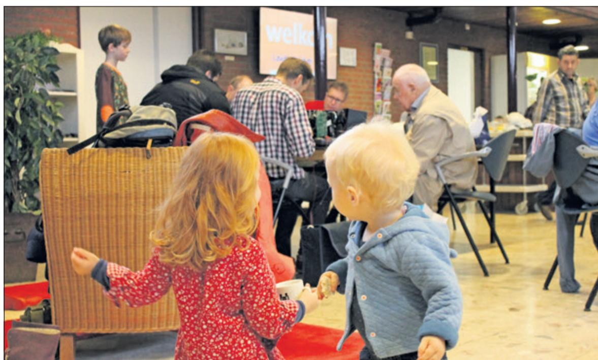
Kinderen zijn welkom tijdens het repaircafé.

Op zaterdag 13 januari is er Repair Cafe bij de WVT in Bilthoven. Kapotte spullen worden gerepareerd met hulp van ervaren reparateurs. Zij helpen bij het repareren van kleding, elektrische apparaten, computers, fietsen, houtwerk, speelgoed, en nog veel meer. Voor de kinderen is er een begeleide knutselafel, waar zij de mooiste dingen kunnen maken van recycle materiaal. De toegang is gratis, een vrijwillige bijdrage welkom. Locatie: WVT, Talinglaan 10 in Bilthoven, Tijd: 11.00 tot 15.00u.