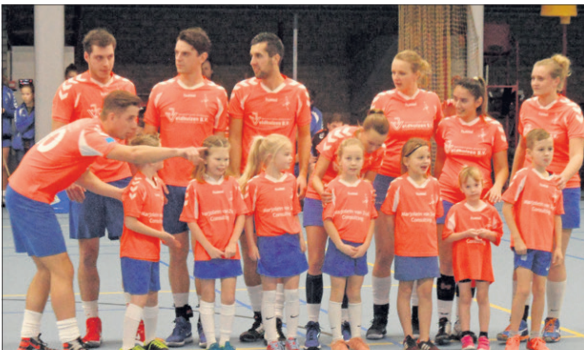
De F1 van DOS was het team van de week.