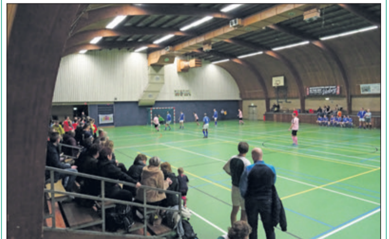
Een impressie van het familiezaalvoetbaltoernooi van 6 januari in de Biltse sporthal.

Evenals vorig jaar is de familie Engel de winnaar van het jaarlijkse Familie Zaalvoetbaltoernooi, dat werd gespeeld in de Sporthal van het HF Witte Dorpscentrum in De Bilt.