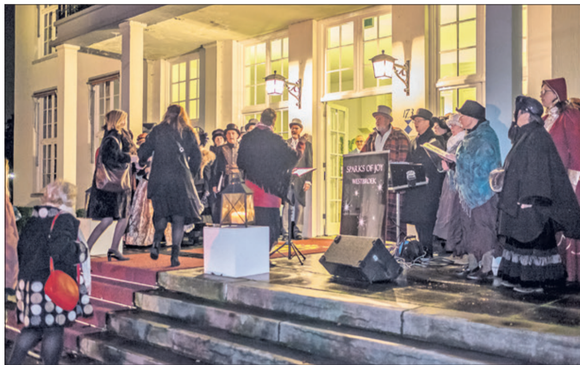
De vele gasten van de nieuwjaarsreceptie kregen een warm welkom van het koor Sparks of Joy uit Westbroek.