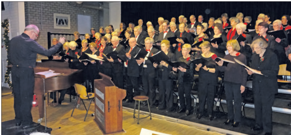
Een goed gevulde zaal geniet van de vocale prestaties van beide koren.