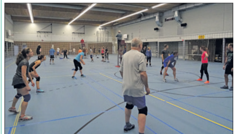
Gedurende de avonden speelden leden en oud leden van Salvo met volle inzet en veel enthousiasme hun wedstrijden.