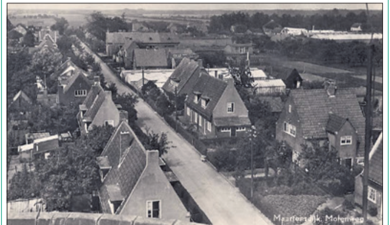
Deze foto van de Maartensdijkse Molenweg is genomen vanaf molen De Hoop en toont de in 1922 gebouwde 10 huizen voor mensen met 'huwelijksvoorrang'. Verder zijn de kassen van van der Heijden en de School met den Bijbel zichtbaar.

Maartensdijk had zijn molen 'De Hoop'. De oorspronkelijke molen werd in 1770 tot een stellingmolen omgebouwd. Hij is tot 1932 in bedrijf geweest. In 1968 is het restant aan de Molenweg opgeruimd. Molen 'De Hoop' stond aan (het einde van) de Molenweg. Op maandag 22 januari tussen 10.00 en ongeveer 12.00 in de zaal van Dijkstate worden de beelden vertoond. Indien er nog tijd over is worden nog beelden van de presentaties 2017 uit de diverse kernen vertoond. De toegang is gratis, de consumpties zijn voor eigen rekening.