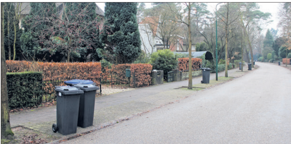
Op de Bilderdijklaan in Bilthoven werd zaterdag 6 januari zowel restafval als papier ingezameld.

De wijzigingen van de afvalinzameling zijn tot stand gekomen met het uitgangspunt dat de investeringen worden terugverdiend door betere afvalscheiding en lagere kosten aan