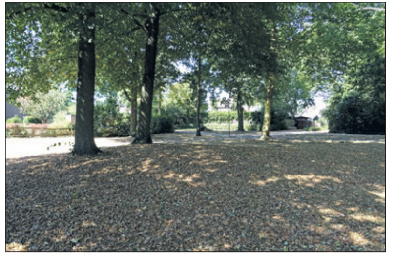
Een tapijt van verdorde bladeren onder de Lindebomen.

Ook Krentenbomen en -struiken hebben nu al verdord blad hangen. Als hout en takken nog verder indrogen zullen deze planten moeite hebben met overleven denkt Rik. 'Coniferen die soms binnen een week bruin kleuren hebben het sowieso al eerder te droog gehad. Gauw water erbij doen zal de conifeer niet meer doen opleven. Als je ziet dat bomen hun blad laten vallen en toch de kracht