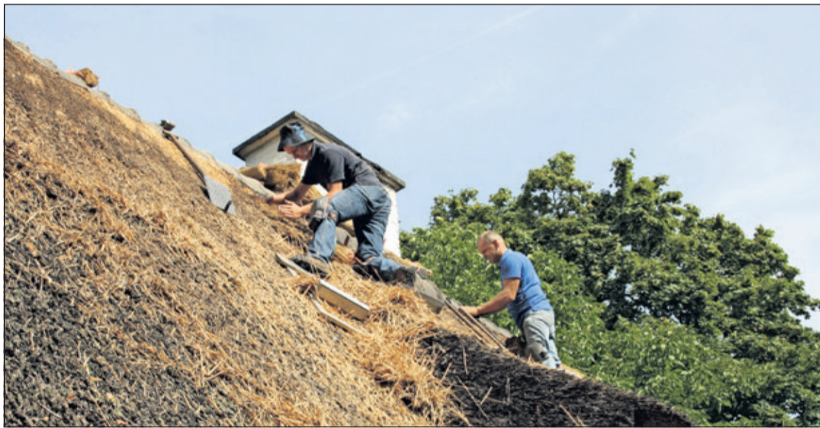
In de volle zon zijn rietdekkers bezig in Hollandsche Rading. Geen koud voetenbadje of een middagje zwemmen op de strook voor deze mannen. Maar wel liters water om het vochtgehalte in het lijf op pijl te houden. Vastberaden gaan ze door. Er wordt met hart en ziel gewerkt om er iets moois van maken. Kanjers. (Rob Timmer)