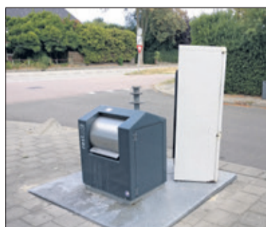
Op de hoek Industrieweg en Tolakkerweg bevindt zich een bestaande ondergrondse container; ongeschikt voor de bijgeplaatste koel-vries-combinatie.