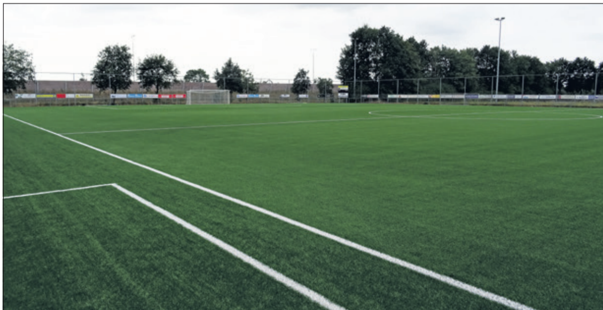
SVM kan zeker weer 10 jaar vooruit met het nieuwe kunstgrasveld.

gespeeld. Wout: 'Omdat we ook op dit veld trainen hebben we van het trainingsveld een extra speelveld kunnen maken. Daar zit dus ook de winst. Vanaf dinsdag 7 augustus begint het seizoen weer met trainingen voor alle teams. De jongste jeugd begint aan het einde van augustus met de training omdat die leeftijdsgroep nog volop op vakantie is. Op dinsdag 14 augustus wordt de eerste wedstrijd op het nieuwe veld gespeeld'. Bij SVM staan ze te trapelen.