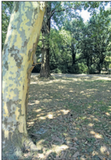
Door de warmte laat de Plataan zijn bast vallen. Het lijkt of de boom ziek is maar het is een overlevingsmechanisme.

'Platanen laten niet door de droogte hun schors vallen, maar door de warmte. Het is wel heftig hoe groot die schorsplakken kunnen zijn. Je zou