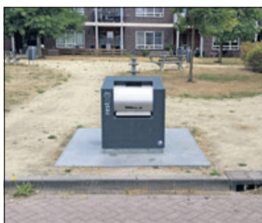
Locatie 163 bij Tolakkerweg 209 (ombouw bestaande ondergrondse container naar PMD) is nog niet gerealiseerd.

verzamelcontainers. Hiervan worden er 20 geschikt gemaakt voor PMD en 7 voor papier. Na het plaatsen van de nieuwe en het aanpassen van bestaande verzamelcontainers staan er 92 ondergrondse restafvalcontainers, 60 ondergrondse PMD-containers en 7 ondergrondse papiercontainers. Wij liepen de 'plaatsingen' in Maartensdijk even langs en zagen opmerkelijke dingen.