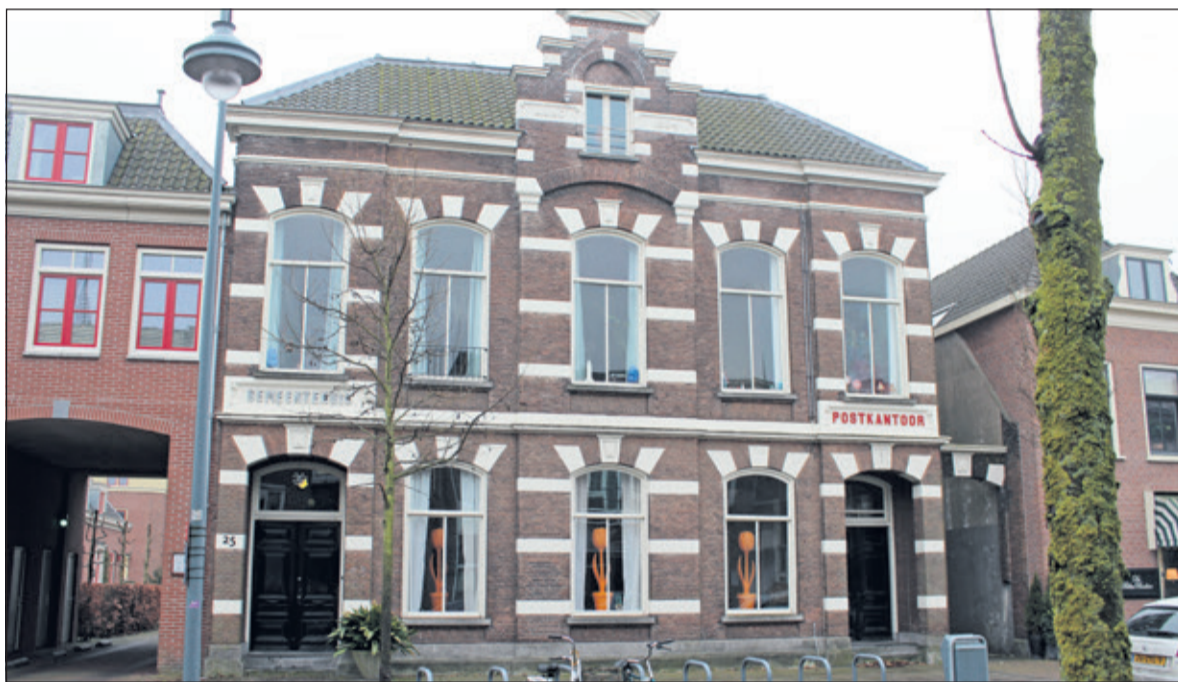
Het oude postkantoor aan de Dorpsstraat in De Bilt.