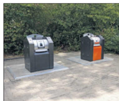
Ten koste van twee parkeerplaatsen zijn bij de Prins Clauslaan in Maartensdijk de locaties 26 (Restafval + GFT) en 27 (PMD) gerealiseerd.