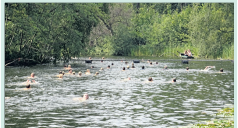
In 2017 namen 120 zwemmers deel.

De waterkwaliteit van zwembad De Kikker en de fortgracht rond Fort Ruigenhoek is uitstekend, waardoor het weer mogelijk is de kilometertocht rond het fort te organiseren. Kinderen, senioren, geoefende en ongeefende zwemmers kunnen deelnemen aan deze recreatieve tocht. Vorig jaar waren er 120 deelnemers. Vanaf 13.30 uur gaan de deelnemers in groepen van start. Inschrijven voor de Kilometertocht kan tot uiterlijk woensdag 22 augustus 2018 bij de kassa van het zwembad. Het inschrijfgeld voor leden bedraagt 5 euro, voor introducees 7,50 euro. [KD]