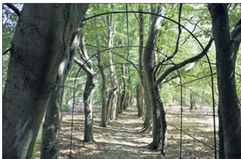
Het Paraplulaantje op Beerschoten.