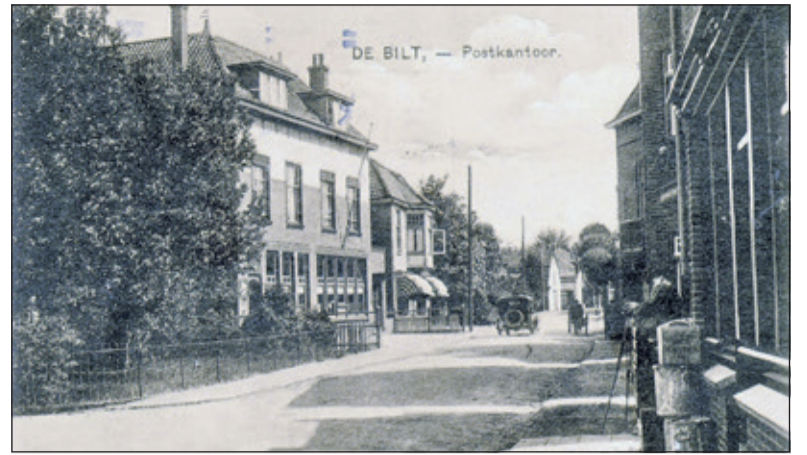
Het postkantoor aan de Burgemeester de Withstraat.

als postkantoor dienst gedaan. Het postkantoor verhuisde toen naar een tijdelijk kantoor aan de Rozenstraat. Rond 1975 werd het postkantoor naar de Hessenweg 164-166 verplaatst. De ernaast geplaatste brievenbus is in de Burgemeester De Withstraat is nog de enige herinnering aan vroegere tijden. In december 1956 schreef het Postdistrict Utrecht, dat men voornemens was om het kantoor te verbouwen omdat het te klein geworden was. In de daarop volgende jaren kwamen er diverse plannen; in 1972 liet de PTT definitief weten dat men bezwaren zag in nieuwbouw aan de Burgemeester de Withstraat. Men vond de ligging te excentrisch en was bang, dat de straat een uitstervend deel van de gemeente was. In 1975 kwam dan uiteindelijk de nieuwe