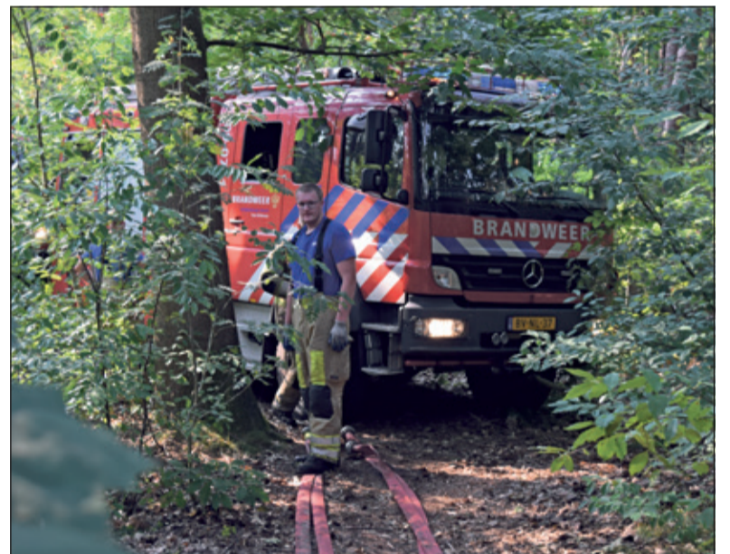
Sommige branden zijn moeilijk te bereiken in het bos.

water onttrekken uit sloot en plas en kunnen andere poelen wel worden voorzien van water'. Ook voor dieren als de das zijn het nu slechte tijden. Hellevoort: 'Volgens onderzoek van de dassengroep heeft geen jonge das deze droogte en hitte overleefd. Waarschijnlijk heeft zelfs de hele Biltse populatie een flinke knauw gekregen'.