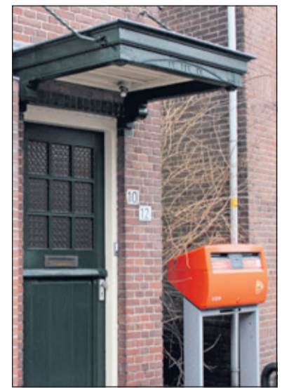
De brievenbus naast het pand aan de Burgemeester de Withstraat is de enige herinnering aan vroegere tijden.

keuken, die uitkwam op een groot balkon. Op de zolderetage waren bovendien nog twee grote voorkamers, een wat kleiner achterkamertje en twee grote overlopen. In een kleine ruimte ernaast lagen twee toiletten, die echter niet meer bruikbaar waren. De opschriften op de deuren zorgden echter voor enige hilariteit, omdat er één bestemd was voor ambtenaren en één voor postbestellers.