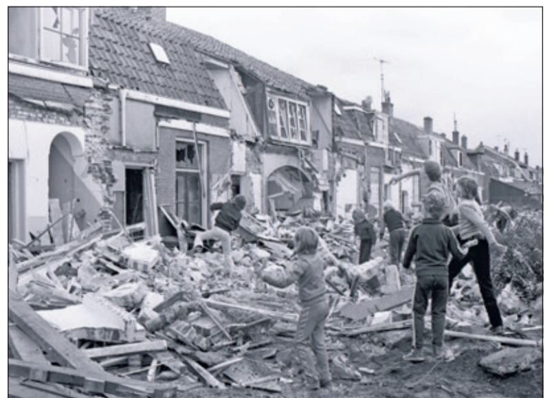
Foto is gemaakt is gemaakt toen de sloop begonnen was op 22 september 1978.

Sinds 1999 wordt op 15 augustus officieel gevlagd. Men wordt verzocht dinsdag 15 augustus de vlag te hijsen als erkenning en ter nagedachtenis aan allen die de oorlog niet hebben overleefd. Bij het monument hangt de vlag tijdens de herdenking halfstok. Na de twee minuten stilte gaat deze vol in top. Gelijktijdig start op 15 augustus de expositie van werken van Iris van Haaren in de ArtTraverse naast de hal in het gemeentehuis. Deze extra expositie met schilderijen en gedichten, kunstkaarten en boek is tot en met 18 september tijdens kantooruren gratis te bezoeken en is bereikbaar vanuit het gemeentehuis van de gemeente De Bilt.