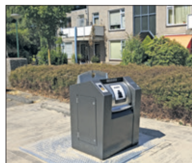
Op de Prins Bernhardlaan komt een maatwerkoplossing voor zowel restafval als PMD. Die voor restafval is er al.