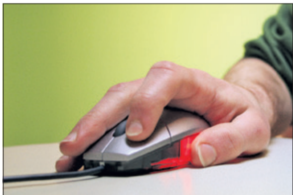
Van driftklikker tot scheerchinez.

Toen ik dat alles las, was mijn nieuwsgierigheid extra geprikkeld. Het 'scheerchinez' van mijn bridgepartner van voorheen en waarmee hij het 'heen- en weer afspelen bij bridge' bedoelde, zou voor eeuwig en altijd een onderbouwing, een uitleg moeten krijgen. Dus ik 'googelde', bezocht Ilse, Wikipedia en van Dale him- of herselfs, maar nergens, nee nergens bleek er ooit iemand - behalve mijn bridgepartner en ik - het woord in zijn of haar mond te hebben gehad. Wij hebben ons dus jaren 'vermaakt' met een niet bestaand woord. In ieder geval kan het wel worden toegevoegd op die websites van andere, niet bestaande woorden (ikzegookmaarwat.nl, vokabulaire.nl) zoals daar zijn achteraanacht, (pas als laatste aandacht krijgen), baardbedenker, (iemand die baarden bedenkt bij een gezicht), bedremsel, (residu van het bedremmelproces), driftklikker, (websurfer, die niet het geduld heeft te wachten op de volgende pagina), facettenbandje, (bandje met verschillende delen), Geenitalië (Frankrijk) of woorden, die (ook) niet bestaan, maar die je desondanks meteen begrijpt zoals: Tandenteugel, Klapcomputerje, Pijlsmitbord, Verstrakoperatie voor je gezicht of scheerchinez.