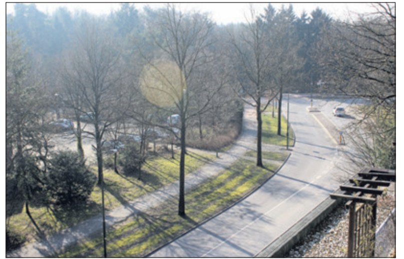
Zicht op de eerder bedachte nieuwe inzamelplek vanuit een appartement op de Sperwerlaan.

Onlangs berichtte de projectleider uitvoering Inzamelingsplan, dat de container 'aan de overkant' niet is geplaatst. 'Ook vanaf die andere kant (Woodland Residence) was men niet gelukkig met de plaatsing van deze container. Daarom is besloten de huidige situatie te