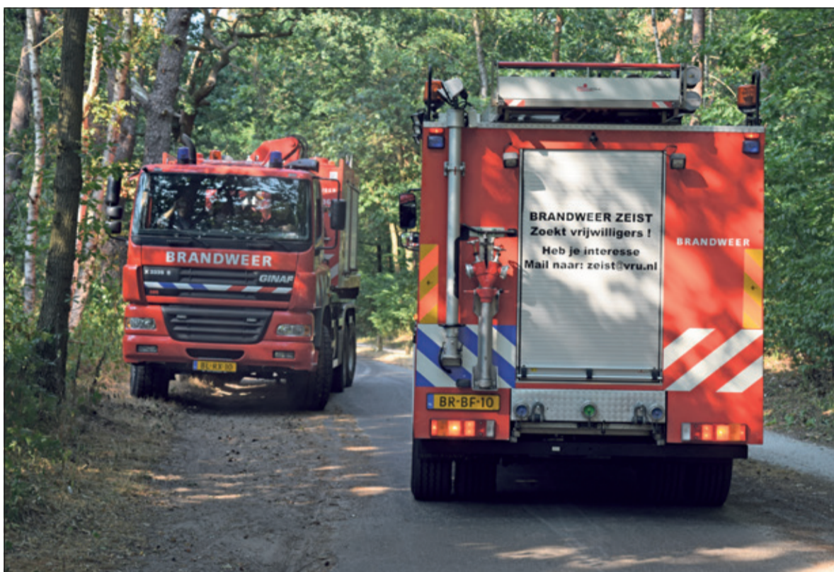
Brandweermannen uit Baarn, De Bilt, Soest en Zeist helpen elkaar met het bestrijden van bosbranden.

is bijna niet meer te vinden.'Voor de natuur is deze droogte een ramp en herstel zal zomaar enige jaren kunnen duren', vertelt Joris Hellevoort, boswachter bij het Utrechts Landschap (UL). 'Wij rijden al zo'n zes weken rond met tractoren, om vooral jonge