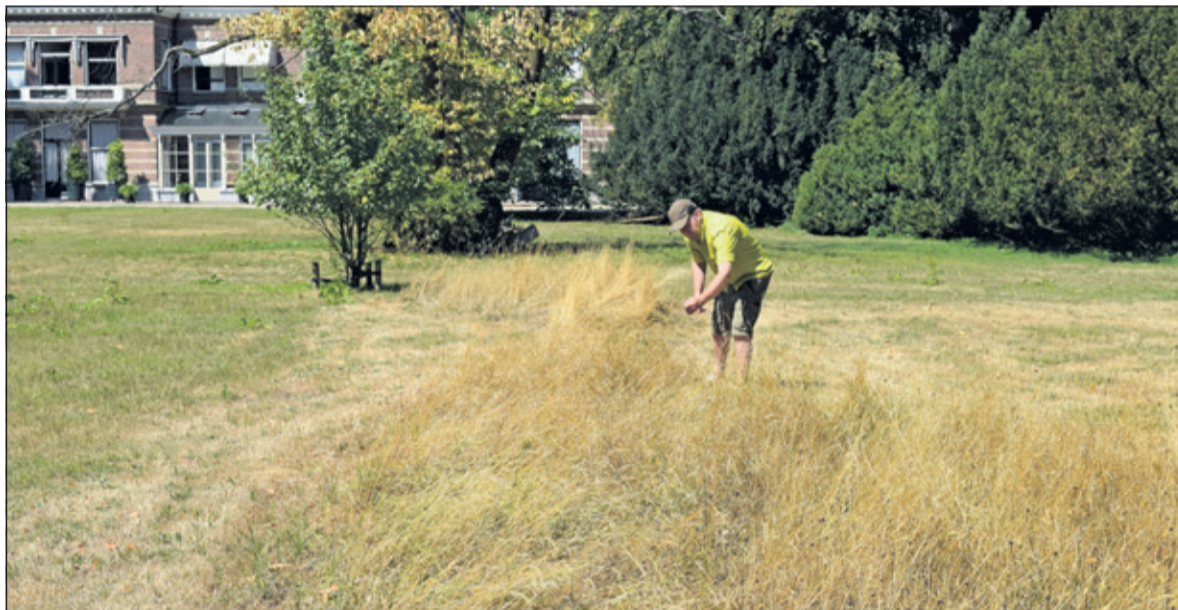
Dankzij goed maaibeleid ontstaan 'eilandjes' in de natuur met veel dierenleven.