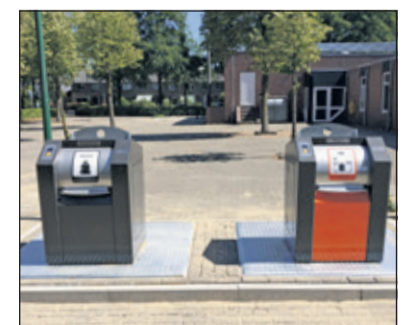
De nieuw te plaatsen containers voor restafval en PMD aan de Graspieper zijn gerealiseerd.