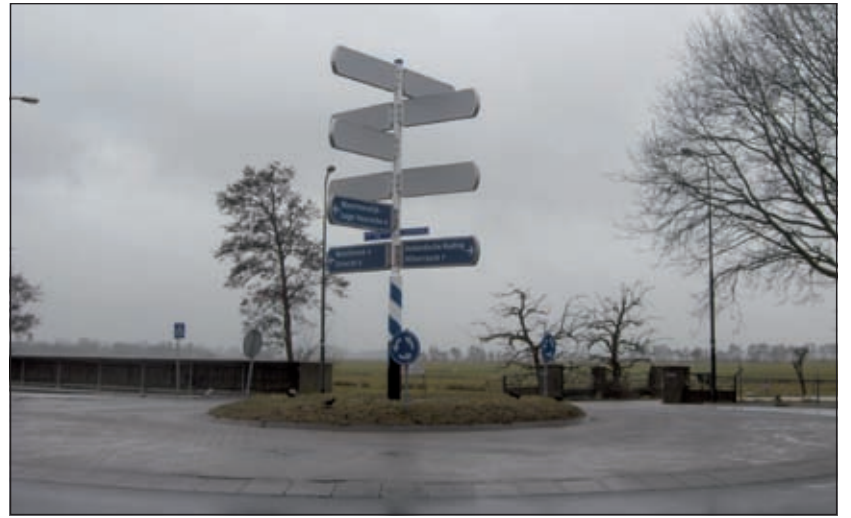
De wegwijzer op de rotonde is er helemaal klaar voor.

Het Rotondelab is ook nog bezig met de uitwerking van het kunstwerk op de rotonde bij het voormalige Braadspit. Er zijn indertijd gesprekken gevoerd met een aantal kunstenaars en daar is een winnaar uitgekomen. Maar over 'De Barcode Rotonde', zoals deze wordt genoemd, is verder nog niets bekend.