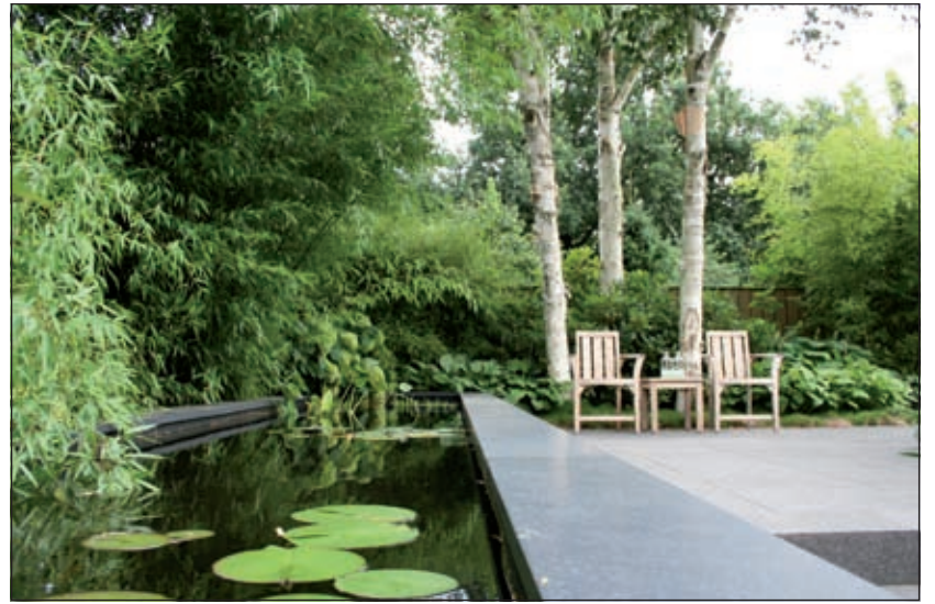
Pieter de Koning: 'Een goed doordacht tuinontwerp is de basis voor een mooie tuin'.

Veel behoefte blijkt er ook te zijn aan de cursus Tuinonderhoud. Dit is geen buiten-snoeicursus, maar gewoon binnen. Met koffie erbij en dat blijkt bijzonder goed te gaan. De Koning: 'Ik kan op deze manier veel vertellen en doordat er veel ruimte is voor vraag en antwoord ontstaat een plezierig en leerzame sfeer'. Water geven, bemes-