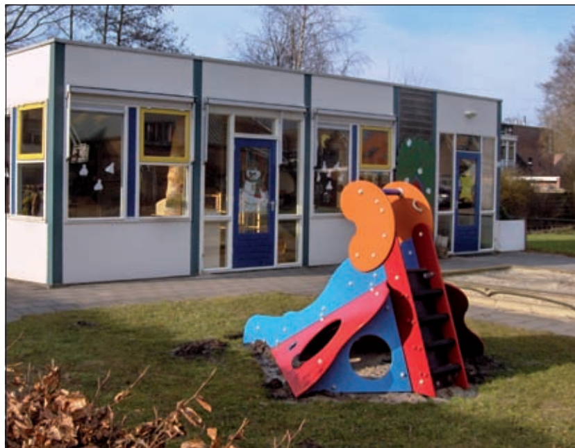
Bijdragen aan de collecte komen ten goede aan het werk van Jantje Beton en van peuterspeelzaal De Stampertjes te Westbroek [HvdB].

50% van de opbrengst mogen de collecterende jeugdverenigingen zelf besteden. De andere helft is bestemd voor de projecten van Jantje Beton. Door uw bijdrage aan de collectanten steunt u het werk van Jantje Beton en van peuterspeelzaal De Stampertjes [HvdB].