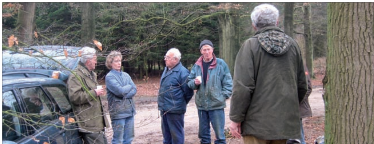
De pauzeplek met mondvoorraad.

wordt doorgenomen. Dan gaan ze weer over het zompige pad naar de houtwal, want de klus is nog niet geklaard.