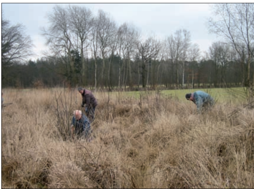
Hakken, zagen, knippen in het struikgewas.

Maar de leden van Hart van Groen luisteren niet. Zij hakken, zagen en knippen en gaan er tegen aan alsof ze een week lang niet hebben gewerkt. Fanatiek soms. In donker jack met spijkerbroek en zware schoenen struinen ze door het struikgewas op de houtwallen. Iets verderop ligt een kudde schapen te slapen en tussen de