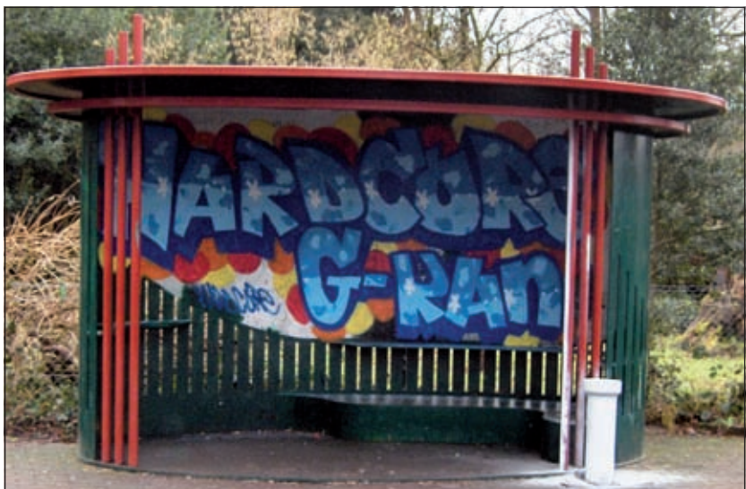
De binnenzijde van de jongerenschuilhaven aan de Kastanjelaan in Groenekan is voorzien van een 'onvoltooid', maar vooralsnog fraai graffiti kunstwerk.

De hangjongeren en omwonenden zijn door 'Kern met Pit' uitgenodigd op woensdag 11 maart a.s. om 14.00 uur bij de feestelijke bijeenkomst in de Spiegelzaal van het Paushuis in Utrecht om de onlangs toegekende prijs in ontvangst te nemen, die uitgereikt wordt door de Commissaris van de Koningin. Ook het gemeentebestuur van De Bilt is hierbij uitgenodigd. Kern met Pit is een fonds van de Koninklijke Nederlandse Heidemaatschappij, dat mensen die hun buurt, wijk of streek willen verbeteren ondersteunt. Het gaat daarbij om ideeën en projecten van burgers, vrijwilligersorganisaties en ideële organisaties. Deze projecten richten zich op actief burgerschap, plattelandsvernieuwing en water. Koninklijke Nederlandse Heidemaatschappij helpt deze verbeteringen van de leefomgeving te realiseren met inzet van kennis, geld en een uitgebreid netwerk. Enige tijd geleden werd bekend, dat het JOPproject en het Shakespeareproject van Muze in 't Groen, beiden uit Groenekan (en beiden in de prijzen zijn gevallen.