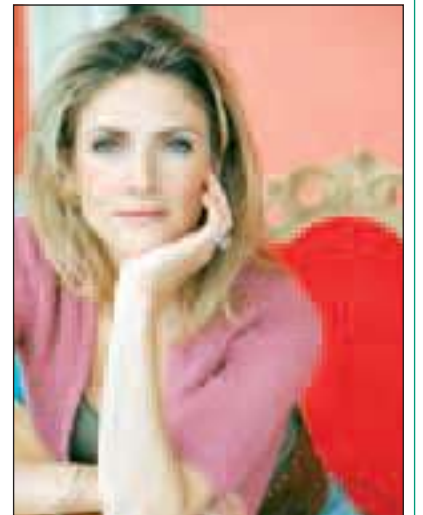
Familie speelt grote rol in nieuwste boek Jessica Durlacher.