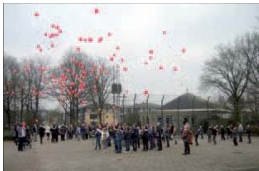
Uitgelaten vierden de massa kinderen het begin van deze schooldag met het oplaten van rode ballonnen.