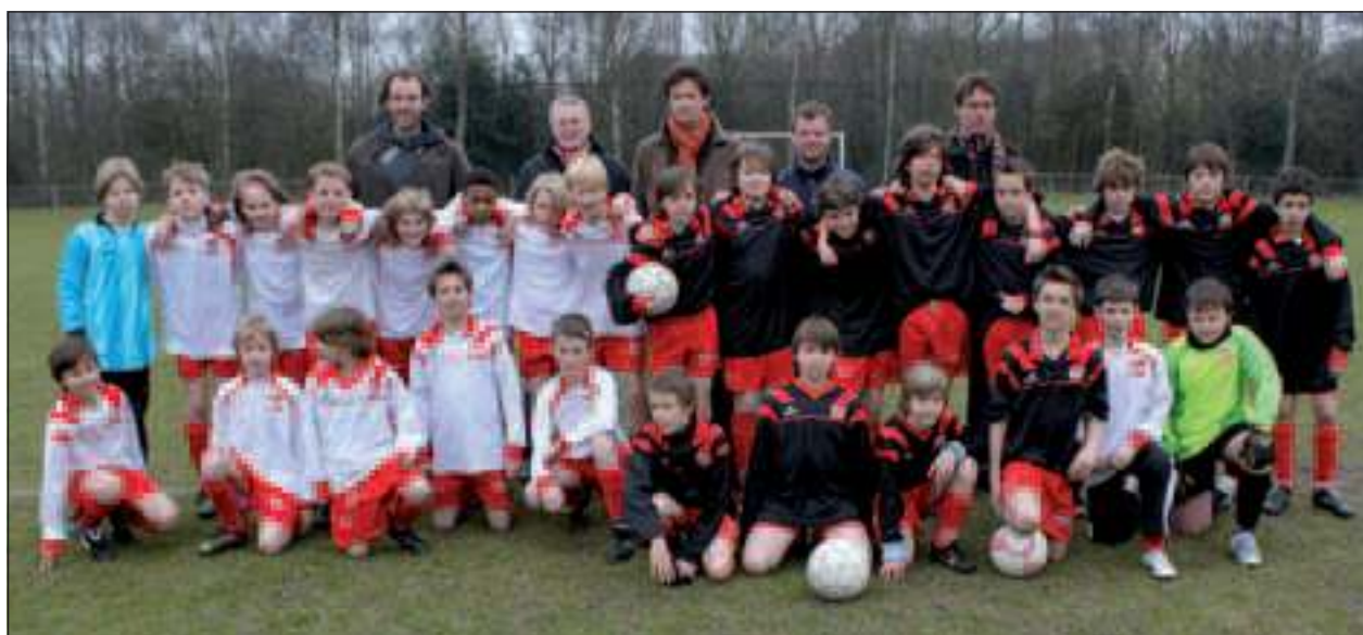
Zaterdag 12 maart jl. speelden op de velden van FC De Bilt de teams D6 en D7 om 10.15 uur al hun onderlinge competitiewedstrijd. Twee natuurgrasvelden bij FC De Bilt zijn aan renovatie toe.

Daarbij behoort ook het vervangen van de drainage en veldafschieding. Verder zijn er nog kosten gebudgetteerd voor diverse kleinere investeringszaken op verschillende sportparken zoals vervangen hekwerken, renovatie bestratingen etc.