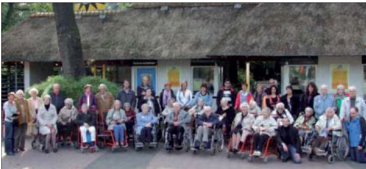
Vrijwilligers van de gemeente bezoeken dierenpark Amersfoort met bewoners Weltevreden.

Samen voor De Bilt trad dit jaar op als initiatiefnemer en intermediair van NL Doet De Bilt. Samen met vrijwilligers van het Meldpunt Vrijwilligerswerk werd er campagne gevoerd en ondersteuning verleend aan alle deelnemers van NL Doet in De Bilt mede dankzij financiële ondersteuning van de gemeente De Bilt en het Rabobank Stimuleringsfonds.