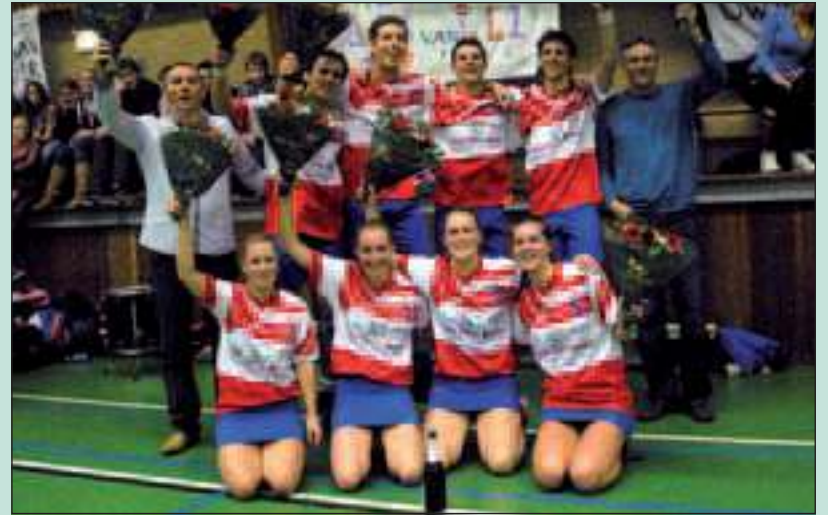
Nova heeft zijn kampioenswedstrijd met indrukwekkende cijfers gewonnen. Hekensluiter Hemur Enge werd met maar liefst 33-10 verslagen.