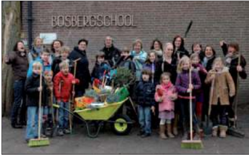
Groenrijk sponsort de natuurochtenden op de Bosbergschool in Hollandsche Rading.

Als er groenten of bereide producten over zijn na natuurochtenden en iedereen genoeg geproefd heeft, worden deze door de kinderen verkocht