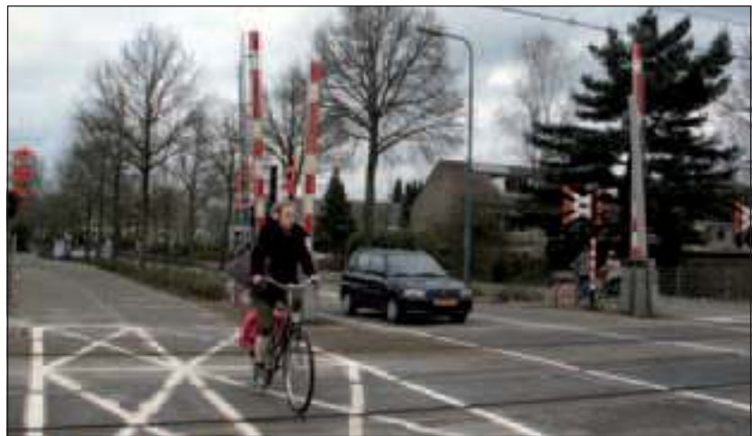
'De gemeente speelt Russische roulette met de bewoners van De Leijen', is een veelgehoorde opmerking in de wijk. Zouden de nieuwe strepen de overweg veiliger maken?

Haverkamp vroeg verder of er een incidentenregistratie van deze spoorwegovergang over de laatste tien jaar bestaat. De minister antwoordt: 'Zowel ProRail als de Inspectie Verkeer en Waterstaat hebben een incidentenregistratie van deze spoorwegovergang gemaakt. De afgelopen 10 jaar hebben zich hier drie incidenten voorgedaan.' Maar de minister omschrijft niet wat als incident wordt gedefinieerd. Wordt elke keer dat een machinist door rood rijdt en de bomen open blijven staan als incident beschouwd, of wordt er alleen iets geregistreerd als er een (bijna) ongeluk uit voortvloeit is en/of getuigen aan de bel hebben getrokken? Ten slotte vroeg Haverkamp of de minister vindt dat een doorkomst tijd van 7 seconden na sluiting van de spoorbomen binnen de normen is en of zij deze situatie als veilig beoordeelt. Het antwoord