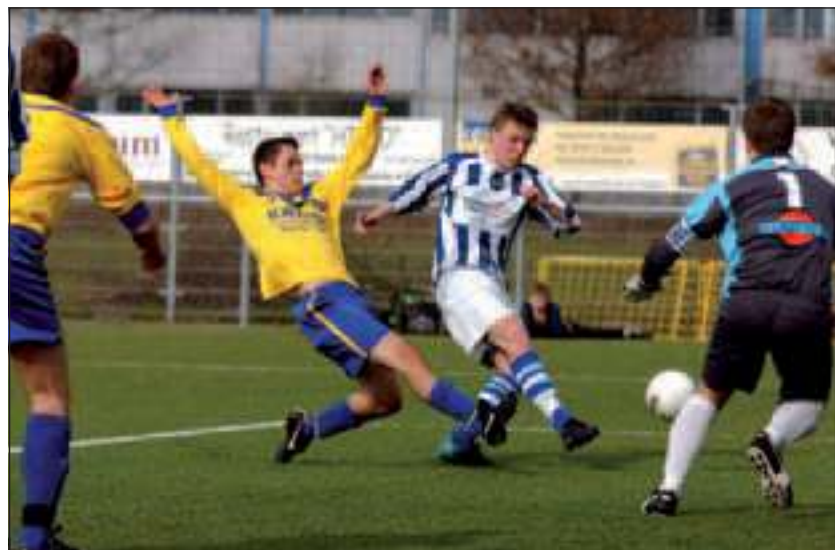
SVM wint met 3-0 van naaste concurrent Scherpenzeel.

SVM begon zoals altijd strijdlustig aan de wedstrijd en liet daarmee de bedoeling zien om de volle winst te pakken. In de beginfase waren er direct goede kansen op de openingsgoal. De grootste kans was voor Tom Jansen die op korte afstand van de goal de bal voor het inschieten leek te hebben. Zijn schot miste doel, maar dat was slechts uitstel van executie voor Scherpenzeel. In de 15de minuut werd Eric Röling door een prima snelle uittrap van keeper Richard de Groot aan de zijkant op weg gestuurd.